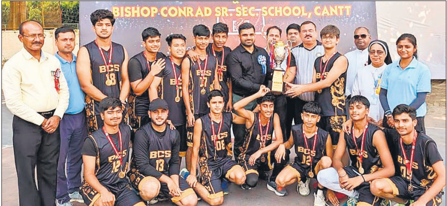
बिशप कॉनराड स्कूल में बास्केटबाल प्रतियोगिता के बालक वर्ग की विजेता टीम को ट्रॉफी देते आयोजक व शिक्षक।