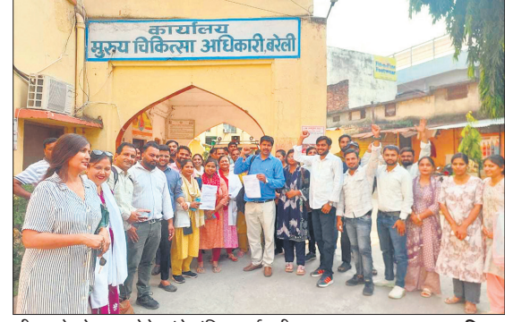
सीएमओ को ज्ञापन देने पहुंचे संविदा कर्मचारी।