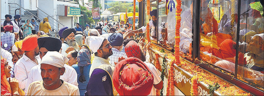
जनकपुरी गुरुद्वारे के पास शहीदी जागृति यात्रा के दर्शन के लिए उमड़ी संगत।