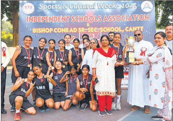
बालिका वर्ग में सेंट मारिया स्कूल की विजेता टीम ट्रॉफी के साथ। ● अमृत विचार

किया। सेमीफाइनल मुकाबलों में बालिका वर्ग में बिशप कैट ने बेदी इंटरनेशनल स्कूल को 6-4 और सेंट मारिया ने राधा माधव को 11-7 से हराकर फाइनल में प्रवेश किया। बालक वर्ग में डीपीएस ने विद्या वर्ल्ड को 34-6 और बिशप कैट ने राधा माधव को