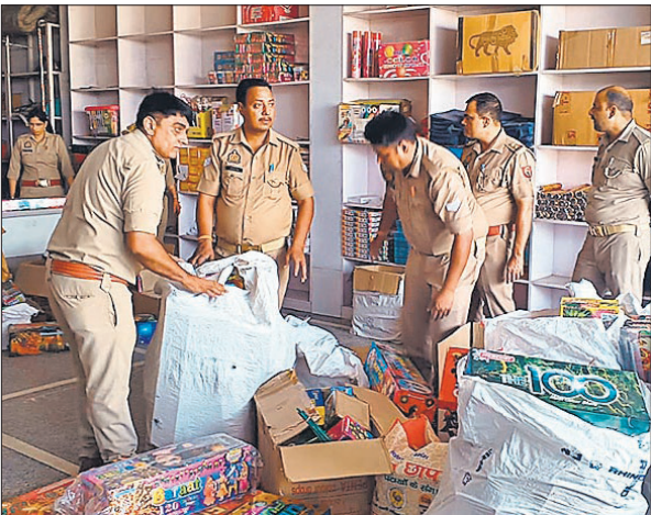
सौ फुटा रोड पर दुकान में पटाखे बरामद करती पुलिस।