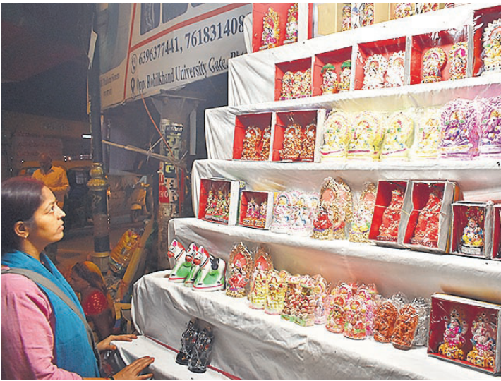
दीपावली का बाजार सजकर तैयार हो गया है। लोगों ने खरीदारी भी शुरू कर दी है। शहामतगंज बाजार में दिवाली पूजन के लिए मूर्तियों और दीयों की खरीदारी करती महिला और युवती।