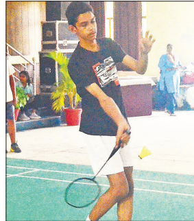
बालक वर्ग में मैच खेलता खिलाड़ी।

● सेक्रेड हार्ट स्कूल में इंटर स्कूल बैडमिंटन मैत्री टूर्नामेंट शुरू प्रतियोगिता में आईएसए से संबद्ध जिले के 34 स्कूलों के खिलाड़ियों ने भाग लिया। पहला मैच पुरुष एकल वर्ग के अंडर-14 में बिशप स्कूल दोहना एवं जीपीएम स्कूल के बीच हुआ। इसमें बिशप स्कूल ने जीपीएम को 2-1 से हराया। अंडर-14 के अन्य मैचों में विद्या वर्ल्ड ने जीपीएम स्कूल को 2-1 से, जीआरएम नैनीताल रोड ने हरीति स्कूल को 2-1 से पराजित कर अगले राउंड में प्रवेश किया। अंडर-17 एकल बालक वर्ग में बिशप कैंट ने जीके सिटी को 2-1