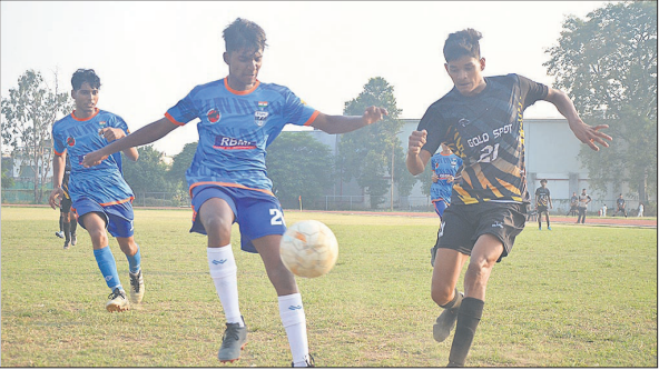
फ्यूचर और स्पोर्ट्स हॉस्टल के बीच मैच में गोल करने की जद्दोजहद करते खिलाड़ी।