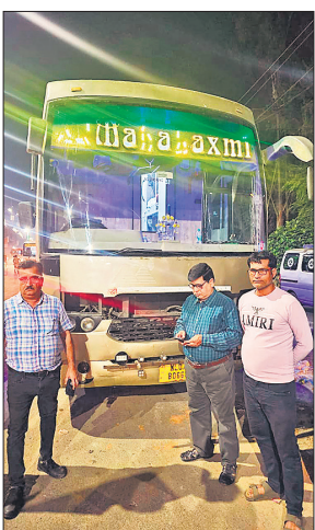
चेकिंग करती परिवहन विभाग की टीम।