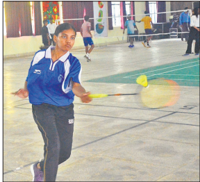
बालिका वर्ग में मैच खेलती खिलाड़ी।