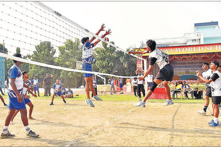
विद्या वर्ल्ड स्कूल में वालीबॉल मैच में भिड़तीं सबती और आर्मी पब्लिक स्कूल की टीमों।