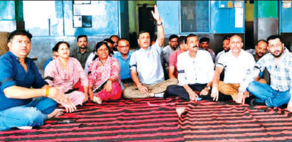
रोडवेज स्टेशन में चार सूत्रीय मांगों को लेकर धरना प्रदर्शन करते रोडवेज कर्मचारी ।

अमृत विचार : प्रांतीय नेतृत्व के आह्वान पर परिवहन निगम कर्मचारियों ने गुरुवार को रोडवेज स्टेशन पर धरना प्रदर्शन किया। इस दौरान बड़ी संख्या में कर्मचारियों ने भागीदारी की और आंदोलन के प्रति एकजुटता दिखाते हुए चार सूत्रीय मांगों को लेकर संकल्प लिया कि चरणबद्ध आंदोलन में सभी एकजुटता के साथ प्रतिभाग करेंगे। कर्मचारियों ने स्पष्ट किया कि आंदोलन के दौरान प्रांतीय नेतृत्व की ओर से दिए जाने वाले सभी दिशा-निर्देशों का ईमानदारी और अनुशासन के साथ पालन किया जाएगा। उन्होंने सितंबर के लंबित वेतन कर्मचारियों को तत्काल दिए जाने, अनुबंध बस नीति समाप्त कर निगम के स्वामित्व में बसें खरीदे जाने, अवैध संचालन ( डगमारी )