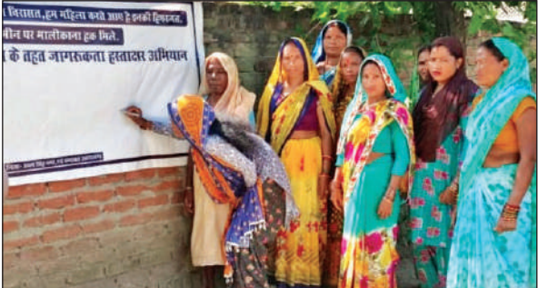
ग्राम मदनपुर में हस्ताक्षर अभियान चलाकर जागरूक करती महिलाएं। ● अमृत विचार

अमृत विचार: अंतरराष्ट्रीय महिला किसान दिवस पखवाड़े के मौके पर ग्रामीण क्षेत्रों में हस्ताक्षर जागरूकता अभियान चलाया। जिले में दो ब्लॉक गदरपुर व खटीमा के अंतर्गत 20 गांव में नेतृत्वकर्ता महिलाओं द्वारा पोस्टर व पम्पलेट के माध्यम से जागरूकता कार्यक्रम चलाया। इस दौरान महिलाओं ने शासन से एक दर्जन मांगें पूरी करने की मांग रखी।