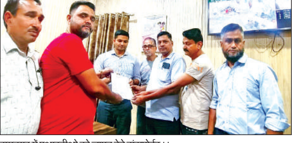
रामनगर में एआरटीओ को ज्ञापन देते ट्रॉंसपोर्टर।।