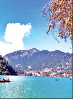
नैनीताल झील का विहंगम दृश्य । ● अमृत विचार

बादल और बारिश ने सैलानियों की आए दिन राह रोक कर सैर सपाटे में व्यवधान उत्पन्न किया। मगर, अब खराब मौसम से निजात मिलने जा रही है। मौसम विभाग