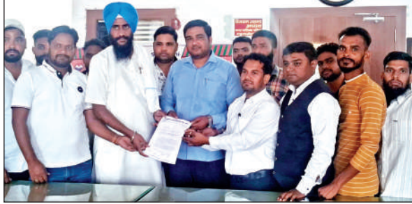
काशीपुर के महुआखेड़ागंज में पालिकाध्यक्ष को ज्ञापन सौंपते संघ के कार्यकर्ता।

अमृत विचार: जयहिंद अल्पसंख्यक सेवा संघ ने नगर पालिका महुआखेड़ागंज के अधिशासी अधिकारी के माध्यम से मुख्यमंत्री को ज्ञापन भेजकर औद्योगिक क्षेत्र महुआखेड़ागंज को उत्तराखंड रोडवेज के माध्यम से राज्य की राजधानी देहरादून व देश की राजधानी नई दिल्ली से जोड़ने की मांग की है।