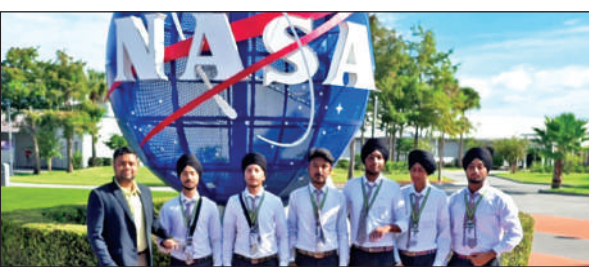
अमेरिका की नासा स्पेस एजेंसी में ग्रीनवुड सितारगंज के बच्चे। ● अमृत विचार

छात्रों के लिए यह एक अत्यंत समृद्ध और लाभदायक अनुभव रहा। इस यात्रा से उन्हें बाह्य अंतरिक्ष विज्ञान और प्रौद्योगिकी के क्षेत्र में हुई अभूतपूर्व प्रगति के बारे में जानकारी प्राप्त हुई। छात्रों ने इस यात्रा के दौरान नासा के कनेडी स्पेस सेंटर के विशाल परिसर में विभिन्न मंडपों