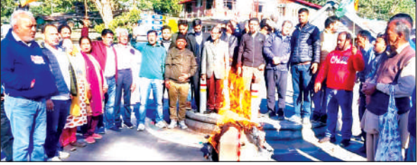
नैनीताल में भाजपा का पुतला दहन करते कांग्रेस कार्यकर्ता। ● अमृत विचार