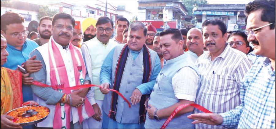
काशीपुर के नगर निगम मेले का उद्घाटन करते भाजपा प्रदेश अध्यक्ष। ● अमृत विचार

स्वयं सहायता समूह की महिला सदस्यों ने भी अपने स्टॉल लगाए और अभियान को आगे बढ़ाने में महत्वपूर्ण योगदान दिया। नागरिकों