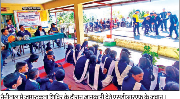
नैनीताल में जागरूकता शिविर के दौरान जानकारी देते एसडीआरएफ के जवान।

शिविर में एसडीआरएफ उत्तराखण्ड पुलिस के जवानों ने आपदा की स्थिति में किए जाने वाले बचाव कार्यों की प्रायोगिक