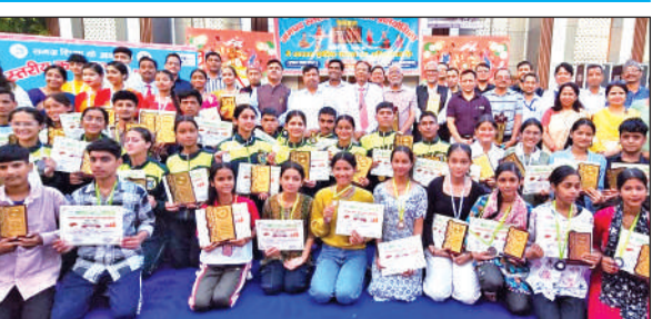
इंस्पिरेशन स्कूल में आयोजित जनपदीय कला उत्सव के विजेता विद्यार्थी ।