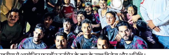
खटीमा में आयोजित फुटबॉल टूर्नामेंट के कप के साथ विजेता और अतिथि।