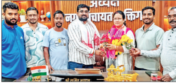
अधिशासी अधिकारी को पुष्प गुच्छ देकर स्वागत करते चेयरमैन और अन्य।