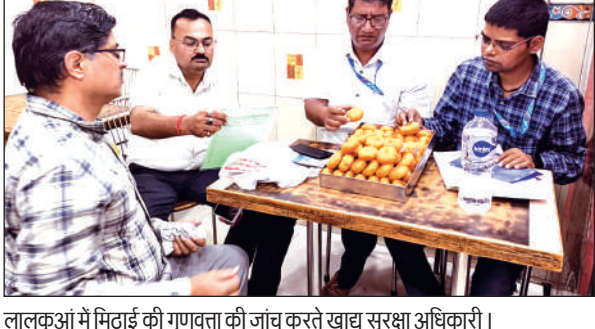
लालकुआं में मिठाई की गुणवत्ता की जांच करते खाद्य सुरक्षा अधिकारी।