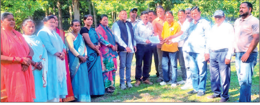
रामनगर में वन क्षेत्राधिकारी को ज्ञापन देते जनप्रतिनिधि।

समस्त ग्राम प्रधान, क्षेत्र पंचायत सदस्य, जिला पंचायत सदस्य, महिला समूह एवं क्षेत्रीय जनप्रतिनिधियों द्वारा डीएफओ तराई पश्चिमी वन प्रभाग से पूर्व में आग्रह किया गया था कि स्थानीय लोगों जैसे मालधन चौड़ की महिला समूह या स्थानीय बेरोजगार युवाओं को को यह कैंटीन ठेके में दी जाए। जिससे स्थानीय लोगों को रोजगार मिल सके किंतु डीएफओ ने टेंडर प्रक्रिया के नियम इतने