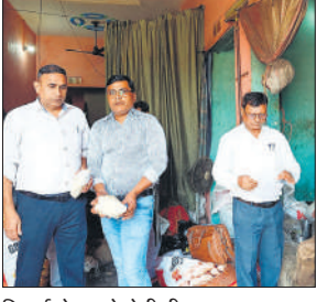
मिठाई के नमूने लेती टीम।

स्वदेशी मेले में प्रतिदिन स्कूल के छात्र छात्राओं द्वारा सांस्कृतिक कार्यक्रम का आयोजन किया जा रहा है। मेले के आठवें दिन रोजाना की भांति आयोजित होने वाले सांस्कृतिक कार्यक्रमों में रेडियंस स्कूल के विद्यार्थियों द्वारा नृत्य की मनमोहक प्रस्तुति की। कस्तूरबा गांधी बालिका विद्यालय