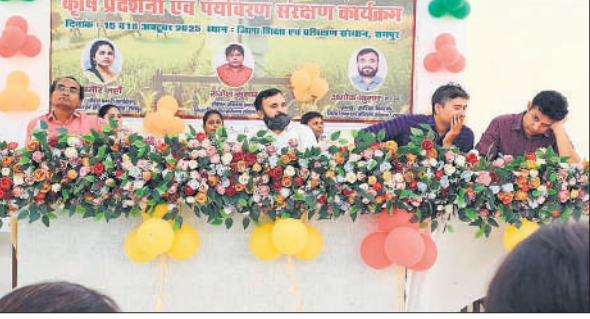
कार्यक्रम में मौजूद मुख्य अतिथि

अमृत विचार : मिशन शक्ति 5 के तहत क्षेत्राधिकारी स्वार द्वारा थाना प्रभारी मिलक खानम व महिला सुरक्षा दल थाना मिलक खानम के साथ उस्मान गंज में चल रही भागवत कथा में ग्रामीणों को पम्फलेट वितरित कर जागरूक किया। महिला संबंधी अपराध, विभिन्न हेल्पलाइन नंबरों 1930 साइबर क्राइम, 1090 वूमैन पॉवर लाइन, 181 महिला हेल्प लाइन,108 एंबुलेंस सेवा,1076 मुख्यमंत्री हेल्पलाइन के बारे में बताया। 112 आपातकालीन सेवा, 1098 चाइल्ड लाइन, 102 स्वास्थ्य सेवा एवं साइबर क्राइम से बचने के उपाय की जानकारी देकर जागरूक किया। क्षेत्राधिकारी स्वार द्वारा ग्रामीणों में सुरक्षा, आत्मरक्षा और साइबर अपराधों से बचाव के प्रति जागरूक किया। प्रलोभन में आकर किसी भी अनजान लिंक पर क्लिक न करें।