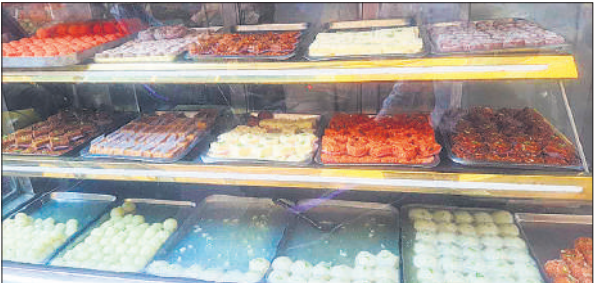
शहर की मिठाई की दुकान में बिना एक्सपाइरी टैग के रखी मिठाइयां। ● अमृत विचार

आमतौर पर दूसरों को देने के लिए मिठाई खरीदी जाती है। इसलिए मिठाई खरीदने वाला मिठाई नहीं खाता और दूसरों को बांटता है। उन मिठाइयों की क्या हातत है यह खरीदार को नहीं मालूम होता है। लेकिन जिसको मिठाई मिलती है और वह मिठाई का डिब्बा खोलकर मिठाई खाता है तब तुरंत ही थूक देता है। इसका