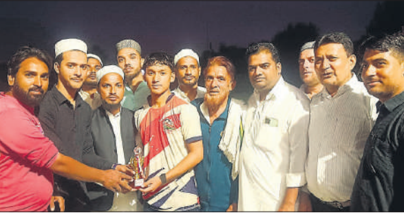
विजयी टीम को पुरस्कार देते मुख्य अतिथि।