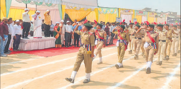
एथलेटिक्स प्रतियोगिता के उद्घाटन पर परेड करते कैडेट्स।