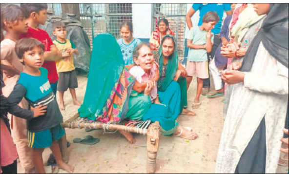
● अमृत विचार

फुटेज के आधार पर ट्रक और उसके चालक की तलाश में जुट गई है, इस हादसे से क्षेत्र में शोक की लहर फैल गई है। बताया गया कि मृतक सात भाई-बहनों में पांचवें नंबर के थे जो अपने पीछे तीन बेटियों को छोड़ गए हैं, वहीं घटना से आहत हुए परिजनों का रो-रोकर बुरा हाल है।