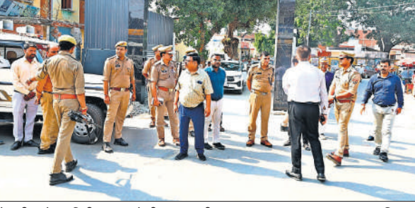
केमरी थाने का निरीक्षण करते डीएम-एसपी।