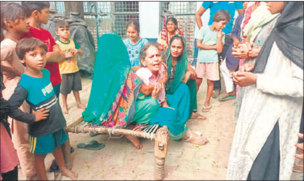
रोते-बिलखते मृतक शिक्षक के परिवारीजन।

लग गया। सूचना मिलने पर पुलिस मौके पर पहुंची शव को पोस्टमार्टम के लिए भेजा।जाम को खुलवाने में पुलिस को काफी मशक्कत करनी पड़ी। पूरी घटना नजदीकी सीसीटीवी कैमरे में कैद हो गई, जिसमें ट्रक की टक्कर लगने के बाद का दृश्य दिखाई दे रहा है। पुलिस