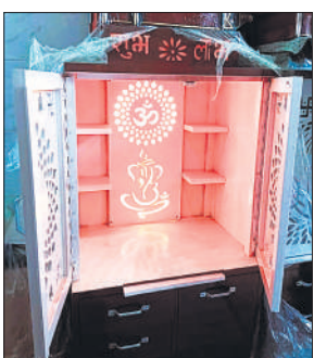
ताड़ीखाना रोड स्थित दुकान पर बिक्री के लिए रखा मंदिर का मॉडल।

कंपनियों के उत्पाद की जमकर खरीदारी की जा रही है। इनमें बोटल,