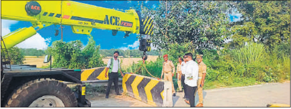
हाईवे से पथर हटाती फ्रेन।