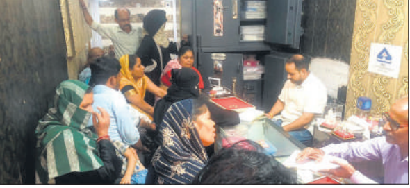
सराफे की दुकान पर खरीदारी करते लोग।

धनतेरस शनिवार को मनाया जाएगा। त्योहार से पहले ही धीरे धीरे करके सराफा बाजार चमक रहा है। दुकानदार अपनी दुकानों को सजाने में लग गए हैं। चांदी और सोने की कीमतें लगातार आसमान छू रही हैं। धनतेरस के मौके पर सोना और चांदी खरीदना जाना शुभ माना जाता है। लगातार बढ़ते भाव के बावजूद