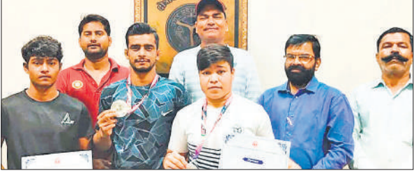
कुश्ती प्रतियोगिता के विजेता खिलाड़ी व अन्य।