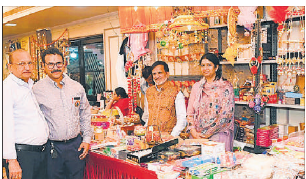
धनतेरस की तैयारी को लेकर बाजार में खरीदारी करते लोग।

अमृत विचार : 18 को धनतेरस और 20 अक्टूबर को दीपावली का पर्व मनाया जाएगा। बाजार दुल्हन की तरह सजकर तैयार हैं, तो खरीदारी के लिए दुकान पर भीड़ उमड़ रही है। इस दिवाली में उपहार के लिए क्रॉकरी, कटलरी और घर को सजाने के सामान की खरीदारी की जा रही है। पर्व से पहले ही बाजार में हर तरफ उल्लास और ग्राहकों में उत्साह नजर आ रहा है। लोग परिजन और मित्रों को देने के लिए उपहारों की खरीदारी में जुटे हुए हैं। घरेलू इस्तेमाल की चीजें जिनमें कप एंड प्लेट सेट, सर्विंग बाउल, सर्विंग ट्रे, ड्राई फ्रूट बॉक्स आम आदमी के बजट में होने के कारण सबसे ज्यादा बिक रहे हैं। साथ ही होम अप्लायंस जिनमें माइक्रोवेव ओटीडी और एयर फ्रायर की भी लोग खूब खरीदारी कर रहे हैं। 24 घंटे ठंडा और गरम खाना और तरल पदार्थ रखने के विभिन्न