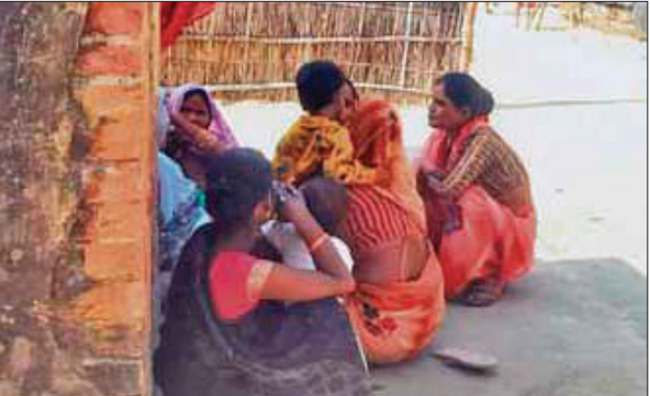
मुमशुम बेटी परिवार की महिलाएं।