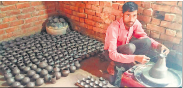
इलेक्ट्रॉनिक चाक पर दीपक बनाता कुंभकार।