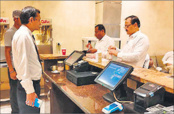
फन सिनेमा में पेटीज के नमूने लेते अधिकारी।

धौरहरा में स्थित मैडम पेट्रोल टंकी पर बुधवार की रात एक डीसीएम समेत छह वाहन खड़े थे। चोरों ने बड़ी ही चालाकी से इन वाहनों की टंकी से रात के अंधेरे में तेल निकाल लिया और मौके से फरार हो गए। सुबह जब कर्मचारियों ने घटना देखी तो अफरा-तफरी मच गई। सूचना पर पहुंची धौरहरा पुलिस ने घटनास्थल का निरीक्षण किया और आसपास लगे सीसीटीवी कैमरों की फुटेज खंगालनी शुरू कर दी है। पुलिस ने आसपास के क्षेत्रों में सस्रिधों की तलाश तेज कर दी है। धौरहरा पुलिस का कहना है कि जल्द ही आरोपियों की पहचान कर गिरफ्तार का खुलासा किया जाएगा।