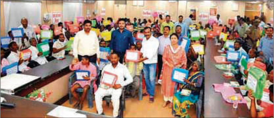
सदर तहसील में तिरपाल वितरण करते विधायक और डीएम।

दहेज में दस लाख रुपये, एक कार और नकद रकम देकर किया गया था। इसके बावजूद विवाह के बाद से ही बेटी को दहेज के लिए शारीरिक और मानसिक रूप से प्रताड़ित किया जा रहा था। गुरुवार को गांव के लोगों से सूचना मिली कि उनकी बेटी की मृत्यु हो गई है। जब वे मौके पर पहुंचे, तो