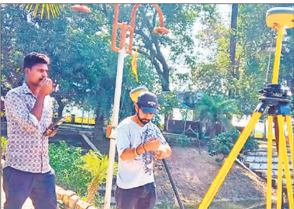
गोमती उदगम स्थल पर डीजीपीएस की मदद से सर्वे करती सर्वेयरों की टीम।

उप मुख्यमंत्री केशव प्रसाद मौर्य एक दिवसीय दौरे पर पीलीभीत पहुंचे थे। यहां उन्होंने समीक्षा बैठक के दौरान पर्यटन विभाग को गोमती उद्गम स्थल, शारदा सागर डैम व अन्य स्थानों को चिह्नित कर पर्यटन स्थल के रूप में विकसित करने संबंधी प्रस्ताव तैयार कर भेजने के