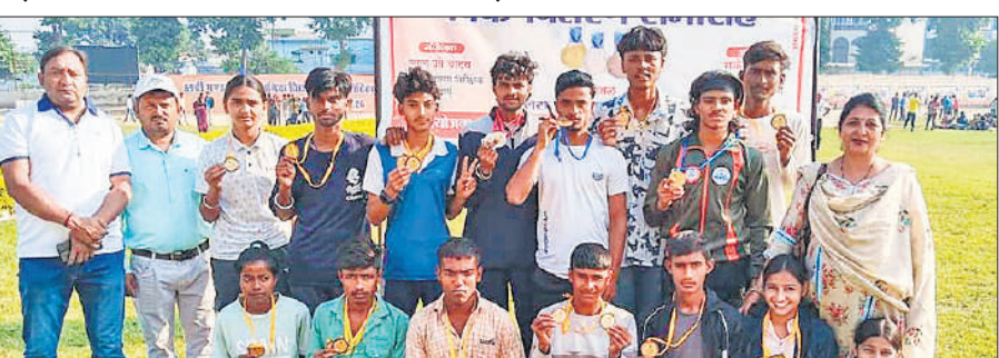
मंडलीय प्रतियोगिता में पदक जीतने वाले खिलाड़ी।

डॉक्टरों से बात की और भर्ती मरीजों को सुझाव दिए सावधानी बरतने की हिदायत दी। घर घर जाकर लोगों को डेंगू मच्छर से बचाव के तरीके बताए और साफ सफाई रखने का सुझाव दिया। आरोग्य मंदिर में संचालित अस्पताल में तैनात डॉक्टर, एनएम, सफाई कर्मचारियों व समस्त स्टाफ से बात की और गांव के लोगों को जल्द से जल्द स्वास्थ्य होने की कामना की। साथ में पूरी टीम थी।