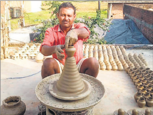
गोवर्धन पूजा के लिए मिट्टी के कुल्हड़ तैयार करता कुम्हार।

शहर के मोहल्ला तुलाराम कुवंगर, खुदागंज, बाग गुलशेर खां, गौहनिया, बिलगवां समेत करीब 10 मोहल्लों में रहने वाले 500 परिवार मिट्टी के दीये, कुल्हड़ आदि बनाने का काम करते हैं। सरकार प्रोत्साहन देने के लिए कुम्हारों के नाम पर तालाबों का पट्टा करती है। ताकि उन्हें मिट्टी आसानी से मुहैया हो सके। कुम्हारों के अनुसार उन्हें उन स्थानों के पट्टे कर दिए हैं। जहां से एक कट्टा भी मिट्टी नहीं निकल