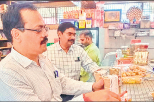
शहर की प्रतिष्ठित मिठाई दुकान पर नमूने लेते अधिकारी।