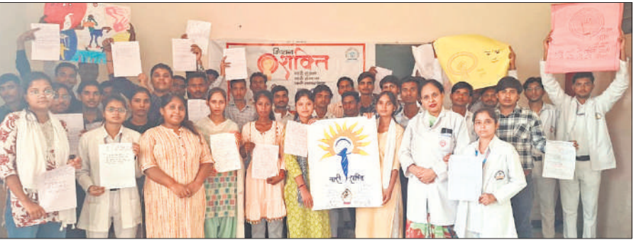
एंटी रैगिंग एवं महिला सशक्तिकरण कार्यक्रम में शामिल स्टाफ व डाक्टरर्स।