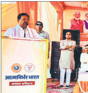
संबोधित करते केंद्रीय राज्यमंत्री बीएल वर्मा।