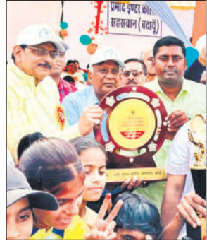
विजेता खिलाड़ियों को ट्रॉफी के शिक्षक।

समापन पर 4×400मीटर की रिले रेस हुई। जिसमें बदायूं ने प्रथम, बरेली द्वितीय व पीलीभीत ने तृतीय स्थान पर रहा। प्रतियोगिता में बदायूं की टीम 503 अंकों के साथ ओवरऑल चैंपियन बनी रही। जिला बरेली की टीम 281 अंकों के साथ द्वितीय स्थान पर रही व जिला पीलीभीत की टीम 103 अंकों के साथ तृतीय स्थान पर रही। सभी विजय प्रतिभागियों को मेडल पहनाकर सम्मानित किया गया। समापन पर स्कूली बच्चों ने सांस्कृतिक कार्यक्रम