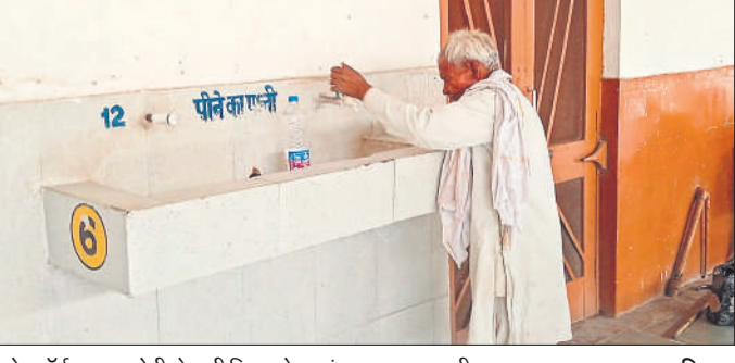
प्लेटफॉर्म एक पर टोटी से पानी निकलने का इंतजार करता यात्री।

स्थानीय रेलवे स्टेशन पर प्लेटफार्म एक पर पेयजल की आपूर्ति गुरुवार को दिन में 11 बजे बंद कर दी गई। राज्यरानी एक्सप्रेस और त्रिवेणी एक्सप्रेस के यात्रियों की संख्या प्लेटफार्म बढ़ती गई। प्लेटफार्म पर ट्रेन के इंतजार में बैठे यात्री पानी की बोतल भरने के लिए पेयजल बूथ पर गए और टोटी में देखा कि पानी नहीं आ रहा है। लोग निराश होकर वापस लौट गए हैं। इस दौरान यात्रियों ने पूछताछ कार्यालय से कई बार अलाउंस करवाया कि प्लेटफार्म एक पेयजल की आपूर्ति चालू की जाए। लेकिन संबंधित विभाग के अधिकारी और कर्मचारियों पर