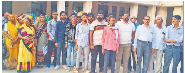
बिल्सी तहसील पर मौजूद ग्रामीण।