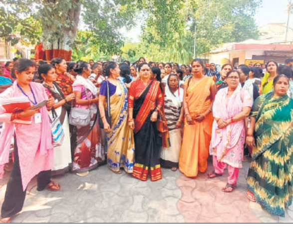
जिला मुख्यालय पर ज्ञापन देने जाती आशा वर्कर।