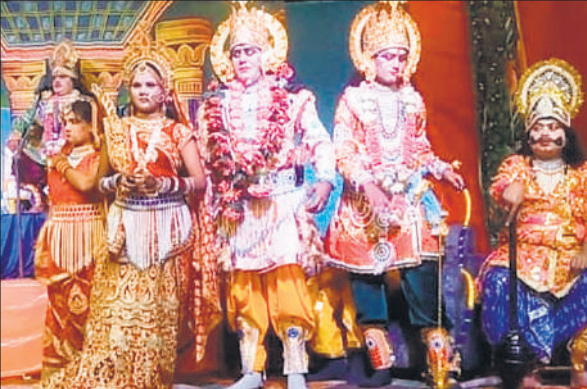
रामलीला में धनुष यज्ञ और सीता स्वयंवर प्रसंग का मंचन करते कलाकार।

इस प्रमुख प्रसंग में मिथिला नगरी का दृश्य जीवंत किया गया। राजा जनक के दरबार में आयोजित धनुष यज्ञ में जब कोई भी राजकुमार शिवधनुष नहीं उठा सका, तब भगवान श्रीराम ने उसे तोड़ा। इस दृश्य के मंचन पर पूरा मैदान 'जय श्रीराम' के उद्घोष से गूंज उठा। इसके बाद सीता स्वयंवर और विवाह का मंचन हुआ, जिससे पूरा माहौल भक्तिमय हो गया। सीता विवाह के अवसर