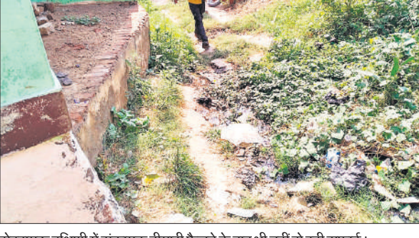
सेहरामऊ दक्षिणी में संक्रामक बीमारी फैलने के बाद भी नहीं हो रही सफाई।