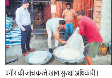
पनीर की जांच करते खाद्य सुरक्षा अधिकारी।