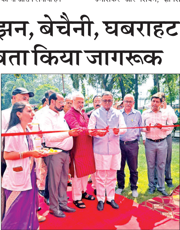
कार्यक्रम का फीता काटकर शुभारंभ करते विधायक।