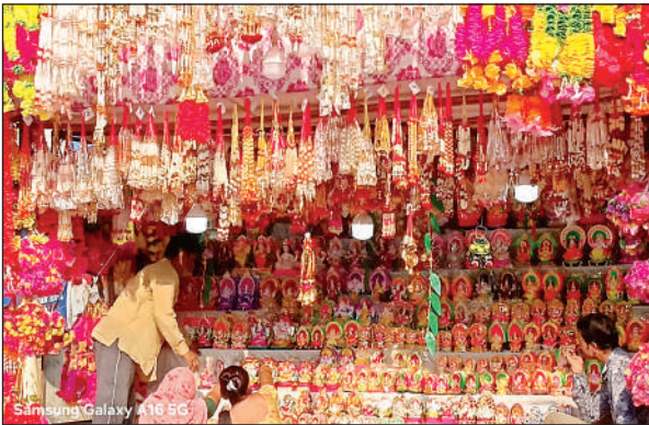
बाजार में सजी गणेश लक्ष्मी की दुकान ।

लोग अपने घरों व कार्यस्थलों को सजाने के लिए अभी से खरीदारी कर रहे हैं। जिससे बाजारों में भारी भीड़ आने चहल पहल बढ़ गई है। जहां ग्राहकों की भीड़ सजावटी सामान रंगोली मैट तोरण लड़ियां दीये और मोमबत्ती जैसे सामानों की