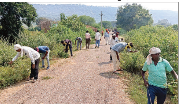
बांकेसिद्ध मार्ग की सफाई करते कर्मचारी।