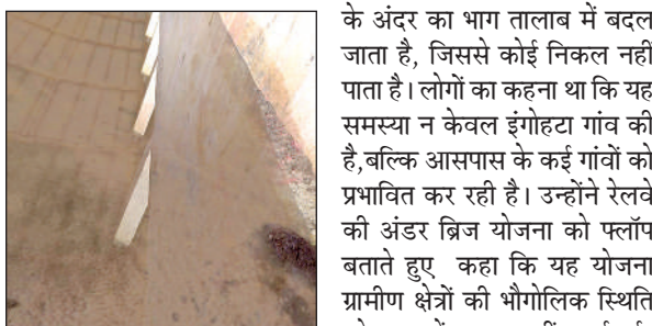
अंडर ब्रिज में भरा पानी।