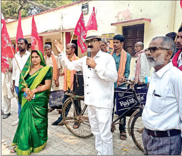
विरोध प्रदर्शन करते भाकपा कार्यकर्ता।

बताया कि पार्टी ने राष्ट्रपति से ज्ञापन में मांग की है कि देश में हो रही जातिगत हत्याओं पर रोक लगाई जाए, प्रदेश में कानून व्यवस्था को ठीक किया जाए, देश में लोकतंत्र और संवैधानिक मूल्यों की रक्षा की जाए, धर्म के आधार पर देश