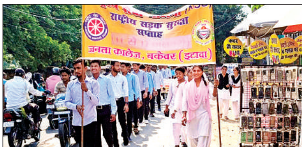
रैली निकालते छात्र-छात्राएं।