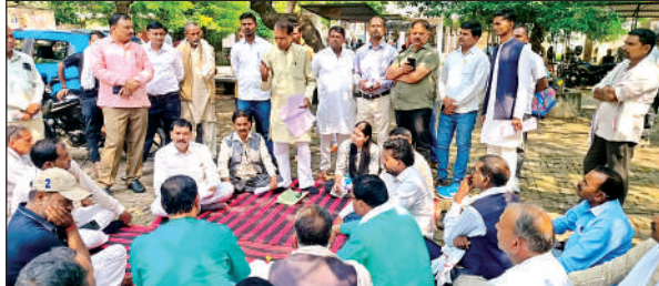
कलेक्ट्रेट परिसर में बैठक करते राष्ट्रीय पंचायतीराज ग्राम प्रधान संगठन के पदाधिकारी।