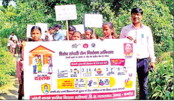
गांव में जागरूकता रैली निकालते छात्र, छात्राएं।