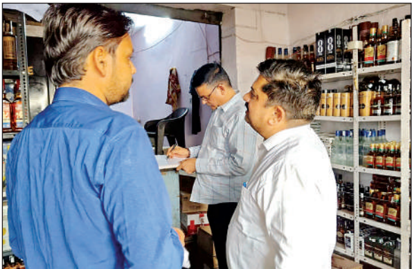
जांच करती खाद्य सुरक्षा विभाग की टीम।

अमृत विचार। आगामी त्योहार धनतेरस, दीपावली, भाई दूज और छठ पूजा को लेकर जहां मिलावट खोर सक्रिय हो गए हैं। वहीं आबकारी विभाग, खाद्य सुरक्षा विभाग, उपजिलाधिकारी और पुलिस ने मिलकर शराब ठेकों, होटलों के साथ छोटी दुकानों पर संयुक्त जांच की। किल्ली के पिर पर चोट आने से सरकारी अस्पताल में भर्ती कराया। जहां से सदर अस्पताल रेफर किया गया।