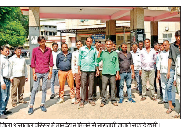
जिला अस्पताल परिसर में मानदेय न मिलने से नाराजगी जताते सफाई कर्मी।