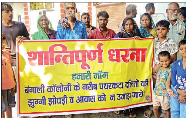
कचहरी में डीएम को ज्ञापन देने जाते बंगाली कालोनी के लोग।