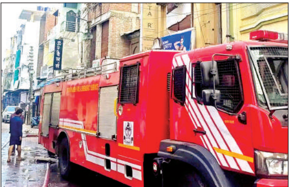
आग पर काबू पाने के बाद खड़ी दमकल।