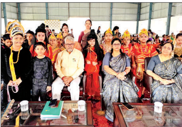
कार्यक्रम प्रस्तुत करने वाले बच्चों के साथ प्रधानाचार्य व स्टाफ।

हम गरीबों को वहां से उजाड़ने की सजिश कर रहे हैं। ज्ञापन में बताया गया कि देश के बंटवारे के समय रिफ्यूजियों के लिए केन्द्र सरकार द्वारा बंगाली कालोनी बनायी गयी थी इसका वास्तव में 90 बीघा के रकवा