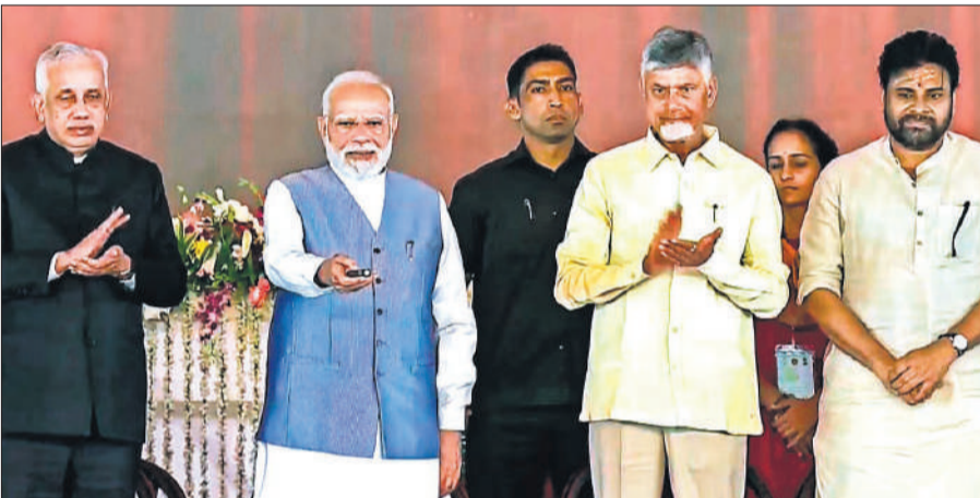
कुरनूल में विकास कार्यों के उद्घाटन और शिलान्यास समारोह में उपस्थित प्रधानमंत्री नरेन्द्र मोदी।

प्रधानमंत्री नरेन्द्र मोदी ने गुरुवार को कहा कि 21वीं सदी 140 करोड़ भारतीयों की है और 2047 तक विकसित भारत का सपना साकार हो जाएगा। उन्होंने कांग्रेस पर बिजली क्षेत्र की उपेक्षा करने का आरोप भी लगाया। भारत के मेक इन इंडिया पारिस्थितिकी तंत्र की तारीफ करते हुए मोदी ने कहा, हमने ऑपरेशन सिंदूर में घरेलू स्तर पर निर्मित उपकरणों की ताकत देखी, जो 22 अप्रैल के पहलगाम हमले के बाद पाकिस्तान व उसके कब्जे वाले कश्मीर (पीओके) में आतंकवादी टिकानों के खिलाफ चलाया गया सैन्य अभियान था। प्रधानमंत्री ने आयकर छूट की सीमा 12 लाख रुपये किए जाने और जीएसटी के ढांचे में सुधार जैसे हालिया घटनाक्रमों का जिक्र करते हुए कहा कि नागरिक-केंद्रित विकास राष्ट्रीय जनतांत्रिक गठबंधन (राजग) सरकार की प्राथमिकता