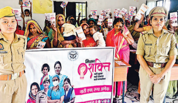
महिलाओं व बालिकाओं को सुरक्षा के टिप्स देते पुलिसकर्मी।