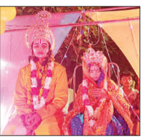
धनुष यज्ञ के बाद राम व सीता का विवाह का दृश्य।

करनैलगंज, छतईचरवा के निकट ब्रह्मचारी स्थान पर चल रहे पंच दिवसीय श्री बालरामलीला उत्सव के अंतिम दिवस धनुष यज्ञ और परशुराम-लक्ष्मण संवाद की लीला का मंचन किया गया।