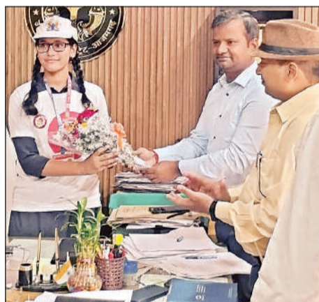
एक दिन के लिए एसडीएम बनी छात्रा का स्वागत करते अधिकारी।

पर अपलोड करना था। जनपद में इस वर्ष हाईस्कूल में कुल 36 हजार 913 छात्र पंजीकृत हुए हैं, जो पिछले साल की तुलना में 1 हजार 659 अधिक हैं। वहीं इंटरमीडिएट में 35 हजार 064 छात्रों का पंजीकरण हुआ है, जो पिछले साल के मुकाबले 1 हजार 050 कम है।