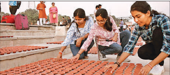
राम की पैड़ी पर तीन सखियों ने एक साथ सजाए दीपोत्सव के दी।

को जीवंत करने के लिए इस बार सरयू के 56 घाटों पर 28 लाख दीये जगमगाएंगे, जो गिनीज वर्ल्ड रिकॉर्ड तोड़ने का संकल्प लिए हैं। राम मंदिर के प्राण-प्रतिष्ठा के बाद यह नौवां दीपोत्सव है, जो हर एक को आध्यात्मिक ऊर्जा से और भी