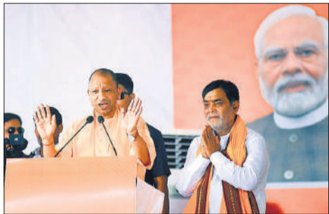
बिहार के दानापुर में भाजपा प्रत्याशी रामकृपाल यादव की नामांकन रैली को संबोधित करते मुख्यमंत्री योगी आदित्यनाथ।

दौड़ को बाधित करने के लिए राजद, कांग्रेस व इंडी गठबंधन के सहयोगी दलों ने विकास बनाम बुर्के की शरारत शुरू की है। जब बिहार विकास की चर्चा कर रहा है तो कांग्रेस, राजद ने बुर्के की नई बहस को बढ़ाने का प्रयास किया है। उन्होंने कहा कि इन्हें फर्जी पोलिंग का अधिकार नहीं मिलना चाहिए। राजद व कांग्रेस फर्जी पोलिंग