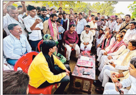
पीड़ित परिजनों से मुलाकात करते सपा के पदाधिकारी।