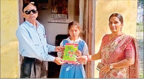
छात्रा को निःशुल्क पुस्तकें देते शिक्षक।