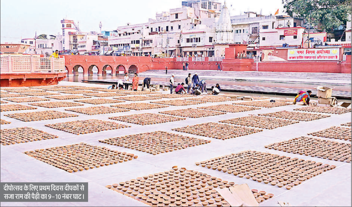
दीपोत्सव के लिए प्रथम दिवस दीपकों से सजा राम की पैड़ी का 9-10 नंबर घाट।

उत्साह से लबरेज स्वयं सेवकों में छात्राओं की भागीदारी अधिक रही। हनुमान चालीसा और रामायण की