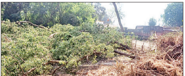
काट गए हरे पेड़ व उनकी टहनियां।