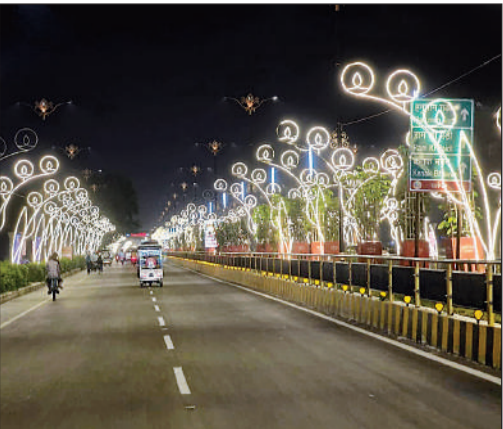
स्वागत के लिए चमकता रामनगरी का लता मणेशकर चौक, केसरिया ध्वज पताका के साथ राम की पैड़ी में हनुमान जी का स्लाडिंग रथ, राम की पैड़ी पर जलधारा में हनुमंत लला की विशाल मूर्ति एवं दीपोत्सव से पूर्व अद्भुत लाइटिंग से दमकता अयोध्या का धर्मपथ।