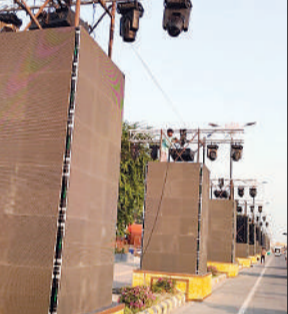
धर्मपथ पर लगाए जा रहे डिजिटल स्तंभ।

डिजिटल लाइट शो प्रदर्शित होंगे। यह डिजिटल प्रस्तुति 18 से 20 अक्टूबर तक चलेगी, जिससे श्रद्धालु स्वयं को त्रेता युग के दिव्य अनुभव में महसूस करेंगे। इसके अलावा रामकथा पार्क, राम की पैड़ी, हनुमानगढ़ी, बिरला मंदिर, तुलसी उद्यान, भजन संध्या स्थल और सरयू ब्रिज तक को सजाने-संवारेने का कार्य युद्ध स्तर पर जारी है। कंपनी द्वारा लगाए जा रहे आर्च गेट्स और डिजिटल पिलर्स अयोध्या की सड़कों को आधुनिक स्वरूप देंगे, वहीं धार्मिक भावना को भी जीवंत रखेंगे।