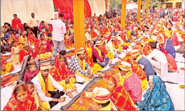
सामूहिक विवाह का प्रतीकात्मक फोटो।

अमृत विचार: मुख्यमंत्री सामूहिक विवाह योजना में सही पात्रों को लाभ मिले और गड़बड़ी पर अंकुश लगेगा। इसके लिए सरकार ने नई व्यवस्था शुरू की है। अब शादी के पहले वर-वधू की बायोमेट्रिक लगेगी। इसके बाद ही विवाह होगा। इससे पारदर्शिता आएगी। इस संबंध में समाज कल्याण विभाग को शासनादेश मिल गया है। इस साल नवंबर में होने वाले आयोजन में इसे अमल में लाया जाएगा। वहीं, अब प्रत्येक जोड़े पर एक लाख रुपये खर्च होंगे, जो पहले 51 हजार रुपये था।