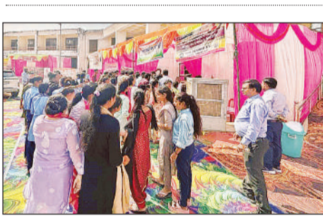
स्वदेशी मेले का अवलोकन करती विद्यालय की छात्राएं व शिक्षक।

अंबेडकरनगर। मुख्यमंत्री के निर्देशन में प्रदेश के सभी 75 जनपदों में स्थानीय उत्पादों के प्रोत्साहन के लिए स्वदेशी मेलों का आयोजन किया जा रहा है। इसी क्रम में यूपी इंटरनेशनल ट्रेड शो स्वदेशी मेला का आयोजन जनपद के लोहिया भवन परिसर में किया गया है। मेले में जनपद के विद्यालयों के छात्र-छात्राओं सहित बड़ी संख्या में आमजन द्वारा उत्साहपूर्वक भ्रमण किया गया तथा स्वदेशी उत्पादों की खरीदारी में विशेष रुचि दिखाई गई। नागरिकों में स्वदेशी उत्पादों के प्रति उत्साह और आत्मनिर्भरता की भावना स्पष्ट रूप से देखने को मिली। 15 अक्टूबर से रोजाना सांय 05 बजे से रात्रि 08 बजे तक लोहिया भवन परिसर में लोक गायन सांस्कृतिक कार्यक्रम का आयोजन किया जा रहा है।