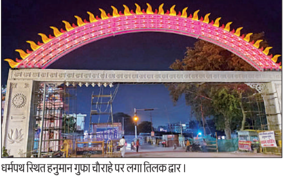
धर्मपथ स्थित हनुमान गुफा चौराहे पर लगा तिलक द्वार।

अमृत विचार : सनातन संस्कृति का केंद्र अयोध्या प्रभु श्रीराम के आगमन की खुशी में दीपोत्सव से जगमग होने के लिए तैयार है। नौवै दीपोत्सव को ऐतिहासिक और अविस्मरणीय बनाने के लिए नगर निगम भी तैयारियों के साथ आगे आ रहा है। पर्व पर अयोध्या केवल दीपों से ही जगमग नहीं होगी। फूलों की सजावट और स्वच्छता से संकल्पित दिखेगी। नगर निगम प्रत्येक वार्ड को दीपों की ज्योति से प्रकाशित कराने की रणनीति पर है। प्रत्येक पार्श्व को वार्ड में 15 सौ दीप वितरित