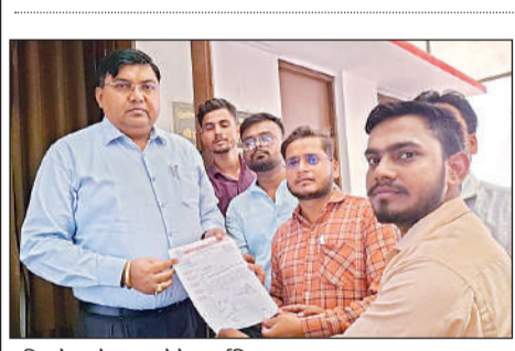
मजिस्ट्रेट को ज्ञापन देते फार्मासिस्ट।

मेडिकल कॉलेज में जिले के फार्मासिस्टों की हो तैनाती, सौंपा मांग पत्र