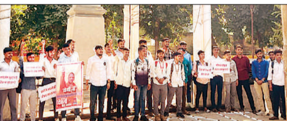
गांधी पार्क में प्रदर्शन करते छात्र पंचायत के सदस्य।