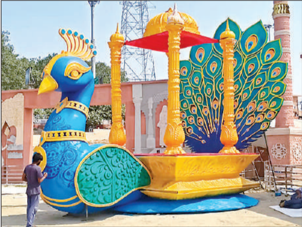
पुष्पक विमान का रंग रोगन करता कलाकार।