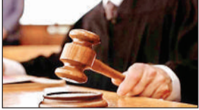
विधि संवाददाता, सुलतानपुर

● न्यायालय ने सख्त रुख अपनाते हुए तलब किया संपत्ति का ब्यौरा