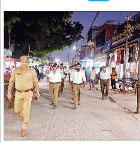
नवाबगंज कस्बे में पथ संवलन करते स्वयं सेवक।