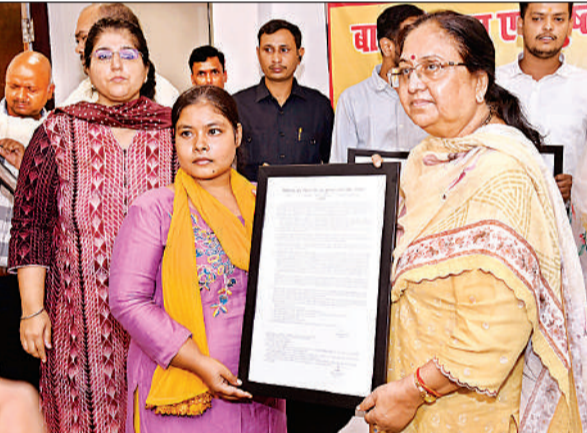
मृतक आश्रित को अनुकंपा नियुक्ति पत्र प्रदान करतीं मंत्री बेबी रानी मौर्य।