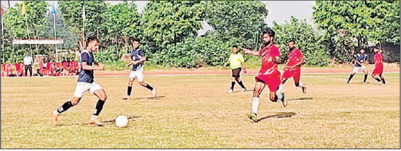
प्रदेशीय सीनियर पुरुष फुटबॉल प्रतियोगिता के सेमीफाइनल मुकाबले में गोल करने को बॉल लेकर भागता खिलाड़ी।