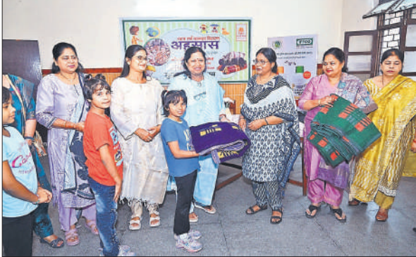
बच्चों को उपहार देती महिला क्लब की सदस्य।