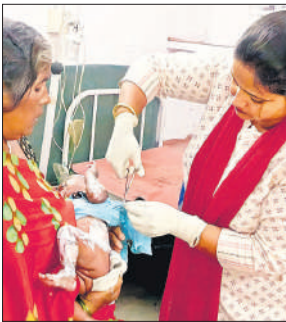
सीएचसी में प्राथमिक उपचार करते हुए।

अमृत विचार : बच्चे द्वारा बाइक की टंकी का पाइप खींचने से निकले पेट्रोल से घर में आग लग गयी। जिससे पास में लेटी छह माह की मासूम झुलस गयी। परिजनो ने मासूम को अस्पताल में भर्ती कराया है।