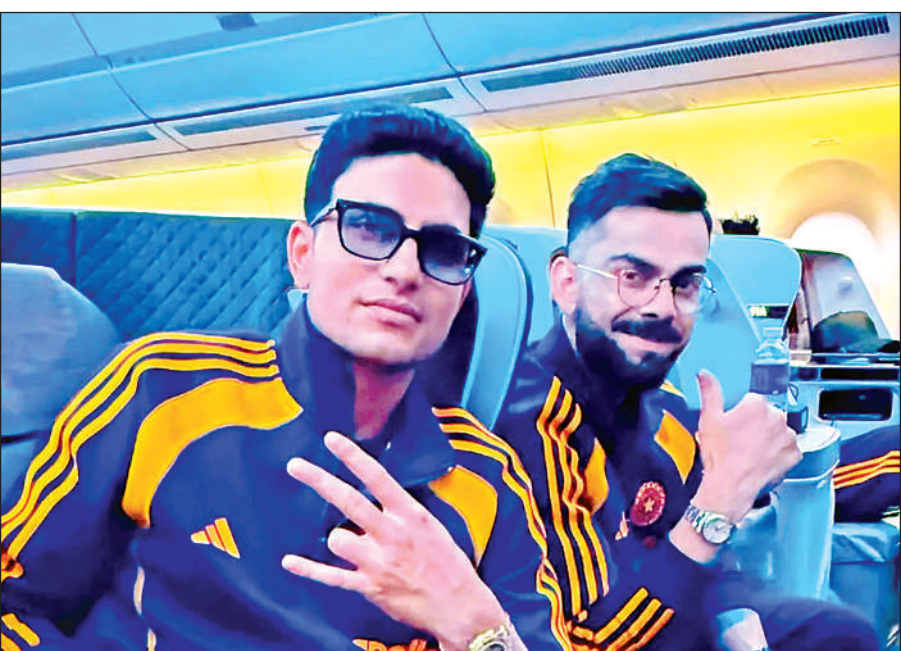
ऑस्ट्रेलिया के पर्थ में भारतीय कप्तान शुभमन गिल व विराट कोहली।

वनडे सीरीज का पहला मैच यहां रविवार को खेला जाएगा। उसके बाद अगले दो मैच एडिलेड (23 अक्टूबर) और सिडनी (25 अक्टूबर) में खेले जाएंगे। इसके बाद 29 अक्टूबर से पांच मैचों की