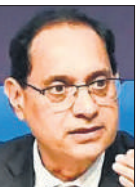
तुहिन कांत पांडेय

उन्होंने कहा था कि पूंजी बाजार नियामक विदेशी पोर्टफोलियो निवेशकों को गैर-नकद निपटान वाले, गैर-कृषि जिंस वायदा एवं विकल्प अनुबंधों में व्यापार करने की अनुमति देने के प्रस्ताव पर भी विचार कर रहा है।