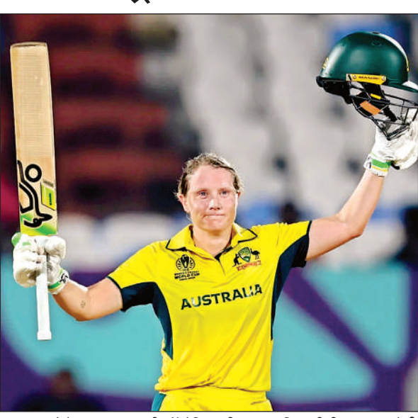
शतक लगाने के बाद जश्न मनाती ऑस्ट्रेलिया की कप्तान एलिसा हीली।