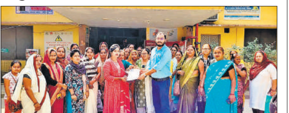
मैडिकल अफसर को ज्ञापन देती आशा व सिंगी कार्यकर्ता ।