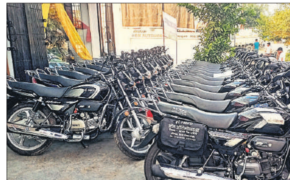
शो रूम में खड़ी बाइकें।

अमृत विचार : जीएसटी कम होने का लाभ ऑटोमोबाइल सेक्टर पर देखने को मिल रहा है। मध्यम वर्ग के लोग अब नई बाइक लाने की तैयारी की जा रही है। दिवाली पर नई बाइक खरीदने के लिए बुकिंग शुरू हो गई है। एजेंसियों ने भी ज्यादा ज्यादा वाहन बेचने के लिए ग्राहकों को लुभावने आफर देना शुरू कर दिया। कस्बे में दो एजेंसियों से अब तक 425 बाइकों की बुकिंग हो चुकी है। इसमें अभी और इजाफा होने की उम्मीद एजेंसी मालिक लगाए हैं।