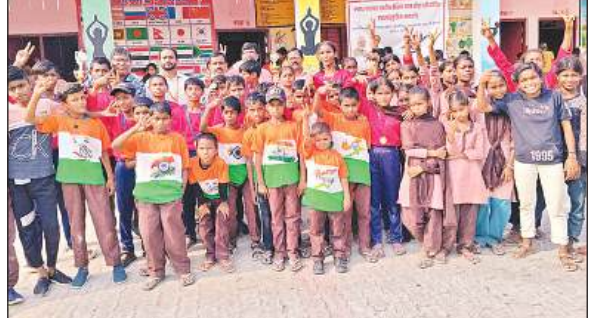
विजेता छात्र-छात्राओं के साथ शिक्षक व ग्राम प्रधान ।