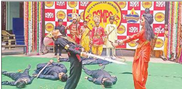
डीएसएम स्कूल में होता राम रावण का युद्ध ।