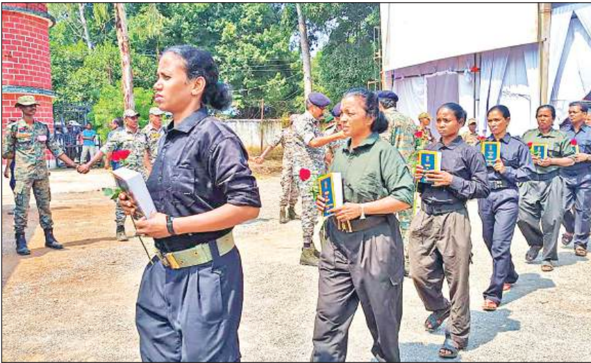
छत्तीसगढ़ के बस्तर जिले के जगदलपुर में स्थित पुलिस लाइन में नक्सलियों ने भारी संख्या में आत्मसमर्पण किया। इस मौके पर हाथ में भारत के संविधान की प्रतियां लेकर राष्ट्र के नियम –कायदों के प्रति विश्वास जताया।

अंतानानारिवो। मेडागास्कर में सैन्य तख्तापलट के तीन दिन बाद सेना के एक कर्नल ने शुक्रवार को राष्ट्रपति पद की शपथ ली, जिसके कारण सत्ता से बेदखल राष्ट्रपति को देश छोड़कर छिपने के लिए मजबूर होना पड़ा। कर्नल माइकल रांद्रियनिरीना (सेना की एक विशेष इकाई के कमांडर) ने देश के उच्च संवैधानिक न्यायालय की मुख्य सभा में आयोजित समारोह में पद की शपथ ली। उनका यह पद ग्रहण समारोह ऐसे समय हुआ है जब उन्होंने केवल तीन दिन पहले घोषणा की थी कि सशस्त्र बल हिंद महासागर के लगभग तीन करोड़ जनसंख्या वाले इस द्वीपीय देश की सत्ता संभालने जा रहे हैं। संयुक्त राष्ट्र ने इस तख्तापलट को असंवैधानिक परिवर्तन करार देते हुए निंदा की है। कई अन्य देशों ने अहम प्रतिक्रियाएं व्यक्त की हैं जिनमें मेडागास्कर पर पूर्व में शासन कर चुका फ्रांस भी शामिल है।