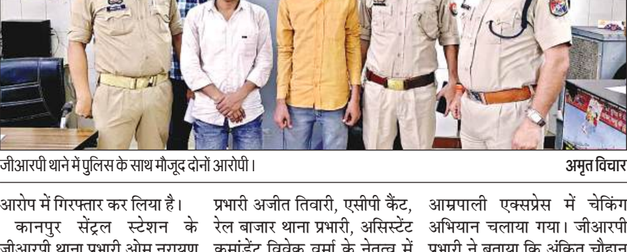
जीआरपी थाने में पुलिस के साथ मौजूद दोनों आरोपी।

अमृत विचार। अमृतसर से कटिहार जा रही गाड़ी संख्या 15708 आम्रपाली एक्सप्रेस में बम की सूचना से हड़कंप मच गया। जीआरपी, आरपीएफ के अतिरिक्त कानपुर कमिश्नरेट की पुलिस, खुफिया विभाग, बम निरोधक दस्ता, डाग स्क्वायड ने सेंट्रल स्टेशन पर ट्रेन के आते ही घेर लिया और ट्रेन को खाली कराकर डिब्बों की तलाशी ली गई लेकिन कुछ नहीं मिला। पता चला कि सीट पर बैठने को लेकर दो सगे भाइयों का कुछ यात्रियों से झगड़ा हो गया जिन्हें सबक सिखाने के लिए दोनों भाइयों ने अफवाह फैलाई थी। पुलिस ने दो सगे भाइयों को अफवाह फैलाने के