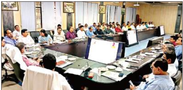
डीएम की अध्यक्षता में हुई बैठक में मौजूद अधिकारी।

कलेक्ट्रेट सभागार में सीएम डैशबोर्ड में विभागीय रैंक, आइजीआरएस और मुख्यमंत्री हेल्पलाइन में लंबित संदर्भों, एक करोड़ से ऊपर की निर्माणाधीन परियोजनाओं की समीक्षा हुई। इसमें डीएम ने पीएम सूर्य घर योजना, नई सड़कों के निर्माण, अनुस्क्षण,सेतु निर्माण, फेमिली आइडी, एनआरएलएम, पंचायतीराज के राज्य वित्त आयोग व पंद्रहवे वित्त आयोग सहित अन्य विभागीय रैंक की प्रगति जांची। नई सड़कों के निर्माण में