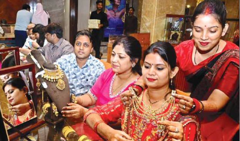
इस बार धनतेरस पर नए लुक में हल्की ज्वेलरी उपलब्ध है।

उधर, धनतेरस के लिए खासतौर पर इसके अलावा अन्य बाजारों को मिलाकर शहर मे एक हजार करोड़ का कारोबार संभव हो सकता है। धनतेरस पर बाजारों में कारोबारी खरीदारों के रुझान के अनुसार नए उत्पाद भी बाजार में लाए हैं। सोना-चांदी कारोबारी भी हल्के आभूषणों में नई डिजाइन की रेंज पर्व पर लाए हैं। इसी तरह बर्तन व्यापारी, उपहार सामग्री के कारोबारी, झालर, कपड़ा और मिठाई कारोबारियों को पर्व पर बाजारों में खरीदारी करने वालों की भीड़ उमड़ने का अनुमान है।