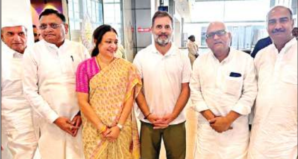
एयरपोर्ट पर राहुल गांधी से मिलते पहुंचे कांग्रेसी।