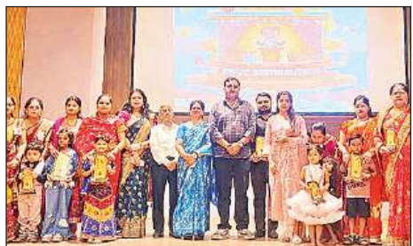
अंबिका स्कूल कार्यक्रम के दौरान मौजूद प्रबंधक ।