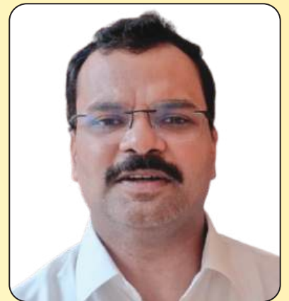
अर्पित उपाध्याय आईआईएस, नगर आयुक्त कानपुर नगर निगम