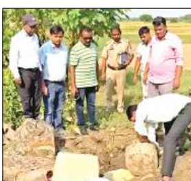
खोवा व दूध को नष्ट कराती खाद्य सुरक्षा की टीम।