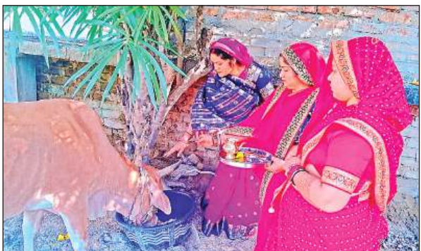
केशव नगर में गाय का पूजन करती महिलाएं।

अमृत विचार: पुत्रवती महिलाओं ने शनिवार को गोवत्स द्वादशी के पर्व पर अपने पुत्रों की दीर्घायु की कामना एवं कुशलता के लिए गाय बछड़े का विधिवत पूजन किया और व्रत रखा। प्राचीन परंपरा के अनुसार इस अवसर पर महिलाएं सुबह स्नान करके अपने पुत्र की दीर्घायु एवं कुशलता की कामना को लेकर गोवत्स की पूजा करती हैं। इस संबंध में इस व्रत की कथा भी प्रचलित है उसके अनुसार कहा जाता है कि एक साहूकार के सात बेटे थे। उसने लोगों की सुविधा के लिए एक तालाब खुदवाया किंतु 12 वर्ष तक बारिश के बावजूद भी वह तालाब भरा नहीं। इस पर उसने इस विषय में विचारों से पूछा तो किसी ने उसे बताया कि यदि वह अपने सबसे