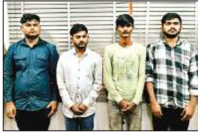
पुलिस के हाथ लगे साइबर अपराधी।