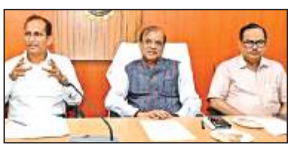
भविष्य निधि कार्यालय सभागार में पत्रकार वार्ता करते अधिकारी।