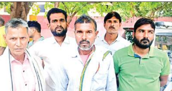
हादसे में छात्र की मौत के बारे में जानकारी देते परिजन।