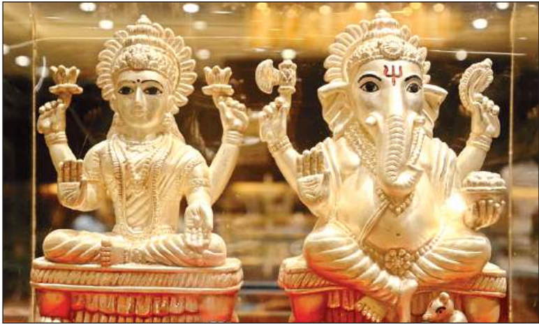
ज्वेलरी बाजार में इस बार सोने-चांदी के गणेश-लक्ष्मी आए हैं।

धनतेरस पर इस बार बाजार में हल्की ज्वेलरी का जोर है। चांदी से लेकर सोने तक हल्के आभूषणों से सराफा बाजार लबरेज है। बाजार में चांदी के पांच ग्राम तक सिक्के भी अपनी मौजूदगी दर्ज करा चुके हैं। इसके अलावा बाजार में इस बार नई डिजाइन की कुंदन ज्वेलरी भी टक्कर दे रही है। राजस्थानी व्हाइट स्टोन और जड़ाऊ ज्वैलरी भी खरीदारों के लिए डिस्टले की गई है। आभूषण कारोबारियों ने बताया कि बाजार में पर्व पर आधुनिक व पारंपरिक दोनों ही तरह के आभूषण को पसंद करने वाले खरीदारों का ख्याल रखा गया है। आधुनिक डिजाइन के आभूषणों में इस बार कुंदन पोलकी ज्वेलरी युवाओं की पसंद मानी जा रही है। यह ज्वेलरी आधुनिक व पारंपरिक दोनों ही डिजाइन में बाजार में मौजूद है। इसी तरह राजस्थान से आने वाला व्हाइट स्टोन भी इस बार आधुनिक खरीदारों को पसंद आ रहा है। रोज गोल्ड के नाम से आई गाढ़े सोने की ज्वैलरी भी खरीदारों को उपलब्ध होगी।