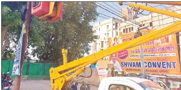
फोरलेन पर झालर लगाने का काम करते पालिका कर्मी ।