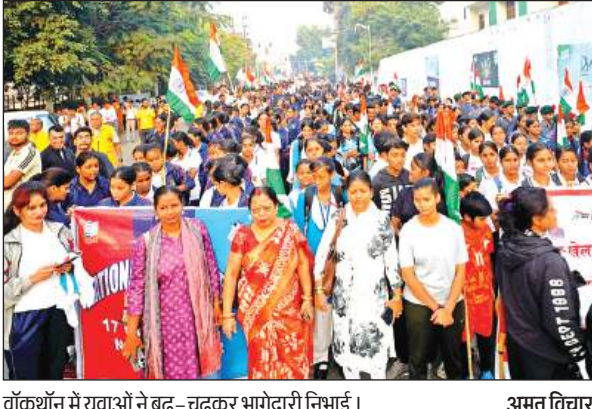
वॉकथॉन में युवाओं ने बढ़-चढ़कर भागेदारी निभाई।

से दिया गया। उन्होंने कहा कि खेल न केवल शारीरिक और मानसिक विकास का माध्यम हैं, बल्कि आत्मविश्वास, अनुशासन और राष्ट्र निर्माण की भावना को भी मजबूत करते हैं। रैली में मुख्य रूप से एनसीसी,