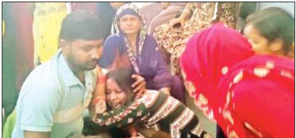
घटना के बाद रोते-बिलखते परिजन।