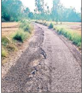
हलोर-जमुरावां मार्ग पर उखड़ी गिट्टियां और जगह-जगह बने गड्ढे।

यह सड़क महाराजगंज क्षेत्र के करीब आधा दर्जन गांवों को जोड़ती है। साथ ही, लगभग एक सैकड़ छात्र-छात्राओं का भी प्रतिदिन इसी