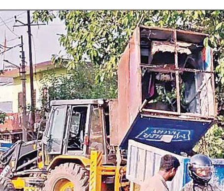
अतिक्रमण हटाने की प्रशासन की जेसीबी।