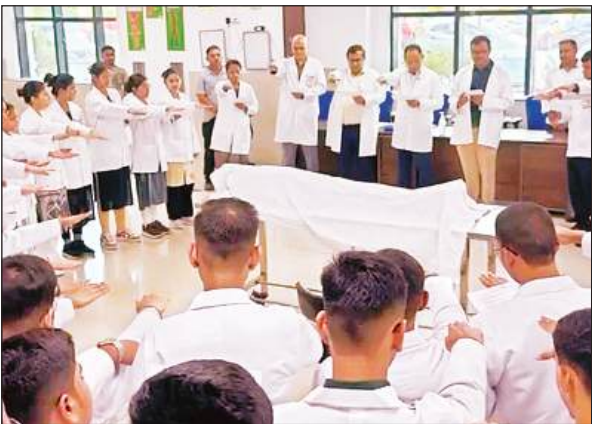
एम्स में आयोजित विश्व मानव संरचना दिवस पर शपथ लेते चिकित्सक व अन्य कर्मी।