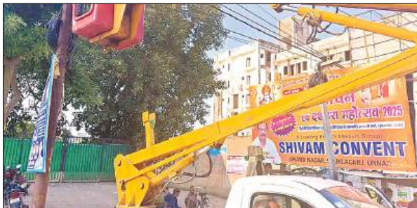
फोरलेन पर झालर लगाने का काम करते पालिका कर्मी ।