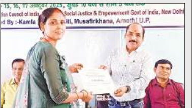
कार्यक्रम में प्रमाण पत्र वितरित करते संस्थापक।

कस्बा स्थित कमला सेवा समिति मुसाफिरखाना में शुक्रवार को तीन दिवसीय सतत पुनर्वास कार्यक्रम का समापन हुआ। कार्यक्रम में