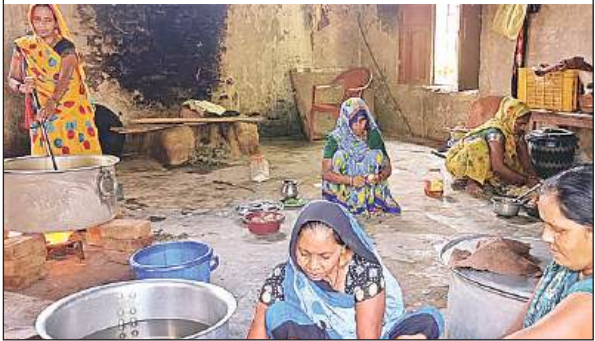
विद्यालय में खाना बनाती रसोइयां।