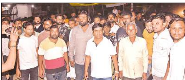
हंगामा करते दुकानदार ।

पटाखा लेने पहुंचे सिपाहियों पर उगाही का आरोप, हंगामा