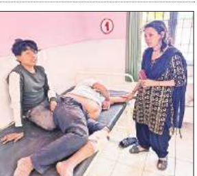
डाक्टर के इंतजार में मरीज व परिजन।

रामनगर, रामसनेहीघाट, बाराबंकी, अमृत विचार