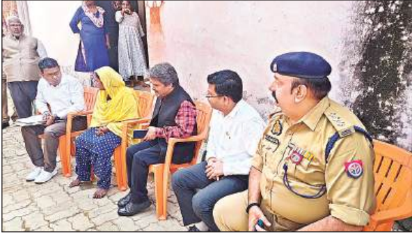
मृतक युवक के परिजनों से बातचीत करते राष्ट्रीय अनुसूचित जाति आयोग के निदेशक।