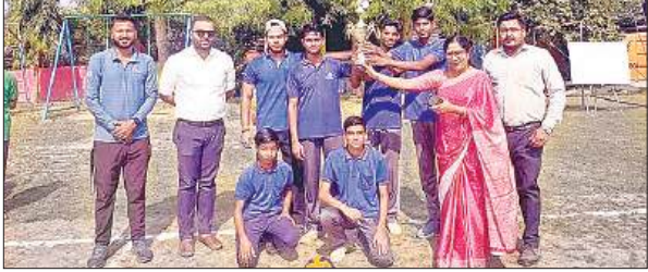
ट्राफी के साथ टीम के सदस्य।

अमृत विचार : शिक्षण संस्था एराइज इंडिया पब्लिक स्कूल में दो दिवसीय इंटर हाउस वॉलीबॉल प्रतियोगिता (बालक वर्ग) का आयोजन किया गया। एराइज इंडिया पब्लिक स्कूल में दो दिवसीय इंटर हाउस वॉलीबॉल प्रतियोगिता (बालक वर्ग) का खिताब यूनिटी हाउस (ब्लू) के नाम रहा। फाइनल मुकाबले में यूनिटी हाउस (ब्लू) ने हारमोनी