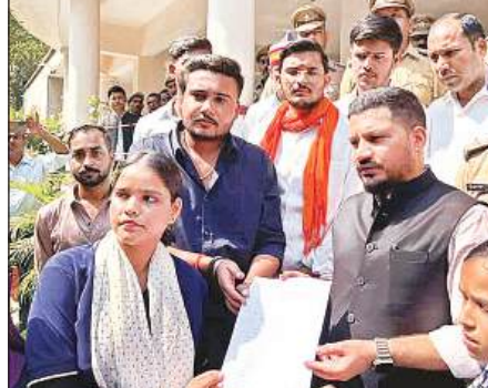
डीएम को ज्ञापन देते एबीवीपी पदाधिकारी।

गई बड़ी मात्रा में आतिशबाजी बरामद की। पुलिस ने बताया कि मौके से चार गत्ते व तीन बोरियां छोटे-बड़े पटाखों की मिलीं, जिनकी कीमत लगभग एक लाख रुपये आंकी गई है। पछताछ में पटाखा गांव के मुबारक का बताया गया। प्रभारी निरीक्षक अनिल पांडेय ने बताया कि जब पटाखों का कोई लाइसेंस प्रस्तुत नहीं किया जा सका, जिस पर दो लोगों के विरुद्ध विस्फोटक अधिनियम के तहत मुकदमा दर्ज किया गया है।