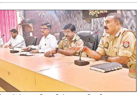
बैठक में मौजूद एसडीएम, सीओ व अन्य अधिकारी।