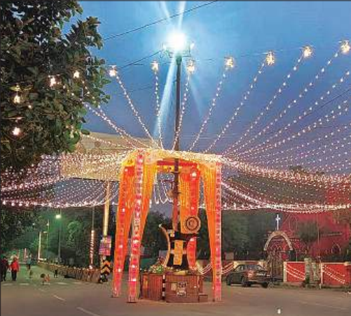
बिजली की रंग-बिरंगी झालरों से जगमगाता चौराहा।