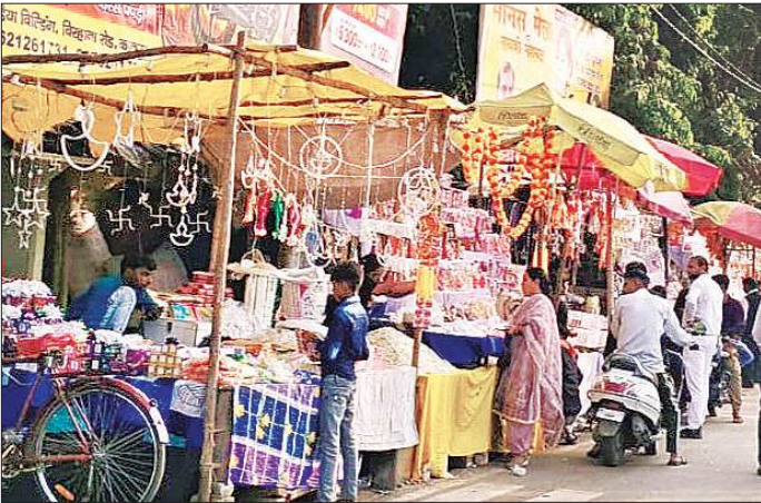
शहर के मुख्य मार्ग पर सजी दुकानें और खरीदारी करते लोग।