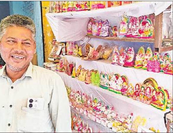
मिठ्ठी की बनी प्रतिमाएं और पूजन सामग्री बेचता दुकानदार।