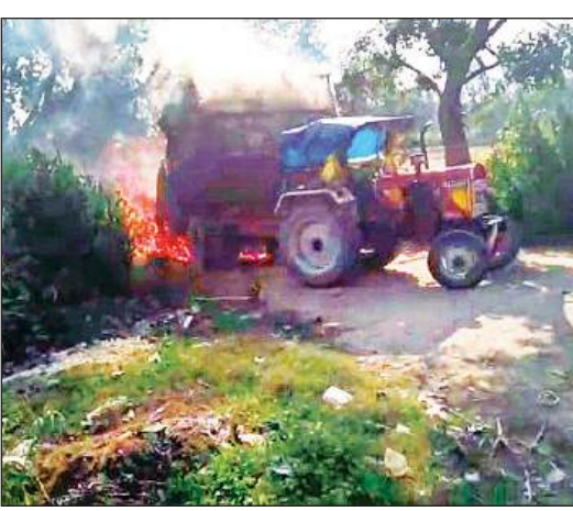
जलता हुआ ट्राली में लदा पुआल।

हाउस (ग्रीन) को एक रोमांचक मैच में हरा कर विजय हासिल की। प्रतियोगिता में करेज हाउस (रेड), लेगसी हाउस (येलो), यूनिटी हाउस (ब्लू), हारमोनी हाउस (ग्रीन) सहित विद्यालय की चारों हाउस की टीमों ने प्रतिभाग किया। फाइनल राउंड में यूनिटी हाउस (ब्लू) और हारमोनी हाउस (ग्रीन) के मध्य कांटे के टक्कर में यूनिटी हाउस (ब्लू) ने 21-17 से ट्रॉफी का खिताब अपने नाम कर लिया।