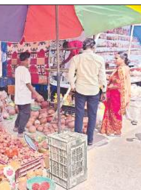
फोरलेन पर दीये खरीदती महिलाएं ।