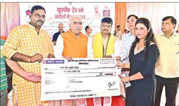
योजना के तहत लाभार्थी को लोन का डेमो चेक देते मंत्री।