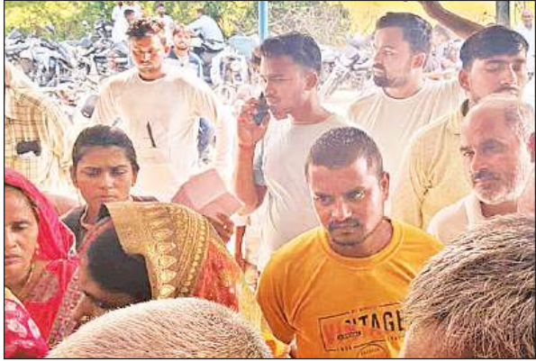
अमेठी कृषक सेवा केंद्र के बाहर लगी किसानों की लंबी लाइन।

जानकारी के मुताबिक साधन सहकारी समिति से लेकर निजी दुकानों तक खाद उपलब्ध होने की बात कही जा रही है। लेकिन जिले में धरातल पर कुछ और ही नजर आ रहा है। सहकारी समितियों में किसान खाद के लिए लाइन लगा रहे हैं फिर भी अंत में उनको मायूस होकर वापस लौटना पड़ता है। परेशान किसानों ने जिला प्रशासन से समितियों में खाद उपलब्ध करवाने की मांग की है। वहीं जिला कृषि अधिकारी ने कहा