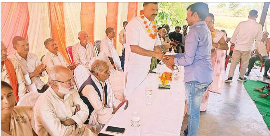
बैठक के दौरान सांसद को माला पहनाकर अभिवादन करता समर्थक।