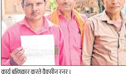
कार्य बहिष्कार करते वैक्सीन रनर।