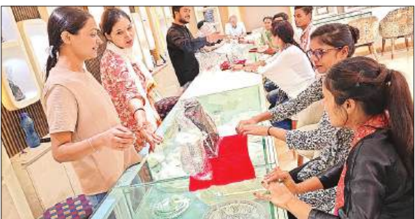
धनतेरस की पूर्व संस्था पर खरीदारी करती महिलाएं।