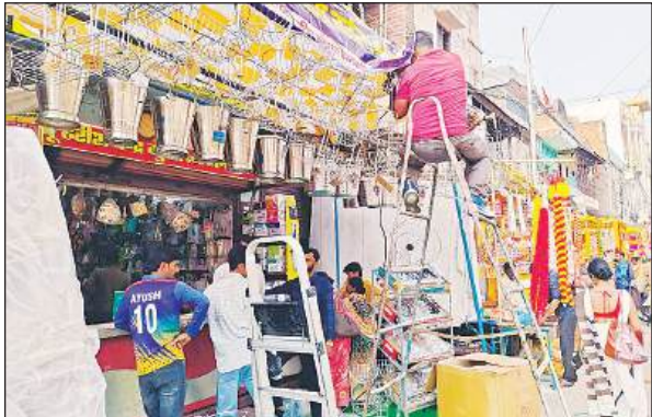
धनतेरस के लिए दुकान के बाहर बर्तन सजाता कर्मचारी ।