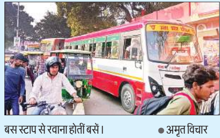
बस स्टॉप से रवाना होती बसें।