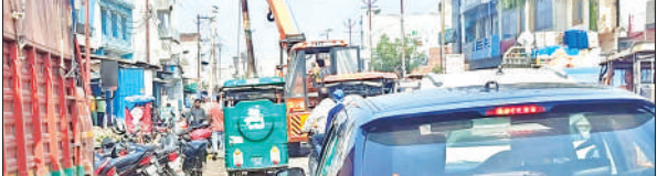
राजापुर मार्ग पर नहर पुलिया के आगे हटाए जा रहे सड़क पर खड़े पोल।

सड़क चौड़ीकरण में बाधा बन रहे थे पोल,आवागमन में भी हो रही काफी दिक्कत