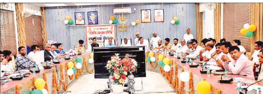
गंधी सभागार में समीक्षा करती विधान परिषद की अध्ययन समिति ।

मौत की खबर मिलते ही उसके परिवार में कोहराम मच गया। पल भर में दिवाली की खुशिया मातम में बदल गईं। पुलिस ने शव पोस्टमार्टम के लिए भेजा है।