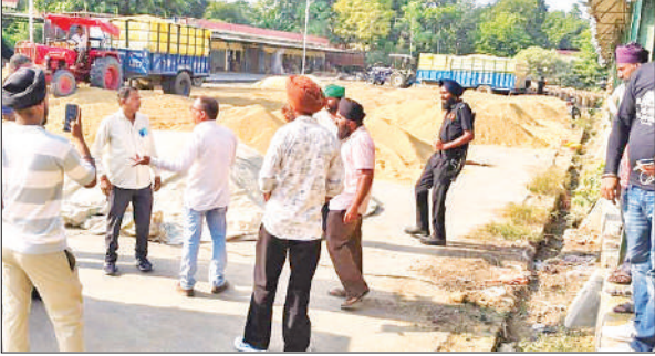
शुक्रवार को किसान का धान न तौलने पर नाराजगी जताते किसान।

दो दिन से पूरनपुर मंडी समिति में स्थित कुछ क्रय केंद्रों पर नियम विरुद्ध तरीके से रात में