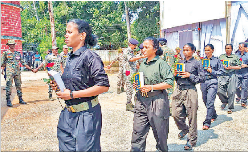
छत्तीसगढ़ के बस्तर जिले के जगदलपुर में स्थित पुलिस लाइन में नक्सलियों ने भारी संख्या में आत्मसमर्पण किया। इस मौके पर हाथ में भारत के संविधान की प्रतियां लेकर राष्ट्र के नियम –कायदों के प्रति विश्वास जताया।

अंतानानारिवो। मेडागास्कर में सैन्य तख्तापलट के तीन दिन बाद सेना के एक कर्नल ने शुक्रवार को राष्ट्रपति पद की शपथ ली, जिसके कारण सत्ता से बेदखल राष्ट्रपति को देश छोड़कर छिपने के लिए मजबूर होना पड़ा। कर्नल माइकल रांद्रियनिरीना (सेना की एक विशेष इकाई के कमांडर) ने देश के उच्च संवैधानिक न्यायालय की मुख्य सभा में आयोजित समारोह में पद की शपथ ली। उनका यह पद ग्रहण समारोह ऐसे समय हुआ है जब उन्होंने केवल तीन दिन पहले घोषणा की थी कि सशस्त्र बल हिंद महासागर के लगभग तीन करोड़ जनसंख्या वाले इस द्वीपीय देश की सत्ता संभालने जा रहे हैं। संयुक्त राष्ट्र ने इस तख्तापलट को असंवैधानिक परिवर्तन करार देते हुए निंदा की है। कई अन्य देशों ने अहम प्रतिक्रियाएं व्यक्त की हैं जिनमें मेडागास्कर पर पूर्व में शासन कर चुका फ्रांस भी शामिल है।