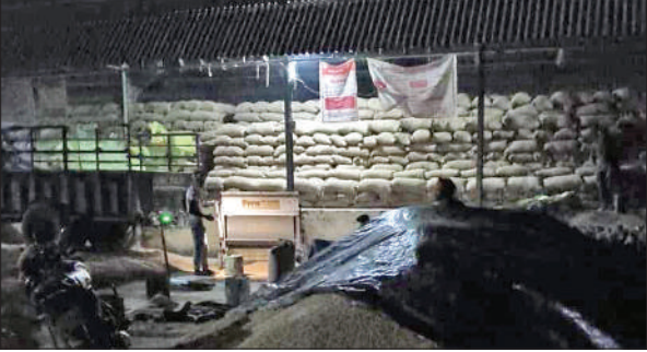
गुरुवार रात को पूरनपुर मंडी में रात में हो रही तौल।

पहुंचा था। आरोप है कि क्रय केंद्र पर पहुंचने पर उसके धान की तौल करने से टालमटोल की जाने लगी। डस्टर न चलने की बात कहकर एक दिन बाद आने के लिए कहा जाता रहा। इस पर किसान ने