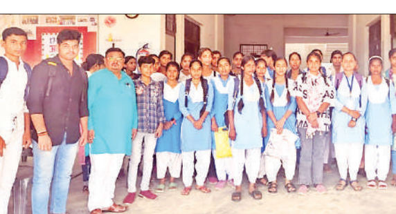
आर्ट मेला के प्रतिभागी छात्र छात्राएं।