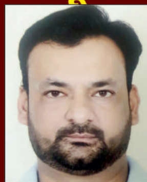
सचिव अग्रवाल कोषाध्यक्ष