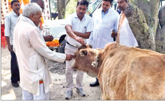
मूड़ा अस्सी में पशुओं का स्वास्थ्य परीक्षण करते डॉक्टर।