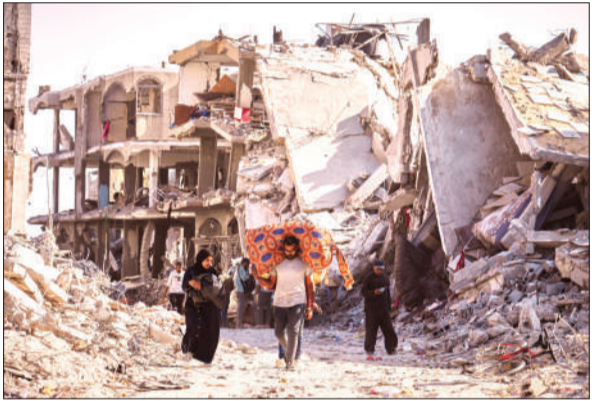
गाजा में गोलीबारी से क्षतिग्रस्त इमारत के सामने से गुजरते नागिरक।

फिर भी ट्रंप ने यह साफ किया कि गाजा में हमारास द्वारा प्रतिद्वंद्वी गुटों की हत्या किए जाने को लेकर उनका धैर्य सीमित है। उन्होंने कहा कि उन्हें अपने हथियार डालने होंगे, वरना हम उन्हें निशस्त्र करेंगे और यह जल्दी एवं संभवतः हिंसक तरीके से होगा।