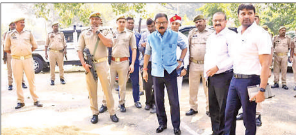
डेलापीर मंडी में धान खरीद केंद्र का निरीक्षण करते डीएम व अन्य। ● अमृत विचार