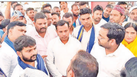
धरना स्थल पर अफसरों से बात करते भीम आर्मी के पदाधिकारी।