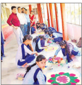
रंगोली बनाती छात्राएं।