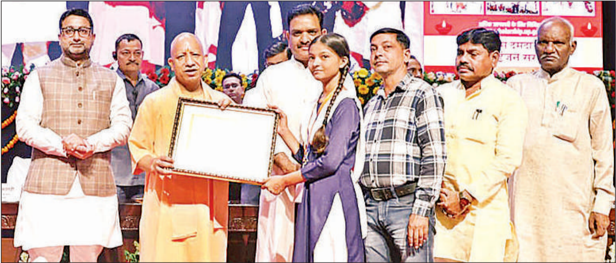
लखनऊ स्थित लोकभवन के सभाभार में आयोजित कार्यक्रम के दौरान छात्रा को छात्रवृत्ति का प्रमाण पत्र प्रदान करते मुख्यमंत्री योगी, साथ में अन्य।

लोकभवन में शुक्रवार को आयोजित छात्रवृत्ति वितरण कार्यक्रम में मुख्यमंत्री ने बताया कि इस बार 10 लाख 28 हजार से अधिक छात्रों को छात्रवृत्ति का लाभ मिला है। इनमें अनुसूचित जाति एवं जनजाति वर्ग के 3.56 लाख विद्यार्थियों को 114.92 करोड़, सामान्य वर्ग के 97 हजार छात्रों को 29.18 करोड़, अन्य पिछड़ा वर्ग के 4.83 लाख छात्रों को 126.69 करोड़ और अल्पसंख्यक वर्ग के