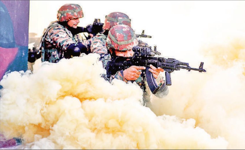
दीपावली के महेनजर देशभर में सुरक्षा बढ़ा दी गई है। दहशतगर्द और दुश्मन त्योहार में कोई खलल न डाल सकें, जिसके महेनजर जम्मू- कश्मीर में भारत –पाकिस्तान सीमा के पास नियंत्रण रेखा पर गश्त और सामरिक अभ्यास करते भारतीय सेना के जवान।

न्यूयॉर्क। मेटा अगले साल की शुरुआत से कृत्रिम बुद्धिमत्ता (एआई) चैटबॉट्स के साथ ऐसे उपाय कर रहा है जिसके तहत बच्चों से बातचीत के दौरान उस पर अभिभावकों का नियंत्रण रहेगा। इनमें एआई पात्रों के साथ आमने- सामने की बातचीत को पूरी तरह से बंद करने का विकल्प भी शामिल है। लेकिन अभिभावक मेटा के एआई सहायक को बंद नहीं कर पाएंगे, जिसके बारे में मेटा का कहना है कि यह किशोरों को सुरक्षित रखने में मदद करने के लिए सुरक्षा के साथ, उपयोगी जानकारी प्रदान करने के लिए उपलब्ध रहेगा। जो अभिभावक सभी एआई पात्रों के साथ सभी बातचीत बंद नहीं करना चाहते हैं, वे विशिष्ट चैटबॉट्स को भी ‘ब्लॉक’ कर सकेंगे।