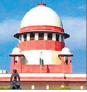
नई दिल्ली, एजेंसी

तमिलनाडु सरकार से कहा- संविधान पीठ के फैसले के बाद मामले की सुनवाई होगी