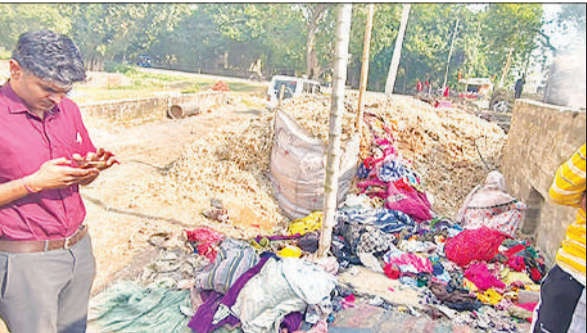
कोल्हु पर जांच करते एसडीएम और मौके पर पड़ी कपड़ों की कतरन।

● घरेलू बिजली कनेक्शन पर चलाए जा रहे कोल्हु