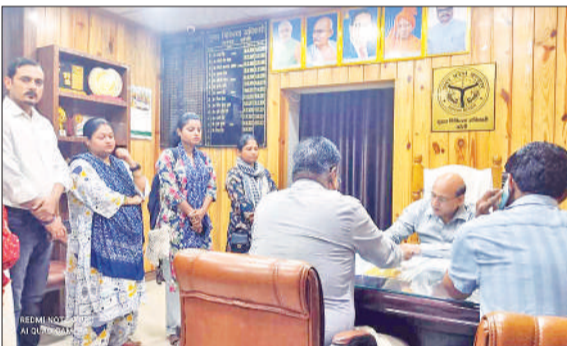
सीएमओ से वेतन न मिलने की पीड़ा बयां करते एनएचएम संविदा कर्मी। ● अमृत विचार

संयुक्त राष्ट्रीय स्वास्थ्य मिशन संविदा कर्मचारी संघ जिला इकाई