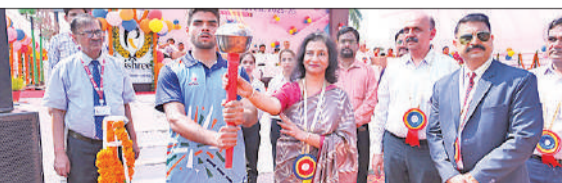
स्पोर्ट्स फेस्ट का शुभारंभ करते अतिथि, साथ में शिक्षक व खिलाड़ी।