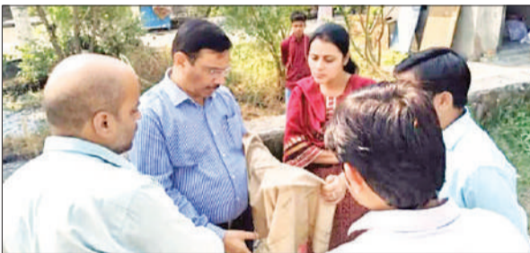
टीम के साथ जांच करते प्रशासनिक अधिकारी।

दरअसल, कुछ समय पहले नगर पालिका के कुछ सभासदों ने तालाब की भूमि पर कब्जा होने और पैमाइश में गड़बड़ी होने का आरोप लगाते हुए डीएम से शिकायत की थी। इसपर डीएम ने एडीएम न्यायिक व एसडीएम आंवला को जांच अधिकारी बनाया था। मामले में जांच के आदेश दिए गए थे। दोपहर