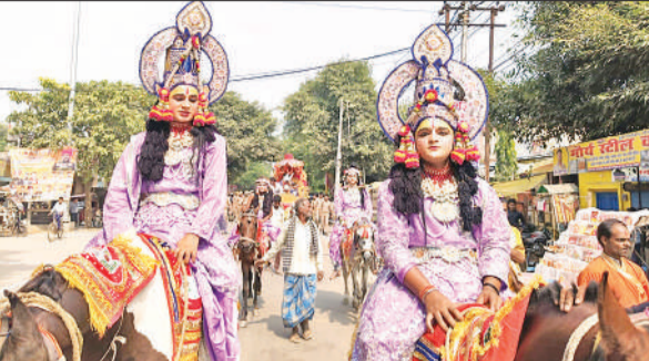
राजगद्दी शोभायात्रा में शामिल झांकी।