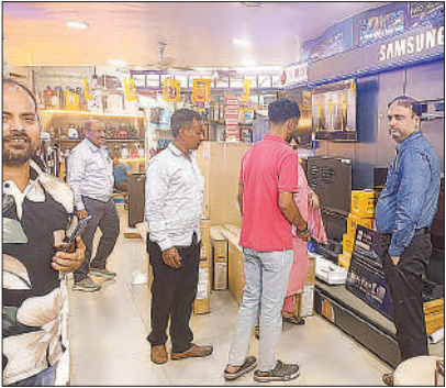
एक शोरूम पर इलेक्ट्रॉनिक उपकरण देखते खरीदार।

स्थानीय निवासियों का कहना है कि प्रशासन द्वारा बिना वैकल्पिक व्यवस्था किए मुख्य मार्ग पर बैरिकेडिंग लगाए जाने से