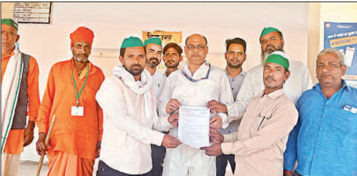
स्टेशन अधीक्षक को ज्ञापन सौंपते भारतीय किसान यूनियन के पदाधिकारी।