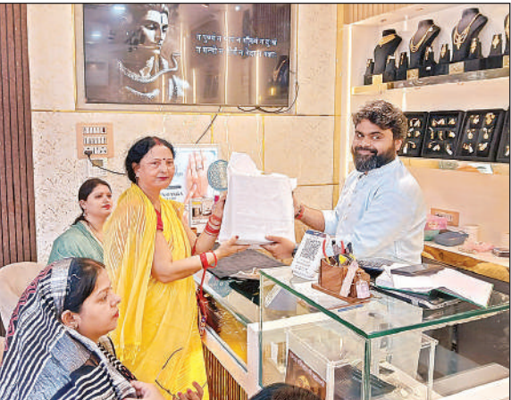
सराफा दुकान से ज्वेलरी खरीदती महिला।