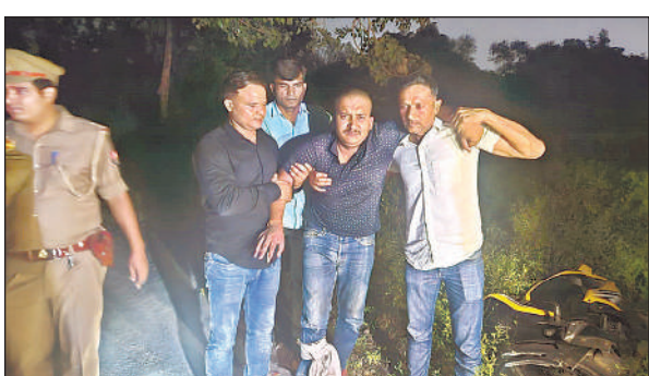
मुठभेड़ में घायल आरोपी को ले जाती पुलिस।