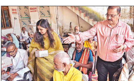
वृद्धा आश्रम में फल व मिठाई वितरित करती सीडीओ।