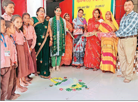
रसोइयों को दीपावली गिफ्ट देते प्रधानाचार्य।