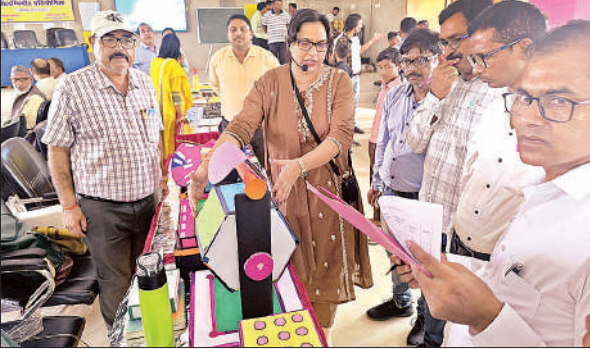
प्रदर्शनी में बच्चों की ओर से लगाये गये मॉडल देखते शिक्षक।

जिले के विभिन्न ब्लॉकों - पयागपुर, विशेषशरंगंज, हुजूरपुर, कैसरगंज, चितौरा, शिवपुर, महसी, रिसिया, जरवल और फखरपुर - के शिक्षकों और बच्चों ने उत्साहपूर्वक प्रतिभाग किया। कार्यक्रम में प्रत्येक ब्लॉक से 10-10 बच्चों और 3-3 शिक्षकों ने हिस्सा लिया, जिससे