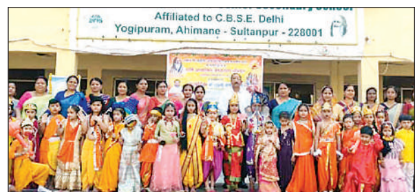
महर्षि विद्या मंदिर में आयोजित कार्यक्रम में शामिल बच्चों।