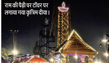
राम की पैड़ी पर टॉवर पर लगाया गया कुत्रिम दीया ।