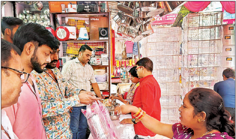
धनतेरस पर बर्तन खरीदते लोग।