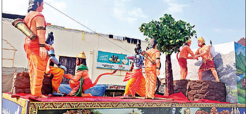
राम की पैड़ी पर राम वनमग्न की सजी झांकी ।

योगी आदित्यनाथ राममंदिर और फिर राम की पैड़ी पर पहला दीया जलाएंगे, तो यह रोशनी देश-दुनिया भर में फैलेगी। पांच देशों के कलाकार रामलीला मंचित करेंगे, और इको-डेस्टिनेशन टूर से पर्यटक अयोध्या के प्राकृतिक सौंदर्य को भी निहार सकेंगे।