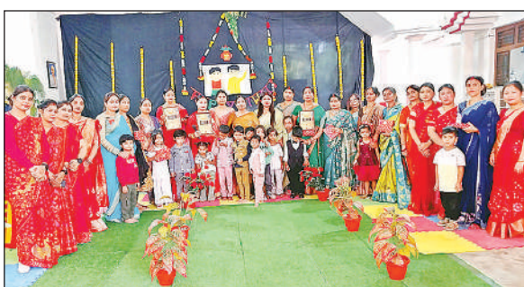
कार्यक्रम में मौजूद छात्र व शिक्षिकाएं।