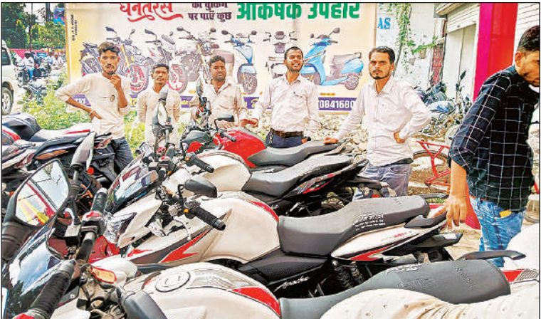
बाइक एजेंसी के सामने जुटे खरीदार।