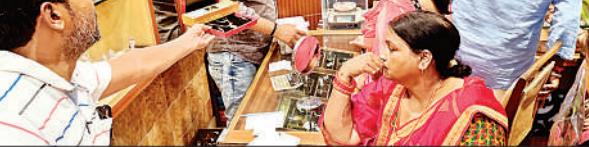
धनतेरस के दिन आभूषण की दुकान पर खरीदारी करती महिलाएं।