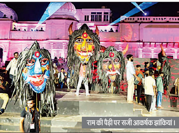
राम की पैड़ी पर सजी आकर्षक झांकियां ।