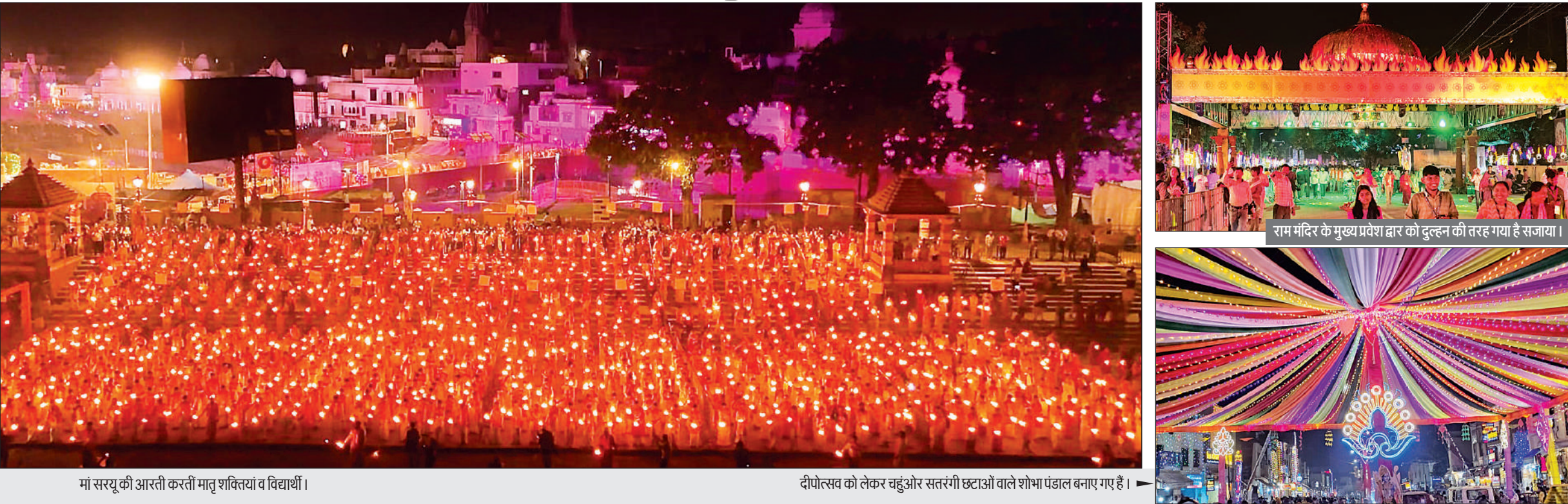
मां सरयू की आरती करती मातृ शक्तियां व विद्यार्थी ।