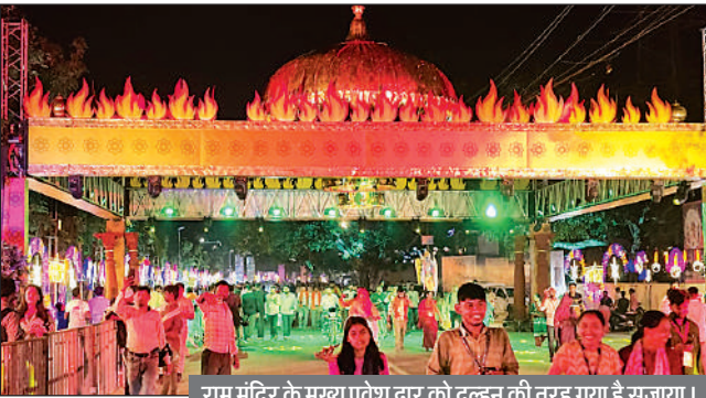
राम मंदिर के मुख्य प्रवेश द्वार को दुल्हन की तरह सजाया है ।