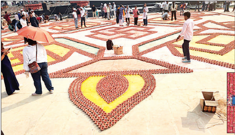
दीपोत्सव में घाट नंबर दस पर 80 हजार दियों से बनाया गया अद्भुत स्वास्तिक एवं इनसेट में झ्रोन से खींची गई तस्वीर ।

56 घाटों पर एक साथ प्रज्ज्वलित होंगे 26 लाख 11 हजार 101 दीपक