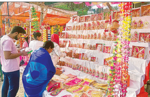
गणेश व लक्ष्मी की मूर्ति खरीदते लोग।

से लस्सर ग्रामीण क्षेत्रों के कस्बों में ग्राहकों की जबरदस्त भीड़ रही। धनतेरस पर लोगों ने बर्तन, कपड़े, मिठाइयां व इलेक्ट्रानिक सामानों की खरीदारी की। इलेक्ट्रानिक्स दुकानों में विभिन्न आइटमों के एक से बढ़कर एक मॉडल ग्राहकों को लुभाते रहे। ग्राहकों को आकर्षित करने के लिए छूट और ऑफर देने की होड़ मची है। भगवान श्री गणेश माता लक्ष्मी की रंग बिरंगी मूर्तियों से दुकानें सजी रहीं। शहर के गुड्डमल चौराहे से लेकर चौक बाजार, पीपल तिराहा, स्टेशन रोड, रानी बाजार समेत विभिन्न स्थानों तरह-तरह की दुकानें सजाई गई हैं। बाजार में 30 रुपये से लेकर 500 रुपये तक की मूर्तियां उपलब्ध हैं। मैजिक खिलौने भी बच्चों को खूब लुभा रहे हैं। दुकानदारों का कहना है