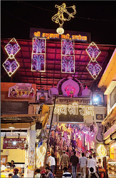
विश्व प्रसिद्ध हनुमानगढ़ी का सजा मुख्य प्रवेश द्वार ।