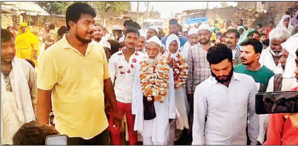
उमरा जाने वाले दंपति को विदाई देते लोग।