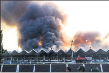
ढाका हवाई अड्डे से उड़ते धुएं के गुबार।

बांग्लादेश नागरिक उड्डयन प्राधिकरण (सीएएबी) ने कहा कि हजरत शाहजलाल अंतरराष्ट्रीय हवाई अड्डे पर दोपहर में आग लग गई, जिसके बाद दो दर्जन से ज्यादा दमकल गाड़ियों को तैनात किया गया और अतिरिक्त टीमें घटनास्थल पर भेजी गईं। अग्निशमन सेवा के प्रवक्ता तल्हा बिन जासिम ने कहा, हमें अपराह्न 2:30 बजे सूचना मिली