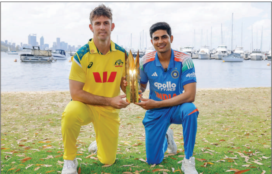
भारतीय कप्तान शुभमन गिल ( दाएं ) और ऑस्ट्रेलियाई कप्तान मिशेल मार्श एकदिवसीय ट्रॉफी के साथ ।

रोहित को अब सिर्फ सीनियर खिलाड़ी के तौर पर टीम में अपनी भूमिका को आत्मसात करना होगा। पिछले दो टी20 और वनडे टूर्नामेंटों को उन्होंने अपनी कप्तानी में टीम को आईसीसी खिताब दिलाये हैं और वह मेलबर्न में आखिरी टेस्ट में भी टीम के कप्तान थे।