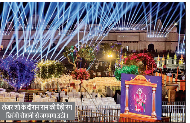
लेजर शो के दौरान राम की पैड़ी रंग बिरंगी रोशनी से जगमगा उठी ।