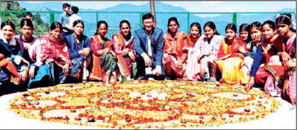
राउमावि बड़ौन में दीपावली उत्सव पर बनाई गई रंगोली के साथ शिक्षक व विद्यार्थी।

चौकन्ने होते हैं। हल्की सी आहट होने पर भी ये उड़ जाते हैं और चक्कर काट-काट के नीचे का सुआयना करते रहते हैं। स्थिति सामान्य होने पर ही बैठते हैं। ये अपना घोंसला पानी से हटकर चट्टानों की दरारों व पेड़ों पर बनाते हैं। पक्षी प्रेमी हर साल इनका बेसब्री से इंतजार करते हैं। सुर्खाब का मुख्य भोजन घास-फूस, जड़, काई, छोटे मेढक, कीड़े-मकोड़े हैं। कानूनी स्थिति पर देखा जाए तो सुर्खाब के शिकार पर पूर्णतः प्रतिबन्ध है। वन्यजीव अधिनियम की धारा 1973 ( 2003 ) से इन्हें पूर्ण संरक्षण प्राप्त है।