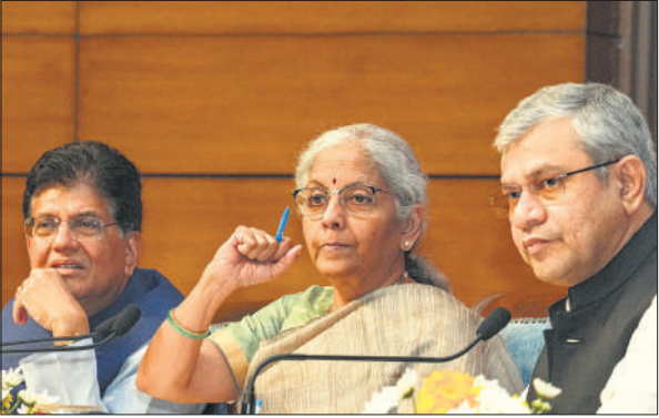
जीएसटी बचत उत्सव के दौरान प्रेसवार्ता में शामिल केंद्रीय वित्त मंत्री निर्मला सीतारमण, उद्योग मंत्री पीयूष गोयल और सूचना एवं प्रसारण मंत्री अश्विनी वैष्णव।

गोयल ने यह भी भरोसा जताया कि अमेरिकी शुल्क के कारण वैश्विक चुनौतियों के बावजूद भारत के निर्यात में सकारात्मक वृद्धि होगी। उन्होंने जीएसटी बचत उत्सव पर आयोजित संवाददाता सम्मेलन में कहा कि भारत के किसानों का, मछुआरों का, भारत के एमएसएमई (सूक्ष्म, लघु एवं मझोले उद्यम) क्षेत्र का, जब तक देश हितों को पूरी तरह से हम संभाल नहीं लेते, तब तक कोई समझौता नहीं हो सकता।