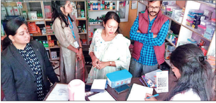
अल्मोड़ा में मेडिकल स्टोरों का निरीक्षण करते औषधि नियंत्रण विभाग के अधिकारी ।● अमृत विचार

कलाकारों ने गणेश स्तुति के साथ सांस्कृतिक कार्यक्रम