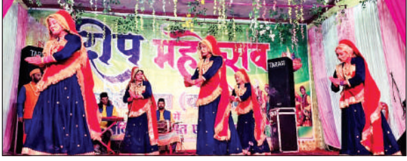
खेतीखान दीप महोत्सव में कार्यक्रम प्रस्तुत करते कलाकार ।● अमृत विचार

कलाकारों ने गणेश स्तुति के साथ सांस्कृतिक कार्यक्रम