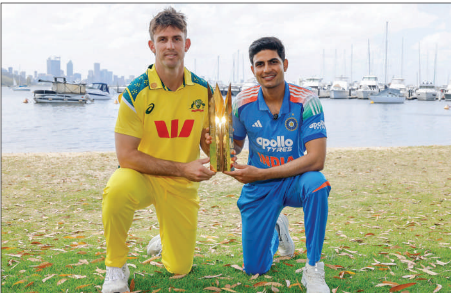
भारतीय कप्तान शुभमन गिल ( दाएं) और ऑस्ट्रेलियाई कप्तान मिशेल मार्श एकदिवसीय ट्रॉफी के साथ।

रोहित को अब सिर्फ सीनियर खिलाड़ी के तौर पर टीम में अपनी भूमिका को आत्मसात करना होगा। पिछले दो टी20 और वनडे टूर्नामेंटों को उन्होंने अपनी कप्तानी में टीम को आईसीसी खिताब दिलाये हैं और वह मेलबर्न में आखिरी टेस्ट में भी टीम के कप्तान थे।