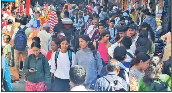
अल्मोड़ा बाजार में शनिवार को धनतेरस पर खरीदारी को उमड़ी लोगों की भीड़ ।

टनकपुर, अमृत विचार : धनतेरस पर्व पर जिले के मैदानी क्षेत्र टनकपुर व बनबसा में जमकर खरीदारी हुई। वहीं चम्पावत और लोहाघाट के बाजारों में भी काफी रौनक रही इस बार भी जिला प्रशासन द्वारा टनकपुर में गांधी मैदान और बनबसा के पूर्णागिरि इंटर कॉलेज में पटाखे की बिक्री के लिए दुकानें निर्धारित की गई हैं। यहां भी लोगों द्वारा जमकर पटाखे खरीदे गए। टनकपुर, बनबसा, चम्पावत, लोहाघाट आदि क्षेत्रों में भी धनतेरस पर लोगों द्वारा खासकर बर्तनों की जमकर खरीदारी की साथ ही खिले बतासे, फल, दिए, मोमबत्ती आदि की भी काफी बिक्री रही। टनकपुर और बनबसा के बाजारों में पड़ोसी देश नेपाल के भी विभिन्न स्थान से यहां खरीदारी के लिए पहुंचे।