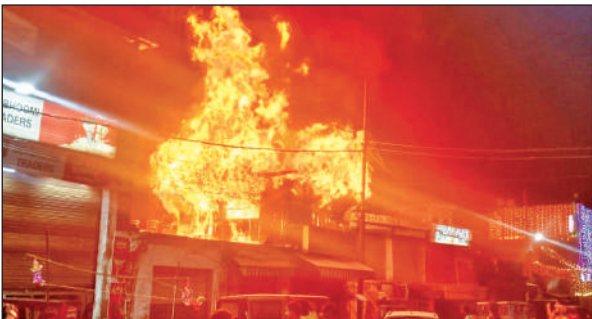
धू-धूकर जलता टीपी नगर स्थित कैफे- 18।