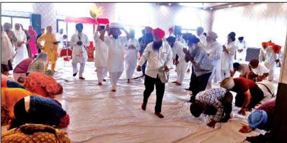
बाजपुर में समागम के पश्चात गुरुग्रंथ साहिब को ले जाने के लिए प्रस्थान करती संगत।