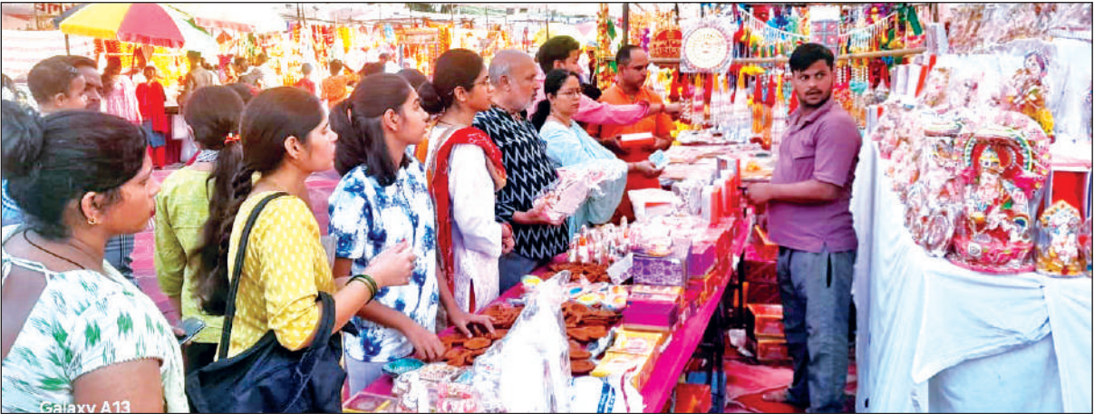
बाजार में खरीदारी करते लोग। ● अमृत विचार

उनका मानना है कि दिवाली की तिथि अक्टूबर के मध्य में पड़ी और सोने व चांदी में जिस प्रकार बेहताशा उछाल हुआ है, वह एक सामान्य परिवार की पहुंच