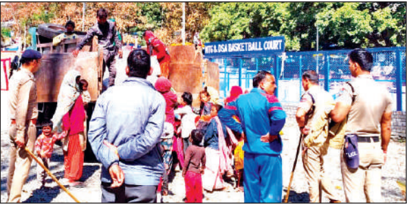
नैनीताल से भिक्षुओं को वापस भेजते पुलिसकर्मी।

हल्द्वानी : मालिकाना अधिकार दिलाने, बागजाला को राजस्व गांव घोषित करने, पंचायत चुनावों में ग्रामीणों का मताधिकार बहाल करने, निर्माण कार्यों पर लगी रोक हटाने, जल जीवन मिशन के चलते क्षतिग्रस्त घरों की मरम्मत कराने, हर घर नल-हर घर जल योजना को पूर्ण कर जलापूर्ति शुरू कराने जैसी मांगों को लेकर बागजाला में चल रहा अनिश्चितकालीन धरना शनिवार को 62वें दिन भी जारी रहा।