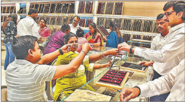
धनतेरस के अवसर पर शुरुूम में आभूषण की खरीदारी करते लोग।

फिक्की-डेलॉयट की रिपोर्ट के मुताबिक, 73% लोग अब किसी भी चीज की जानकारी सबसे पहले ऑनलाइन ही लेते हैं यहां तक की आभूषण के लिए भी। हालांकि 53% ग्राहक अब भी आखिरी खरीदारी