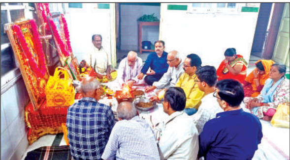
काशीपुर में हवन करते पदाधिकारी।