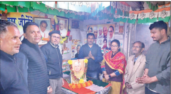
नैनीताल में पूर्व मुख्यमंत्री को श्रद्धांजलि देते कांग्रेसी।