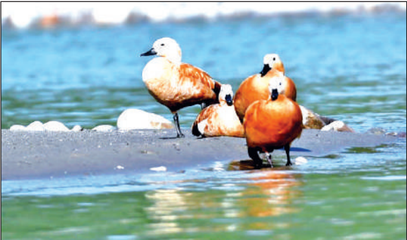
कोसी बैराज में मौजूद सुर्खाब।