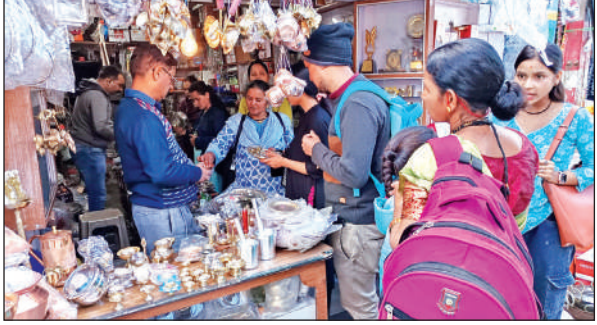
रानीखेत में संजी बर्तनों की दुकान में खरीदारी करते ग्राहक ।