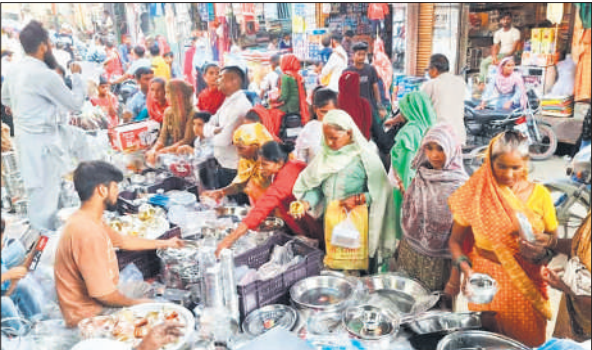
धनतेरस पर बाजारों में उमड़ी भीड़।

संभल जिले को जोड़ने वाले करीब 11 किलोमीटर लंबे जोया संभल मार्ग की हालत खराब हो गई है। खस्ताहाल मार्ग पर सबसे ज्यादा असगरीपुर, कपासी और मालीपुर में समस्या बनी हुई है। स्थानीय लोग लंबे समय से मार्ग की हालत सुधारने की मांग करते