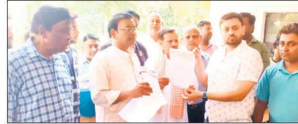
प्रशासनिक अधिकारी को ज्ञापन सौंपते मजदूर संघ के पदाधिकारी। ● अमृत विचार