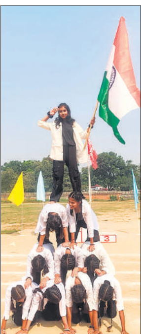
चंदौसी में प्रतियोगिता के समापन पर सांस्कृतिक प्रस्तुति देती छात्राएं।