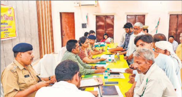
शिकायतों का निस्तारण करते डीएम व एएसपी।