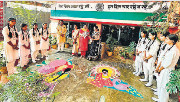
प्रतियोगिता में भाग लेते बच्चे।