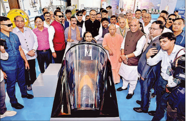
सुपर एलॉय मटेरियल प्लांट्स का लोकार्पण करते राजनाथ सिंह

होंगी। उन्होंने कहा कि मुख्यमंत्री योगी आदित्यनाथ के नेतृत्व में बेहतर कानून-व्यवस्था, स्थिर नीतियां और निवेशक-हितैषी माहौल ने उद्योगों का भरोसा बढ़ाया है। अब निवेशक घबराते नहीं, बल्कि उत्तर प्रदेश को अवसर की भूमि मानते हैं। राजनाथ सिंह ने बताया कि टाइटेनियम और सुपर एलॉय जैसे स्ट्रैटेजिक मटेरियल्स डिफेंस, एयरोस्पेस, इलेक्ट्रॉनिक्स और मेडिकल उपकरणों में अत्यंत महत्वपूर्ण भूमिका निभाते हैं। इनका स्वदेशी उत्पादन भारत को आयात निर्भरता से मुक्त करेगा। उन्होंने कहा कि भारत अब केवल ‘मेक इन इंडिया’ नहीं, बल्कि ‘डिजाइन, डेवलप और डिलीवर इन इंडिया’ के युग में प्रवेश कर