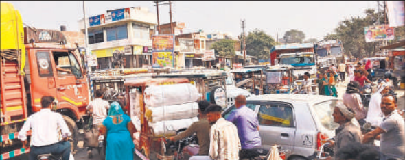
नगर के बाईपास मार्ग पर लगा जाम।