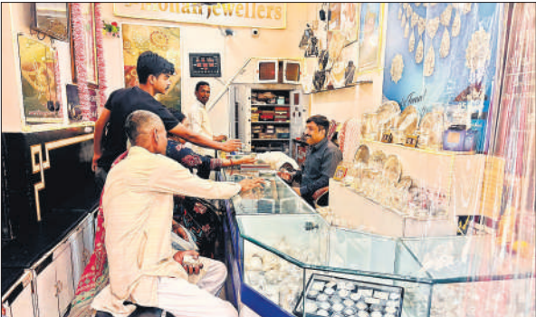
धनतेरस पर ज्वेलर्स की दुकान से खरीदारी करते लोग।

दीपावली को लेकर जिले भर उत्साह का माहौल है। धनतेरस पर बर्तनों व सोने-चांदी की खरीदारी करना शुभ माना जाता है। धनतेरस के दिन सुबह से ही लोग बाजार में खरीदारी के निकल पड़े। आभूषण और बर्तन की दुकानों पर लोगों की भारी भीड़ उमड़ पड़ी। हर कोई धनतेरस के मौके पर कुछ न कुछ खरीद लेना चाहता था। शनिवार को धनतेरस के मौके पर बाजार में खील बताशे की दुकानें भी सज गई थीं। लोगों ने दीपावली के लिए दीपों से