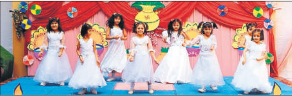
सांस्कृतिक कार्यक्रम प्रस्तुत करती छात्राएं।