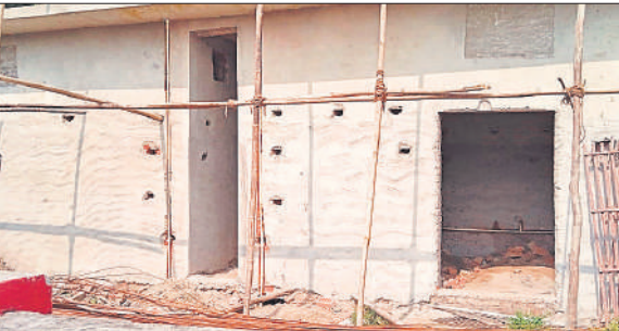
मौ प्लेटफॉर्म एक अधूरा पड़ा शौचालय।

स्थानीय रेलवे स्टेशन ए ग्रेड श्रेणी में आता है। प्लेटफार्म एक, दो और तीन तथा चार व पांच पर शौचालय बना था। इसके अलावा प्लेटफार्म एक पर द्वितीय श्रेणी प्रतीक्षालय और संकुलेटिंग एरिया में पे एंड यूज शौचालय बना था। इसके अलावा संकुलेटिंग एरिया में मूत्रालय बना हुआ था। अमृत योजना के तहत निर्माण कार्य को