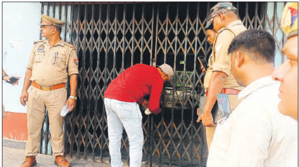
अस्पताल को सील करते कर्मचारी ।

जांच के दौरान मेडिकल स्टोर में फार्मासिस्ट अनुपस्थित पाया गया, जो ड्रग एक्ट के तहत गंभीर के लापरवाही मानी जाती है । इसके