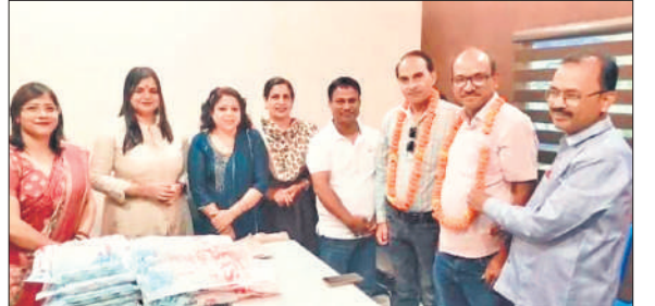
वीआईपी ग्रुप की बैठक में उपस्थित पदाधिकारी एवं सदस्य। ● अमृत विचार