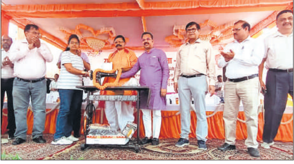
लाभार्थी को सिलाई मशीन देते सदर विधायक और भाजपा जिला अध्यक्ष।