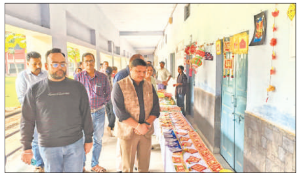
वेस्ट आउट ऑफ वेस्ट' प्रतियोगिता में तैयार की गई वस्तुओं को देखते अतिथि व शिक्षक।

इस अवसर पर बीएड प्रथम वर्ष और डीएलएड प्रथम सेमेस्टर के विद्यार्थियों ने निष्प्रयोज्य सामग्री से घरेलू साज-सज्जा की वस्तुएं और उपयोगी सामान बनाकर अपनी सृजनात्मक प्रतिभा को प्रदर्शन किया। छात्रों ने दीपक, बंधनवार, स्वागत पट्टिकाएं और कलश आदि का निर्माण कर