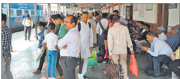
दीपावली को लेकर स्टेशन पर यात्रियों की भीड़।

रेलवे स्टेशन पर शनिवार की दोपहर 12 बजे दीपावली और छठ पूजा पर घर जाने वालों यात्रियों की भीड़ प्लेटफार्म एक पर जमा होने लगी। धीरे-धीरे भीड़ बढ़ती गयी। डाउन लाइन की राज्यरानी एक्सप्रेस में पहले से भीड़ थी। ट्रेन के रुकते ही यात्री जनरल कोच में घुसने लगे। इसके बाद डाउन लाइन की त्रिवेणी