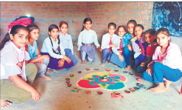
रंगोली बनाकर दीपावली का पर्व मनाती छात्राएं।

घटना के बाद परिजन और आसपास के लोग तुरंत उन्हें शाम 6 बजे सीएचसी कलान ले गए। प्राथमिक उपचार के बाद सभी घायलों को गंभीर स्थिति को देखते हुए आगे के इलाज के लिए बदायूं जिला अस्पताल भेजा गया। पुलिस ने मौके का निरीक्षण किया और घायलों की स्थिति जानी।