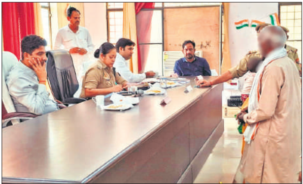
जलालाबाद तहसील में सम्पूर्ण समाधान दिवस के दौरान जन समस्याएं सुनते एडीएम व एएसपी ग्रामीण ।