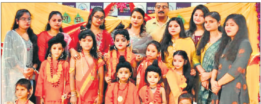
रामायण नाटिका के दौरान भागवान राम, लक्ष्मण आदि के स्वरूप बने बच्चे।