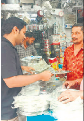
दुकान से बर्तन की खरीदारी करते लोग।