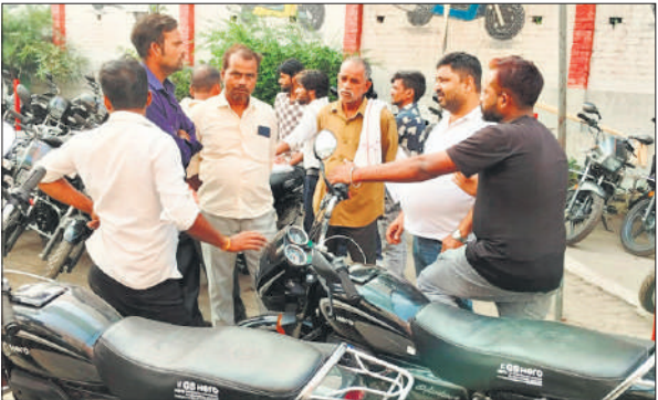
जीएससी एजेंसी पर बाइक देखते ग्राहक।

सदर विधायक आमजन से स्वदेशी को अपनाने के लिए आह्वान किया। कहा कि स्वदेशी उत्पादों में भारत के लोगों का पसीना व मिट्टी की खुशबू है। भाजपा जिलाध्यक्ष