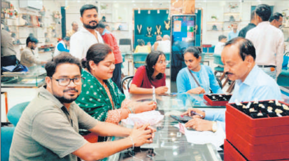
प्रतिष्ठान पर ज्वेलरी की खरीदारी करते लोग।

कार्तिक माह की कृष्ण पक्ष की त्रयोदशी तिथि पर ऐश्वर्य, धन, आरोग्य और सौभाग्य की वृद्धि के लिए लोगों ने लक्ष्मी-गणेश और धन्वंतरि भगवान की पूजा की। पूजा के बाद बड़ी संख्या में लोग बाजार पहुंचे और परंपरा के अनुसार बर्तन, सोना, चांदी, वाहन, इलेक्ट्रॉनिक्स सामान, झाड़ू, दीये, मोमबत्तियां, खील, खिलौने आदि की खरीदारी की। बहादुरगंज, सदर बाजार, चौक मंडी और जलालनगर बाजार में