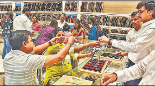
धनतेरस के अवसर पर शोरूम में आभूषण की खरीदारी करते लोग।

देश में आभूषणों की खरीदारी का तरीका तेजी से बदल रहा है। पहले लोग आभूषण खरीदने सुनार के पास जाते थे, लेकिन अब यह ऑनलाइन हो रहा है। भारत में सोने और हीरे से लोगों का पुराना जुड़ाव है। अब इस क्षेत्र में डिजिटल बाजार की पैठ तेजी से बढ़ रही है। ऑनलाइन मंच पर हॉलमार्क प्रमाणन, ब्रांड की गारंटी और बेहतर सर्विस के कारण लोग ऑनलाइन गहने खरीदने में भरोसा दिखा रहे हैं।