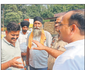
नायब तहसीलदार से बात करते किसान

● धरने पर बैठे किसानों को अधिकारियों ने मनाया