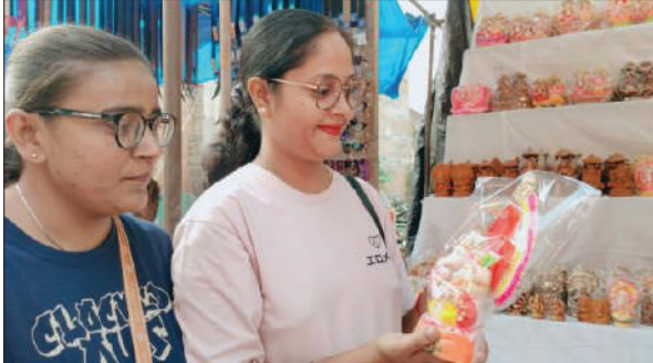
भगवान गणेश की मूर्ति देखती महिला।

सबसे ज्यादा बिके। पूजा सामग्री और पूजा बर्तनों की भी खरीदारों में उत्सुकता रही। इलेक्ट्रॉनिक्स उत्पादों में एलईडी, फ्रिज, वॉशिंग मशीन, मिक्सर ग्राइंडर, एसी और हीटर की जबरदस्त बिक्री हुई। बताया जा रहा है कि जिले में लगभग 40 करोड़ रुपये का कारोबार हुआ है।