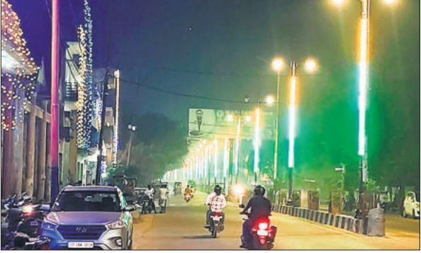
रोशनी से नहाया संभल मुरादाबाद मुख्य मार्ग।

बढ़ गई। पुरानी तहसील रोड, टंडन तिराहा, डाकखाना रोड, कोतवाली के सामने, ठेर बाजार