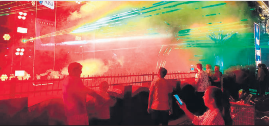
पीएसी में आयोजित लेजर शो का अद्भुत नजारा देखते लोग।

छोटी दीपावली के दिन सुबह से ही बाजार में दीवाली की खरीदारी के लिए लोग जुटे। सोने चांदी, कपड़े, खाने पीने की सामग्री की अलावा, मिष्ठान व उपहार की दुकानों पर जमकर भीड़ रही। ब्रांडेड शोरूम