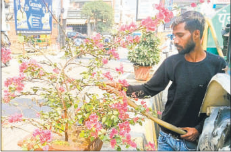
सफाई करते नगर निगम के कर्मचारी।