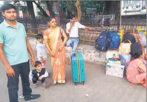
रोडवेज बस अड्डे के बाहर घर जाने के लिए खड़े यात्री । ● अमृत विचार

धनतरस के बाद से ही पांच दिवसीय पर्व का आगाज हो गया है। शनिवार और रविवार को कई स्थानों पर धनतरस मनाई गई। जबकि कई स्थानों पर रविवार को छोटी दिपावली मनाई गई। रविवार को अवकाश होने के कारण लोग सुबह से ही घरों की ओर रुख करने लगे थे। दिपावली को लेकर रेलवे स्टेशनों पर भारी भीड़ है। यहां तक कि ट्रेनों में चढ़ने के लिए लोगों