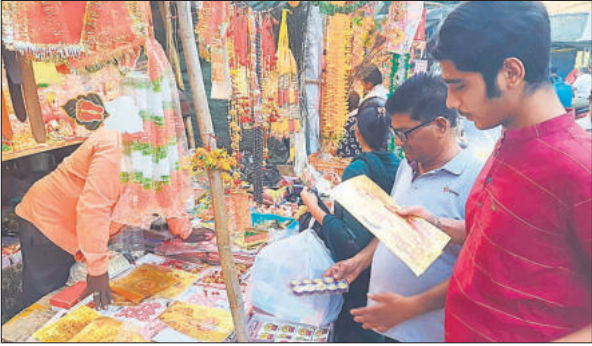
बाजार में दुकान पर झालर खरीदते लोग ।

लोगों ने घरेलू और पूजा का सामान खरीदा, घरों की सफाई कर रंग बिरंगी झालरें लगाईं