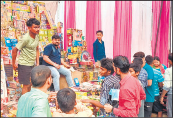
बहजोई में आतिशबाजी की खरीदारी करते लोग।

● लोगों ने जमकर खरीदी आतिशबाजी, दीपक, मूर्तियां मिठाई की खरीदारी