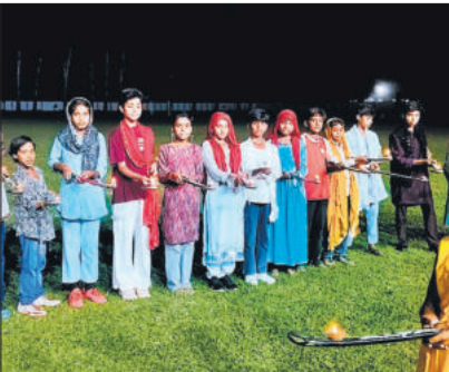
हॉकी पर दीप जलाते खिलाड़ी।

न मारामारी तक कर दी। इसके अलावा लोगों ने बसों का सहारा तक न लिया। बसों और ट्रैन में लोगों ने डालतककर सफर किया। ट्रैन में भीड़ अधिक होने के कारण यात्री गेट तक पर जान जोखिम में डालकर सफर कर रहे हैं। हर किसी को घर जल्दी पहुंचने की जल्दी रही। डग्गामार वाहनों में लोगों ने डालिया सफर : मुरादाबाद, मिलक और दलपतपुर तक जाने वाले