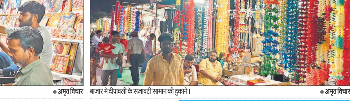
● अमृत विचार

पटाखे व आतिशबाजी की जमकर खरीदारी की। देर रात्रि तक खरीदारी करने को लेकर खासा उत्साह नजर आया। मिठाइयों की दुकान पर भी मिठाइयां खरीदने वालों का तांता लगा रहा।