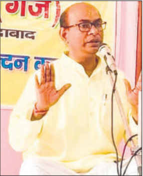
जानकारी देते आर्य समाज के वक्ता।

हजार रानियां रखने का भी कलंक लगा जो सत्यपरक नहीं है ,पति शब्द की व्यापकता को न मानकर उसे संकुचित अर्थों में प्रसारित किया गया जिससे श्रीकृष्ण जैसे