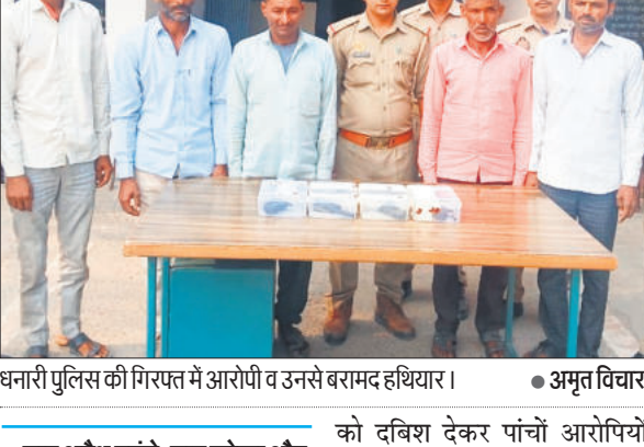
धनारी पुलिस की गिरफ्त में आरोपी व उनसे बरामद हथियार।