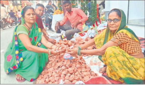
मिस्टनगंज बाजार में दीये खरीदती महिलाएं।

शहर में चार स्थानों पर पटाखों को दुकानें लगाई हैं। तीन दिन पहले से ही दुकानों को लगाने का काम तेजी से चल रहा है। रिविचर को बहुत से लोग ने एक दिन पहले ही पटाखों की दुकानों पर जाकर अपने मजपसन्द बम और अनार खरीदे। गांधी समाधि के पास, चीनी मिल के पास, ज्वालानगमर, कोसी मंदिर रोड पर पटाखों की दुकानें लगाई गई हैं। दुकानदारों को सरकारी गाइडलाइन का पालन करने के निर्देश दिए गए हैं। जबकि पुलिस टीमों को भी तेनात जिला दिया है। वहीं, दमकल विभाग की ओर से किले में 475 अस्थायी दुकानों को लाल सेब दिया गया है।