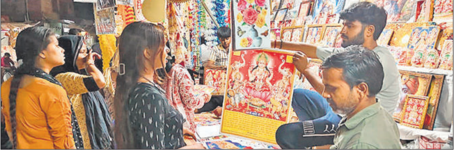
दीपावली पूजन के लिए लक्ष्मी जी की तस्वीर खरीदती महिलाएं व युवतियां।