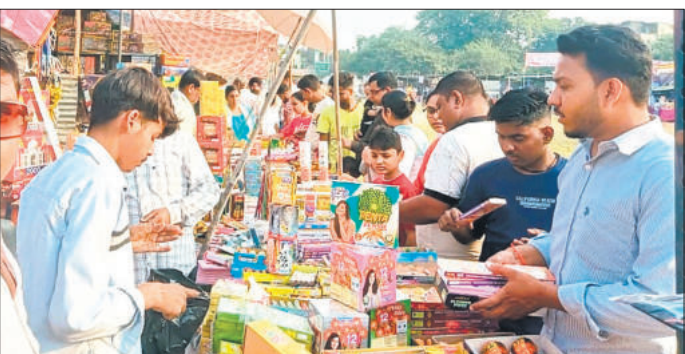
पटाखा बाजार में लगी दुकान से पटाखे खरीदते लोग।

बच्चे भी त्योहार को लेकर करीब महीने भर से उत्साहित थे। लिहाजा त्योहार को भुनाने के लिए पहले ही बड़ी तादात में आतिशबाजी का अपने गोदामों पर स्टॉक कर लिया था। जिसमें अधिक दुकानों ने निर्धारित स्थानों पर ही आतिशबाजी की दुकानें लगा रखी है। इसके बाद दुकानदारों ने तेज धमाकेदार