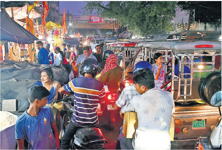
● अमृत विचार