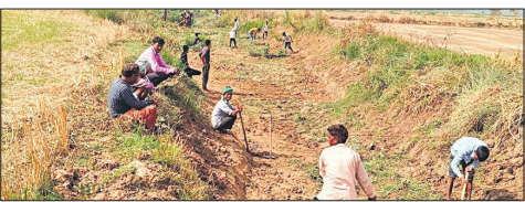
एक गांव में तालाब की खुदाई करते श्रमिक।