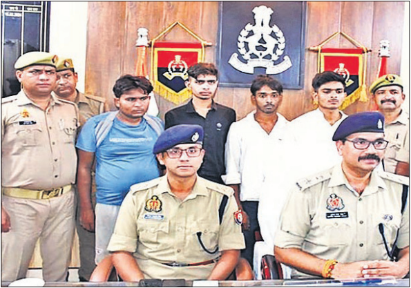
पुलिस हिरासत में आरोपी और जानकारी देते अफसर।