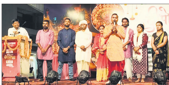
नगर निगम के स्वदेशी मेले में प्रस्तुति देते कलाकार।