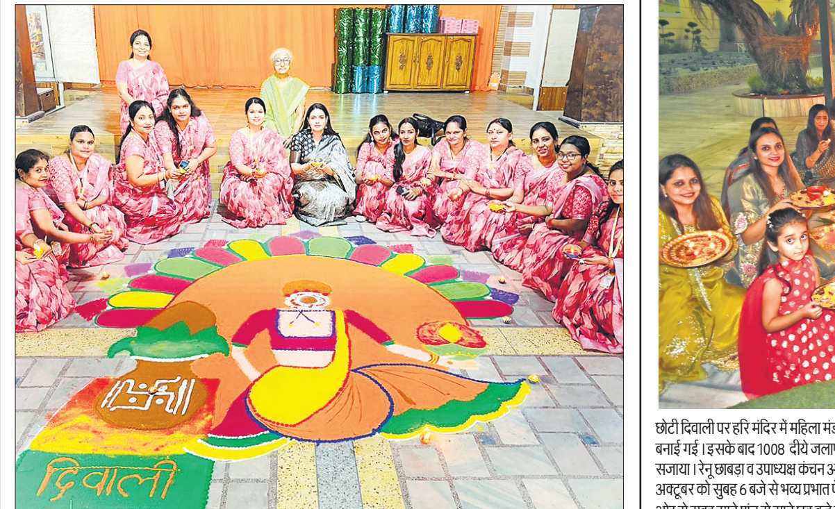
एसएसबी इंटर कॉलेज में दीपोत्सव मनाती प्रेम सुरेश फाउंडेशन की महिला सदस्य।