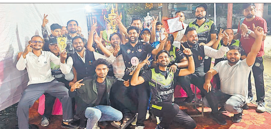
बार एसोसिएशन प्रीमियर लीग ट्रॉफी के साथ विजेता टीम के खिलाड़ी।