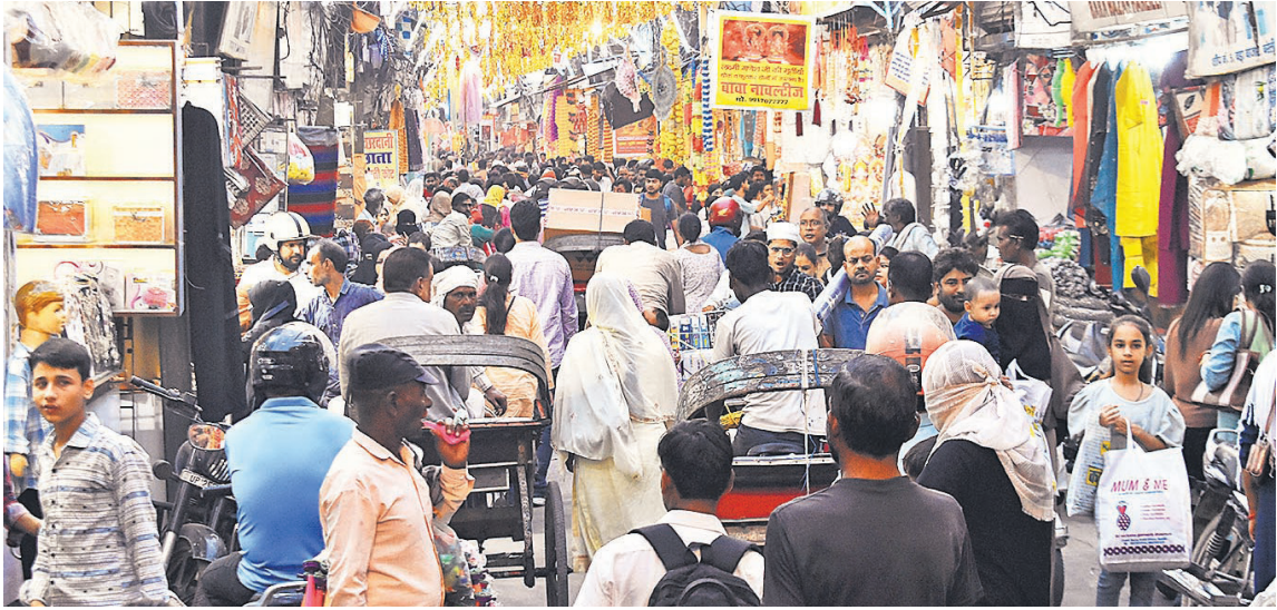
दिवाली के चलते बड़ा बाजार, शहामतगंज आदि स्थानों पर ग्राहकों की भीड़ उमड़ी। इसकी वजह से बाजार में पूरे दिन जाम के हालात बने रहे। वाहन चालकों और पैदल राहगीरों को परेशानी से जूझना पड़ा।