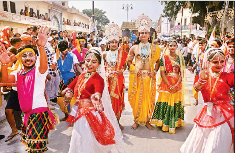
लोकनृत्य के बीच सीता राम व लक्ष्मण के स्वरूप ।