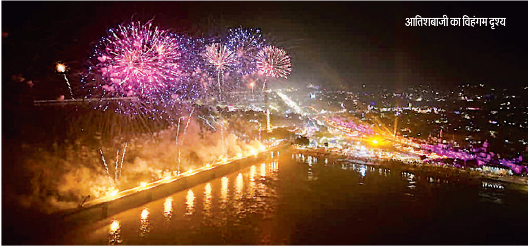
आतिशबाजी का विहंगम दृश्य