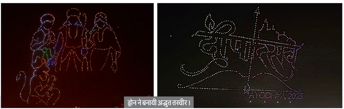
झोन ने बनायी अद्भुत तस्वीर।