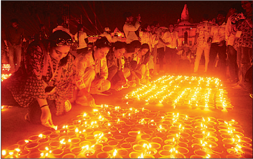
राम की पैड़ी पर दीप प्रज्ज्वलित करते स्वयंसेवक।

अमृत विचार : दीपों की अनगिनत पंक्तियों से सजी अयोध्या रविवार की शाम ऐसे आलोकित हुई, मानो स्वयं त्रेता युग धरती पर उतर आया हो। लंका विजय कर चौदह साल बाद पुष्पक विमान से लौटने जैसा दृश्य आसमान में हेलीकाप्टर की गड़गड़ाहट से साकार हुआ। मुख्यमंत्री योगी आदित्यनाथ ने वैदिक मंत्रोच्चार और पुष्पवर्षा के बीच प्रभु श्रीराम, माता सीता और लक्ष्मण के राज्याभिषेक का प्रतीकात्मक अनुष्ठान किया। जैसे ही योगी ने प्रभु श्रीराम का रथ खींचा, पूरा पार्क जय श्रीराम के नारों से गुंज उठा।