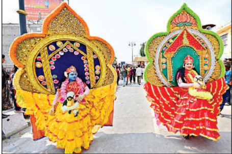
अयोध्या की सड़कों पर निकाली गई झांकी में देश के कोने-कोने से आए कलाकारों ने लिया हिस्सा।