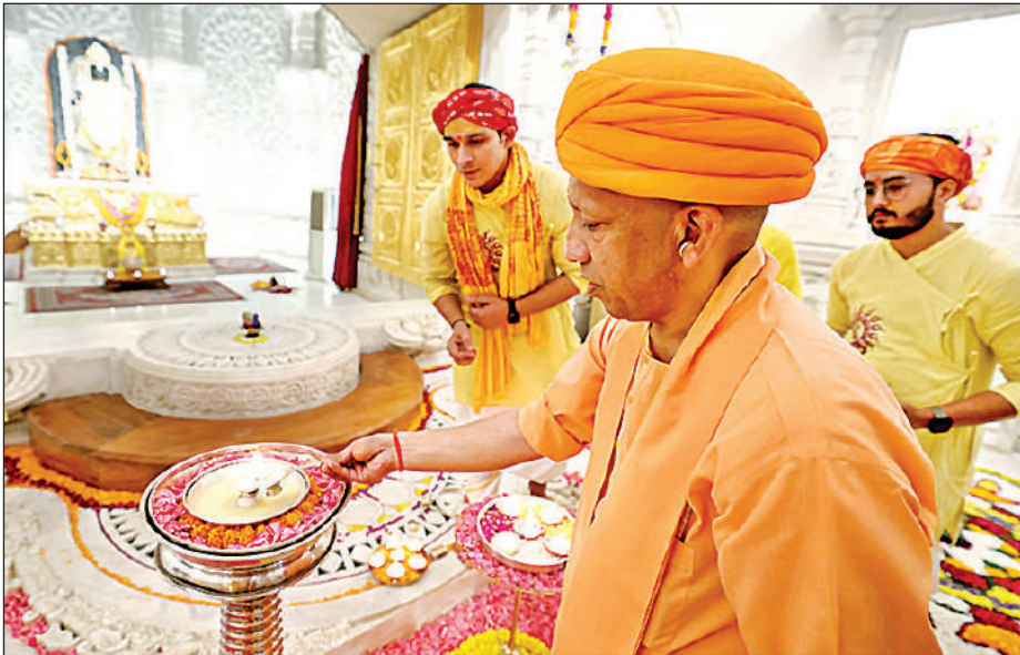
रामलला के समक्ष दीप प्रज्ज्वलित कर दीपोत्सव का आगाज करते मुख्यमंत्री योगी आदित्यनाथ।

बोले, मुख्यमंत्री, कहा- यही नया भारत है, जो आस्था, अस्मिता और विकास तीनों में आत्मविश्वास से जगमगा रहा है