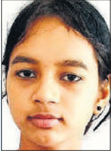
भावना मेव एडिटरिटर

स्कूलों में यह असमानता अक्सर सूक्ष्म रूप में ही दिखाई देती है, पर असर बहुत बड़ा होता है। बच्चों का अलग बैठना, शौचालय और