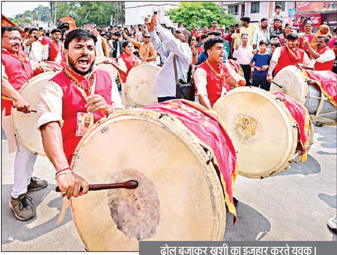
ढोल बजाकर खुशी का झुंझार करते युवक।

सूचना विभाग, अयोध्या प्राधिकरण और पर्यटन विभाग की झांकियों में योगी सरकार की विकास गाथा भी सजीव रूप में प्रदर्शित हुई। डिफेंस कॉरिडोर, काशी कॉरिडोर, पीएम आवास योजना, बेंटी बचाओ-बेंटी पढ़ाओ, आत्मनिर्भर नारी और स्वच्छ हरित उत्तर प्रदेश जैसी योजनाओं की झलक ने आधुनिक राम राज्य का चित्र खींच दिया। यहीं अयोध्या मॉडल अब विश्व के लिए प्रेरणा बन गया है।