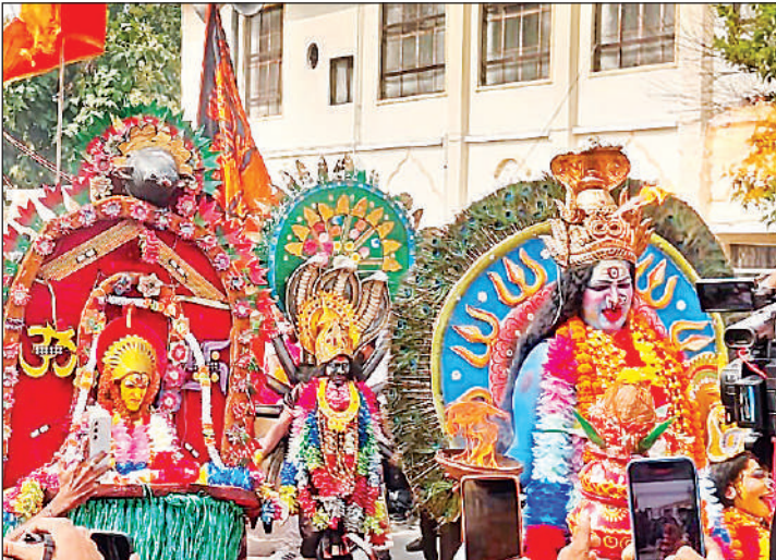
झांकियों के दौरान मां काली के स्वरूप में महिला कलाकार ।