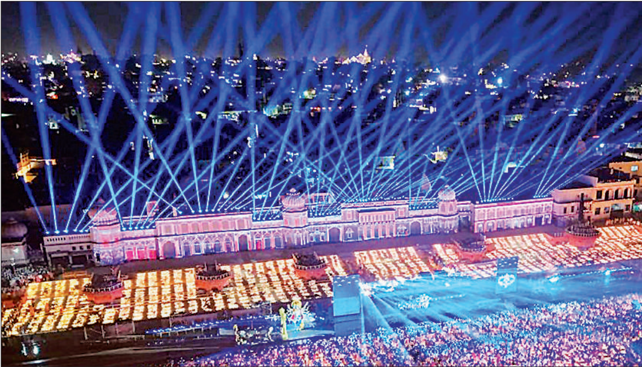
दीपोत्सव-2005 कार्यक्रम के तहत लाखों दीयों की जगमगाहट से रोशन रामनगरी।