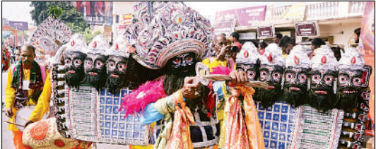
रावण के स्वरूप में कलाकार ।

शोभायात्रा में सभी झांकियों के आगे विभिन्न प्रदेशों से आए 500 कलाकार लोक नृत्य के माध्यम से लोगों को आकर्षित कर रहे थे। मां काली का रोद्र रूप धरे आंध्र प्रदेश के कलाकार, राजस्थान की कलश यात्रा के वया कहने, तो वहीं फरवाही गुप ऑफ अवध के कलाकारों द्वारा प्रस्तुत फरवाही नृत्य लोगों को आनंदित कर रहा था। मध्य प्रदेश के कलाकारों द्वारा बघाई गायन, झारखंड, बिहार व महाराष्ट्र के कलाकारों का लोकनृत्य, गाजीपुर का डोडिया नृत्य, सोनभद्र का गरबा नृत्य, गोरखपुर का फरवाही, केरल का कथक कली, पंजाब का भांगड़ा, मथुरा का मयूर नृत्य, सोनभद्र का आदिवासी घूमर नृत्य, राजस्थान का चकरी व घोड़ी नृत्य, गाजीपुर का धोबिया नृत्य व बंगाल के कलाकारों द्वारा डोलक-मजोरा पर संकीर्तन जैसे अन्य लोकनृत्य कार्यक्रम की छटा को बढ़ा रहे थे।