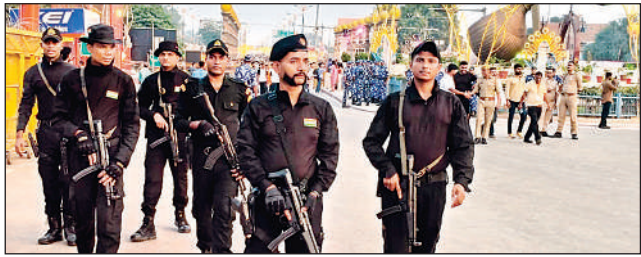
लता चौक के पास तैनात एटीएस के कर्माओं ।

रामकथा पार्क, हनुमानगढ़ी, दशरथ महल, बिरला मंदिर, तुलसी उद्यान और सरयू ब्रिज को रंग-बिरंगी लाइटिंग से सजाया गया। धर्मपथ पर 30 डिजिटल स्तंभ लगाए गए, जो रामायण के प्रसंगों को उड़ी प्रोजेक्शन से प्रदर्शित कर रहे हैं। इसके अलावा, झोन शो और लाइट एंड साउंड शो ने आकाश को रामपथ बना दिया। अयोध्या की गलियां भी दीप आकार की लाइटों से सजी हुई हैं। राम मंदिर परिसर से लेकर सरयू तट तक हर कोना आध्यात्मिक आभा से दमक रहा है।