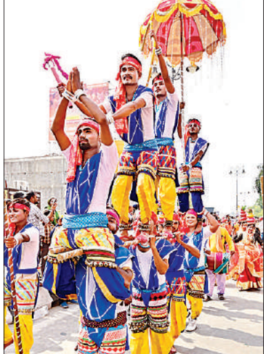
लोकनृत्य करते कलाकार ।