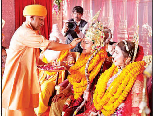
रामकथा पार्क में प्रभु श्रीराम का राजतिलक करते मुख्यमंत्री योगी।

मुख्यमंत्री योगी आदित्यनाथ दीपोत्सव के भव्य आयोजन के दौरान राम कथा पार्क में उन्होंने राम भक्तों के संकल्प से अयोध्या में भव्य राम मंदिर निर्माण का कार्य संपन्न होने की बात कहते हुए कहा कि आज आस्था को कोई राजनीति कैद नहीं कर सकती है। मंच से संबोधन में बताया कि प्रभु श्री राम को काल्पनिक कहने वाले लोग किस-किस प्रकार के शब्दों का इस्तेमाल करते थेज कभी राम के अस्तित्व पर ही प्रश्न चिन्ह खड़ा करते थे। उन्होंने कहा कि यह वही लोग हैं जो कभी एक आक्रांता की कब्र पर जाकर की सज्जदा करते हैं और फिर भारत की आस्था को अपमानित करने में कोई भी कसर नहीं छोड़ते हैं। कहा कि जिन्होंने राम मंदिर आंदोलन के दौरान मंदिर का निर्माण ना हो इसके लिए न्यायालय में अपने अधिवक्ता को अलग से विरोध में खड़े किए थे। जहां इन लोगों ने राम भक्तों पर गोली चलाई वहीं हम अयोध्या में दीप जला रहे हैं। उन्होंने कहा कि पूर्ववर्ती सरकार ने अयोध्या की पहचान को मिटाकर फैजाबाद बनाया था। वहीं हम लोगों ने यहां की पहचान को अयोध्या के साथ जोड़ करके फिर से अयोध्या धाम बनाने के साथ जुड़े।