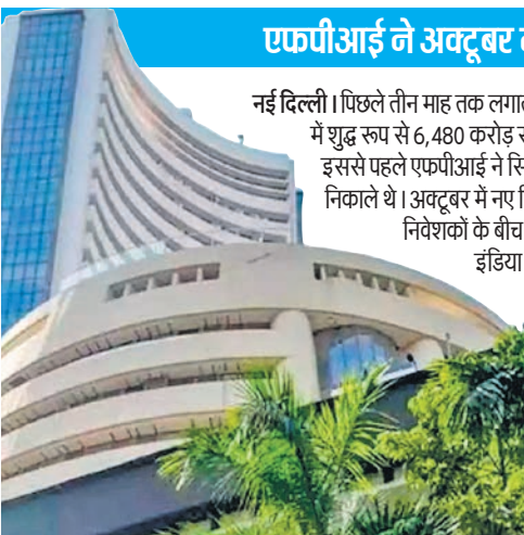
एफपीआई ने अक्टूबर में अबतक भारतीय शेयर बाजार में 6,480 करोड़ रुपये डाले