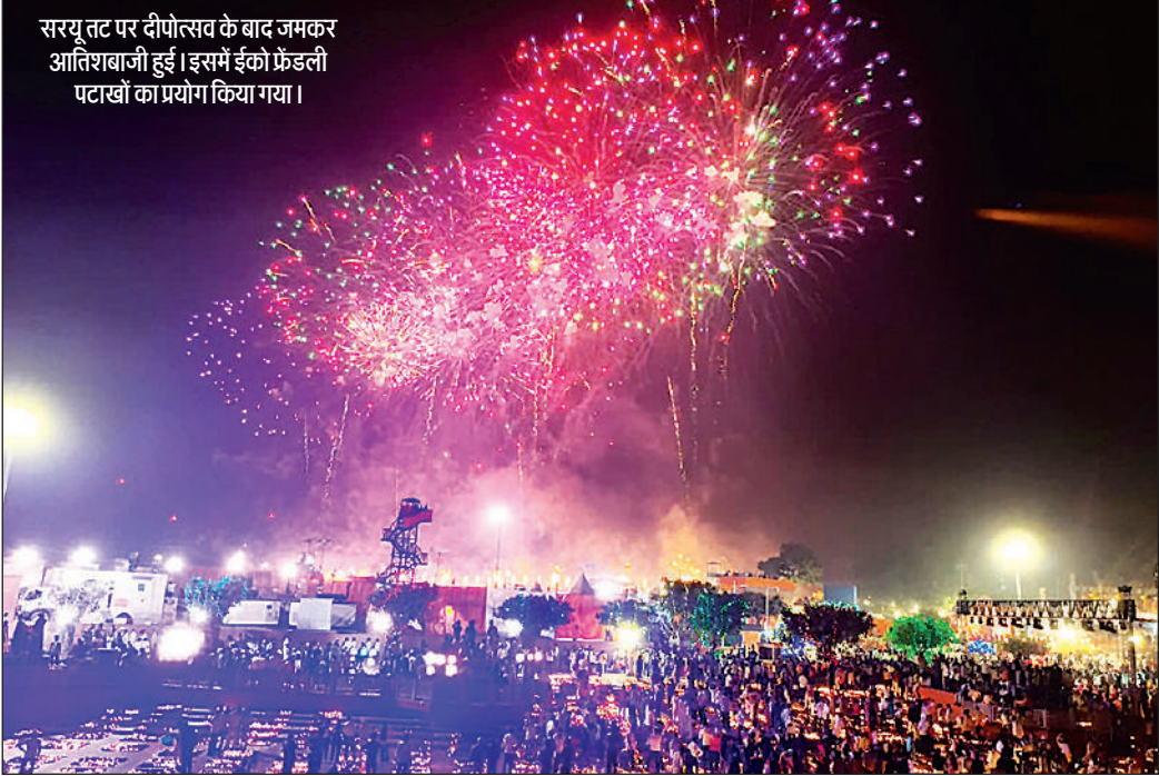
सरयू तट पर दीपोत्सव के बाद जमकर आतिशबाजी हुई। इसमें ईंको फ्रेंडली पटाखों का प्रयोग किया गया।