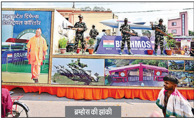
ब्रम्होस की झांकी