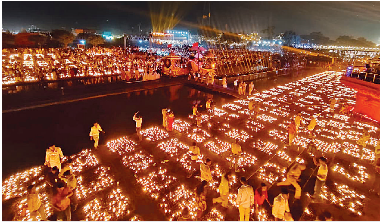
राम की पैड़ी पर दीप प्रज्ज्वलित करते स्वयंसेवक। इस दौरान विद्यार्थियों में काफी उत्साह दिखा।