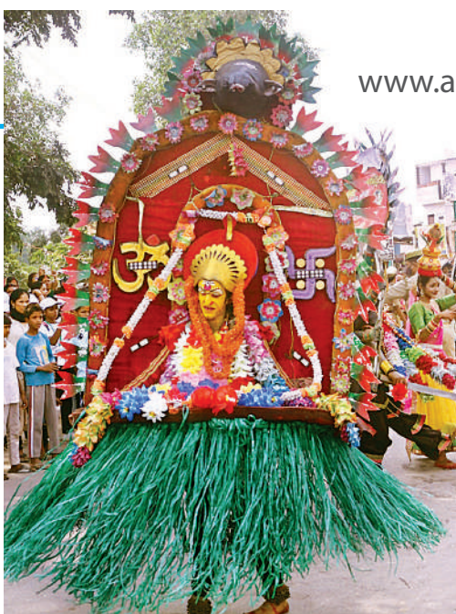
केरल का कथक कली नृत्य प्रस्तुत करता कलाकार ।