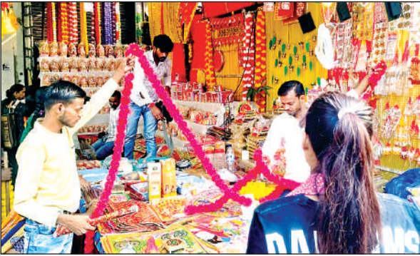
गणेश लक्ष्मी व सजावट का सामान खरीदते लोग।

●घरों से लेकर सरकारी कार्यालय में सजावट की गई ●गणेश- लक्ष्मी की पूजा होते ही जमकर हुई आतिशबाजी