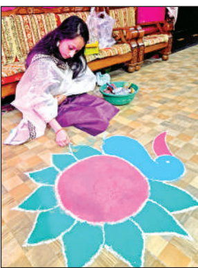
मां लक्ष्मी के स्वागत में रंगोली सजाई।

प्रतिष्ठानों में पूजन-अर्चन किया। विधि-विधान के साथ मां लक्ष्मी और गणेश की आराधना की गई। उन्हें