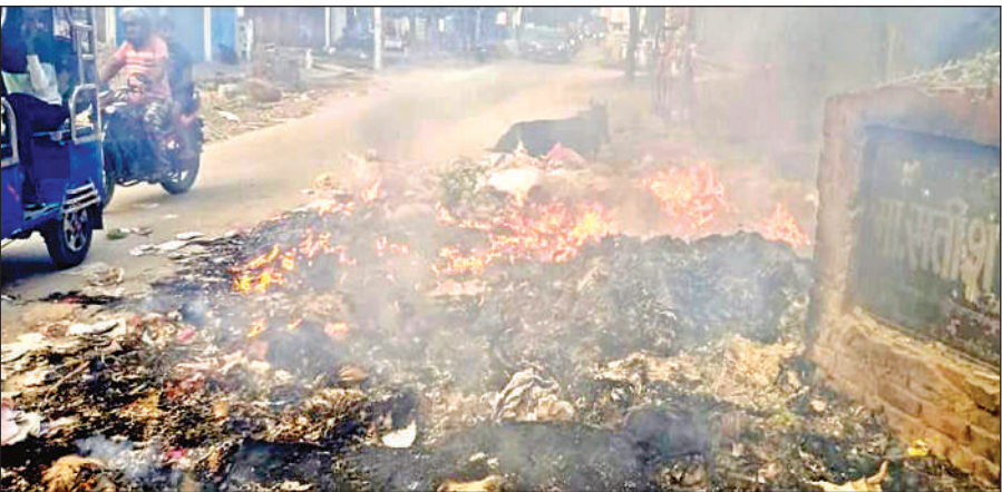
कूड़े में लगाई गई आग।

कानपुर। सड़क निर्माण और मरम्मत के एस्टीमेट में गड़बड़ी होने की शिकायतें अब लोक निर्माण विभाग नहीं कर सकेगा। क्योंकि अब किसी भी सड़क परियोजना के लिए बजट जारी करने से पहले शासन की टीम स्वतंत्र जांच करेगी। जब तक संतोषजनक परिणाम नहीं मिलेगा, तब तक बजट स्वीकृत नहीं होगा। शासन ने लोक निर्माण विभाग को स्पष्ट निर्देश दिए हैं कि बिना जांच के कोई भी एस्टीमेट पास नहीं किया जाएगा। यदि जांच में एस्टीमेट वास्तविक आवश्यकता से अधिक मिलता है तो अभियंता की जांच की जाएगी।