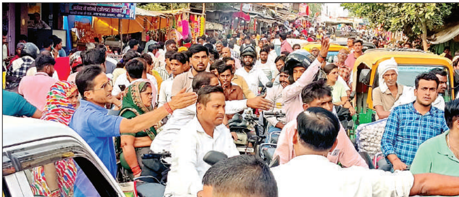
त्योहार के चलते पर बाजार में लगा जाम।