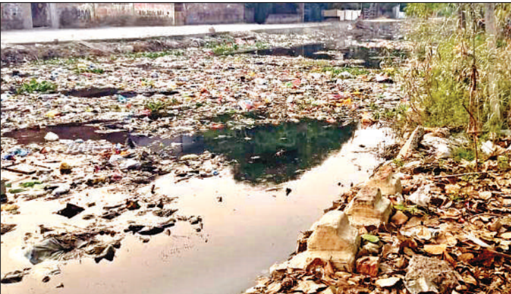
सचान चौराहा नहर कूड़े से पटी है।