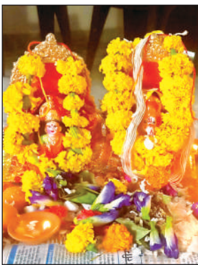
घर-घर हुई गणेश-लक्ष्मी की पूजा।

बजकर 35 मिनट तक का शुभ काल रहा। शुभ मुहूर्त के अनुसार लोगों ने घरों और व्यावसायिक