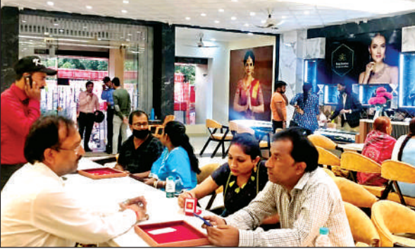
पंवरत्ना ज्वेलर्स में मौजूद ग्राहक।

कानपुर। दीपावली एवं छठ पूजा पर यात्रियों की भारी भीड़ के चलते निजी लग्जरी एसी बसों का किराया कई गुना बढ़ गया है। हालत ये है कि दिल्ली से कानपुर के लिए निजी एसी बसों का किराया 2500 रुपये तक पहुंच चुका है। दरअसल निजी ट्रैवलर्स एजेंसियों के बस बुकिंग वेबसाइट्स के अनुसार बीते 18 अक्टूबर से 22 अक्टूबर 2025 तक यात्रियों का भारी दबाव है जिससे निजी एसी बसें दिल्ली से कानपुर के लिए सीधे मुंह मांगा किराये पर सवारी बिठा रही हैं। नोएडा से कानपुर आने वाली वातानुकूलित निजी बस का किराया औसतन 2500 रुपये तक पहुंच गया है जबकि आम दिनों में यही किराया केवल 800 से 1200 रुपये के बीच रहता है। ऐसी संभावना जताई जा रही है कि यात्रियों की भीड़ को देखते हुए निजी एसी बसें छोट पूजा तक इसी तरह फुल होकर चलेगीं।