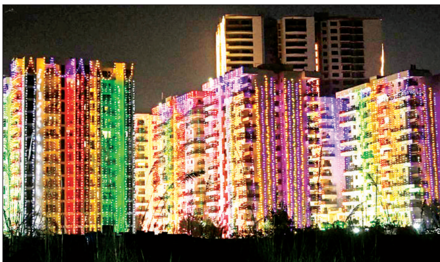
शहर की बहमंजिला इमारतें लाइटों से जगमगाती रहीं।