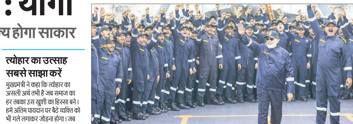
आईएनएस विक्रांत पर आयोजित दीपावली उत्सव में नौसैनिकों के साथ प्रधानमंत्री नरेंद्र मोदी।

पणजी, एजेंसी प्रधानमंत्री नरेन्द्र मोदी ने सोमवार को कहा कि ऑपरेशन सिंदूर के दौरान नौसेना के खौफ, वायु सेना के असाधारण कौशल, थल सेना की वीरता और तीनों सशस्त्र बलों के बीच असाधारण समन्वय ने पाकिस्तान को घुटने टेकने पर मजबूर कर दिया। गाँवा तट पर आईएनएस विक्रांत पर नौसेना कर्मियों से उन्होंने कहा कि स्वदेश में निर्मित विमानवाहक पोत आत्मनिर्भर भारत का शक्तिशाली प्रतीक है और इसे नौसेना को सौंपने से एक प्रमुख औपनिवेशिक विरासत को त्याग दिया गया। कुछ महीने पहले हमने देखा था कि कैसे आईएनएस विक्रांत ने पाकिस्तान की रातों की नींद उड़ा दी थी। आईएनएस विक्रांत, इसका नाम ही दुश्मन के दुस्साहस का अंत कर देता है। मोदी ने आईएनएस विक्रांत पर एक रात बिताई और कोचीन शिपयार्ड में निर्मित विमानवाहक पोत पर मिंग 27 विमानों के कौशल