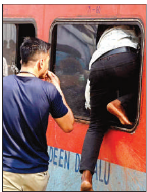
ट्रेन की खिड़की से अंदर घुसे।

ट्रेनों के माध्यम से आगामी 2 माह में 650 फेरे लगाए जाएंगे। उन्होंने बताया कि अक्टूबर माह में 374 फेरे एवं नवंबर में 276 फेरे लगाए जाएंगे। इसके अतिरिक्त, अन्य जोनों से संचालित लगभग 100 से अधिक ट्रेनें कानपुर समेत विभिन्न मंडलों से होकर गुजरेंगी जिससे यात्रियों को पर्याप्त यात्रा विकल्प मिल सके। उन्होंने बताया कि प्रमुख स्टेशनों