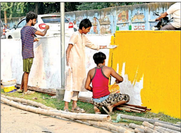
अर्मापुर नहर पर रंगरोगन हो रहा है।

अमृत विचार। दीपावली के बाद आने वाला छठ पर्व 25 अक्टूबर से नहाय खाय से शुरू होगा। इस दिन स्नान करने के बाद कुल की देवी और सूर्य देव की पूजा करने का विधान है। 26 को खरना, 27 को संध्या व 28 को उगते सूर्य को अर्घ्य दिया जाएगा।