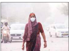
● 31 क्षेत्रों में हवा का स्तर बहुत खराब, तीन पर गंभीर

31 केंद्रों ने वायु गुणवत्ता को बहुत खराब श्रेणी में बताया, जिसमें एक्यूआई का स्तर 300 से ऊपर था, जबकि तीन स्टेशनों आनंद विहार (402), वजीरपुर (423) और शर्मा नगर (414) में प्रदूषण 'गंभीर' श्रेणी में रहा। मंगलवार और बुधवार को वायु गुणवत्ता और अधिक खराब हो सकती है।