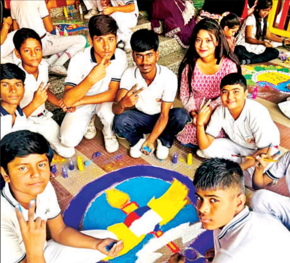
मनोरमा एजुकेशन सेंटर में बच्चों ने दिवाली मनाई।