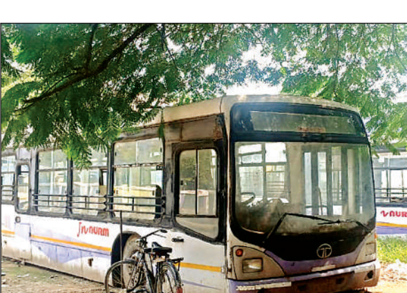
कंडम हो गई सीएनजी सिटी बसें।

अमृत विचार। शहरवासियों के लिए बीते 15 वर्षों तक संसाधन मुहैया करा रही सीएनजी सिटी बसों का काम खत्म हो गया। अब सभी सीएनजी चालित सिटी बसों को फजलगंज सिटी बस डिपो में डंप कर दिया गया है और संचालन से जुड़े अधिकारियों एवं कर्मियों की हमेशा के लिए छुट्टी कर दी गयी है। फजलगंज स्थित सीएनजी सिटी बस डिपो के मुख्य गेट पर ताला लगा दिया गया है और एक नोटिस चस्पा कर दी गई है जिसमें ये कहा गया है कि सीएनजी चालित सिटी बसों का संचालन बंद किया जा रहा क्योंकि इनकी उम्र पूरी हो चुकी है और इनका परमिट, आरसी अवैध हो चुकी हैं। ऐसे में इन्हें रूट पर नहीं