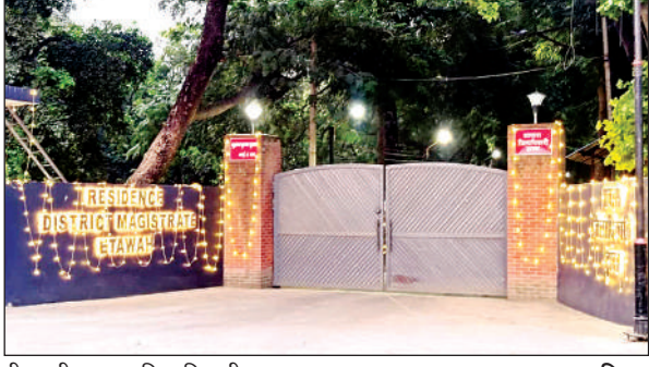
दीपावली पर सजा जिलाधिकारी आवास।

रंग बिरंगी रोशनी से नहायी शहर, कस्बे और गांव की इमारतें, बच्चों और बड़ों ने जमकर छुड़ाये पटाखे, मनाई खुशियां