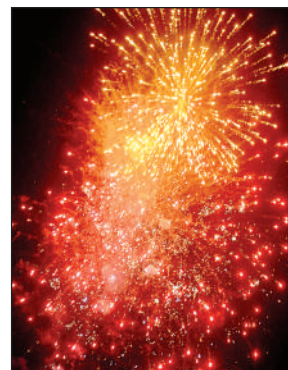
आतिशबाजी से आसमान रोशन