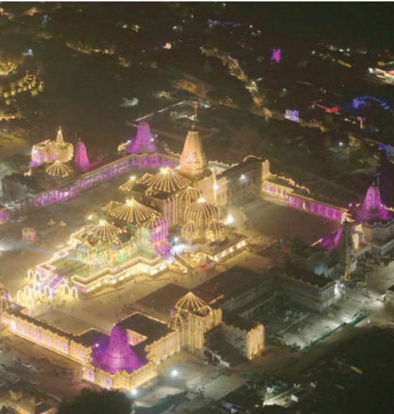
दिवाली पर लाइटों की रोशनी से जगमगाता अयोध्या स्थित श्रीराम मंदिर।