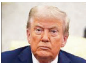
● अमेरिकी राष्ट्रपति डोनाल्ड ट्रंप ने भारत को दी चेतावनी

भारत ने पिछले हफ्ते कहा था कि वह बाजार की परिस्थितियों के अनुरूप ऊर्जा खरीद के अपने स्रोतों को व्यापक और विविध बना रहा है। इससे कुछ घंटे पहले ट्रंप ने दावा किया था कि मोदी ने उन्हें आश्वासन दिया है कि भारत रूस से कच्चे तेल की खरीद बंद कर देगा। ट्रंप ने कहा कि उन्हें नहीं लगता कि भारत ने ऐसी कोई टिप्पणी की। अमेरिकी राष्ट्रपति ने कहा कि मैंने भारत के प्रधानमंत्री