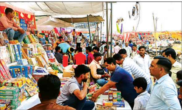
आतिशबाजी की दुकान पर खरीदारों की भीड़।

अमृत विचार। दीपावली के पर्व पर सोमवार को बाजार में रौनक नजर आई। दुकानदारों के पास ग्राहकों की भीड़ लगी रही। किसी को मिठाई चाहिये तो किसी को खील खिलौने तो किसी को आतिशबाजी चाहिये। इसलिये बाजारों में खूब खरीदारी होती रही। दीपावली का पर्व सुख समृद्धि की कामना लेकर आता है। इस दिन भगवान गणेश व लक्ष्मी की पूजा की जाती है। हर व्यक्ति को सुख समृद्धि चाहिये इसलिये घरों में सफाई के साथ ही माता लक्ष्मी के आगमन को लेकर पूजा की जाती है। इसको लेकर बाजारों में खरीदारी करने के लिये लोग बाजार आते हैं। पर्व को लेकर दुकानदारों ने भी अपनी दुकानों में अधिक माल एकत्र कर रखा। दो दिन तक ग्राहक बाजार में कम आने से दुकानदार मायूस रहे। सोमवार को सुबह से ही दुकानें सज गईं। सुबह के 09 बजते ही बाजार में पहल पहल नजर आने