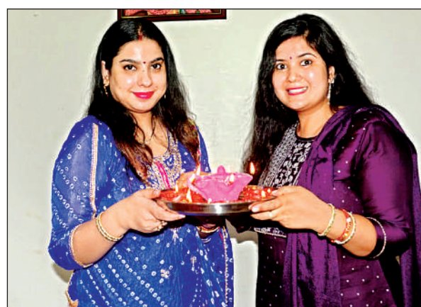
दीप जलाकर दिया रोशनी का पैगाम ।