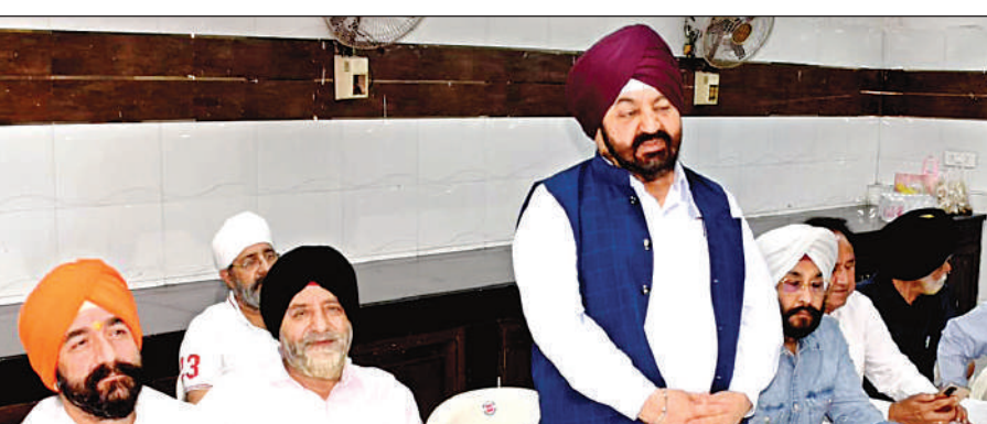
गुरुद्वारा कीर्तनगढ़ में सिख समाज की बैठक हुई।