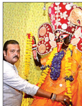
मां काली का पूजन किया गया ।