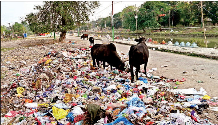
पनकी नहर के किनारे गंदगी का अंबार।