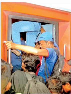
ट्रेनों में भारी भीड़ रही।