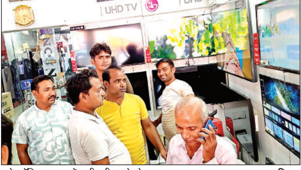
इलेक्ट्रॉनिक दुकान में खरीदारी करते लोग।