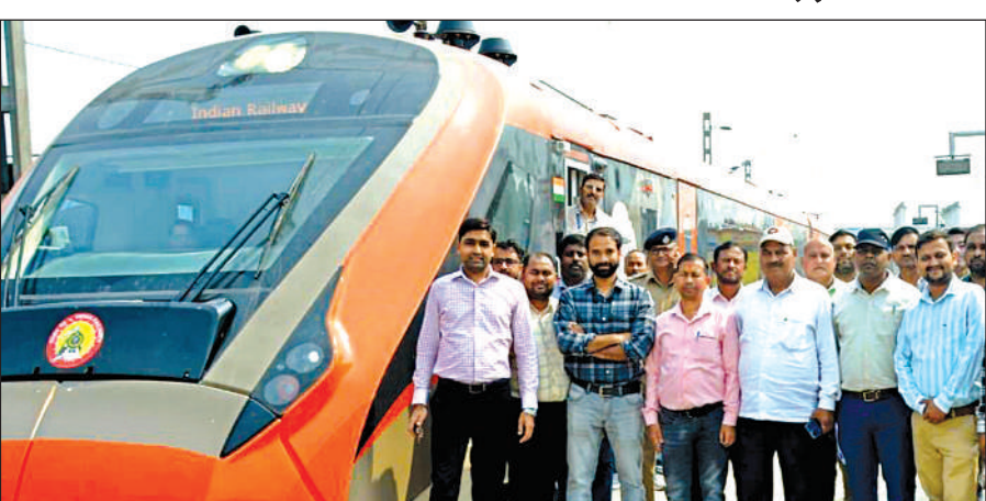
वंदेभारत एक्सप्रेस का कवच ट्रायल करने वाले रेल अधिकारी।