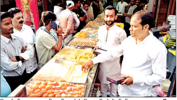
मिठाई की दुकान पर खरीददारी करने के लिए लगी लोगों की भीड़।

कार्यालय संवाददाता इटावा अमृत विचार । दीपावली का पर्व उत्साह व उमंग के साथ मनाया गया। लोगों ने अपने अपने घरों को झालरों सजाया। वहीं सरकारी इमारतों में भी झालरों को लगाया गया। लोगों ने घरों में धूमधाम से लक्ष्मी गणेश की पूजा अर्चना की और जमकर आतिशबाजी छुड़ाई। लोगों ने दीपक व मोमबत्तियों से घरों को रोशन किया। दीपों के पर्व दीपावली को लेकर शहर में लोगों ने जमकर खरीदारी