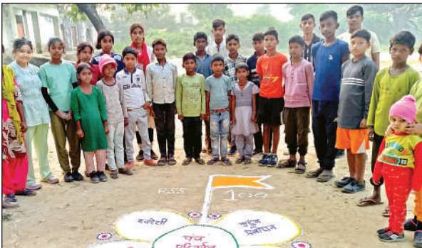
पंच परिवर्तन के संदेश को प्रदर्शित करती आकर्षक रंगोली।

रसूलाबाद के कहिंजरी मंडल की संत कबीर शाखा के स्वयंसेवकों ने पंच परिवर्तन पर रंगोली बनाई। स्वयंसेवकों ने कहा कि हम वर्षपर्यंत इसी शाखा पर भारत माता की जय का उद्घोष करते हैं। इस वर्ष संघ की शताब्दी के उपलक्ष्य में दीपोत्सव के अवसर पर प्रत्येक व्यक्ति पंच