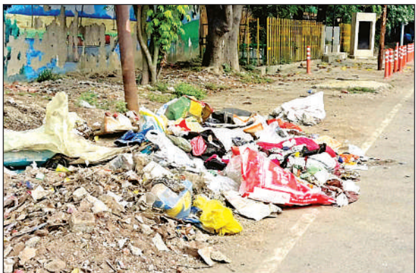
मरियमपुर की ओर जाने वाली सड़क पर सफाई के बाद फेंका गया कूड़ा।

● कई मोहल्लों में नहीं पहुंचे सफाई कर्मचारी, लोगों ने सड़कों के किनारे फेंक दिया कूड़ा