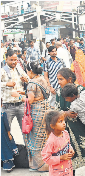
महिलाएं और बच्चे हुए परेशान।

दी है। चार जोड़ी ट्रेनें बुधवार को कई घंटे की देरी से बरेली जंक्शन पहुंचीं।