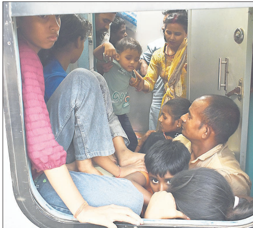
शौचालय में बैठकर यात्रा करते लोग।

के मुताबिक मुरादाबाद मंडल की ओर से यात्रियों की सुविधा के लिए 15 स्पेशल ट्रेनें चलाई जा रही