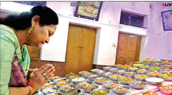
रघुवीर मंदिर में भगवान को लगाया गया छप्पन भोग।