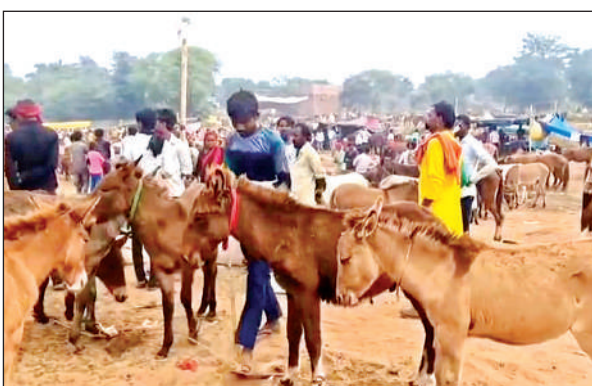
पशु मेले में आए खच्चर और गधे।

तीर्थक्षेत्र में गधों का यह अनूठा मेला है। साल भर खच्चर और गधा पालने वालों को इसका इंतजार रहता है। इसमें सबसे खास बात यह रहती है कि ज्यादातर पशुपालक अपने जानवरों का नाम फिल्मी सितारों के नाम पर रखते हैं। बताया जाता है कि औरंगजेब चित्रकूट में मंदिरों को नष्ट करने के इरादे से आया था लेकिन इसी बीच उसकी सेना में कोई अज्ञात बीमारी फैली और अफरातफरी मच गई। उसके सैनिक और मवेशी मरने लगे। तब किसी संत