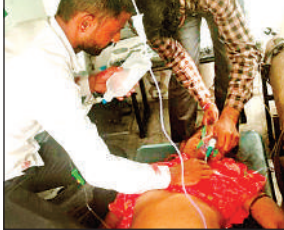
अस्पताल में इलाज करते डॉक्टर।