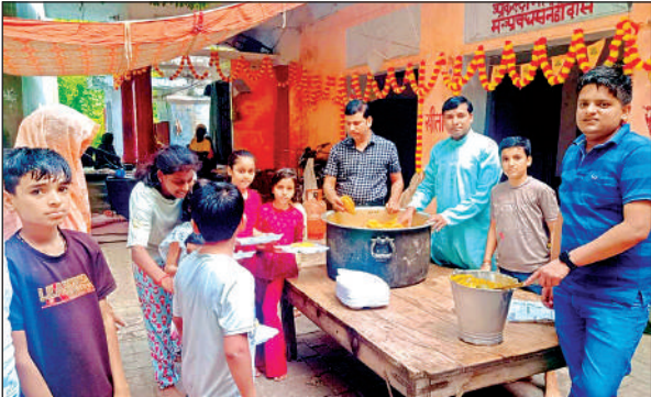
प्रसाद वितरित करते श्रद्धालु।