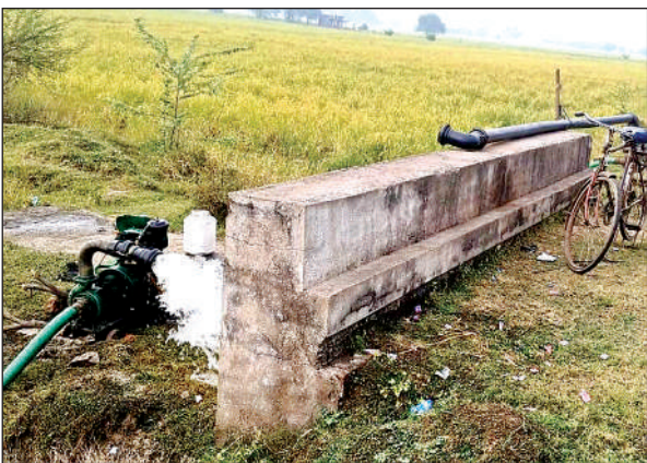
पंपसेट के जरिये बेतावा नहर में पानी निकालते किसान।