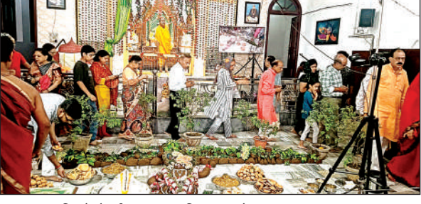
राधामाधव मंदिर में गोवर्धन पूजा कर परिक्रमा करते भक्तगण ।