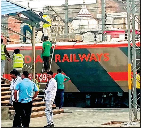
आग बुझाते दमकल कर्मी।