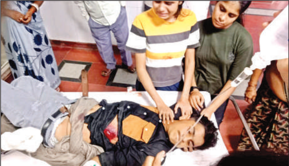
मेडिकल कॉलेज में भर्ती किशोर का इलाज करते डॉक्टर।