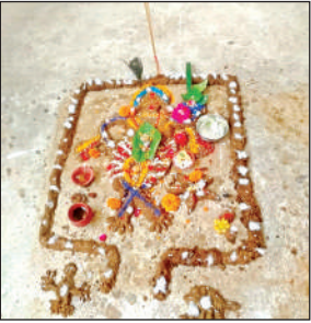
गोबर से बने गोवर्धन भगवान ।

गोबर से गोवर्धन बना लगाया पकवानों का भोग:गुरसहायगंज। दो दिनों की अमावस्या होने के कारण दीपावली के तीसरे दिन घर-घर गोवर्धन महाराज की पूजा-