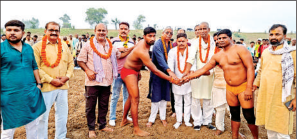
पहलवानों का हाथ मिलाकर दंगल का शुभारंभ कराते अतिथि।