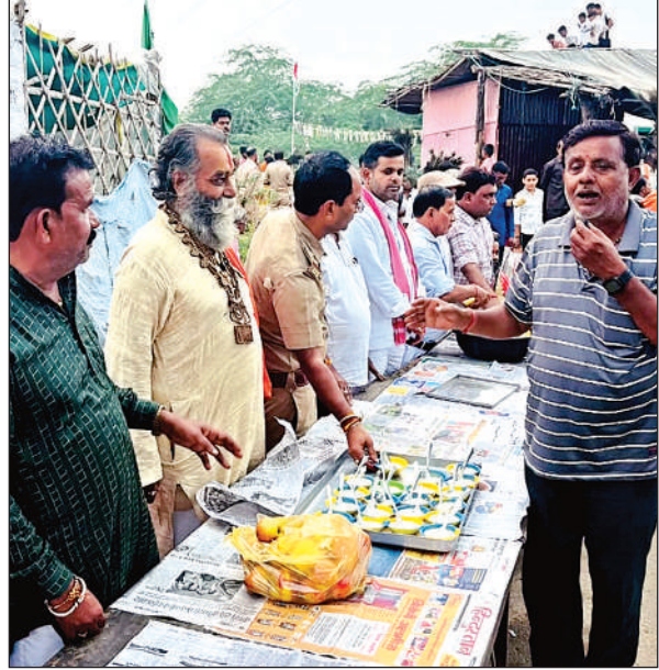
स्वल्पाहार करते लोग।

अमृत विचार। प्रतिवर्ष की भांति इस वर्ष भी मोहल्ला राजघाट में चौकी मंदिर प्रांगण में दिवारी नृत्य हुआ मौनियों को खड़ी मिठाई केला वह स्वल्पाहार कराकर सभी मौनियों को शुभकामनाएं दी गई। दीपावली के पावन पर्व पर जहां एक और तरह-तरह के पकवान व्यंजन का लोग आनंद लेते हैं वहीं भगवान श्री कृष्ण की श्रद्धा और भक्ति के दीवाने मौनिया निर्जला एवं मौन व्रत रखकर भगवान श्री कृष्ण की उपासना करते हैं। यह व्रत बहुत ही आस्था का प्रमाण है क्योंकि 12 वर्ष व्रत रहने के उपरान्त 13वें वर्ष दीपावली के पावन पर्व पर मौन व्रत और निर्जला उपवास तक कड़ी साधना के उपरांत मौनिया श्री कृष्ण के धाम मथुरा जाकर गोवर्धन पर्वत पर अपना व्रत तोड़ते हैं। दीपावली का अपना बुंदेलखंड के प्रवेश द्वार कालपी में अलग ही महत्व है ग्रामीण क्षेत्रों में अलग-अलग रीति रिवाज से यह पर्व मनाया जाता है। दीपोत्सव पर मौन व्रत करने वाले मौनिया भगवान कृष्ण पर अपनी आस्था और शक्ति, भक्ति का परिचय देते हैं लोग अपने हाथों में मोर के पंखों