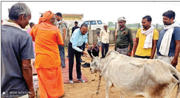
पहाड़ी में गोवंशों की पूजा करते अधिकारी।

श्रद्धाभाव से गोवर्धन पूजा मनाई गई, एसडीएम और नगर पंचायत अध्यक्ष पहुंचे