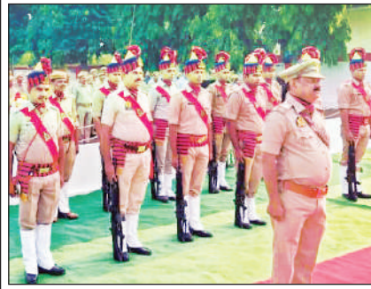
पुलिस स्मृति दिवस पर शहीदों को दी जाती श्रद्धांजलि।