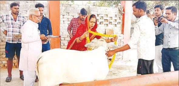
गौशाला में गोवंश की पूजा- अर्चना करती पालिकाध्यक्ष।

अमृत विचार । दीपावली के दूसरे दिन नगर में परंपरागत श्रद्धा और उल्लास के साथ गोवर्धन पूजा तथा अन्नकूट किया गया। सुबह से ही घर-घर में महिलाएं व श्रद्धालु गोबर से गोवर्धन भगवान की प्रतिमा बनाकर उनकी अलौकिक सजावट में जुटे रहे। लोगों ने प्रतिमा को फूलों, पत्तियों और लताओं से सुसज्जित कर यज्ञोपवीत पहनाया। इसके बाद विधि विधान से रोली, चावल, जल, दूध, खीर, बताशे व दीपक से पूजा अर्चना कर गिरिराज महाराज का आह्वान किया गया। पूजा से पूर्व राजधानी मार्ग की सब्जी मंडी, क्रॉसिंग ढाल ओर रेलवे पुल के नीचे लगने वाली अस्थायी मंडी में सब्जी खरीदने के लिए सुबह से ही भीड़ उमड़ी रही। परिवारों ने विभिन्न प्रकार की सब्जियां, दूध और पूजन सामग्री खरीदकर अन्नकूट प्रसाद की तैयारी की। श्रद्धालुओं ने मान्यता के अनुसार गिरिराज भगवान को 56 भोग अर्पित कर आशीर्वाद प्राप्त किया। धार्मिक मान्यता है कि इस दिन भगवान श्रीकृष्ण ने इंद्र के अहंकार का नाश कर गोवर्धन