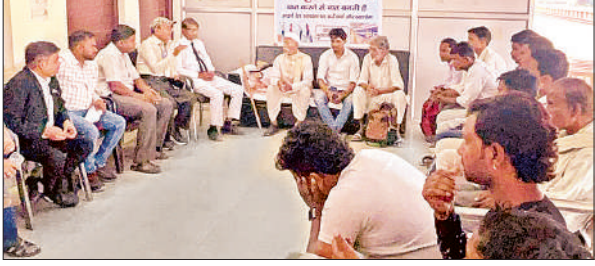
यात्रियों की समस्याएं सुनते रेल अधिकारी ।

अमृत विचार । हरदोई रेलवे स्टेशन पर बुधवार को ‘अमृत संवाद’ कार्यक्रम का आयोजन किया गया । कार्यक्रम में रेलवे विभाग के अधिकारियों ने स्थानीय रेलकर्मियों और यात्रियों से आमने-सामने बातचीत की तथा स्टेशन से जुड़ी समस्याओं और आवश्यकताओं को विस्तार से सुना । कार्यक्रम का मुख्य उद्देश्य यात्रियों के सुझावों को धरातल पर उतारते हुए स्टेशन पर बेहतर सुविधाएं उपलब्ध कराना था । संवाद के दौरान यात्रियों ने बताया