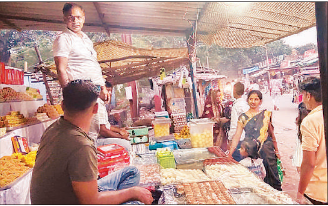
मिठाई की दुकान पर खरीदारी करते लोग ।