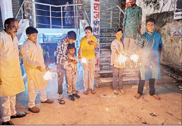
दीपावली पर फुलझड़ी जलाते बच्चे।

शहर के प्रमुख इलाकों में देररात तक जोरदार आतिशबाजी होती रही। कंचाई पर जाकर फूटने वाले रंगीन रॉकेटों व तेज आवाज वाले बमों ने आसमान को अद्भुत छटा से भर दिया। बच्चों से लेकर बड़ों तक सभी ने आतिशबाजी का आनंद लिया। पटाखों की गूंज