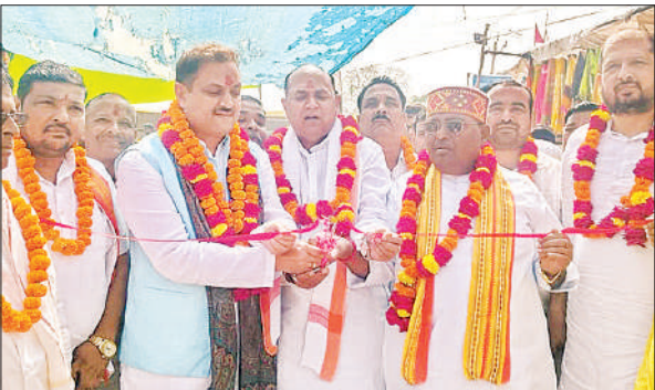
मेले का शुभारंभ करते विधायक, पूर्व विधायक व एमएलसी।