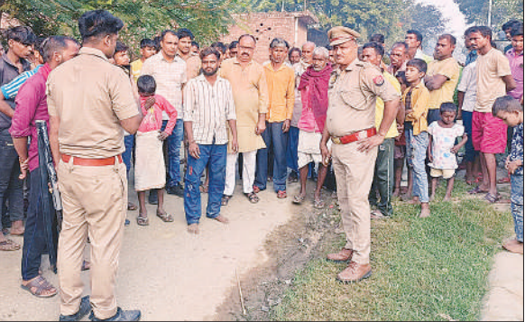
घटना के बारे में पूछताछ करती पुलिस ।

अमृत विचार । दीपावली के दिन शराबी बेटा अपनी मां से शराब के लिए 500 रुपये मांग रहा था । लेकिन मां ने पैसे देने से मना कर दिया । इसी बात को लेकर वह मां को भला-बुरा कहते हुए उससे हाथापाई करने लगा । उसी बीच घर पहुंचे उसके छोटे भाई ने उससे रोकने का प्रयास किया । लेकिन