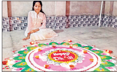
दौलतपुर में बनाई रंगोली के साथ युवती।