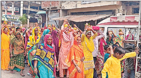
कलशयात्रा में शामिल श्रद्धालु।