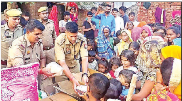
गरीबों को मिठाई और उपहार देते सीओ और प्रभारी निरीक्षक।