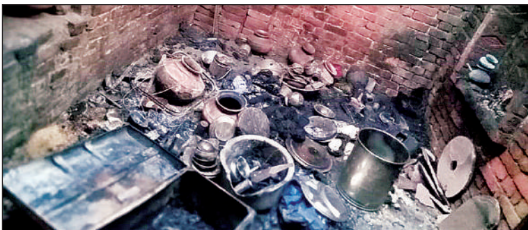
आग लगने से जला सामान।