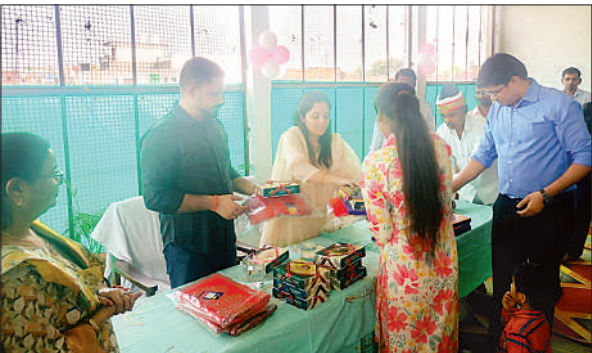
राजकीय संप्रेक्षण गृह में दीपावली मनाते डीएम व उनकी पत्नी।