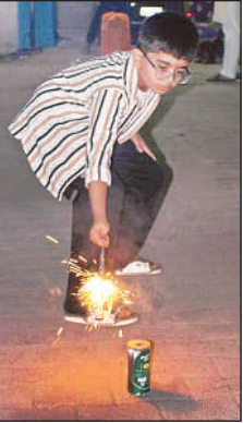
आतिशबाजी छुड़ाता बालक ।