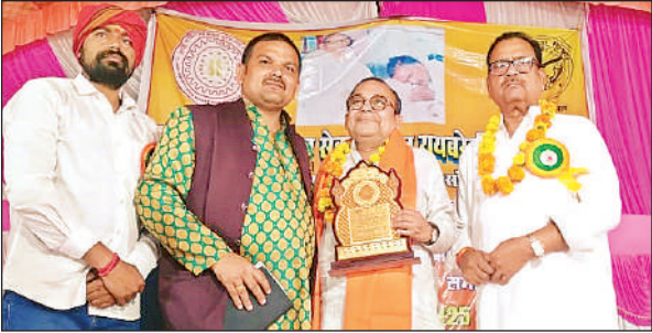
कवि सम्मेलन में मुख्य अतिथि का स्वागत करते आयोजक।