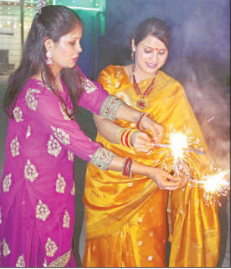
दीपावली पर फुलझड़ी छुड़ाती महिलाएं ।

अमृत विचार । दीपावली का त्योहार गांव से लेकर शहर तक पूरे उत्साह और उमंग के साथ मनाया गया । नगर के विभिन्न मोहल्लों, गलियों और बाजारों में शाम ढलते ही दीपों की जगमगाहट फैल गई । घरों की दीवारों और छज्जों पर सजी रंगीन झालरों ने ऐसा नजारा पैदा किया कि पूरे क्षेत्र में मानो रोशनी की नदी बह रही हो । हर तरफ सजावट की सुंदरता लोगों का मन मोहती दिखाई दी । पूजा-अर्चना के बाद परिवारों ने पारंपरिक रीति के अनुसार दीप जलाए और भगवान गणेश व माता लक्ष्मी से सुख-समृद्धि की कामना की । इसके बाद छोटे-बड़े सभी आतिशबाजी का आनंद लेते दिखाई दिए । बच्चे फुलझड़ियों और चकमक पटाखों