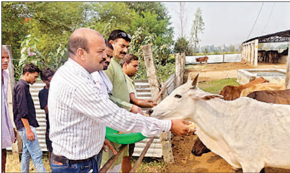
जरहरा गौशाला में गाय का पूजन करते श्रद्धालु।