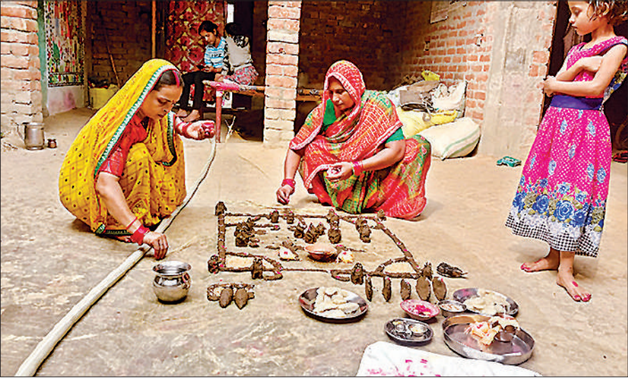
गोवर्धन पूजा को लेकर गोबर की प्रतिमाएं तैयार करती गृहणियां।

श्रद्धालुओं ने चक्रतीर्थ पर लगाई डुबकी : मिश्रिख। नैमिषारण्य तीर्थ में कार्तिक मास की अमावस्या पर श्रद्धालुओं ने चक्रतीर्थ और गोमती नदी के घाटों पर स्नान किया। पूजन अर्चन के साथ दान भी किया। बड़ी संख्या में आए श्रद्धालुओं ने मां ललिता देवी मंदिर, व्यास गद्दी, सूत गद्दी, हनुमानगढ़ी, शौनक गद्दी और