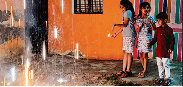
दीपावली पर आतिशबाजी करते बच्चे।

अमेठी, अमृत विचार। प्रकाश पर्व दीपावली का पर्व सोमवार को पारंपरिक तरीके से हर्षोल्लास के साथ मनाया गया। महंगाई के बावजूद पर्व पर लोगों का उत्साह भारी दिखा। दिन ढलते ही महल अट्टालिकाएं घर प्रतिष्ठान और झोपड़ी रोशनी व पटाखों फुलझड़ियों से शहर और गांव जगमगा उठे। मान्यता है कि मर्यादा पुरुषोत्तम भगवान श्री राम लंका विजय के उपरांत कर्तिक मास की अमावस्या को अयोध्या पहुंचे थे। भगवान के आगमन पर घर-घर अयोध्या को दीप मालिका से सजाया गया था। पूरा अवध अमावस की अंधेरी रात में भी रोशनी से जगमगा उठा था। उसी समय से दीपावली का पर्व मनाया जाने लगा। हर कोई उत्साह