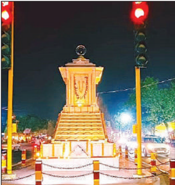
दीपक तथा रंगबिरंगी झालरों से सजा डिग्री कॉलेज चौराहा। अमृत विचार

अमृत विचार। जिले में दीपावली का पर्व धूमधाम से मनाया गया। मिट्टी के दिव्यों, झालरों और मोमबत्ती से घर, मंदिर और प्रतिष्ठान जगमगा उठा। महिलाओं और बच्चों ने शानदार रंगोली सजाईं, वहीं विधि विधान से भगवान श्री गणेश व मां लक्ष्मी की पूजा अर्चन कर सुख समृद्धि की कामना की। इसके बाद आतिशबादी का दौर शुरू हुआ, जो देर रात तक चलता रहा। इस दौरान जिले के प्रशासनिक और पुलिस अधिकारों ने गरीबों के बीच जाकर मिठाई वितरित की। वहीं समाजसेवियों ने भी उपहार और मिठाई का वितरण किया। आस्था के साथ की गोवर्धन पूजा: कार्तिक मास के शुक्ल पक्ष की प्रतिपदा