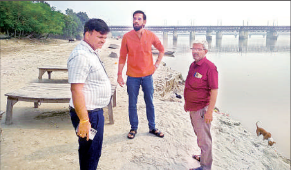
घाट का निरीक्षण करते ईओ और पालिकाध्यक्ष प्रतिनिधि।