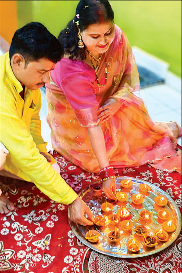
दीपावली पर्व पर दीप प्रज्ज्वलित करते श्रद्धालु।