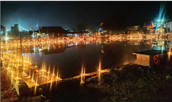
कोटवाधाम में दीपोत्सव के दौरान जगमगाता अभरण सरोवर।