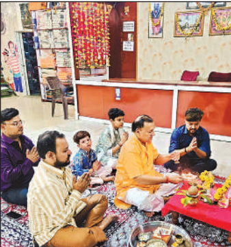
पुलिस लाइन स्थित प्रतिष्ठान में पूजा-अर्चना करतेपरिजनों के साथ व्यापारी। अमृत विचार

तिथि को गोवर्धन पूजा की जाती है। यह हर वर्ष दीवाली के अगले दिन होता है। इस बार अमावस्या तिथि दो दिन होने की वजह से गोवर्धन पूजा बुधवार को पूरे विधि विधान से मनाया गया। मान्यता है कि इस