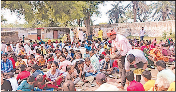
बाबा घिसियावन दास कुटी में आयोजित भंडारे में प्रसाद ग्रहण करते श्रद्धालु।