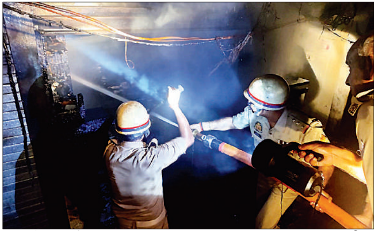
अमृत विचार आग बुझाते दमकलकर्मि।