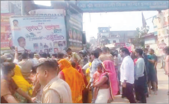
प्रदर्शन करते लोगों को समझाते पुलिसकर्मि।