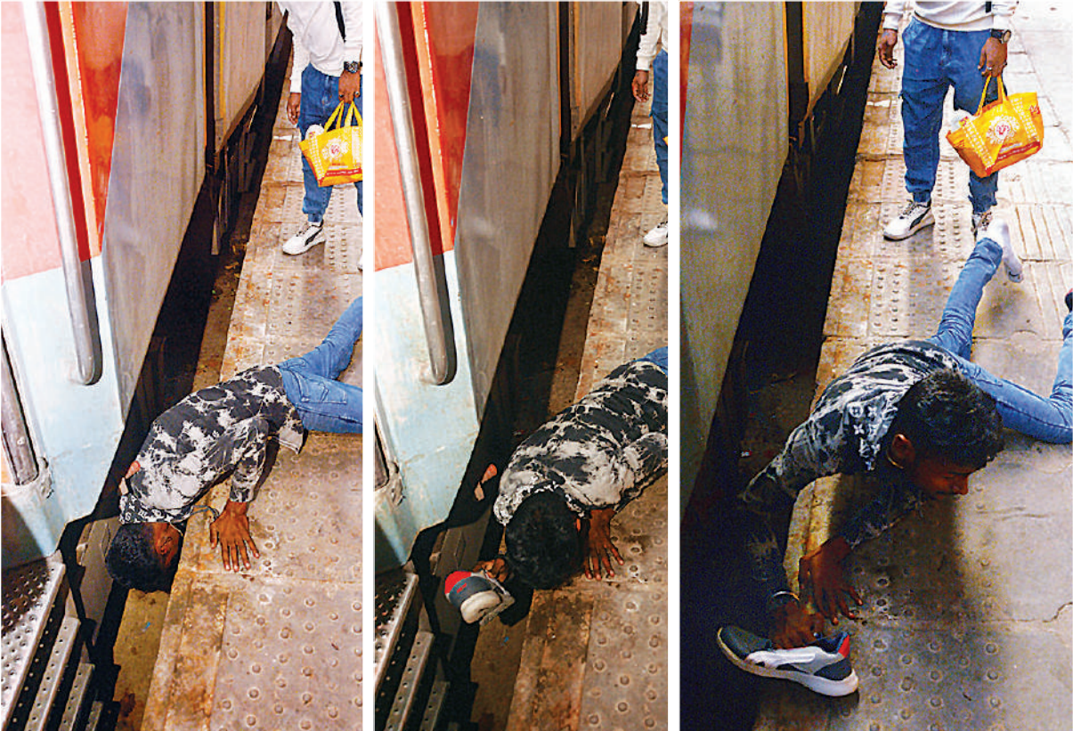
चारबाग रेलवे स्टेशन पर बुधवार को त्रिवेणी एक्सप्रेस से जा रहे युवक को जुता ट्रेन के नीचे गिर गया। जुता निकालने के लिए युवक प्लेटफार्म पर लेट गया और सिर को ट्रेन के बीच में डालकर जुता निकलाने लगा, काफी देर बाद वह जुता निकाल पाया, गनीमत रही इस बीच ट्रेन नहीं चली। अगर ट्रेन चलने लगती तो युवक की जान भी जा सकती थी। – प्रमोद शर्मा