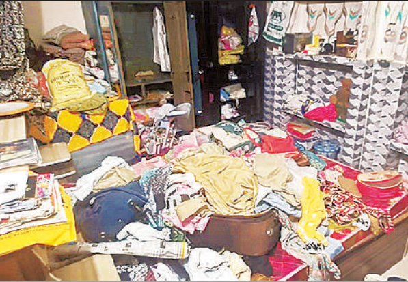
चोरी के बाद बिखरा सामान।