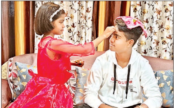
भाईदूज पर भाई को टीका लगाती बहन ।

अमृत विचार । भाई-बहन के अटूट प्रेम व स्नेह का पर्व भाईदूज जिले में पूरे हर्षोल्लास के साथ मनाया गया। बहनों ने भाइयों के माथे पर रोली व खील का तिलक लगाकर उनकी लंबी उम्र, सुख-समृद्धि की कामना की। दीपावली के बाद भाईदूज का पर्व गोवर्धन पूजा के अगले दिन होता है। पारंपरिक रूप से बहनों ने चावल के आटे से चौक बनाकर उस पर भाई को बिठाया। थाली में रोली, चावल (अक्षत), सुपारी, मिठाई आदि रखकर भाई का तिलक किया। कई जगह बहनों ने बेर के कांटे की पूजा कर भाई को तिलक लगाया। तिलक के बाद भाइयों का मुंह मीठा कराया