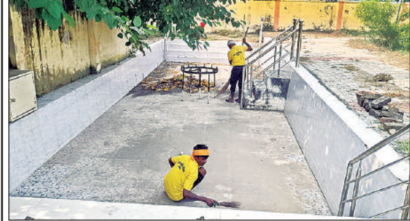
तालाब की सफाई करते पालिका कर्मी ।

छठ पूजा को लेकर साफ किया गया तालाब उन्नाव, अमृत विचार । शहर के आवास विकास कॉलोनी स्थित चंद्रशेखर आजाद पार्क में होने वाली छठ पूजा के लिए तैयारियां शुरू हो गई हैं। नगर पालिका प्रशासन ने पार्क के तालाब को छट के लिए तैयार करने का कार्य शुरू कर दिया है। गुरुवार को पालिका कर्मियों ने पार्क में छठ पूजा के लिए उपयोग होने वाले तालाब की सफाई की और पूजा स्थल व तालाब के किनारों को आकर्षक रूप देने के लिए रंग-रोगम भी कराया।