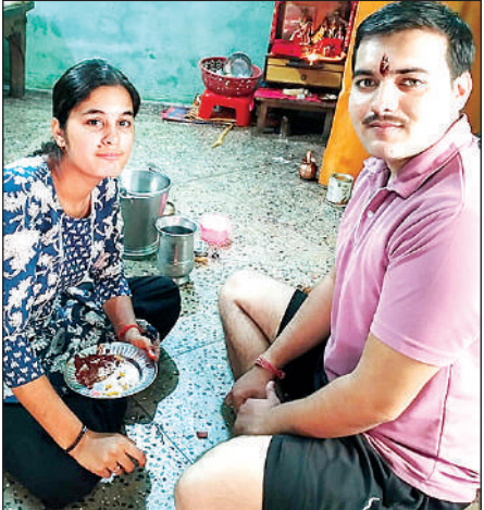
अमृत विचार टीका करती बहन ।

ने आम दिनों की अपेक्षा सवारियों से डेढ़ से दो गुना अधिक किराया वसूल किया । पर्व पर भीड़ के चलते पुलिस ने पूरी चौकसी बरती । घर के बड़ों के अनुसार: “भैया