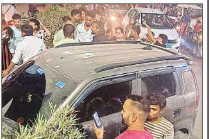
फोरलेन स्थित डिवाइडर पर खड़ी क्षतिग्रस्त कार ।