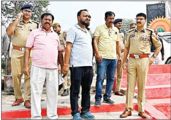
पुलिस कमिश्नर ने भी घाटों का निरीक्षण किया।