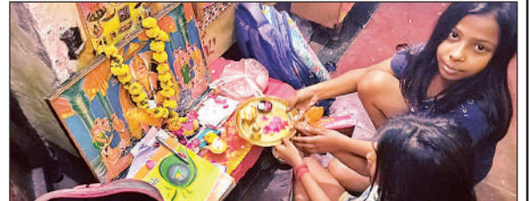
ऋषि नगर में चित्रगुप्त की होती पूजा ।

विधिविधान से घरों-आंगनों में की गई चित्रगुप्त की पूजा शुक्लागंज, अमृत विचार । दीपावली पर्व के बाद गुरुवार को नगर में परंपरा के अनुसार घरों-आंगनों में चित्रगुप्त भगवान की पूजा अर्चना श्रद्धाभाव के साथ की गई। कार्तिक मास में भइया दूज के अवसर पर चित्रगुप्त पूजन का विशेष महत्व माना जाता है। मान्यता है कि कलम-दवात के अधिष्ठाता एवं कर्मों के लेखा-जोखा रखने वाले देवता चित्रगुप्त की आराधना से विद्या, बुद्धि और समृद्धि की प्राप्ति होती है। सुबह से ही महिलाओं ने स्नान-ध्यान के बाद चावल के आटे से आंगन में सुंदर अल्पनाएं व प्रतीकात्मक आकृतियां बनाकर पूजा की तैयारी की। इसके