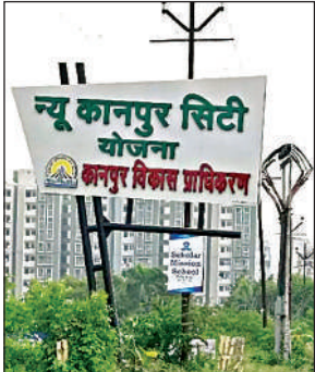
● 142 करोड़ रुपये से विकास कार्य कराए जाएंगे, 11 कंपनियों ने टेंडर डाले

अमृत विचार। न्यू कानपुर सिटी योजना को धरातल में लाने के लिए केडीए का अमला जुटा है। इसके लिए 142 करोड़ रुपये के विकास कार्य कराए जाएंगे। इसमें 60 करोड़ रुपये से छह सेक्टर में 30 मीटर, 45 मीटर और 60 मीटर चौड़ी सड़कों का निर्माण होना है। 11 कंपनियों ने टेंडर डाले हैं। अगले हफ्ते तक कार्य करने वाली कंपनी तय होगी। नवंबर माह से योजना में विकास कार्य शुरू कर दिया जाएगा।