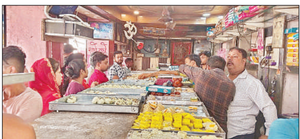
मिठाई खरीदने के लिये दुकान में लगी लोगों की भीड़ ।

अवैधानिक प्रवेश व बिना मान्यता संचालन पर होगी कार्यवाई समिति यह भी सुनिश्चित करेगी कि किसी भी छात्र का प्रवेश बिना मान्यता वाले कोर्स में नहीं हुआ है। समिति यदि किसी संस्था में अवैधानिक प्रवेश मिलते हैं व बिना मान्यता प्राप्त संचालित पाती है तो उस संस्थान पर कार्यवाही कर प्रस्ताव देगी। ऐसे मामलों में छात्रों से लिया गया सम्पूर्ण शुल्क ब्याज सहित लौटाने की जिम्मेदारी संस्था की होगी। वहीं, समिति यदि किसी संस्था में अवैधानिक प्रवेश व बिना मान्यता प्राप्त कोर्स संचालित मिलते हैं तो उस संस्थान पर कार्यवाही का प्रस्ताव देगी।