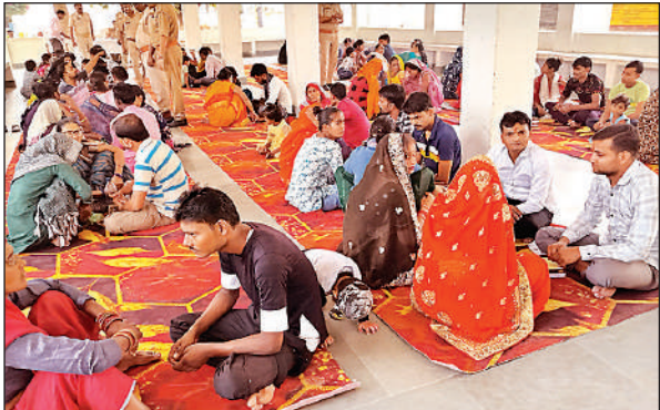
जिला जेल में बंद भाइयों के टीका करती बहनें ।

गया। बहनों के स्नेह और कामना के बदले भाइयों ने भी उन्हें उपहार दिए और हमेशा उनकी रक्षा करने का वचन दिया। त्योहार को हर्षोल्लास के साथ मनाया गया।