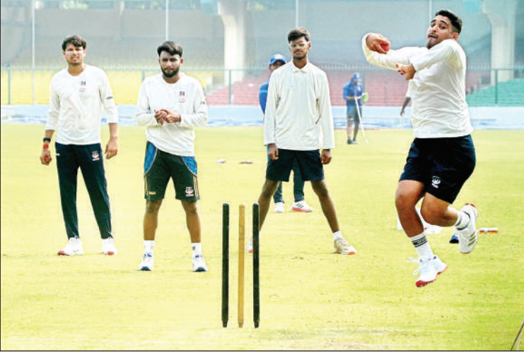
गेंदबाजों ने अभ्यास किया।

कानपुर। छह महीने से ज्यादा समय से लाखों राहगीरों के लिए परेशानी का सबब बनी दादानगर-विजयनगर रोड का आधा-अधूरा निर्माण कराकर छोड़ दिया गया है। मेट्रो की खुदाई के बाद से खराब पड़ी सड़क पर बड़ी मात्रा में गिट्टी उखड़ गई है जिसपर दोपहिया वाहन फिसल कर गिर जाते हैं। दिनभर इस अधूरी सड़क पर बहल उड़ती रहती है। इसके अलावा दूसरी तरफ की लेन पर भी गड़बड़े हैं।