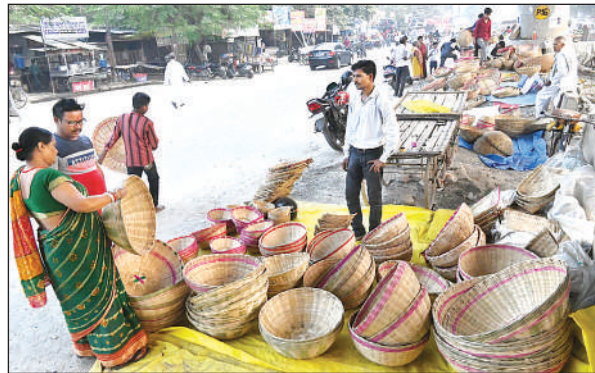
सूप और डाला कि बिक्री शुरू हो गई है।