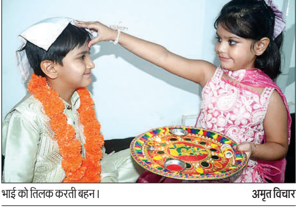
भाई को तिलक करती बहन।