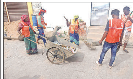
पालिका द्वारा कराई जाती साफ-सफाई ।

मोहल्लों में घरेलू वातावरण दिनभर भक्ति और परंपरागत रीति-रिवाजों से सराबोर रहा। पूजा पद्धति के पश्चात परिवारों ने एक-दूसरे को शुभकामनाएं दी और प्रसाद का वितरण किया।