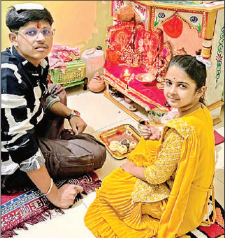
बहन ने भाई को लगाया टीका ।

कार्तिक माह के शुक्ल पक्ष की द्वितीया तिथि को भाई दूज पर गुरुवार सुबह से ही कस्बे में जीटी रोड , बंदी माता मार्ग व बेला मार्ग पर चहल पहल नजर आई । भइया दूज पर्व पर बहनों ने भाइयों के माथे पर रोचना लगाकर व मिष्ठान खिलाकर उनके अच्छे स्वास्थ्य और सुखमय जीवन की कामना की, तो वहीं भाइयों ने भी बहनों को उपहार भेंट कर आजीवन रक्षा का संकल्प दोहराया । त्योहार पर सर्वाधियों की अधिकता के चलते टेम्पो व ऑटो चालकों की मनमानी रही । चालकों