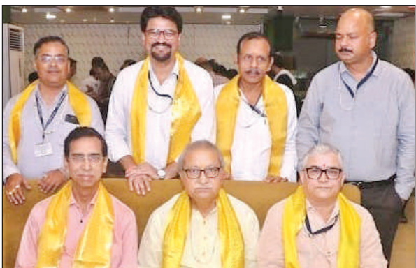
पदाधिकारियों ने दी जानकारी।

के कारण रियल एस्टेट रेगुलेटरी अथारिटी से भी स्वीकृति नहीं मिल पा रही है। 153.31 हेक्टेयर जमीन पर योजना लांच करनी है। इसमें 89.69 हेक्टेयर जमीन में अभी तक 56 हेक्टेयर जमीन अधिग्रहित हो पायी है। दीपावली के बाद 60 करोड़ रुपये से 30 मीटर, 45 मीटर और 60 मीटर चौड़ी सड़क का निर्माण होना है। इसके अलावा डक्ट के माध्यम से भूमिगत केबल, पेयजल व सीवर लाइन डाली जाएगी।