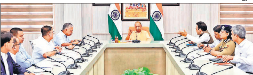
अग्निशमन व आपात सेवा विभाग में पदों के सृजन व अभियोजन संवर्गीय अधिकारियों के कैडर रिव्यू के संबंध में बैठक करते मुख्यमंत्री योगी।

अमृत विचार: मुख्यमंत्री योगी आदित्यनाथ ने कहा है कि केमिकल, बायोलाॅजिकल, रेडियोलाॅजिकल हादसों और सुपर हाईराइज बिल्डिंग से अग्निकांड से निपटने के लिए को प्रत्येक क्षेत्र में स्पेशलाइज्ड यूनिट बनेगी। साथ ही एक्सप्रेस-वे के हर 100 किमी पर छोटी फायर चौकी खुलेगी। मुख्यमंत्री ने अग्निशमन विभाग की संरचना को समय की ज़रूरत के अनुरूप पुनर्गठित करने के निर्देश देते हुए 98 राजपत्रित व 922 अराजपत्रित नए पदों की मंजूरी भी दी है। योगी ने अपने आवास पर अग्निशमन विभाग की समीक्षा करते हुए कहा कि प्रदेश की बढ़ती जनसंख्या, तेज औद्योगिक विस्तार व तीव्र शहरीकरण को देखते हुए फायर सर्विस को केवल आग बुझाने वाली एजेंसी न मानकर इसे आपदा प्रबंधन,