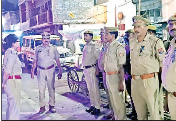
भ्रमण के दौरान रनियां थाने के पुलिस कर्मियों को एसपी ने दिए निर्देश । अमृत विचार

संकट: यह समस्या आने वाले दिनों में और भी गंभीर होने वाली है । कानपुर में प्रस्तावित एलिवेटेड रेलवे ट्रैक के निर्माण के चलते जब रेल सेवा बाधित होगी, तो ग्रामीण क्षेत्रों के लोगों के पास शहर तक पहुंचने का लगभग कोई विश्वसनीय साधन नहीं बचेगा । यह स्थिति न केवल आवागमन को रोकेगी, बल्कि व्यापार, शिक्षा और स्वास्थ्य सेवाओं तक पहुंच को भी प्रभावित करेगी । जनता और स्थानीय बुद्धिजीवियों ने इस गंभीर