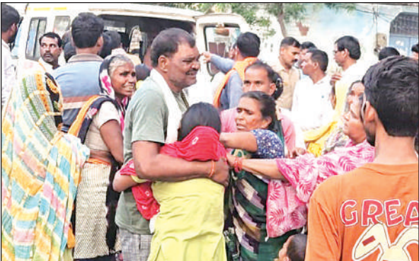
प्रसव के दौरान मंजू की मौत पर बिलखते परिजन। हंगामे की जानकारी पर पहुंची पुलिस। और की मामले की जानकारी। अमृत विचार

स्नान करके यमराज को तिलक करके भोजन कराती है। बहन के अपने प्रति स्नेह, आदर और सम्मान को देखकर यमराज खुश हो जाते हैं और यमुना को वर मांगने का आदेश देते हैं। यमुना ने कहा भाई इस दिन जो बहन मेरी तरह अपने भाई का आदर, सत्कार और टीका करके भोजन कराये उसे तुम्हारा भय न रहे। यमराज तथास्तु कहकर यमुना को अमृत्य वर्र और आभूषण देकर चले जाते हैं। इसीलिए यह भाई बहन का अटूट पर्व माना जाता है।