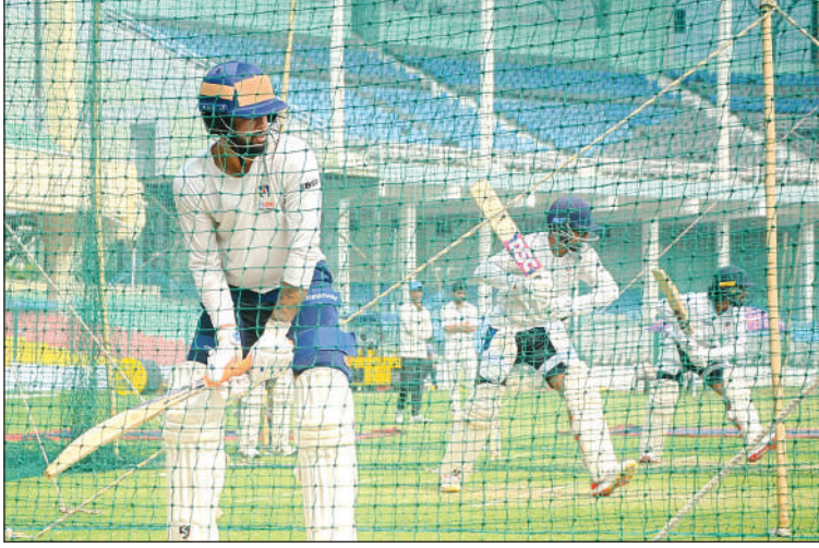
बल्लेबाजों ने भी हाथ खोले।