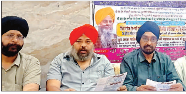
गुरुद्वारा में पत्रकार वार्ता में जानकारी देते सेवादर