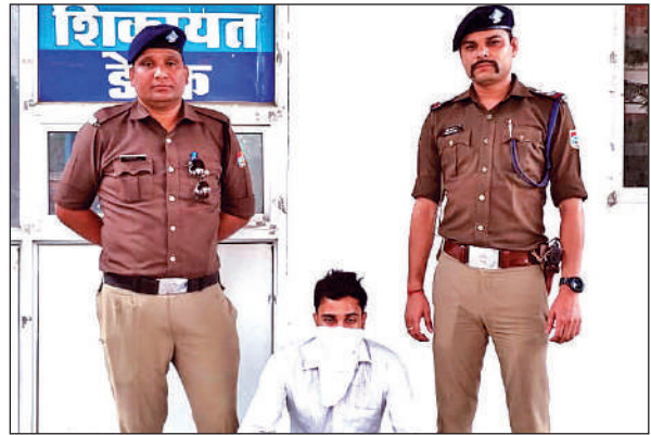
पुलिस की गिरफ्त में गोलीकांड का अभियुक्त।