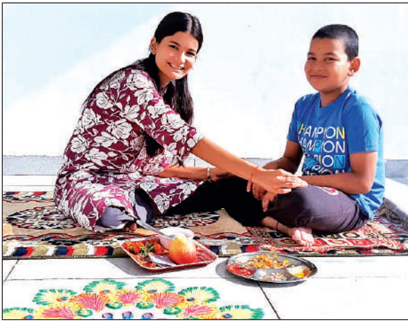
अल्मोड़ा में गुरुवार को भैया दूज पर भाई को च्यूड़े पूजती बहन।

श्रद्धालुओं ने विभिन्न देवी-देवताओं के मंदिरों में भी पूजा-अर्चना कर च्यूड़े अर्पित किए। भैया दूज पर बहनें भाइयों को च्यूड़े चढ़ाने के लिए सुबह से दूर-दूर से भाइयों के घर पहुंचीं। वहीं भाई ने भी बहन को उपहार देकर बहन के भी सुखमयी भविष्य की कामना की। इधर, इस पर्व पर श्रद्धालुओं