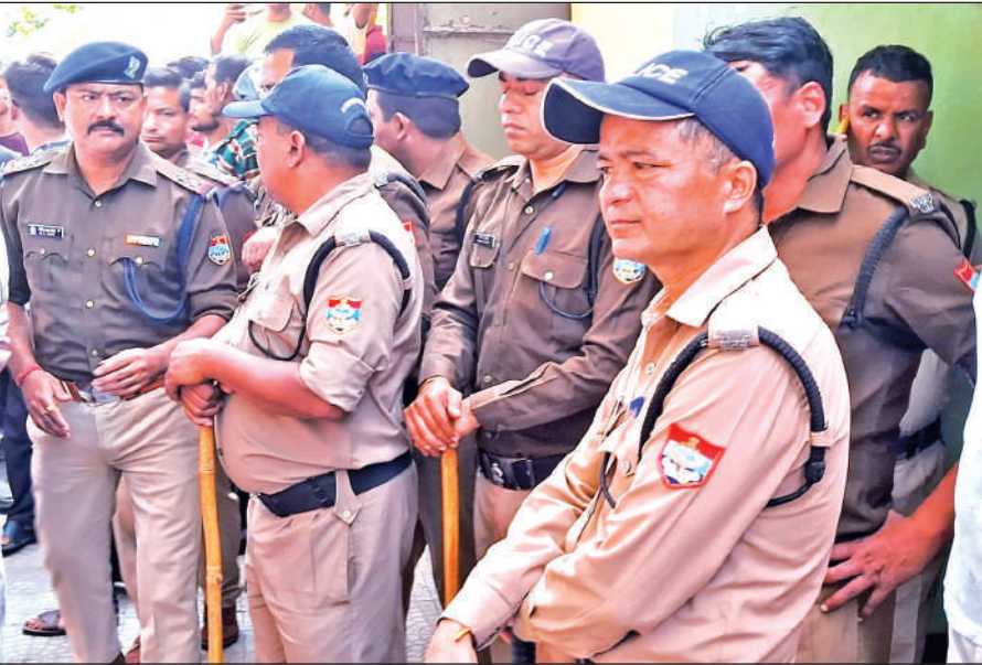
हंगामे के बाद बैलपड़ाव चौकी में तैनात पुलिस बल।

देहरादून : धर्मस्व एवं संस्कृति मंत्री सतपाल महाराज ने कहा है कि गंगोत्री धाम के पश्चात भैया दूज को यमुनोत्री और केदारनाथ धाम के कपाट भी शीतकाल के लिए बंद होने के साथ ही अब चारधाम यात्रा अपने समापन की ओर है। धामों के कपाट बंद होने के पश्चात परम्परागत रूप से शीतकालीन पूजा स्थलों पर श्रद्धालु के लिए पूजा-अर्चना और दर्शनों के सरकार द्वारा विशेष प्रबंध किए गए हैं। सरकार के सुनियोजित प्रयासों से यह यात्रा सफल और सुचारू रूप से संपन्न हुई हो रही है। इसके लिए मैं तीर्थयात्रियों, तीर्थ पुरोहितों, स्थानीय नागरिकों, स्वयंसेवी संस्थाओं, सभी विभागों के अधिकारियों, कर्मचारियों और सीएम का आभार जताया है।