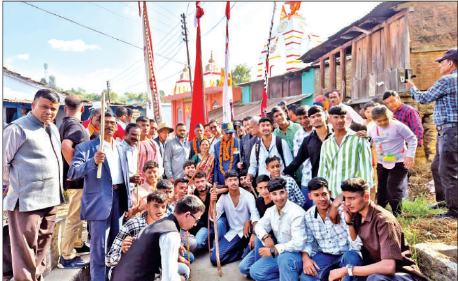
बगवालीपोखर में बगवाली मेले के दौरान ओड़ा भेंटने की रस्म निभाई गई। ● अमृत विचार

मुख्य अतिथि क्षेत्रीय विधायक मदन सिंह बिष्ट ने किया मेले का शुभारंभ, मेले के दौरान एक से बढ़कर एक सांस्कृतिक कार्यक्रमों ने बांधा समां