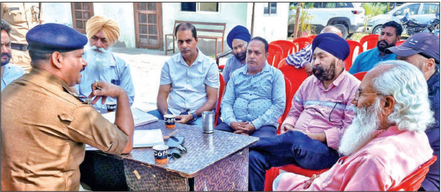
लालपुर चौकी में बैठक करते क्षेत्रवासी एवं चौकी प्रभारी। ● अमृत विचार

लालपुर क्षेत्र में बढ़ती चोरी की घटनाओं पर अंकुश लगाने एवं दीपावली के दिन व्यापारी के निवास से हुई लाखों रुपए की चोरी तथा अन्य घटनाओं के खुलासे की मांग को लेकर दर्जनों लोग लालपुर