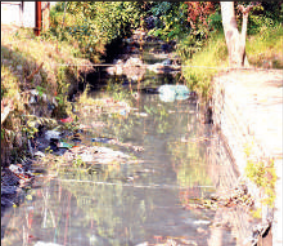
पूजा स्थल पर नहर के अंदर फैली गंदगी।