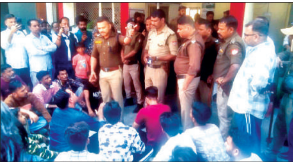
कोतवाली पहुंचे मीट कारोबारियों ने धरना प्रदर्शन किया।