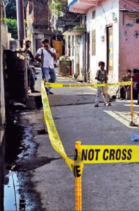
बनभूलपुरा में इसी घर में आरोपी पति ने दिया गया घटना को अंजाम।

गाड़ी काठगोदाम-मुम्बई सेन्ट्रल, लालकुआं-कोलकता, प्रयागराज-लालकुआं, बरेली सिटी-काशीपुर और काशीपुर-बरेली सिटी विशेष गाड़ियों का संचलन किया जा रहा है। इसके अलावा बरौनी जंक्शन-बान्ना टर्मिनल विशेष गाड़ी प्रत्येक गुरुवार को इज्जतनगर मंडल के स्टेशनों से होकर गुजरती है। सप्ताह