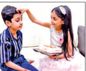
भैया दूज पर भाई को टीका लगाती बहन।

एसपी यातायात व अपराध डॉ. जगदीश चन्द्र ने बताया कि सड़क किनारे वाहन पार्क कर यातायात प्रभावित करने वाले लोगों के खिलाफ लगातार कार्रवाई की जा रही है। वहीं यातायात व्यवस्थित करने के लिए पुलिस सड़कों से वाहनों को हटा रही है।