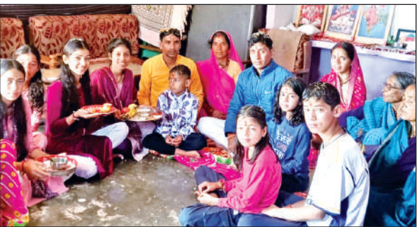
लोहाघाट के दूरस्थ गांव में भैया दूज कार्यक्रम में मौजूद लोग। ● अमृत विचार

अमृत विचार: चम्पावत जिले में भैया दूज का पर्व उत्साह के साथ मनाया गया। बहनों ने परंपरागत ढंग से भाइयों का चावल से बने च्यूड़ा और और गुप्फा के फूलों से रिर पूजन किया। जी रया, जागी रया, झुलना फुलना होया आदि आशीर्वाचनों से भाइयों की लंबी आयु और सुखमय जीवन की कामना की, जबकि भाइयों ने बहनों की रक्षा का वचन दिया। पर्व को लेकर सुबह से ही उत्साह रहा। रोडवेज की बसों और टैक्सियों में खचाखच भीड़ रही। बहनों के सुबह से ही भाइयों के घर पहुंचने का सिलसिला शुरू हो गया था। हर आयु वर्ग के लोगों ने भैया दूज का पर्व मनाया। मान्यता है कि इस दिन