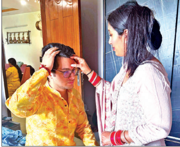
दिनेशपुर में भाई को तिलक लगाती बहन। ● अमृत विचार

रोडवेज व प्राइवेट बसों में भी यात्रियों की खासी भीड़ रही। यात्री बसों में उतरने और चढ़ने को लेकर जटीलहद करते नजर आए।