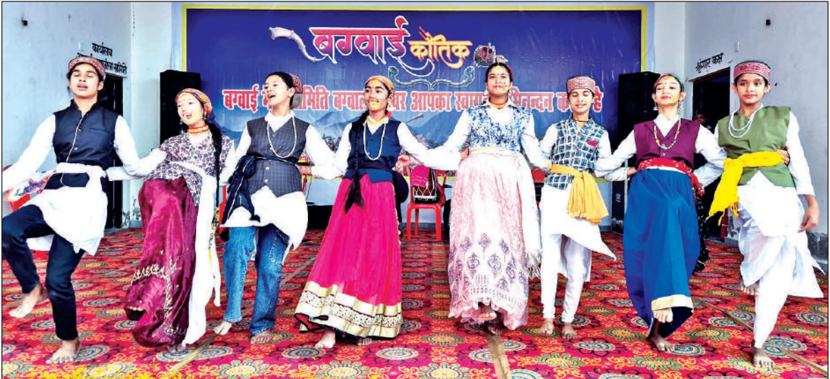
बगवाली मेले में स्कूली बच्चों ने सांस्कृतिक कार्यक्रमों की प्रस्तुति दी।