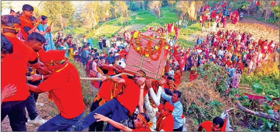
मजपीपल में मां भगवती मंदिर की ओर जाती देवी रथ यात्रा। ● अमृत विचार

मेले में मडलक, सेलपेड़, सुनकुरी, मजपीपल, कन्दुकरा, सागर, धौनी बूंगा, गुरेली, चामा, डुंगरालेटी, रौलधौन, गुडमांगल,