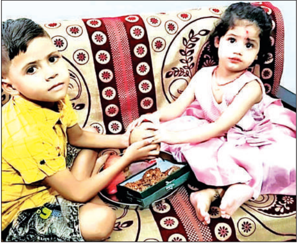
भैया दूज पर भाई को नारियल देती बहन।

एक पौराणिक कथा के अनुसार, भगवान कृष्ण नरकासुर नामक दुष्ट राक्षस का वध करने के बाद अपनी बहन सुभद्रा से मिलने गए थे। उनकी बहन ने उनका मिठाई और फूलों से गर्मजोशी से स्वागत किया। फिर उन्होंने कृष्ण के माथे पर तिलक लगाया। ऐसा माना जाता है कि यहीं से “भाई दूज” के त्योहार की शुरुआत हुई।