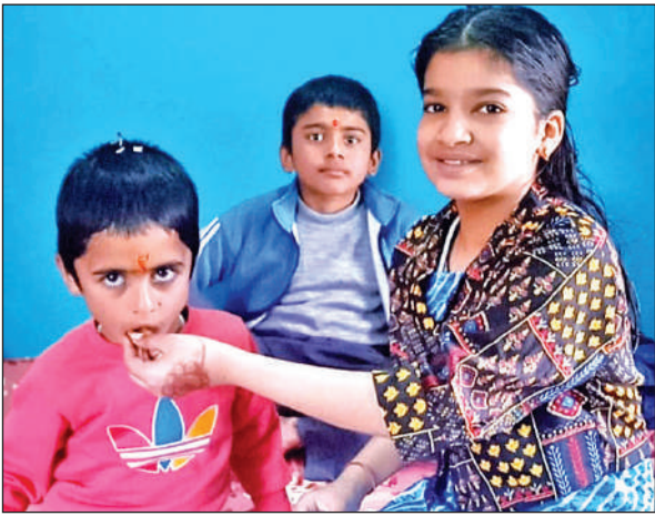
रानीखेत में भैया दूज पर बहन भैया को मिठाई खिलाते हुए। ● अमृत विचार

ने नगर के नंदादेवी, त्रिपुरासुंदरी, कालिका देवी, शीतला देवी, उल्का मंदिर, पातालदेवी, देवी मंदिर खल्याड़ी, जगदंबा दरबार, चितई मंदिर में पूजा-अर्चना की। बच्चों में भी भैया दूज पर्व को लेकर खासा उत्साह देखने को मिला।