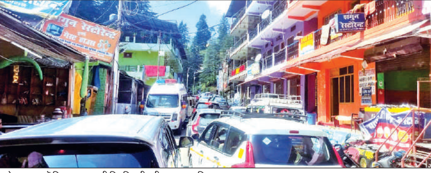
जागेश्वर धाम में दिन भर जाम की स्थिति बनी रही।