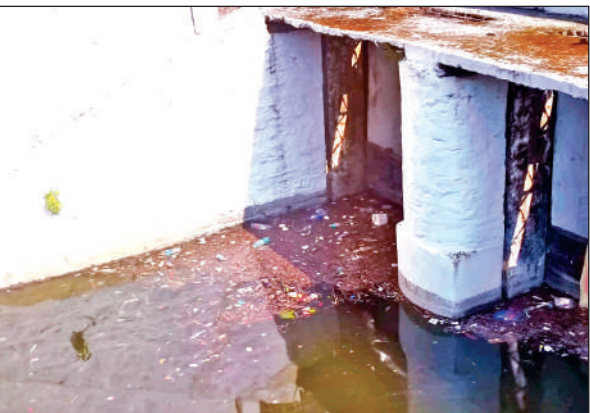
भीमताल झील में तेरती गंदगी। ● अमृत विचार

स्थानीय लोगों ने इस समस्या को कई बार झील से संबंधित अधिकारियों के समक्ष उठाया, लेकिन बजट की कमी का हवाला देकर सफाई कार्य शुरू नहीं किया गया है। वहीं विभागीय सूत्र बताते हैं कि पिछले वर्ष झील की सफाई करने वाले ठेकेदार को भुगतान नहीं किया गया, जिसके चलते वह अब सफाई के लिए तैयार नहीं है। वर्तमान स्थिति को देखते हुए