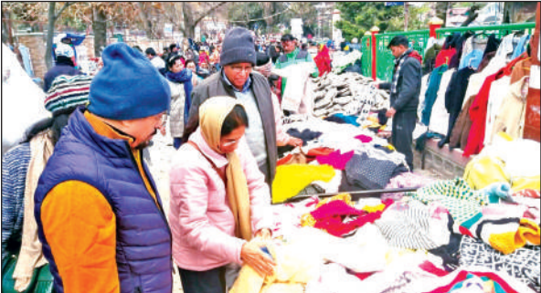
नैनीताल में गर्म कपड़ों की खरीदारी करते पर्यटक।