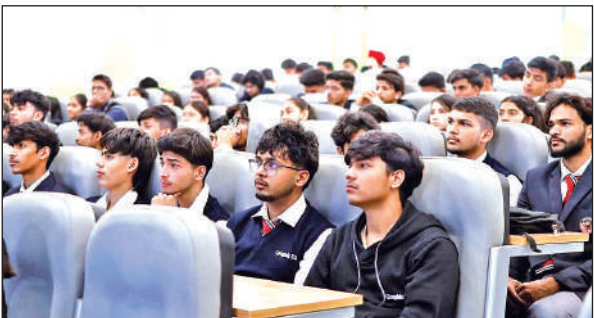
ग्राफिक एरा हिल यूनिवर्सिटी में आयोजित कार्यक्रम में मौजूद छात्र।