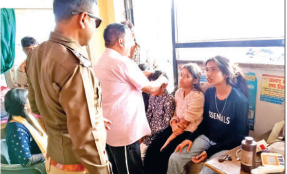
घायल का इलाज करते चिकित्सक।