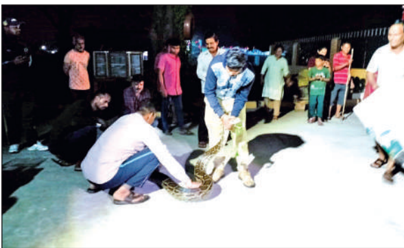
खटीमा के ऊंची महुवट गांव में अजगर को रेस्क्यू करते वनकर्मी।