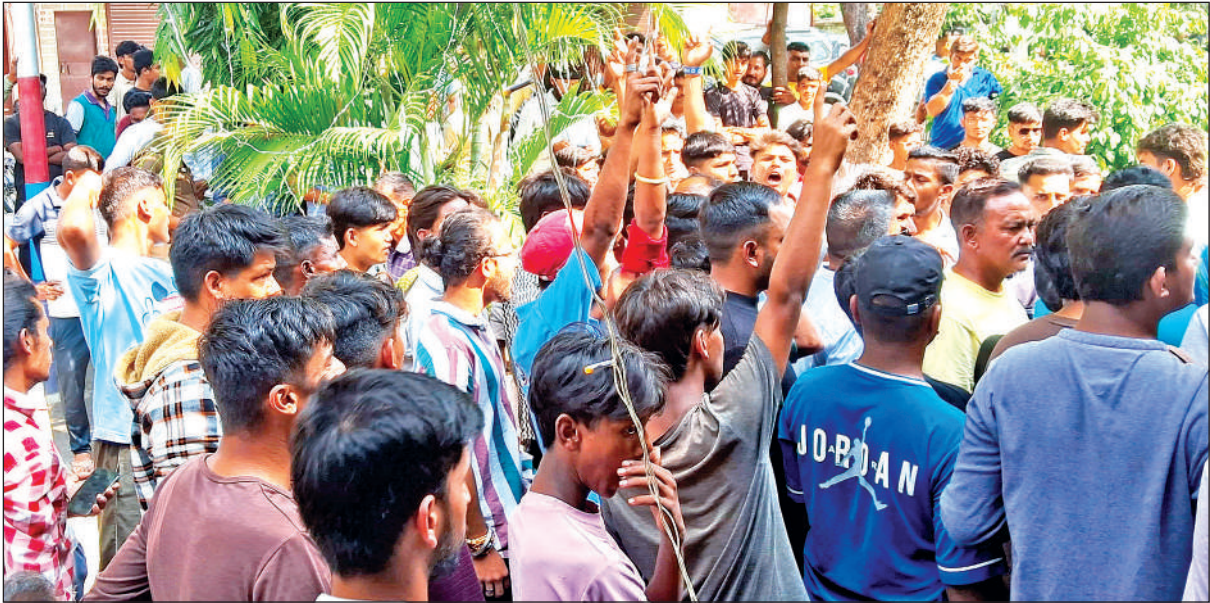
बैलपड़ाव पुलिस चौकी पर नारेबाजी करते हिंदूवादी संगठनों से जुड़े लोग।

देहरादून : राज्य स्थापना के रजत जयंती वर्ष में प्रवासी उत्तराखंडी पांच नवंबर को दून विश्वविद्यालय में जुटने जा रहे हैं। इस सम्मेलन के लिए पंजीकरण प्रक्रिया जारी है जो कि 24 अक्टूबर की देर रात्रि तक चलेगी। अभी तक विभिन्न राज्यों के 200 प्रवासियों ने अपना पंजीयन कराया है। पंजीकरण प्रवासी उत्तराखंड प्रकोष्ठ की वेबसाइट पर जाकर कराया जा सकता है। मुख्यमंत्री पुष्कर सिंह धामी के निर्देश पर प्रदेश में प्रवासी उत्तराखंडी सम्मेलन के आयोजन का सिलसिला शुरू हुआ है। वर्ष 2024 से पहला प्रवासी उत्तराखंडी सम्मेलन हुआ था, जिसमें 17 राज्यों के 200 प्रतिभागियों ने हिस्सा लिया था। इस बार इस सम्मेलन में भाग लेने वालों की संख्या बढ़ना तय है।