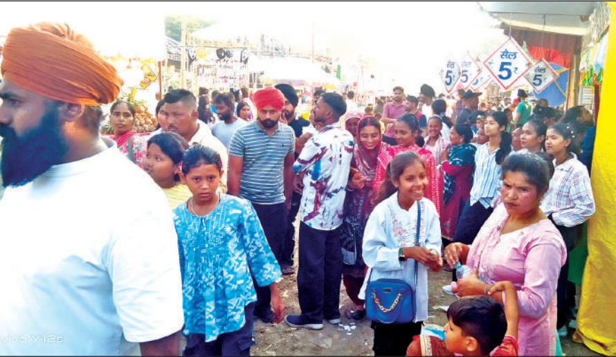
नानकमत्ता के दीपावली मेले में पहुंचे लोग। ● अमृत विचार

को रोककर उन्हें शहर के बाहरी रास्तों से जाने के लिए निर्देशित किया। जिन चालकों ने नियम का उल्लंघन करने की कोशिश की, उनके खिलाफ नियमानुसार कार्रवाई की गई और कुछ वाहनों के चालान भी काटे गए। यातायात पुलिस ने बताया कि शहर की सुगम यातायात व्यवस्था बनाए रखने के लिए यशे में गुप्तद्वारा साहिब ने मत्था टेका और प्रसाद ग्रहण किया।