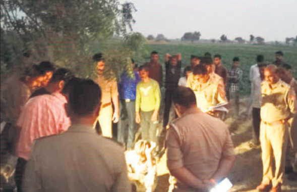
घटनास्थल पर मौजूद पुलिस।