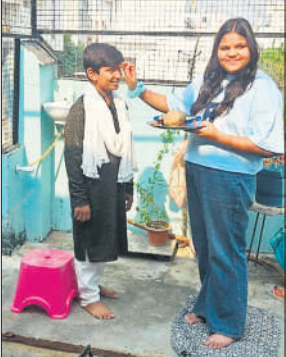
भाई दूज पर भाई का तिलक लगाती बहन।

भाई दूज को लेकर जिलेभर में खासा उत्साह दिखाई दिया। सुबह से ही बहनें तिलक की थाली तैयार करने में जुट गई थीं। बहनों ने परंपरा के अनुसार भाइयों के माथे पर तिलक लगाकर उनकी आरती उतारी। इसके बाद गोला, मिश्री और मिठाई भेंट की। भाइयों ने भी उपहार देकर बहनों को सदैव रक्षा करने का वचन दिया। बहनों ने भी भाई की लंबी उम्र के लिए