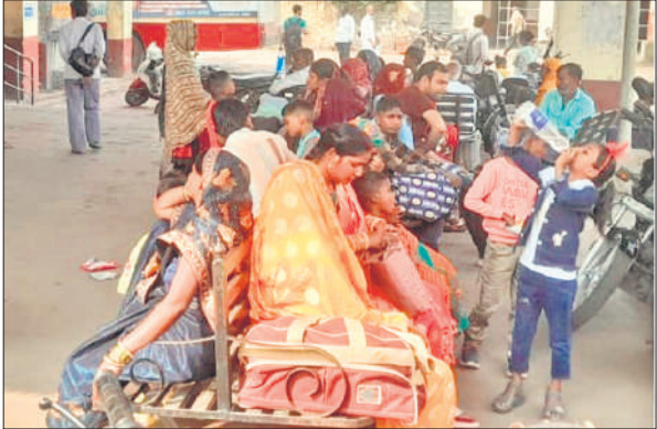
रोडवेज बस स्टैंड पर बस का इंतजार करते यात्री।

गुरुवार को भाई दूज पर सुबह से ही यात्रियों की भीड़ उमड़ पड़ी। अपने गर्तव्य तक पहुंचने के लिए बसों के इंतजार में चौराहों व बस अड्डे पर सवारियों की भीड़ दिखाई दी। बस स्टैंड पर तो यात्रियों को बसों की इंतजार में लंबा समय व्यतीत करना पड़ रहा था। बस के आगे ही चढ़ने को लेकर मारामारी मच जाती थी। आम दिनों की अपेक्षा