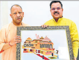
मुख्यमंत्री से भेंट करते जिलाध्यक्ष।

जिलाध्यक्ष ने मुख्यमंत्री योगी आदित्यनाथ को बदायूं जिले में पार्टी संगठन की वर्तमान स्थिति, आगामी अभियान कार्यक्रमों एवं जनसंपर्क गतिविधियों की विस्तृत जानकारी दी। साथ ही जिले में चल रहे विकास कार्यों, केंद्र एवं राज्य सरकार की जनकल्याणकारी योजनाओं के क्रियान्वयन, जनता की समस्याओं और प्रशासनिक व्यवस्था पर भी चर्चा हुई। जिलाध्यक्ष ने मुख्यमंत्री को जनपद