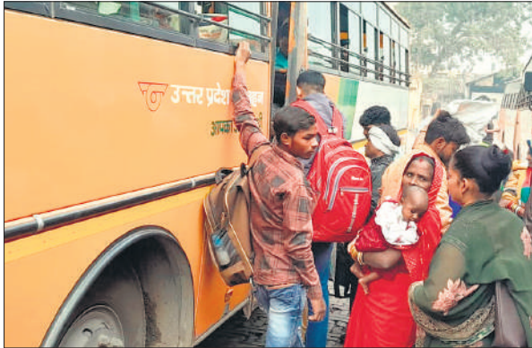
बस स्टैंड पर रोडवेज बस गेट पर लगी यात्रियों की भीड़।

भाई दूज के दिन जिले में यातायात व्यवस्था धड़ाम नजर