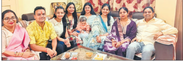
भाई दूज का पर्व मनाती बहनें।

भैया दूज को लेकर एक दिन पहले ही तैयारियां शुरू हो गई थीं। पर्व को लेकर बहनों में खासा उत्साह रहा। पर्व को लेकर बहनें पहले से ही तैयारियां शुरू कर देती हैं। इस पर्व पर बहनें भाइयों के मस्तिष्क पर तिलक कर गोला और मिश्री अर्पित करते हुए मिष्ठान खिलाती हैं। बहन-भाई द्वारा भैया दूज पर्व को सबसे अधिक महत्व