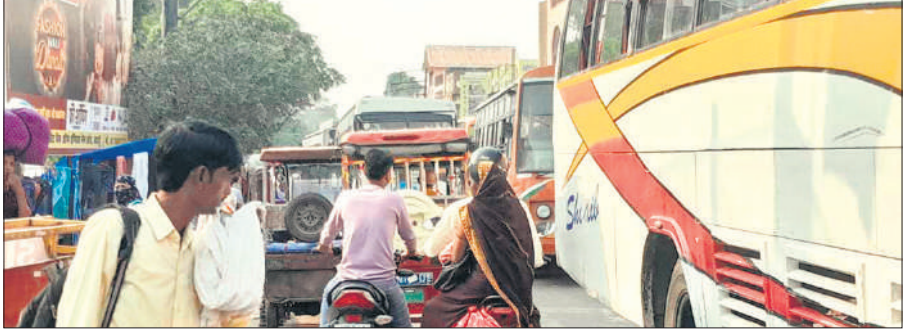
पुलिस लाइन चौराहे पर वाहनों की लगी लाइन।

अमृत विचार : नगर और ग्रामीण क्षेत्र में बृहस्पतिवार को भाई दूज का पर्व हर्षोल्लास के साथ मनाया गया। इस अवसर पर बहनों ने अपने भाइयों के माथे पर तिलक लगाकर उनकी लंबी आयु और सुख-समृद्धि की कामना की। बहनों ने पारंपरिक रीति-रिवाजों का पालन करते हुए भाइयों को तिलक