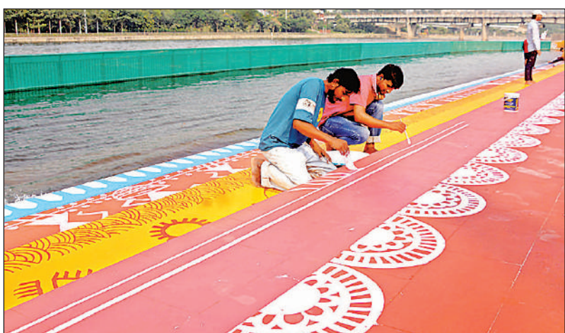
लखनऊ के लक्ष्मण मेला पार्क स्थित छठ पूजा स्थल पर रंगोली बनाते हुए आर्ट कॉलेज के छात्र।