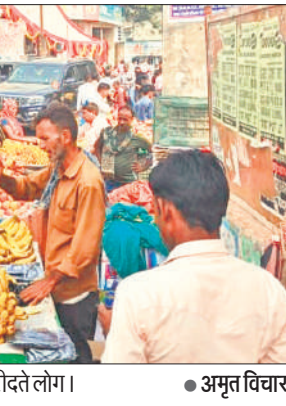
कादरचौक में चौराहे पर लगा जाम।

दिन भर वाहन रेंगते रहे। कासगंज और मथुरा से आने वाली रोडवेज की बसों को लालपुर ली ही जाम में फंसना पड़ा। कचहरी पर बसों का जाम दोपहर एक बजे लगा तो काफी देर तक वाहन रेंगते हुए आगे को निकले। जाम के चलते शहरी लोगों को दिक्कत का सामना करना पड़ा। दातागंज रोड से आने वाली बसों के कारण दातागंज चौराहे पर दो बजे तक जाम लगा र हा। हालांकि पुलिस ने कड़ी मशक्कत कर जाम खुलवाया।