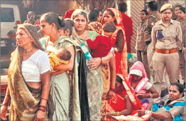
जेल गेट पर भाइयों से मुलाकात के लिए कतार में खड़ी बहनें।

जिला जेल पर बंदियों से मुलाकात के लिए 600 से अधिक पर्चीं लगी थीं। मुलाकात का सिलसिला सुबह 8 बजे से शुरू होना था, मगर जेल परिसर में सुबह छह बजे से महिलाओं ने डेरा डाल दिया। जेल प्रशासन ने बहनों को दो शिफ्टों में मुलाकात कराई। जेल के बाहर भीड़ सुबह 10 बजे के बाद