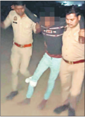
मुठभेड़ में घायल तस्करों को ले जाते पुलिसकर्मी।