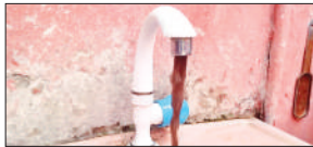
टोटी से निकलता गंदा पानी।