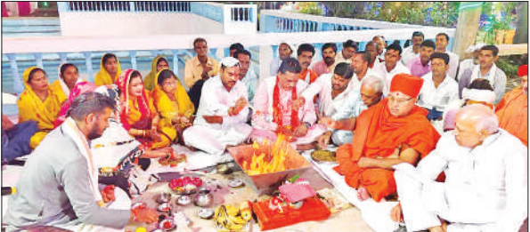
संभल के वंशगोपाल तीर्थ पर हवन पूजन करते परिक्रमा समिति के पदाधिकारी।

68 तीर्थ 19 कूपों की नगरी संभल में हर साल आयोजित होने वाली दो दिवसीय 24 कोसीय परिक्रमा यात्रा का बड़ा धार्मिक महत्व है। मान्यता है कि जो श्रद्धालु संभल के 69 तीर्थों की परिक्रमा नहीं कर पाते हैं उन्हें 24 कोसीय परिक्रमा से वहीं फल प्राप्त होता है जो 68 तीर्थों की परिक्रमा व संभल में स्थापित अन्य मंदिरों व कूपों की परिक्रमा से होता है। 24 कोसीय परिक्रमा करने से धार्मिक नगरी संभल के सभी तीर्थ व मंदिरों की परिक्रमा