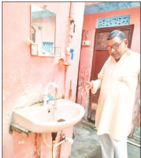
टोटी से आता रेतीला पानी दिखाते गृह स्वामी।

वार्ड-24 में करीब दर्जन भर घनी आबादी वाले मोहल्ले हैं और तीन मोहल्लों में मई 2025 से रेतीला पानी आ रहा है। टोटी खोलते ही गंदे और