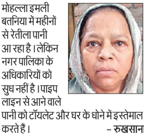
मोहल्ला इमली बतनिया में महीनों से रेतीला पानी आ रहा है। लेकिन नगर पालिका के अधिकारियों को सुध नहीं है। पाइप लाइन से आने वाले पानी को टॉयलेट और घर के बोने में इस्तेमाल करते हैं।

है और उसके साथ रेत आ रही है। स्थिति जस की तस है अमृत विचार के मोहल्ला इमली बतनिया पहुंचने पर