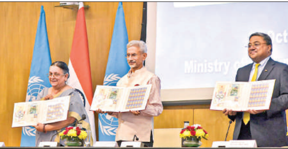
संयुक्त राष्ट्र के 80 वर्ष पूरे होने पर स्मारक डाक टिकट जारी करते हुए विदेश मंत्री।

जयशंकर ने कहा कि किसी भी सार्थक सुधार को उसकी अपनी प्रक्रिया के जरिए ही रोका जा रहा है। उन्होंने कहा कि संयुक्त राष्ट्र को बनाए रखना तथा इसके पुनर्निर्माण की मांग करना स्पष्ट रूप से विश्व के समक्ष एक बड़ी चुनौती है।