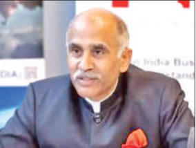
● दो राष्ट्र समाधान से ही इजराइल-फलस्तीन में स्थायी शांति : भारत