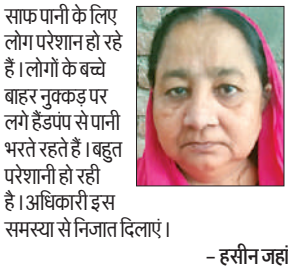
साफ पानी के लिए लोग परेशान हो रहे हैं। लोगों के बच्चे बाहर नुकड़ पर लगे हैंडपंप से पानी भरते रहते हैं। बहुत परेशानी हो रही है। अधिकारी इस समस्या से निजात दिलाएं।