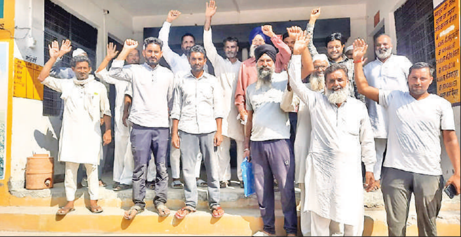
बिजारखाता मानपुर सहकारी समिति में प्रदर्शन करते किसान।