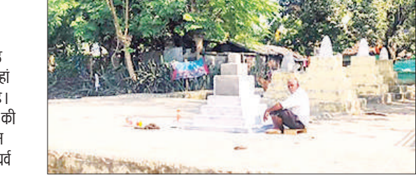
छठ मईया पर रंग करता मजदूर।