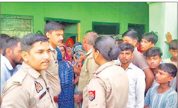
गुन्नाौर के रायपुर गांव में विवाहिता की मौत के बाद इकट्ठा भीड़ व जांच करती पुलिस।

● दीपावली के बाद मायके के आते समय हुआ था पति-पत्नी के बीच विवाद