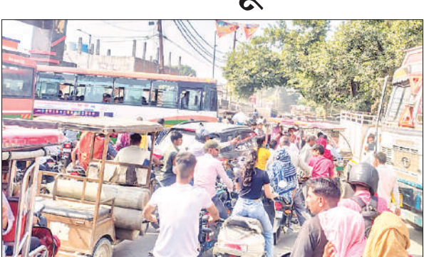
चंदौसी में मालगोदाम रोड पर जाम में फंसे वाहन।

पिछले कुछ समय से नगर में सुबह से ही जाम की समस्या उत्पन्न हो जाती है। जिससे स्कूली बच्चों को सबसे अधिक समस्या का सामना करना पड़ता है। बच्चे स्कूल देर से पहुंचते हैं और छुट्टी के समय जाम है। जाम का कारण व्यापारियों द्वारा अपनी दुकानों के आगे सामान रख कर अतिक्रमण करना भी है। जिससे बाजारों की सड़के और भी संकरी हो जाती हैं और जाम की स्थिति पैदा होती है। नगर में जाम की समस्या से