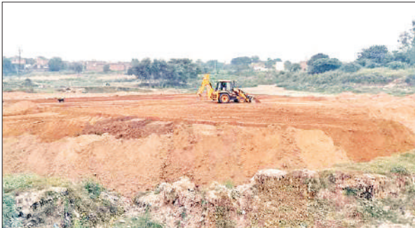
सिरसी में तालाब की भूमि पर किये पटान को समतल करती जेसीबी।