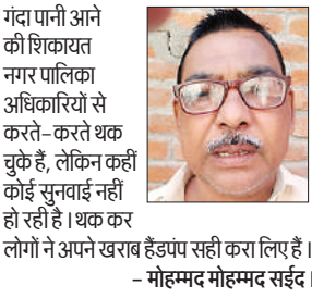
गंदा पानी आने की शिकायत नगर पालिका अधिकारियों से करते-करते थक चुके हैं, लेकिन कहीं कोई सुनवाई नहीं हो रही है। थक कर लोगों ने अपने खराब हैंडपंप सही करा लिए हैं।

माह से लोग पालिका के अधिकारियों से शिकायत करते-करते थक चुके हैं। कई बार बोलतों में रेतीला और काला पानी लेकर पालिका पहुंचे और अधिकारियों को पानी के साथ रेत आने के बारे में बताया। अधिकारियों ने लोगों को आश्वासन दिया कि शीघ्र ही समस्या का समाधान करा दिया जाएगा, लेकिन पानी साफ नहीं हुआ