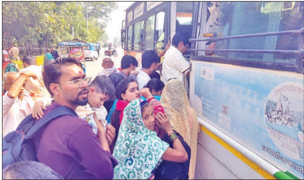
बसों में चढ़ने का प्रयास करती सवारी।

महिलाओं से लेकर बच्चे नई पोशाक पहनते हैं। इसके अलावा पूजा के दिन आतिशबाजी भी होती है। चार दिन चलने वाले इस पर्व