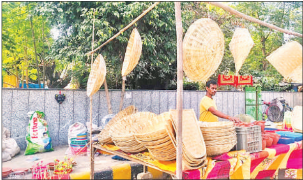
छठ के मौके पर दुकान पर रखा सूप।