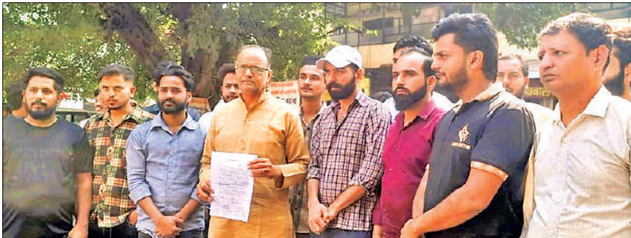
भाजपा नेता के नेतृत्व में वरिष्ठ पुलिस अधीक्षक को ज्ञापन देने पहुंचे संचालक।

शुक्रवार को कांठ रोड पर सुबह सुबह तेज रफ्तार से स्कूली बच्चों स्कूल छोड़ने जा रहे स्कूली वाहन बेहद खटारा हालत में दिखाई दिए। जिनमें कुछ वाहनों की बाँड़ी तक कई जगह से फटी थी और स्कूली बसें काला धुआं उगल रही थीं। कई वाहन पुराने और खराब हालत के हैं, जिनमें बाहरी बाँड़ी को चकमकर अंदर के पार्ट्स असुरक्षित है। जिसमें ऐसे वाहनों कभी आगजनी जैसी घटनाएं होना स्वाभाविक है।संभागीय परिवहन विभाग इस स्थिति की अनदेखी कर रहा है। नियमों के अनुसार बच्चों के परिवहन के लिए वाहनों को मानक के अनुरूप किया के स्कूलों पर कार्रवाई से बचता नजर आ रहा है।