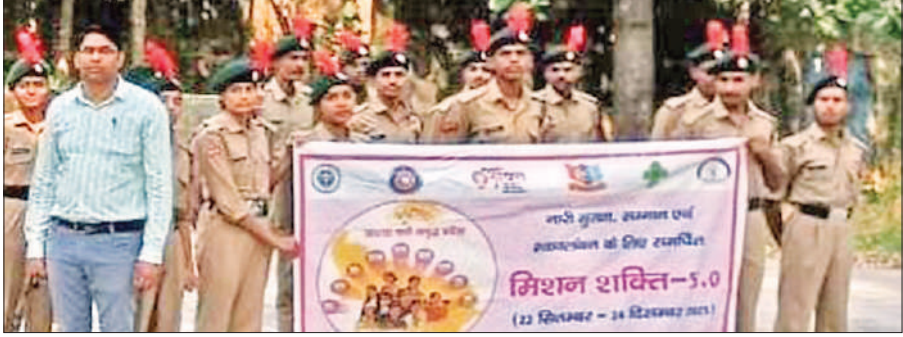
कॉलेज परिसर में जागरूकता रैली निकालते एनसीसी कैडेट्स।