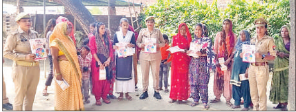
पंपलेट दिखाती महिला सिपाही एवं ग्रामीण।