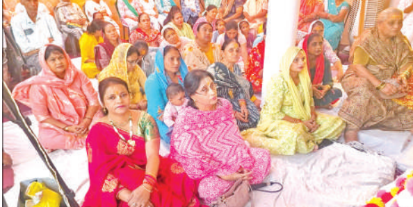
हरथला स्थित शिव मंदिर में भागवत कथा सुनते श्रद्धालु।