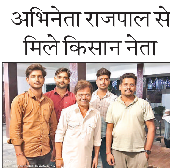
अभिनेता राजपाल के साथ किसान नेता।

मुख्य बाजार से गुजरती हुईं देर रात रामलीला मैदान पर संपन्न हुईं। बरात में भगवान श्रीराम दरबार, भस्म आरती झांकी, काली अखाड़ा सहित कई धार्मिक और सांस्कृतिक झांकियां शामिल थीं, जिन्हें देखकर