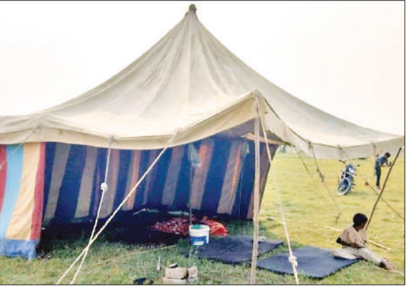
ककोड़ा मेला स्थल पर लगा तंबू।

अमृत विचार : मंडल का मिनी कुंभ मेला ककोड़ा अब रात को रोशनी में नहाएगा। मेला प्रशासन ने आज मेला स्थल पर बिजली पहुंचा दी। जिससे पूरा मैदान रोशन होगा। मेला स्थल पर दुकानें सज रही हैं। मिट्टी के चूल्हे बिकने लगे हैं। मेले में अस्थायी कोतवाली अब 28 अक्टूबर को पहुंचेगी। शुक्रवार को जिला प्रशासन की सख्ती के बाद बिजली विभाग सक्रिय हो गया। मेला स्थल पर खम्बे लगा कर लाइन खींच दी गई। जबकि अन्य स्थानो पर भी दो दिन में बिजली पहुंच जाएगी। आज मेला स्थल पर बिजली विभाग ने आधा दर्जन खंबे लगा कर बिजली पहुंचा दी है। जिससे अब रात को बिजली की रोशनी में दुकानदार अपनी दुकान से लगा सकेंगे। जिला पंचायत प्रशासन के अनुसार फिलहाल कुछ जगहों पर ही खंबे