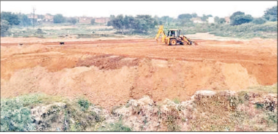
सिरसी में तालाब की भूमि पर किये पटान को समतल करती जेसीबी।

सिरसी में रेलवे क्रासिंग के निकट सिंघा तालाब और दमदमा तालाब का पिछले कुछ दिनों से दिन रात पटान किया जा रहा है। हालात यह हैं कि तालाबों को समतल करने का काम अंतिम दौर में हैं। इन्हीं दोनों तालाबों में न सिर्फ सिरसी बल्कि आसपास के कई गांव का पानी इकट्ठा होता रहा है। तालाब पटान के खिलाफ