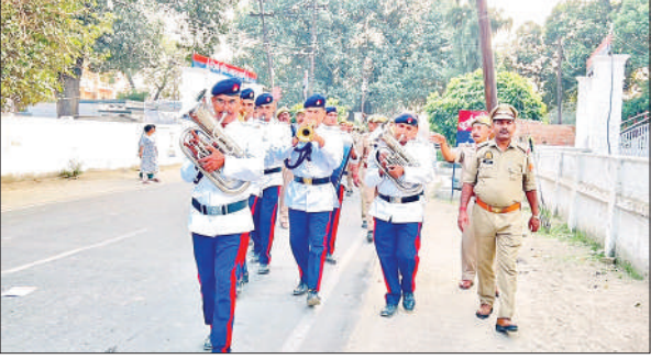
शहीद पुलिसकर्मियों की याद में बैंड वादन करते पुलिसकर्मी।