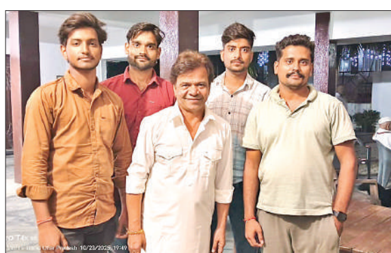
अभिनेता राजपाल के साथ किसान नेता।