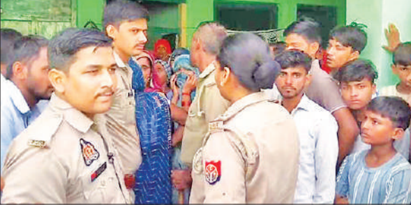
गुन्नौर के रायपुर गांव में विवाहिता की मौत के बाद इकट्ठा भीड़ व जांच करती पुलिस।