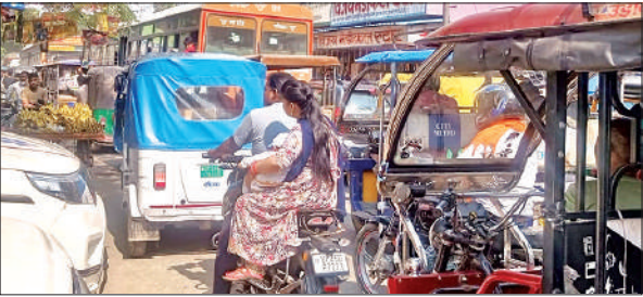
जिला अस्पताल के सामने लगा जाम।

दिल्ली सहस्रवान कासगंज से आने वाली रोडवेज की बसें कलेक्ट्रेट चौराहे से रोडवेज की ओर निकली तो जिला अस्पताल के सामने जाम में