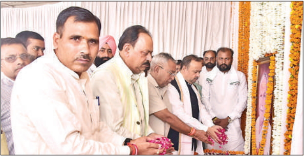
विधायक के पिता को श्रद्धांजलि अर्पित करते सहकारिता मंत्री।