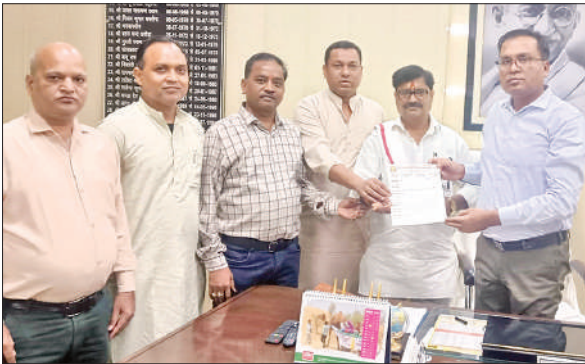
डीएम को ज्ञापन सौंपते उद्योग व्यापार प्रतिनिधि मंडल के पदाधिकारी ।