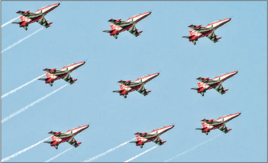
भारतीय वायु सेना (आईएफए) की सूर्य किरण एरोबैटिक टीम (एसकेएटी) शुक्रवार को गुजरात के मेहसाणा में हवाई अड्डे के ऊपर युद्धाभ्यास करती हुई।