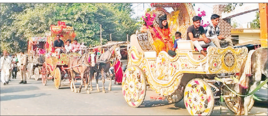
निगोही में रामलीला शुभारंभ पर निकली शिव बरात में शामिल आकर्षक झांकियां।