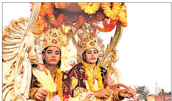
श्रीराम बरात में सजी झांकी।