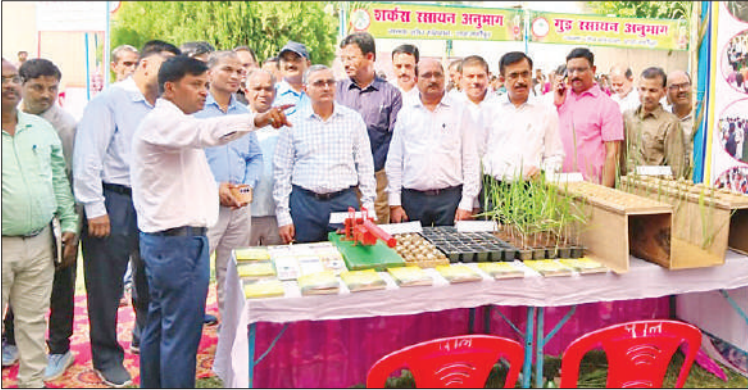
संगोष्ठी में लगे स्टाल का निरीक्षण करते अधिकारी।