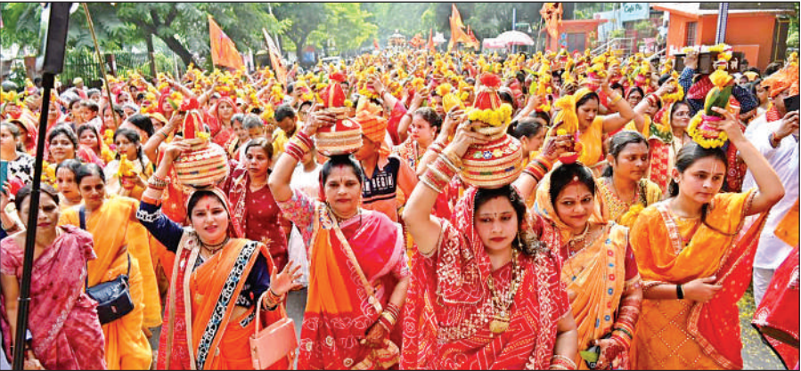
मोतीझील में कथा शुरु होने से पहले कलश यात्रा में महिलाओं ने बढ़-चढ़कर भाग लिया।

बोर्ड आवश्यक नहीं है, तो फिर हम तिरुपति बालाजी के प्रसाद में हो रही मिलावट को क्यों नहीं रोक पाए? जब धर्मस्थलों पर भी प्रशासनिक हस्तक्षेप और कुप्रबंधन देखने को