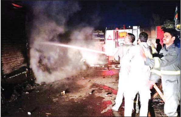
आग पर काबू पाने की मशवकत में लगे दमकल कर्मी।