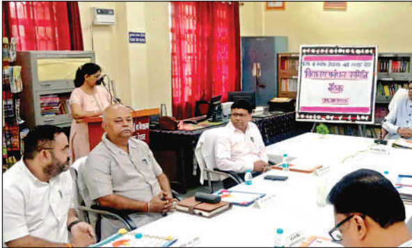
प्रबंध समिति की बैठक के दौरान डीएम ने दिए अहम निर्देश।