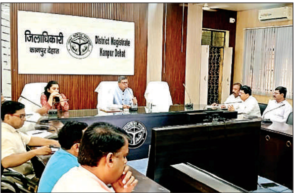
ओटीडी सेल की बैठक में डीएम ने की आंकड़ों की समीक्षा।