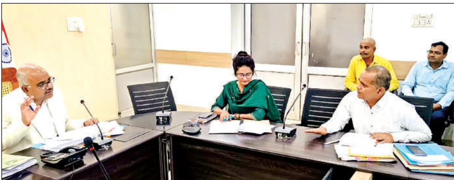
कलेक्ट्रेट सभागार में शुक्रवार को डीएम की मौजूदगी में लाभार्थियों की चयन प्रक्रिया पूरी की गई।