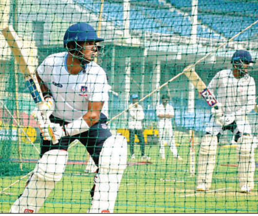
शुक्रवार को ग्रीन पार्क में राजाजी मुकाबले के लिए नेट पर प्रैक्टिस करते खिलाड़ी।