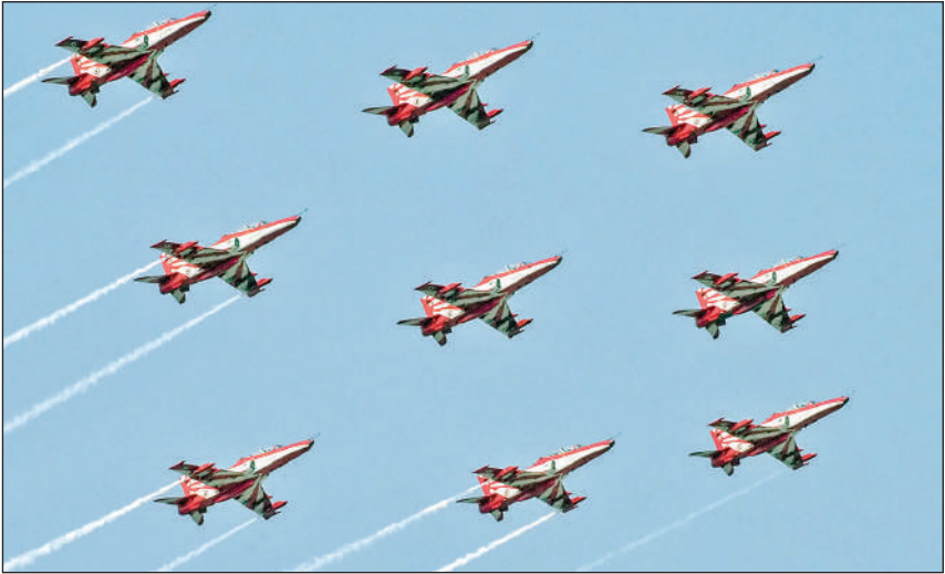
अहमदाबाद । भारतीय वायु सेना (आईएफ) की सूर्य किरण एरोबैटिक टीम (एसकेएटी) शुक्रवार को गुजरात के मेहसाणा में हवाई अड्डे के ऊपर युद्धाभ्यास करती हुई ।

अमेरिका और रूस के बीच तनाव एक पुरानी समस्या है, जो हाल के वर्षों में और भी बढ़ गई है। यूक्रेन पर रूस के हमले के बाद से अमेरिका और उसके सहयोगी देशों ने रूस पर कई आर्थिक प्रतिबंध लगाए हैं। जिनमें रूस के तेल और गैस क्षेत्र को निशाना बनाना शामिल है। हाल ही में, अमेरिका ने रूस की दो बड़ी तेल कंपनियों, रोसनेफ्ट और लुकोइल पर प्रतिबंध लगाए हैं। अमेरिका चाहता है कि भारत भी रूस से तेल खरीदना बंद कर दे और उसके साथ व्यापारिक संबंधों को रूसीत करे।