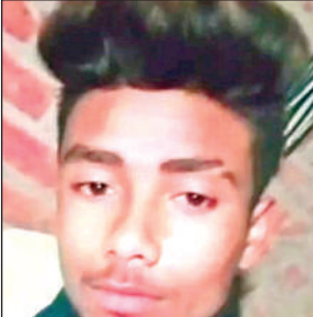
ओमजी (फाइल फोटो)।

परिजनों पुलिस को घटना के बारे में जानकारी दी। मौके पर मौके पर पहुंची थाना पुलिस के साथ फोरेंसिक टीम ने साक्ष्य संकलित किए। इसके बाद शव को पोस्टमार्टम के लिए भेजा गया।