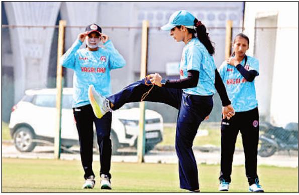
अभ्यास करती नागालैंड और मिजोरम की खिलाड़ी।

पहले दिन नहाय-खाय पर शनिवार को श्रद्धालु स्नान कर शुद्ध सात्विक भोजन ग्रहण करेंगे। दूसरे दिन खरना पर निर्जला उपवास रखेंगे और शाम को गुड़ की खीर व रोटी का प्रसाद ग्रहण करेंगे। 27 अक्टूबर को तीसरे दिन इबूते सूर्य को अर्घ्य दिया जाएगा। सूर्यास्त का समय 5:27 बजे रहेगा। 28 अक्टूबर को चौथे दिन सुबह 6:13 बजे उगते सूर्य को अर्घ्य देने के साथ व्रत पूर्ण हो जाएगा। ये व्रत अत्यंत कठोर माना जाता है और परिवार की सुख-समृद्धि तथा संतान की दीर्घायु के लिए किया जाता है। भगवान सूर्य को ठेकुआ, मालपुआ, फल, चावल के लड्डू और नारियल अर्पित किया जाता है।