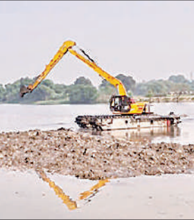
नदी से सिल्ट निकालती जेसीबी।