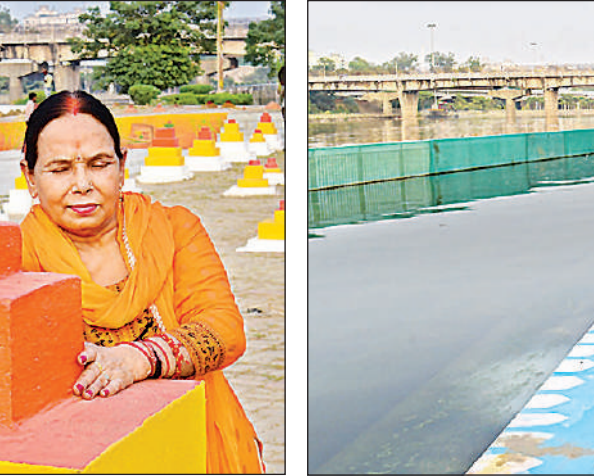
छह महापर्व के लिए घाट पर बनाई गई वेदी के पास खड़ी महिला और पेंट से चित्र बनाकर सजाई गई गोमती नदी के घाट की सीढ़ियां।