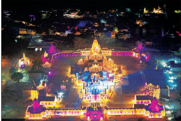
रोशनी से जगमगाता राम मंदिर।

राम जन्मभूमि मंदिर में 21 नवंबर से ध्वजारोहण अनुष्ठान प्रारंभ हो जाएगा और 25 नवंबर को