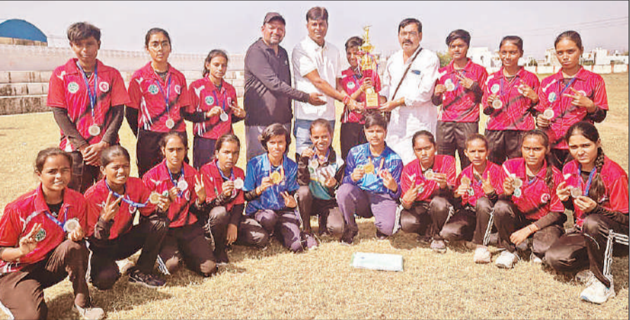
सब जूनियर नेशनल टेनिस बाल क्रिकेट प्रतियोगिता की उप विजेता टीम को खिताब देते अतिथि।