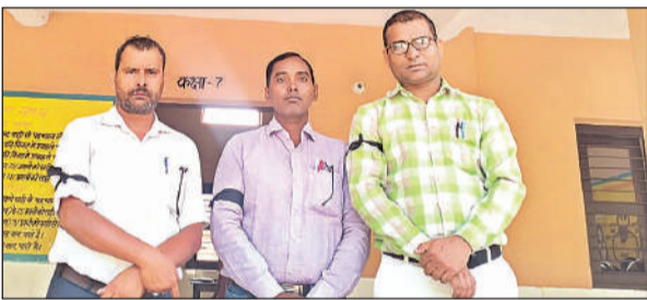
पूर्व मावि विद्यालय गौहनना में काली पट्टी बांधकर कार्य करते शिक्षक।