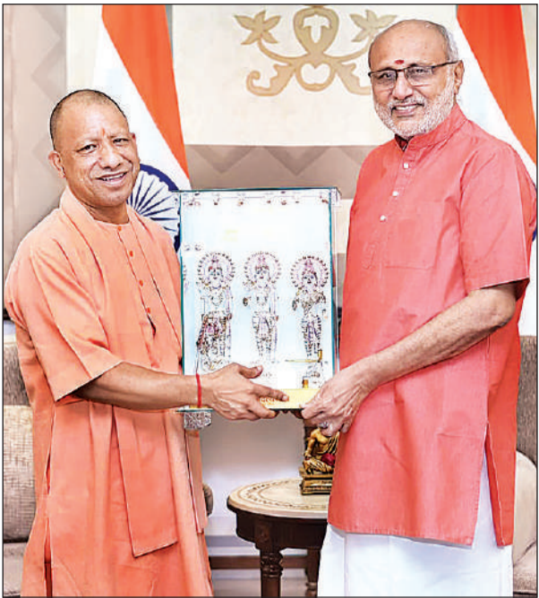
नई दिल्ली स्थित राष्ट्रपति भवन में राष्ट्रपति द्रौपदी मुर्मू और उप राष्ट्रपति सीपी राधाकृष्णन से उनके आवास पर शिष्टाचार भेंट करते मुख्यमंत्री योगी आदित्यनाथ।