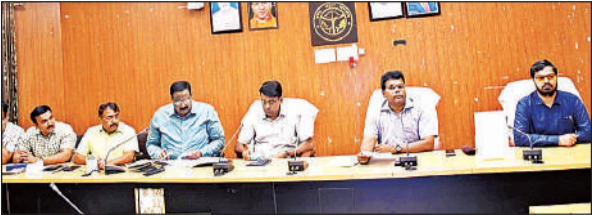
समीक्षा बैठक जिलाधिकारी व मौजूद अन्य अधिकारी।

बैठक में जिलाधिकारी ने आईजीआरएस की शिकायतों के निस्तारण में असंतुष्ट फीडबैक मिलने पर प्रत्येक तहसीलों के 05-05 प्रकरणों एवं अन्य विभागों के प्रकरणों की समीक्षा की। जिलाधिकारी ने निर्देश दिया कि किसी भी शिकायतकर्ता के प्रकरण राजस्व विभाग से सम्बंधित है तो लेखपाल, कानूनगों की रिपोर्ट