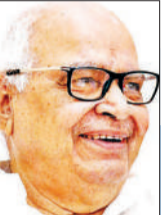
हृदय नारायण दीक्षित पूर्व विधानसभा अध्यक्ष उत्तर प्रदेश

डेंगू, कोरोना आदि बताया था। संघ 100 साल का हो चुका है। इस अवधि में संघ ने सारी दुनिया में विशेष प्रतिष्ठा हासिल की है। संघ का मूल आधार हिंदुत्व है। सर्वोच्च न्यायपीठ ने हिंदुत्व को भारत की जीवन पद्धति बताया था। हिंदुत्व किसी रीतिजन या उपासना पद्धति का नाम नहीं है। भारत में सुदीर्घ काल से चली आ रही संस्कृति और उस पर आधारित जीवन पद्धति का नाम है हिंदुत्व। संघ इसी विचारधारा को लेकर राष्ट्र निर्माण के कार्य में जुटा हुआ है। संघ ने पूरे देश में हिंदुत्व का वातावरण बनाने में सफलता पाई है। यह बात छद्म सेकुलरवादियों को खलती है। सेकुलर भारतीय विचार नहीं है। यह विचार यूरोप से आया था। सेकुलर शब्द का अर्थ इहलोकवादी, प्रत्यक्ष, भौतिक और सांसारिक होता है। इसका अर्थ है इस संसार में जो कुछ भी भौतिक दिखाई पड़ रहा है, वही सही है। इस विचार के अनुसार हिन्दू आस्था गैर सेकुलर है। ईश्वर प्रत्यक्ष नहीं होता। सेकुलरवाद की परिभाषा में ईश्वर भी सेकुलर नहीं है। संघ दुनिया का सबसे बड़ा सांस्कृतिक संगठन है। संघ भी सेकुलरवाद के चरमे में सांप्रदायिक है, लेकिन घोर सांप्रदायिक कट्टरपंथी मुस्लिम लीग, एआईएमआईएम सेकुलर हैं। ईसाईयत और इस्लामी विश्वास भी सेकुलर हैं। कायदे से दोनों