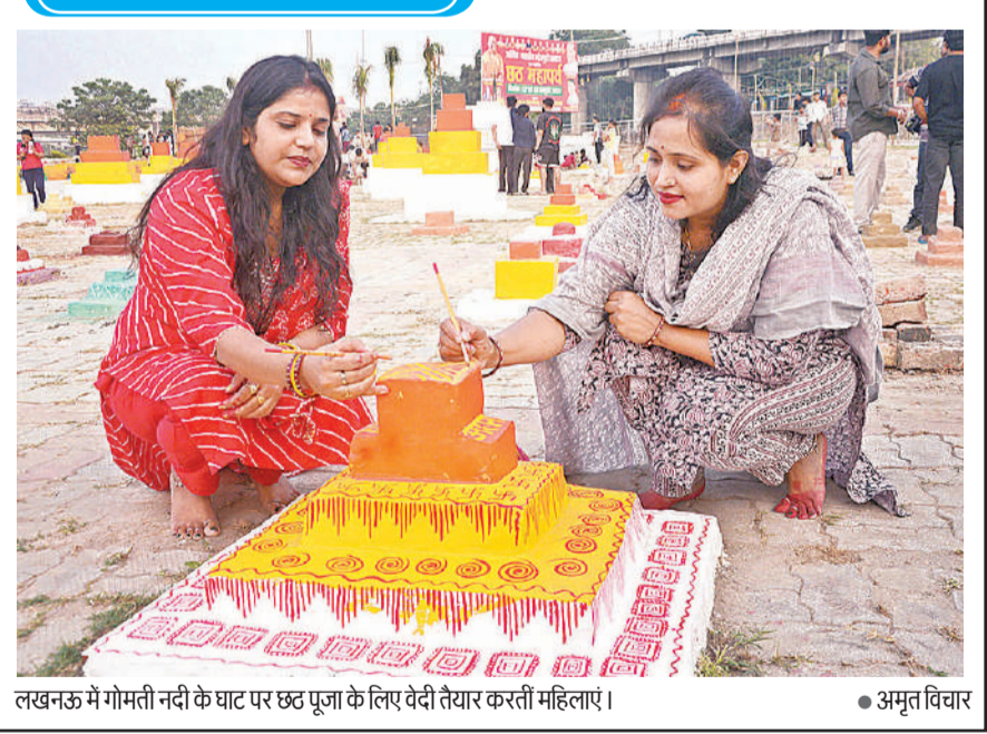
लखनऊ में गोमती नदी के घाट पर छठ पूजा के लिए वेदी तैयार करती महिलाएं।