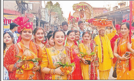
निशान एवं शोभा यात्रा में शामिल श्रद्धालु।

छपिया : मसकनवा बाजार पर स्थापित गणेश लक्ष्मी की प्रतिमाएं शुक्रवार को कड़ी सुरक्षा के बीच पिपरी घाट के मनोरमा नदी में विसर्जित की गयीं। कई जगह भंडारे का आयोजन किया गया। कस्बे के सब्जी मंडी, गल्ला मंडी, नवयुवक कमेटी, नव दुर्गा नई देवी स्थान, महजनी टोला में गणेश लक्ष्मी की मूर्तियों सजाई गईं। कस्बे में गणेश लक्ष्मी की मूर्तियों की शोभा यात्रा निकाली गयी। शोभा यात्रा अमरुली बाग, इलाहाबाद बैक, रामजानकी मंदिर,स्टेट बैंक, सब्जी मंडी, चौक, चौराहा, चिक मंडी, खालेगांव, पटखौली, शीतलगंज होते हुये पिपरीही पहुंची मनोरमा के तट पर मूर्तियों का पूरे पारम्परिक ढंग से विसर्जन किया गया।