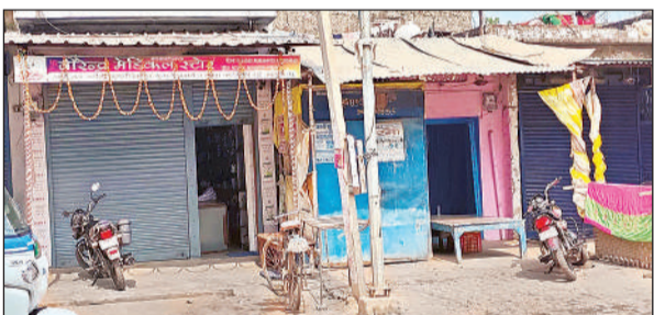
महंत के निधन पर शनिवार को बंद रहा बाबागंज बाजार।

मिशन शक्ति 5.0 के अंतर्गत महिलाओं एवं बालिकाओं को सुरक्षा, सम्मान एवं स्वावलंबन के प्रति जागरूक किया गया। पुलिस अधीक्षक ने कहा कि महिलाएं समाज की रीढ़ हैं। उन्होंने महिलाओं को किसी भी प्रकार की हिंसा, उत्पीड़न या भेदभाव की स्थिति में तुरंत पुलिस या हेल्पलाइन सेवाओं पर संपर्क करने के लिए प्रेरित किया।