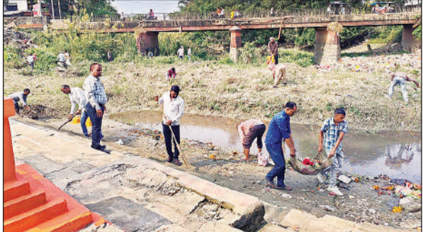
इटियाथोक में बिसुही घाट की सफाई करते कर्मचारी।

अमृत विचार : छठ पूजा को लेकर जिला प्रशासन तैयारियों में जुट गया है। इसको लेकर कलेक्ट्रेट परिसर में इमरजेंसी ऑपरेशन सेंटर की स्थापना की गयी है। यह सेंटर किसी भी प्रकार की आपात स्थिति में तत्काल सहायता पहुंचाने का काम करेगा और आपदा या दुर्घटना की सूचना पर तत्काल कार्रवाई सुनिश्चित करेगा। इस केंद्र में जिला प्रशासन, पुलिस, स्वास्थ्य, अग्निशमन, नगर पालिका, विद्युत, जल निगम, आपदा प्रबंधन सहित सभी संबंधित विभागों के अधिकारी एवं कर्मचारी समन्वय के साथ कार्य