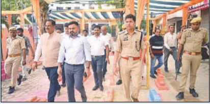
घाट का निरीक्षण करते जिलाधिकारी व पुलिस अधीक्षक।