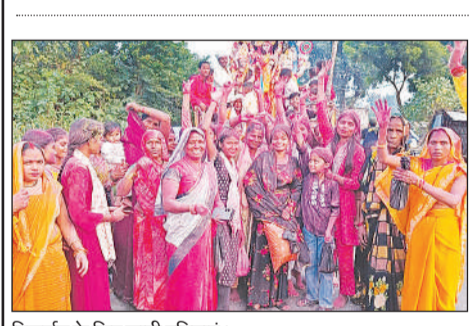
विसर्जन के लिए जाती प्रतिमाएं।

गोंडा : शनिवार को जिले के सभी थानों पर थाना समाधान दिवस का आयोजन किया गया। कोतवाली नगर में जिलाधिकारी प्रियंका निरंजन ने जनसुनवाई की। सुनवाई के दौरान कुल 9 प्रार्थना पत्र प्राप्त हुए जिसमें से 2 प्रार्थना पत्रों का मौके पर निस्तारण कर दिया गया है। शेष प्रार्थना पत्र का समय सीमा के अंदर निस्तारित कर दिया जाएगा। जिलाधिकारी ने उपस्थित सभी शिकायतकर्ताओं से उनकी समस्याएं सुनीं और संबंधित अधिकारियों को प्रत्येक प्रकरण का गंभीरता से परीक्षण कर गुणवत्तापूर्ण निस्तारण करने के निर्देश दिए। एसपी विनीत जायसवाल ने धानेपुर थाने पर पहुंचकर फरियदियों की शिकायतें सुनीं। धानेपुर में जनसुनवाई के दौरान 8 शिकायती प्रार्थना पत्र प्राप्त हुए। तरबंग थाने पर कुल 11 शिकायतें प्राप्त हुईं, लेकिन किसी का भी निस्तारण नहीं हो सका।