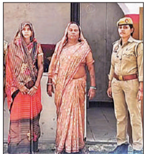
पुलिस की गिरफ्त में आरोपी सास व देवरानी।