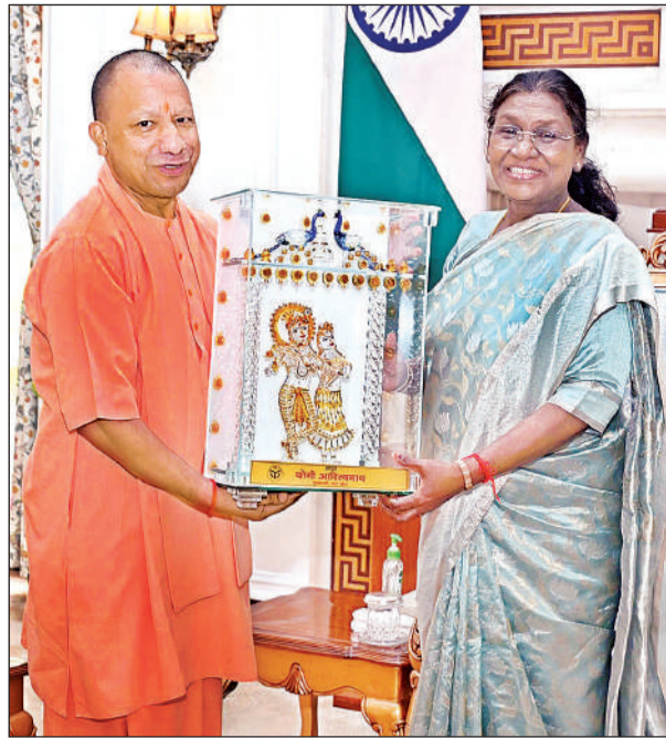
नई दिल्ली स्थित राष्ट्रपति भवन में राष्ट्रपति द्रौपदी मुर्मू और उप राष्ट्रपति सीपी राधाकृष्णन से उनके आवास पर शिष्टाचार भेंट करते मुख्यमंत्री योगी आदित्यनाथ।