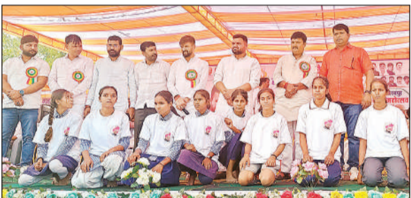
प्रतिभागियों के साथ मुख्य अतिथि सांसद करण भूषण सिंह।