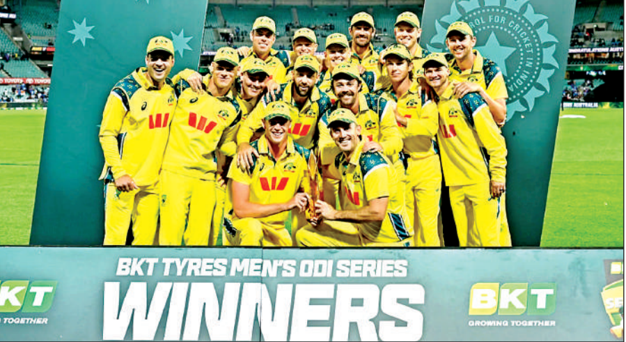
एकदिवसीय श्रृंखला जीतने के बाद ट्रॉफी के साथ जश्न मनाते ऑस्ट्रेलियाई खिलाड़ी।

इससे पहले तेज गेंदबाज हर्षित राणा ने अपने करियर का सर्वश्रेष्ठ प्रदर्शन करते हुए 39 रन देकर चार विकेट लेकर अपनी क्षमता का परिचय दिया जिससे आस्ट्रेलिया की टीम 46.4 ओवर में 236 रन पर सिमट गई। उसकी तरफ से मैट