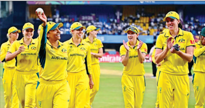
दक्षिण अफ्रीका को हराने के बाद विजयी मुद्रा में पेवेलियन लौटती ऑस्ट्रेलियाई खिलाड़ी।