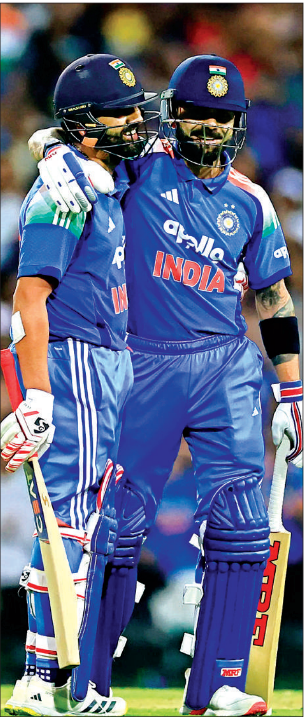
रोहित शर्मा को शतक लगाने की बधाई देते विराट कोहली।