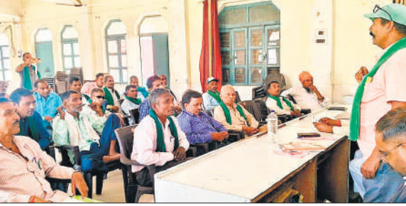
अमरिया ब्लॉक में पंचायत करते भाकियू भानु कार्यकर्ता।