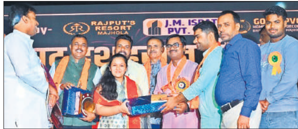
विजेताओं को पुरस्कृत करते अतिथि।