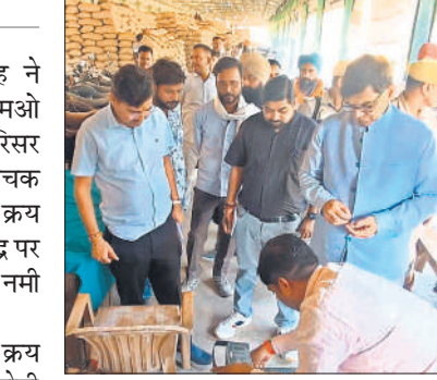
धान की नमी चेक कराते डीएम ज्ञानेंद्र सिंह।

केंद्र प्रभारियों को निर्देश दिए कि क्रय केंद्रों किसानों को परेशानी नहीं होनी चाहिए। उन्होंने किसानों से भी टोकन सिस्टम से अपने धान तुलवाने की अपील की। मंडी सचिव नाजिम को निर्देश दिए कि मंडी में क्रय केंद्रों पर जो भी किसान अपना धान लाता है। उसके धान की नमी यंत्र द्वारा मंडी गेट पर मापने के बाद ही केंद्र पर उतारा जाए। इसके अतिरिक्त उन्होंने मंडी में स्थित धान क्रय केंद्रों के प्रभारी जो भी समय से नहीं आते हैं उनके विरुद्ध कड़ी कार्रवाई की भी चेतावनी दी। उन्होंने केंद्रों पर मौजूद किसानों से वार्ता कर सुविधाओं