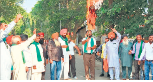
पूरनपुर मंडी सचिव का पुतला फूंकते भाकियू के पदाधिकारी।

बता दें पूरनपुर मंडी सचिव पर पूर्व से ही धान खरीद में खेल कराने समेत भ्रष्टाचार के आरोप किसान नेता लगा रहे हैं। जिसे लेकर बीते दिनों काफी हंगामा भी हुआ था। भाकियू चढ़नी के नेताओं ने मंडी समिति पूरनपुर के सचिव का पुतला फूंका। जिलाध्यक्ष का कहना था कि मंडी सचिव पूरनपुर का पुतला फूंका गया है जो लंबे समय से ये तैनात है। इन पर कई अन्य मंडियों की भी