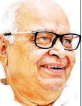
हृदय नारायण दीक्षित पूर्व विधानसभा अध्यक्ष उत्तर प्रदेश

विश्वासों में ईश्वर हैं और जहां ईश्वर है विश्वास है वे सेकुलरवादी नहीं हो सकते, लेकिन छद्म सेकुलरवाद में इस्लामी ईसाई विश्वास सेकुलर हैं। यहां सभी सांस्कृतिक प्रतीक सांप्रदायिक हैं। सरस्वती वंदना भी सांप्रदायिक है। इस्लामी परंपरा के रोजा आदि कार्यक्रमों में राजनेताओं का सम्मिलित होना सेकुलर है। श्रीराम जन्मभूमि सहित सभी आस्था केंद्रों में जाना गैर सेकुलर है और सांप्रदायिकता है। इन्हीं सेकुलरवादियों ने अंतर्राष्ट्रीय स्तर पर चर्चित योग को भी सांप्रदायिक बताया था। राष्ट्रीय स्वयंसेवक संघ की देशभक्ति संस्कृति प्रियता और काम करने की सामान्य पद्धति बहुत लोकप्रिय है। उसके कार्यकर्ता देश और विचार के लिए अपना करियर छोड़ देते हैं। मातृभूमि के लिए किसी भी सीमा तक जाने की भावना रखते हैं। कांग्रेस को संघ अच्छा नहीं लगता। प्रधानमंत्री श्रीमती इंदिरा गांधी ने प्रधानमंत्री रहते हुए संघ का घोर विरोध किया था। उन्होंने 1975 के आपातकाल के साथ संघ पर प्रतिबंध भी लगाया था। संघ के हजारों कार्यकर्ताओं को लंबी अवधि तक जेल में डाल दिया था, जो जेल नहीं जा सके, उनका भी व्यापक उत्पीड़न हुआ था। कांग्रेस संघ विरोधी है।