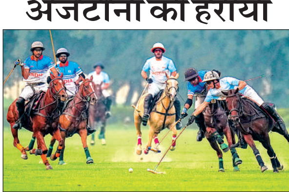
जयपुर पोलो ग्राउंड में भारत और अर्जेंटीना की टीमों प्रतिस्पर्धा करती हुई।