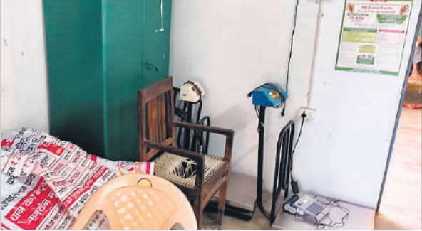
गजरौला के क्रय केंद्र पर कमरे में रखे तराजू और क्षतिग्रस्त बैनर।

3 अक्टूबर से जनपद में 132 क्रय केंद्र स्थापित कर धान खरीद शुरू कराई गई। 22 दिन पूरे हो चुके हैं। इस अंतराल में कई बार विवाद और लापरवाही सामने आ चुके हैं। पूरनपुर में तो एक किसान नेता पर गोली भी चला दी गई थी, जिसमें राइस मिलर्स समेत दो लोग आरोपी बनाए गए। संगठन के राष्ट्रीय अध्यक्ष ने डीएम-एसपी से मुलाकात कर कई बिंदुओं को