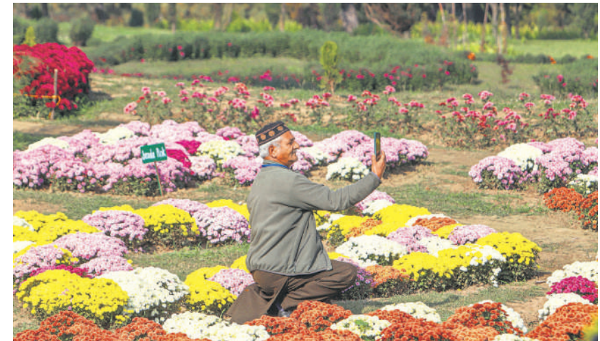
श्रीनगर के नेहरू मेमोरियल बॉटनिकल गार्डन में जम्मू-कश्मीर के पहले विशेष गुलदाउदी उद्यान बाग-ए-गुल-ए-दाऊद में फूल के साथ सेल्फी लेता एक बुजुर्ग।