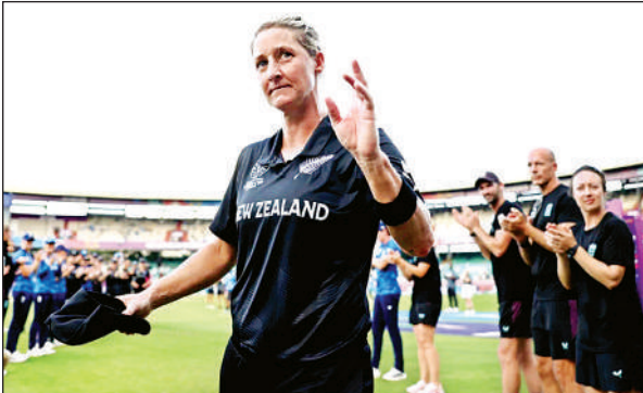
दोनों टीमों के खिलाड़ियों का अभिवादन स्वीकार करती सोफी डिवाइन।