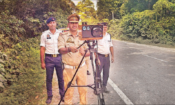
बहराइच-लखनऊ मार्ग पर वाहनों की स्पीड नापती यातायात पुलिस।

लखनऊ-बहराइच राजमार्ग पर अभियान चलाया गया। स्पीड रडार यंत्र से वाहनों की गति की जांच की गई। निर्धारित गति सीमा से अधिक गति से वाहन चलाते पाए गए 24 वाहनों का चालान तथा उन पर 48 हजार रुपये का अर्थदंड लगाया गया।