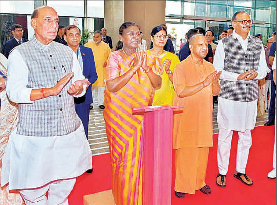
गाजियाबाद में यशोदा मेडिसिटी का उद्घाटन करती राष्ट्रपति द्रौपदी मुर्मू, साथ में रक्षा मंत्री राजनाथ सिंह, मुख्यमंत्री योगी आदित्यनाथ, उपमुख्यमंत्री ब्रजेश पाटक और अन्य लोग।

एयरपोर्ट में ड्यूल फाइबर ऑप्टिक नेटवर्क की सुविधा होगी, जिससे डेटा कनेक्टिविटी पूरी तरह निर्बाध और