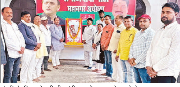
संत शिरोमणि नामदेव जी की जयंती पर उन्हें नमन करते सपा के नेता।

राजर्षि दशरथ मेडिकल कॉलेज में आवश्यकता पूरी हो जाने की जानकारी देकर आने से मना कर दिया। उन्होंने बताया कि मशीन इस्टाल है। सिंगल डोनर जरूरतमंद को निशुल्क सुविधा दी जा रही है।