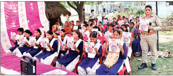
बहू बेटी सम्मेलन में मौजूद छात्राएं व महिलाएं।