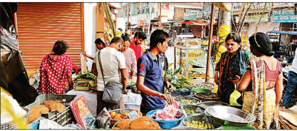
डाला छठ व्रत के लिए सामग्री खरीदती महिलाएं।