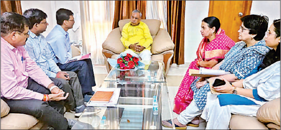
सर्किट हाउस में विभागीय अधिकारियों के साथ बैठक करते पंचायती राज मंत्री ओम प्रकाश राजभर।

इससे पहले एमएसएमई नीति में निरंतर बदलाव जारी है। उत्तर प्रदेश में पहले ग्रामीण क्षेत्रों में 12 मीटर सड़क पर औद्योगिक पार्क, विकसित करते हुए उद्योग लगाने की अनुमति दी जा रही थी, लेकिन इसे बाद में बदल कर सात मीटर कर दिया गया। इसी तरह शहरी क्षेत्रों में अनुमति देने की तैयारी है। उच्च स्तर पर इसको लेकर बैठक हुई थी इसमें सहमति बन चुकी है। कहा जाता है कि शीघ्र ही कैबिनेट से प्रस्ताव पास करते हुए इसे लागू किया जाएगा। इसके साथ ही औद्योगिक पार्क के अंदर सुविधाएं विकसित करने के मानक