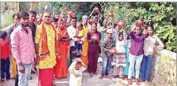
कलश यात्रा निकालती महिलाएं।