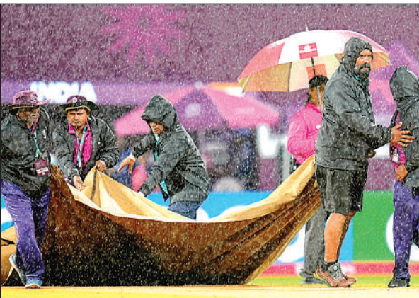
बारिश के कारण खेल रुक जाने पर ग्राउंड स्टाफ ने पिच को ढक दिया।