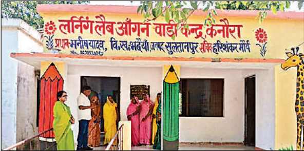
आंगनबाड़ी केंद्र। ● अमृत विचार

अमृत विचार: महिला एवं बाल विकास विभाग की प्रमुख योजना आंगनबाड़ी सेवाओं की स्थिति जिले में चिंताजनक है। पौष्टिक आहार से लेकर मातृ-शिशु स्वास्थ्य तक की जिम्मेदारी संभालने वाले आंगनबाड़ी केंद्र ही स्टॉफ कमी के संकट से जूझ रहे हैं। जिले में महकमे द्वारा 2511 आंगनबाड़ी केंद्र संचालित है जिसमें 94 आंगनबाड़ी केंद्र बिना आंगनबाड़ी कार्यकर्त्री के संचालित हो रहे हैं। वहीं 667 केंद्र ऐसे हैं जहा सहायिका ही नहीं तैनात है। रिक्त पदों के चलते केंद्रों की नियमित कार्यप्रणाली पर सीधा प्रभाव पड़ रहा है। सबसे अधिक असर गर्भवती, धात्री महिलाओं व 3-6 वर्ष के बच्चों