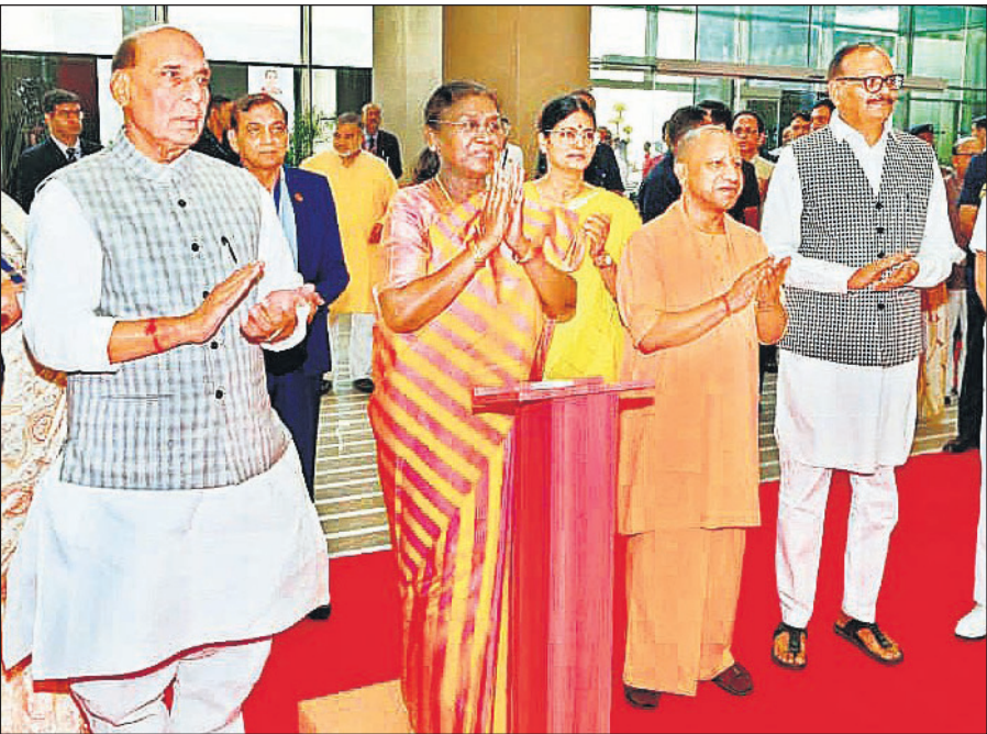
गाजियाबाद में यशोदा मेडिसिटी का उद्घाटन करती राष्ट्रपति द्रौपदी मुर्मू, साथ में रक्षा मंत्री राजनाथ सिंह, मुख्यमंत्री योगी आदित्यनाथ, उपमुख्यमंत्री ब्रजेश पाटक और अन्य लोग।

एयरपोर्ट में ड्यूल फाइबर ऑप्टिक नेटवर्क की सुविधा होगी, जिससे डेटा कनेक्टिविटी पूरी तरह निर्बाध और