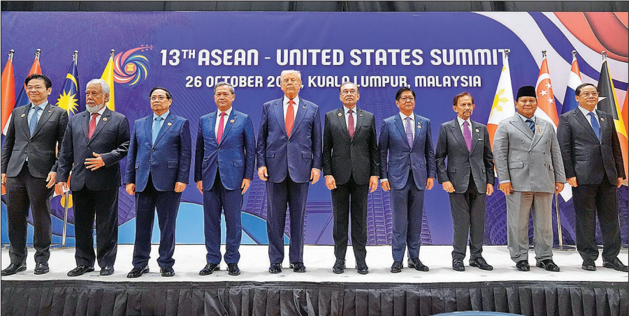
आसियान शिखर सम्मेलन में ग्रुप फोटो खिंचते अमेरिकी राष्ट्रपति डोनाल्ड ट्रंप के साथ प्रमुख देशों के राष्ट्राध्यक्ष और प्रतिनिधि।