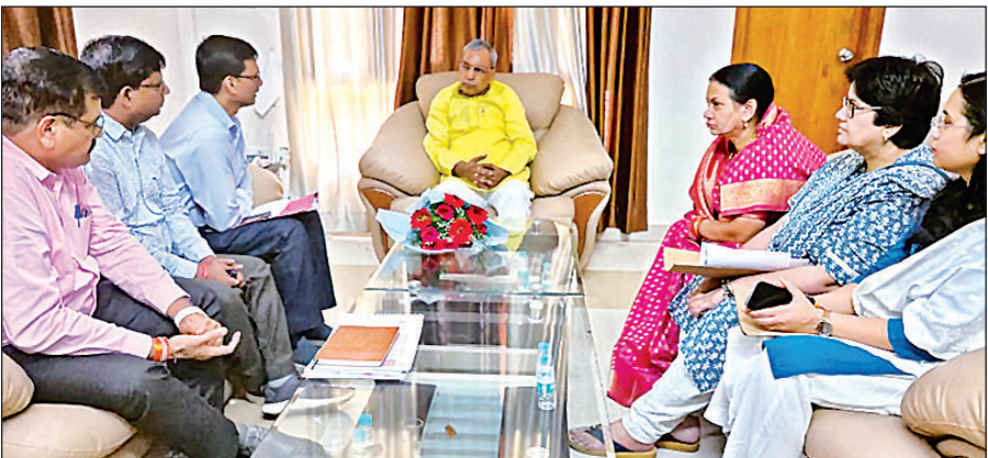
सर्किट हाउस में विभागीय अधिकारियों के साथ बैठक करते पंचायती राज मंत्री ओम प्रकाश राजभर।

इससे पहले एमएसएमई नीति में निरंतर बदलाव जारी है। उत्तर प्रदेश में पहले ग्रामीण क्षेत्रों में 12 मीटर सड़क पर औद्योगिक कार्यों, विकसित करते हुए उद्योग लगाने की अनुमति दी जा रही थी, लेकिन इसे बाद में बदल कर सात मीटर कर दिया गया। इसी तरह शहरी क्षेत्रों में अनुमति देने की तैयारी है। उच्च स्तर पर इसको लेकर बैठक हुई थी इसमें सहमति बन चुकी है। कहा जाता है कि शीघ्र ही कैबिनेट से प्रस्ताव पास करते हुए इसे लागू किया जाएगा। इसके साथ ही औद्योगिक पार्क के अंदर सुविधाएं विकसित करने के मानक