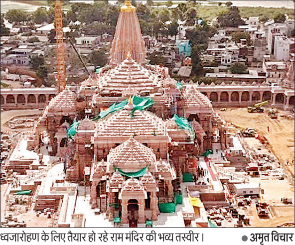
ध्वजारोहण के लिए तैयार हो रहे राम मंदिर की भव्य तस्वीर।

शेषावतार मंदिर और अनेक प्रमुख कार्य पूरे किए जा चुके हैं। उन्होंने बताया कि परकोटे का कार्य भी अंतिम चरण में है। जिसे 10 नवंबर तक हर हाल पूरा कर लिया जाएगा। उन्होंने बताया कि मंदिर परिसर में होने वाले आयोजन को लेकर मंथन किया जा रहा है। जिसमें आयोजन को संपन्न कराने के साथ दर्शन की व्यवस्था भी अत्यधिक बाधित न हो। इसके लिए विशेषज्ञों से भी राय ली जा रही है।