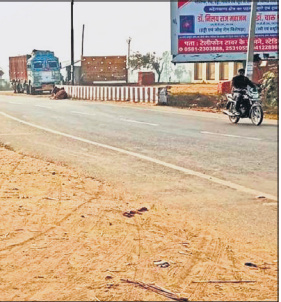
नवाबगंज में पीएमजीएसवाई से बनी सड़क।

मंडलायुक्त भूपेंद्र एस चौधरी ने पिछले माह विभागीय अधिकारियों के साथ समीक्षा की थी। इस दौरान उन्होंने इस वित्तीय वर्ष में बनने वाली सड़कों का तेजी से निर्माण कार्य पूरा करने के साथ ही पिछले पांच साल में बनी पीएमजीएसवाई की सड़कों का व्योरा लेकर इस अवधि में बनी सभी 65 सड़कों की गुणवत्ता व वर्तमान स्थिति का सत्यापन कराने के डीएम को निर्देश दिए थे, जिससे सड़कों की