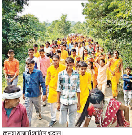
कलश यात्रा में शामिल श्रद्धालु।