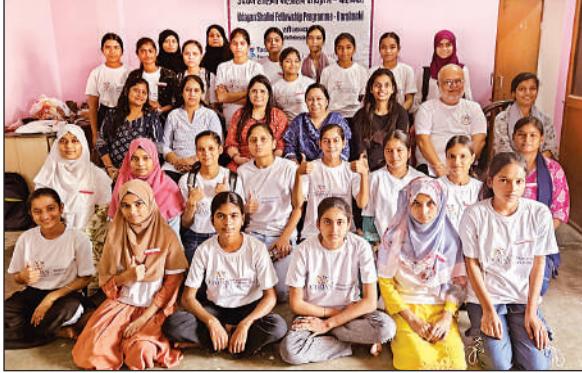
कार्यशाला में मौजूद छात्राएं व फाउंडेशन के पदाधिकारी।