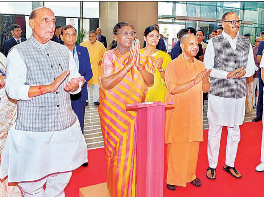
गाजियाबाद में यशोदा मेडिसिटी का उद्घाटन करती राष्ट्रपति द्रौपदी मुर्मु, साथ में रक्षा मंत्री राजनाथ सिंह, मुख्यमंत्री योगी आदित्यनाथ, उपमुख्यमंत्री ब्रजेश पाटक और अन्य लोग।

एयरपोर्ट में ड्यूल फाइबर ऑप्टिक नेटवर्क की सुविधा होगी, जिससे डेटा कनेक्टिविटी पूरी तरह निर्बाध और