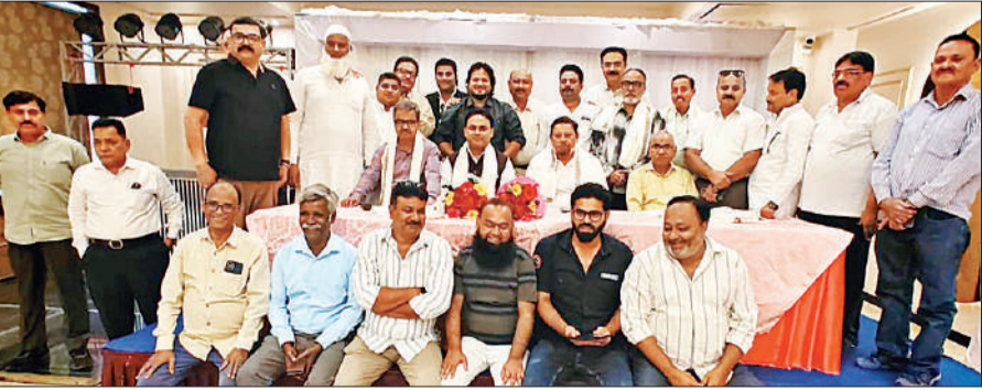
बीडीसीए के मनोनीत पदाधिकारी।