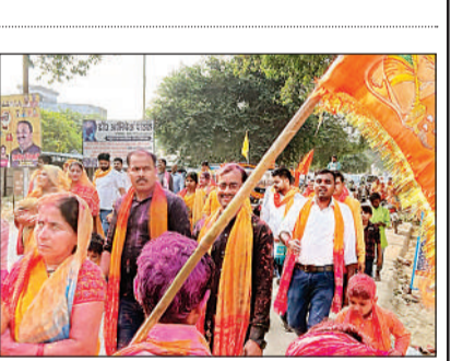
कलश यात्रा में मौजूद श्रद्धालु।