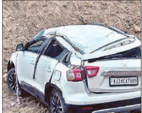
गंगा एक्सप्रेस-वे के नीचे गिरी कार।