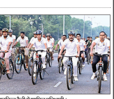
साइकिल रैली में शामिल प्रतिभागी।