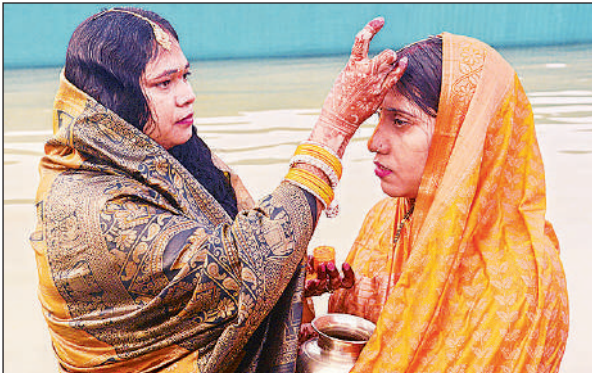
खरना पर साथी महिला को भखरा सिंदूर लगाती दूसरी महिला।