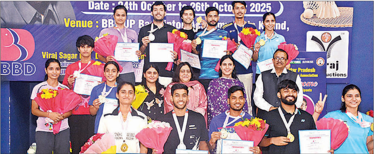
बीबीडी यूपी बैडमिंटन अकादमी, गोमती नगर में आयोजित स्टेट सीनियर बैडमिंटन चैंपियनशिप में पदक के साथ विजयी खिलाड़ी।