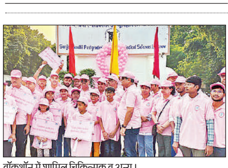
वॉकथॉन में शामिल चिकित्सक व अन्य।