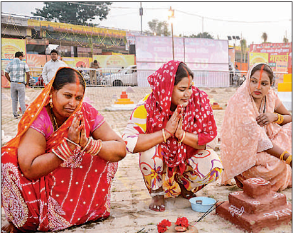
छठ पूजा घाट पर गोमती में स्नान के बाद देवी का पूजन करती महिलाएं।