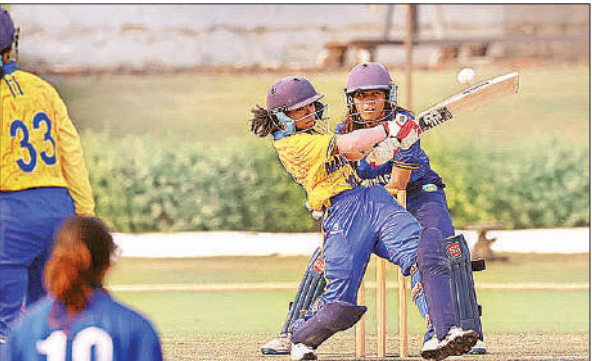
बॉल को हिट करती बल्लेबाज।

मिजोरम और नागालैंड के मुकाबले में नागालैंड के बल्लेबाज मिजोरम की गेंदबाजों के सामने टिक नहीं सके। शुरुआती दोनों बल्लेबाज