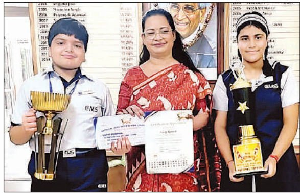
सम्मानित सीएमएस के छात्र-छात्राएं।