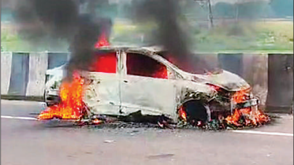
धू-धूकर जलती कार।