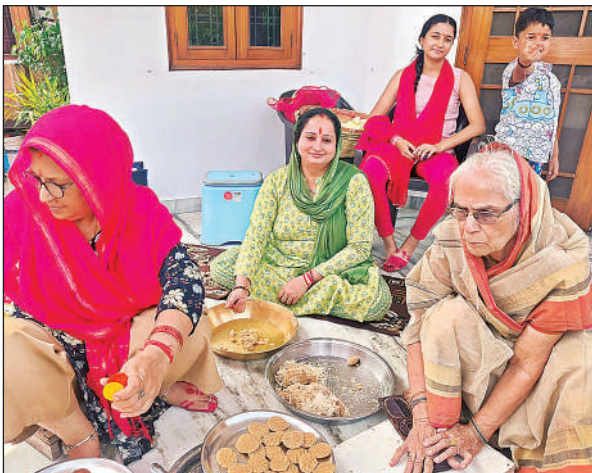
छठी मैया और भगवान सूर्य को अर्पण करने के लिए प्रसाद तैयार करती महिलाएं।