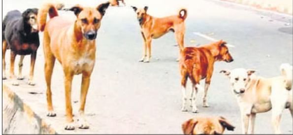
शहर की सड़कों पर खुले में घूमते पालतू कुत्ते।

इनमें से अधिकतर लोग आवारा कुत्तों के हमले का शिकार होते हैं, जबकि कुछ मामले पालतू कुत्तों द्वारा काटे जाने के भी होते हैं। स्वास्थ्य विभाग के आंकड़ों के मुताबिक, जनवरी से अब तक 60 हजार से अधिक लोगों को एंटी-रेबीज इंजेक्शन लगाया जा चुका है, जिनमें करीब 70 प्रतिशत मरीज कुत्ता काटने से घायल हुए हैं। नगर निगम की ओर से कुत्ता पालने वालों को पंजीकरण और लाइसेंस लेने की व्यवस्था की गई है। अभी तक सिर्फ