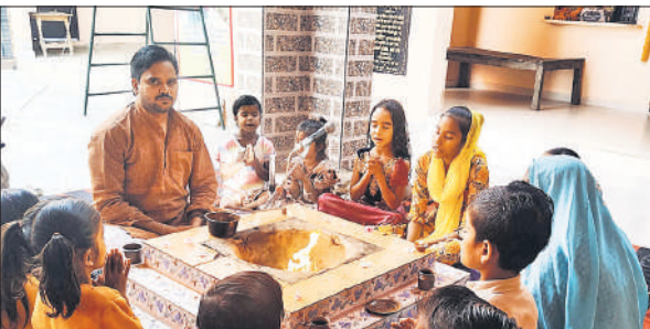
गुधनी में यज्ञ करते आर्य समाजी।

प्राचीन मंदिर को पर्यटक स्थल का दर्जा दिलाएंगे।