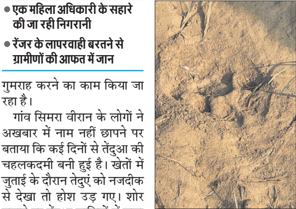
गोशाला के पास और अंदर मिले पगचिह्न।