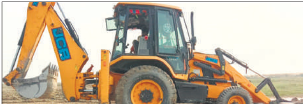
स्नान घाट के लिए खुदाई करती जेसीबी।