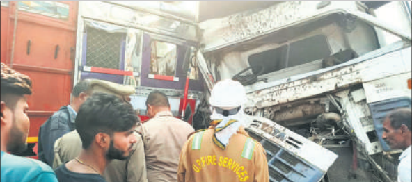
केबिन में फंसे चालक को निकालते पुलिसकर्मी।

उपचार के लिए प्राथमिक स्वास्थ्य केंद्र भावल खेड़ा भेजा गया। वहां डॉक्टरों ने प्राथमिक उपचार के बाद दोनों को गंभीर हालत में राजकीय मेडिकल कॉलेज में भर्ती कराया है।