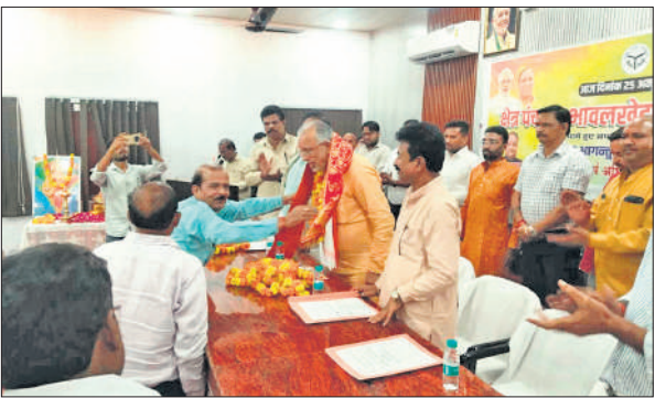
बैठक में वित्त मंत्री का स्वागत करते शिक्षक नेता।