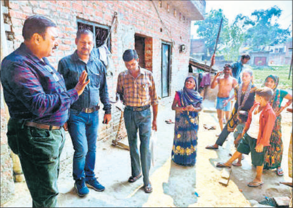
सेहरामऊ दक्षिणी में जांच करती स्वास्थ्य विभाग की टीम।