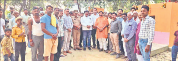
तपोसिद्ध मंदिर का स्थलीय जायजा लेते सदर विधायक व सहायक परियोजना।

घोसपुर में स्थित तपोसिद्ध बाबा की मणि का प्राचीन मंदिर है। जहां बड़ी संख्या में लोग पूजा अर्चना आते हैं। मान्यता है कि जो भी यहां आता है उसकी मनोकामना पूरी होती है। यह महान संत तपोसिद्ध महाराज की तपो स्थली है। स्थानीय व्यक्तियों के अनुसार इस स्थान पर पूर्व में कभी मां गंगा का प्रवाह भी था। इस स्थान का विशेष पौराणिक महत्व है। यहां पर दूर दराज से लोग अपनी मनोकामना के लिए