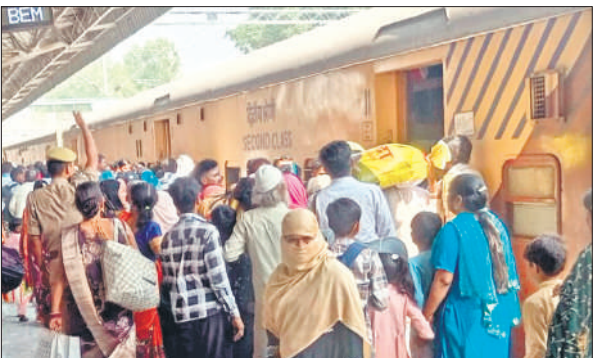
स्टेशन पर ट्रेन में घुसने के लिए मारामारी कर रहे यात्री।

पर्व पर अपने घरों को जाने वाले निकल पड़े हैं। रेलवे स्टेशन पर रविवार सुबह 7 से 9 बजे और फिर दोपहर 12 बजे भारी भीड़ रही। दोपहर को कासगंज की ओर से आने वाली ट्रेन जैसे ही प्लेटफार्म एक पर रुकी तो पहले से तैयार खड़े यात्री ट्रेन में घुसने को मारामारी करने लगे। एक के ऊपर एक यात्री चढ़ने के प्रयास में धक्का मुक्की करने लगे। जीआरपी ने यात्रियों की तलाशी ली जिससे यात्रियों को ट्रेन तक पहुंचने में पसीने छूट गए।