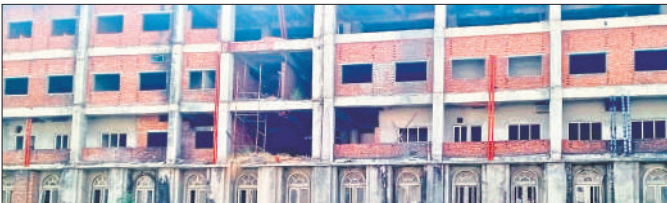
राजकीय मेडिकल कॉलेज में निर्माणाधीन छात्रावास।

राजकीय मेडिकल कॉलेज की निर्माण लागत 672 करोड़ थी। इस लागत से मेडिकल कॉलेज का करीब 60 प्रतिशत निर्माण कराया जा चुका है। कुछ बिल्डिंग का निर्माण जारी है, लेकिन अब कार्यवाही संस्था ने पिछले छह महीने से काम बंद कर दिया है। संस्था का कहना है कि 2018 में जब काम शुरू किया गया था तब निर्माण सामग्री की लागत कम