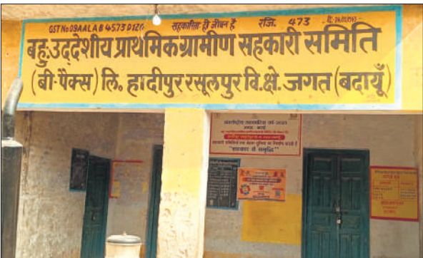
रसूलपुर की साधन सहकारी समिति।

इस समय जिले भर में यूरिया और डीएपी खाद का संकट बना हुआ है। साधन सहकारी समितियों पर खाद नहीं पहुंच रही है। किसान अलख सुबह समिति पर पहुंच रहे हैं। लाइन लगाने के बाद भी किसान खाली हाथ लौट रहे हैं। ब्लॉक जगत के ग्राम हादीपुर रसूलपुर में साधन सहकारी समिति है। यह समिति सात दिन से बंद है। किसानों