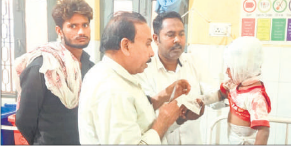
ई-रिक्षा की टक्कर से घायल बालक का अस्पताल में इलाज करते चिकित्सक।