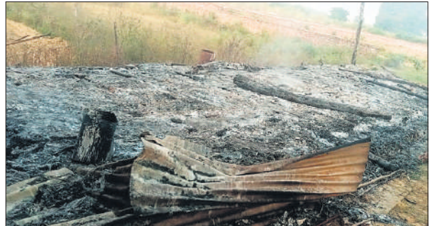
हाईवे किनारे आग लगने के बाद ढाबे का जला पड़ा सामान।