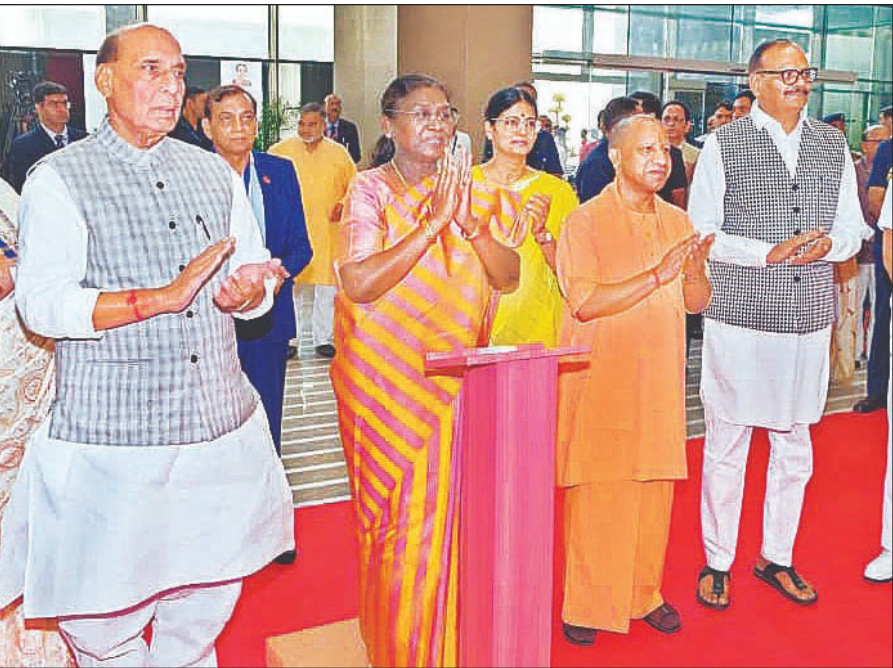
गाजियाबाद में यशोदा मेडिसिटी का उद्घाटन करती राष्ट्रपति द्रौपदी मुर्मू, साथ में रक्षा मंत्री राजनाथ सिंह, मुख्यमंत्री योगी आदित्यनाथ, उपमुख्यमंत्री ब्रजेश पाटक और अन्य लोग।

एयरपोर्ट में ड्यूल फाइबर ऑप्टिक नेटवर्क की सुविधा होगी, जिससे डेटा कनेक्टिविटी पूरी तरह निर्बाध और