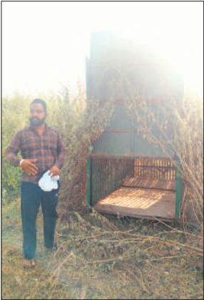
खानापूर्ति के लिए लगाया खाली पिंजरा।

खुटार, अमृत विचार : रविवार सुबह करीब दस बजे गांव रसवां कलां के मजरा हिमचलपुर के 17 नंबर ट्यूबवेल पर तेंदुएं को टहलता देखा गया है। खेतों में तेंदुएं के पदचिन्ह मिले। इसके बाद सूचना वन विभाग को दी गई। सूचना मिलते ही वनकर्मी मौके पर पहुंचे और जांच की। किसानों ने बताया कि तेंदुएं के देखे जाने के बाद दहशत में है। खेतों में आने जाने से लोग कतरा रहे हैं। इससे लोग दहशत में है। किसानों ने तेंदुएं को पकड़वाने की मांग की है। किसान दहशत में है।