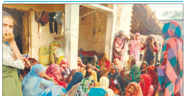
युवक की मौत के बाद विलाप करती परिजन।