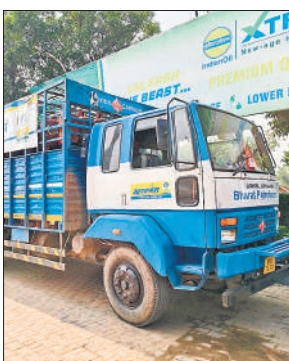
पेट्रोल पंप पर खड़ी डीसीएम।