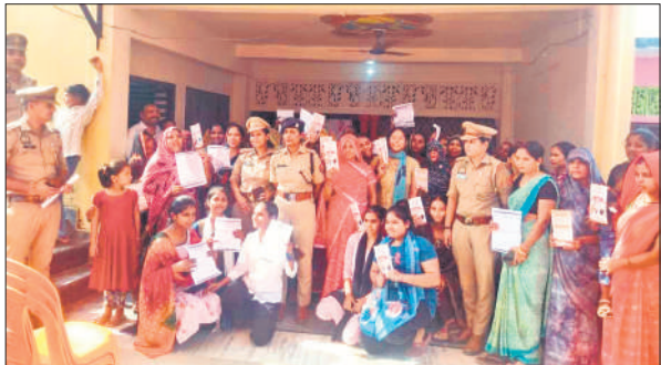
बच्चियों को जानकारी देती महिला पुलिस अधिकारी।