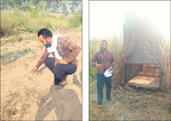
तेंदुए का पगचिह्न दिखाता किसान।