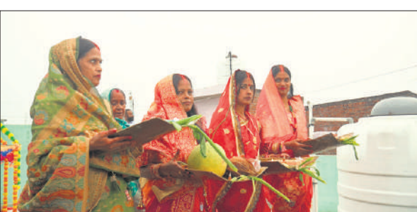
डूबते सूरज को अर्घ्य देती व्रती महिलाएं।

सोमवार को छठ पर्व पर शाम होते ही आनंद धाम सरोवर पर महिला श्रद्धालुओं का रेला उमड़ पड़ा। व्रती महिलाओं ने घुटने भर पानी में खड़े होकर डूबते भास्कर को प्रथम अर्घ्य दिया। रात भर शहर और देहात में छठ मईया के गीत गूंजते रहे। छठ व्रत रखने वाली महिलाएं सोमवार सुबह से ही तैयारी में लग गईं। विविध प्रकार के पकवान बनाए गए। इसे