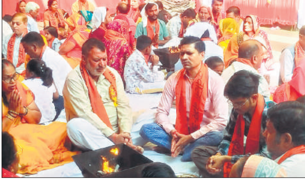
हवन में हिस्सा लेते आर्य समाज के लोग।