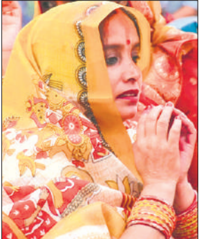
भगवान के ध्यान में मगन महिला श्रद्धालु।

दिया। घाटों पर छठ पर्व के आयोजन में सहयोग करने के लिए पूर्वांचलवासी कई संस्थाओं की ओर से चाय व अन्य प्रबंध भी किए गए थे। नगर निगम के अधिकारियों ने घाटों पर पहुंचकर व्यवस्था सुनिश्चित कराया।