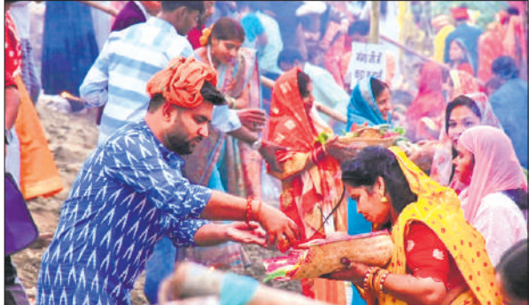
रामगंगा के तट पर पूजा करते श्रद्धालु।