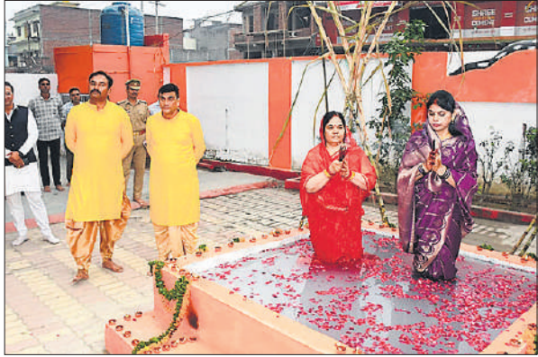
घाट में पूजा करती पुलिस अधिकारियों की पत्नी।