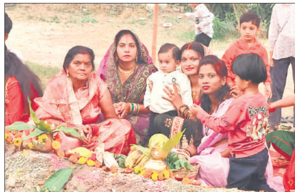
परिवार के साथ पूजा करने को तैयार महिलाएं।

उन्होंने बताया कि करीब 500 घरों के लोग इस रास्ते से