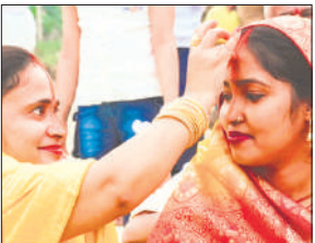
एक दूसरे को सिंदूर लगाती महिला।