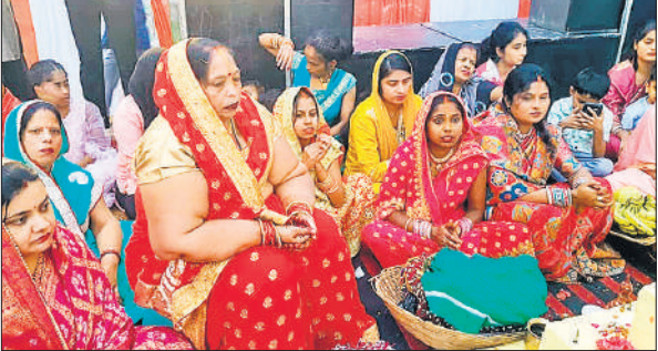
रजा टेक्सटाइल में छठ मैया की पूजा करती महिलाएं।