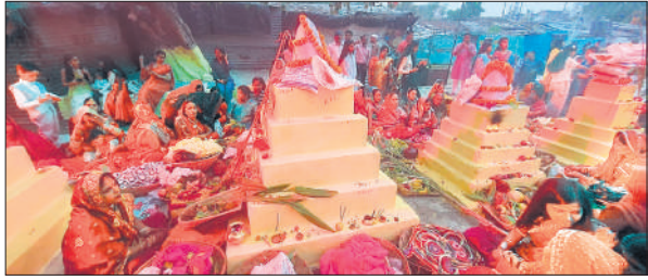
वेदी पर पूजन करती महिलाएं।