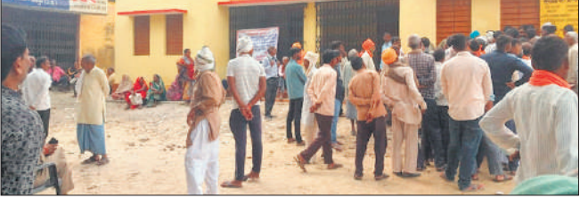
सहकारी समिति पर मौजूद किसान।