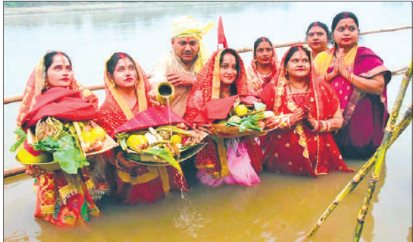
रामगंगा नदी में खड़े होकर भगवान सूर्य को अर्घ्य देते श्रद्धालु।