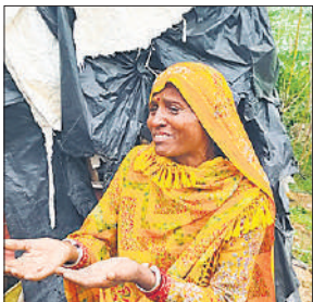
फसल उजड़ने के बाद बिलखती महिला।

राजस्व प्रशासन की टीम ने सरकारी जमीन को कब्जा मुक्त करने के लिए बुलडोजर से वहां बोई गई फसल को नष्ट कराया तो जमीन पर मौजूद वृद्धा फूट-फूट कर रोने लगी। उसने तहसीलदार को बताया कि आखिर उसकी क्या खता है जो उसकी फसल उजाड़ी जा रही है। वह तो जमीन के मालिक को हर साल खेती करने का पैसे चुकाती है। महिला का दर्द सुनाने के बाद तहसीलदार ने कहा कि जो फसल बच गई है उसे खुद उखाड़ ले और 15 दिन के अंदर यहां से अपना कब्जा पूरी तरह से हटा ले।