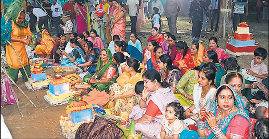
सीआरपीएफ कैपस में छठ पूजा करती महिलाएं।

मंदिरों परकांच ही बांस के बहंगिया, बहंगी लचकत जाय..... जैसे भजन दिन भर बजते रहे। दिवाली के बाद बिहार में भूमधाम से मनाए जाने वाले छठ माह पर्व की नहाय खाय के साथ हो गई थी। जिसमें महिलाओं ने रविवार को खरना करके 36 घंटे का निर्जला व्रत किया था। उसके बाद सोमवार को डूबते सूर्य को अर्घ्य देने के लिए दोपहर बाद महिलाओं और श्रद्धालुओं का तांता लगना शुरू हो गया था। काफी संख्या में छठ पूजा के लिए पहुंचे श्रद्धालुओं ने घाटों खड़े होकर सूर्य देव की आराधना की। साथ ही डूबते सूर्य को अर्घ्य दिया। महिलाओं के द्वारा काफी समय से घरों से लेकर घाटों तक में पूजा की तैयारी चल रही थी।