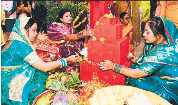
वेदी की पूजा करती महिलाएं।

मालवार की सुबह छठ व्रती महिलाएं परिवार के साथ घाट पर पहुंचकर नदी के जल में खड़े होकर भगवान सूर्य के उदय होने पर अर्घ्य देंगी। इसके बाद पूजा अर्चना कर प्रसाद वितरित करेंगी। घर लौटकर पारण कर व्रत पूरा होने पर प्रसाद का वितरण करेंगी। इसके साथ ही छठ महापर्व का आयोजन पूरा हो जाएगा।