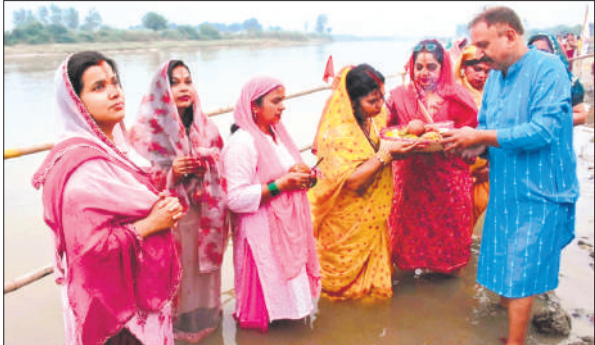
रामगंगा में खड़े होकर सूर्य देव की पूजा करते श्रद्धालु।