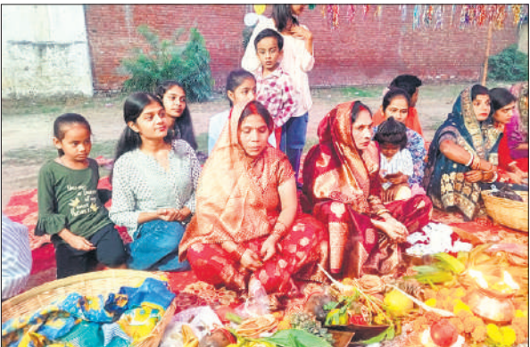
रामलीला मैदान में विधि विधान के साथ पूजा अर्चना करती पूर्वांचल वासी।

व्रती महिलाएं निर्जला व्रत रखकर घाट पर पहुंचीं और कृत्रिम रूप से बने तालाब में खड़े होकर डूबते सूर्य को अर्घ्य दिया। मान्यता है कि संध्या के समय सूर्य अपनी पत्नी प्रत्युषा के साथ रहते हैं, इसलिए अस्ताचलगामी सूर्य को अर्घ्य देने से उनकी पत्नी की भी उपासना हो जाती है और मनोकामनाएं शीघ्र पूरी होती हैं। व्रतियों ने बांस की टोकरी में मौसमी फल, ठेकुआ, गुड़ की खीर, चावल और गन्ना सहित पूजन सामग्री से सजे सूप लेकर