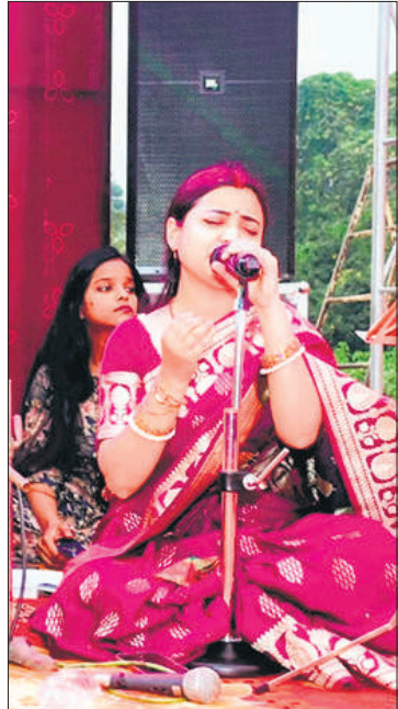
छठी मैया के गीत गाती महिला।