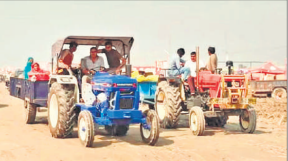
तिगरी मेले में ट्रैक्टर ट्रालियों से जाते श्रद्धालु।

अब तक तीन लाख से अधिक श्रद्धालुओं के मेले में पहुंचने का अनुमान लगाया जा रहा है। बीते दो दिन से गजरोला-तिगरी मार्ग पर ट्रैक्टर-ट्रालियों की लाइन टूट नहीं रही है। सोमवार सुबह भी तिगरी की ओर जाने वाले श्रद्धालुओं का रेला लगा रहा। भीड़ ज्यादा होने की वजह से यातायात व्यवस्था चरमरा गई। गजरोला में फाजलपुर और कुमराला पुलिस चौकी के पास जाम की स्थिति बनी रही। पुलिस ने काफी प्रयासों के बाद जाम खुलवाते हुए यातायात सुचारू कराया। वहीं, दूसरी ओर मेला स्थल पर पहुंचे श्रद्धालुओं ने तड़के से ही गंगा स्नान शुरू कर दिया। हर-हर गंगे के जयकारों के साथ श्रद्धालुओं ने स्नान कर सूर्य को अर्घ्य दिया। परिवार एवं