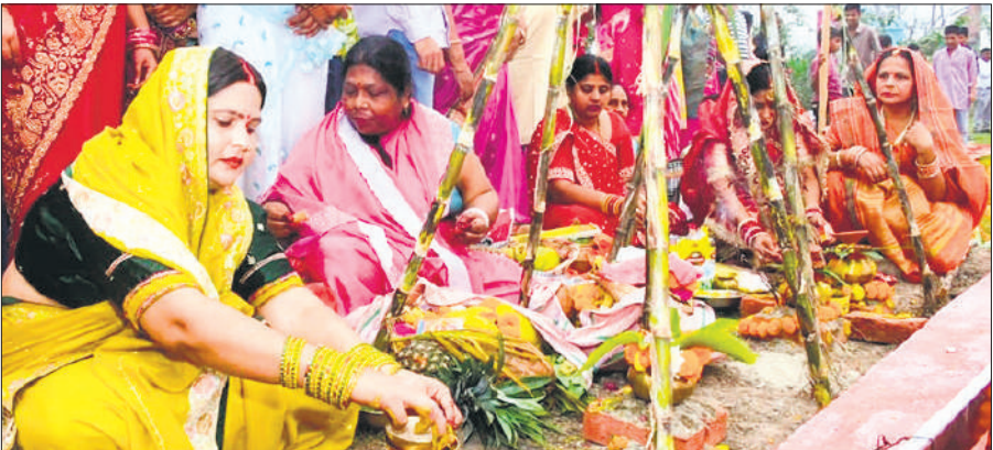
घाट पर पूजा करती महिलाएं।

छठ महापर्व पर 36 घंटे का निर्जला व्रत रखने वाली व्रती महिलाओं व उनके परिवार के लोग दोपहर बाद से ही रामगंगा नदी के सीएल गुप्ता घाट, लोकोशेड पुल के पास बने नये स्थायी छठ घाट, कटघर घाट आदि पर पहुंचकर विधिविधान से पूजा अर्चना की। घाटों पर छठ मैया के गीत कांच ही बांस के बहंगिया, बहंगी लचकत जाय, बाट जे पूछेला बटोहिया, बहंगी केकरा के जाय, ओहरे जे बारी छठी मैया, बहंगी उनका के जाय, बहंगी उनका के जाय सहित अन्य गीतों की गूंज घाटों पर रही। नये कपड़ों में श्रृंगार कर व्रती महिलाओं ने घाटों पर बने वेदी के पास बैठकर पूजा अर्चना की। परिवार के लोगों ने इसमें सहयोग किया। सीएल गुप्ता घाट पर नगर निगम की ओर से टेंट लगाए गए थे। इसके अलावा पेयजल, प्रकाश, सुरक्षा व नदी में सुरक्षा के लिए मोटर आदि के प्रबंध के बीच डूबते सूर्य देव को नदी के जल के बीच खड़े होकर अर्घ्य