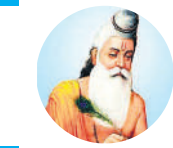
असली ताकत शारीरिक शक्ति में नहीं, बल्कि बुद्धि और आत्म-नियंत्रण में निहित है।

एनिमेशन की कला को बढ़ावा देने के उद्देश्य से एनिमेशन दिवस के अवसर पर विभिन्न सांस्कृतिक संस्थानों को एनिमेटेड फिल्मों की स्क्रीनिंग, प्रदर्शन, कार्यशालाओं के आयोजन तथा इस कला को प्रोत्साहित करने में मदद करने वाले कार्यक्रमों के आयोजन और प्रतिযোগिताओं के लिए आमंत्रित किया जाता है। इस अवसर पर दिखाई जाने वाली पूर्ण लंबाई की एनिमेशन फिल्मों और एनिमेटेड शॉर्ट्स में से कुछ फिल्में रेत, कागज तथा कम्प्यूटर का उपयोग करते हुए ड्राइंग, पेंटिंग, एनिमेटेड कठपुतलियों तथा अन्य वस्तुओं के साथ तैयार की असाधारण श्रेणी को प्रदर्शित करती हैं। कुछ एनिमेटेड फिल्में गैर-मौखिक होती हैं, जो सांस्कृतिक अभिव्यक्ति तथा संचार के लिए समृद्ध अवसर मानी जाती हैं।