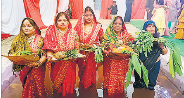
घाट में खड़ी महिलाएं सूर्य की पूजा करती महिलाएं।