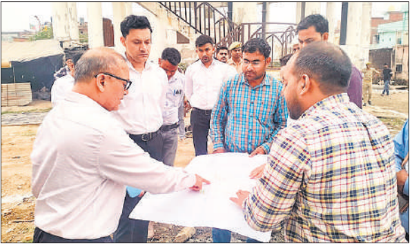
ज्वालानगर में टंकी का निरीक्षण करते नोडल अधिकारी।

उन्होंने कहा कि सभी विभागीय अधिकारी अपने-अपने कार्यों को शासन की मंशानुरूप समयबद्ध, पारदर्शी एवं गुणवत्तापूर्ण रूप से पूर्ण करें। समीक्षा के दौरान नोडल अधिकारी ने सामुदायिक शौचालयों के संबंध में निर्देश दिए कि ग्राम पंचायतों में निर्मित शौचालयों का विशेष सत्यापन कराया जाए।