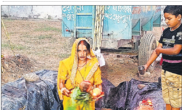
जल में खड़े होकर पूजा करती महिला।