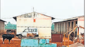
गौशाला में अफसरों की गाड़ी ।