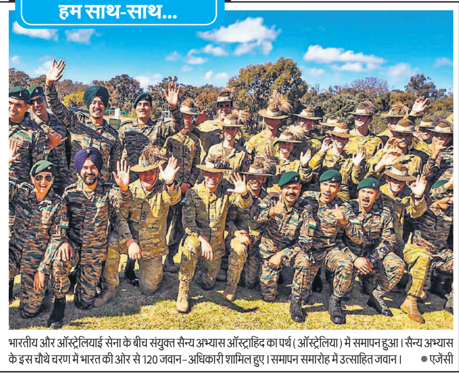
भारतीय और ऑस्ट्रेलियाई सेना के बीच संयुक्त सैन्य अभ्यास ऑस्ट्राहिंद का पर्थ ( ऑस्ट्रेलिया ) में समापन हुआ। सैन्य अभ्यास के इस चौथे चरण में भारत की ओर से 120 जवान-अधिकारी शामिल हुए। समापन समारोह में उत्साहित जवान।