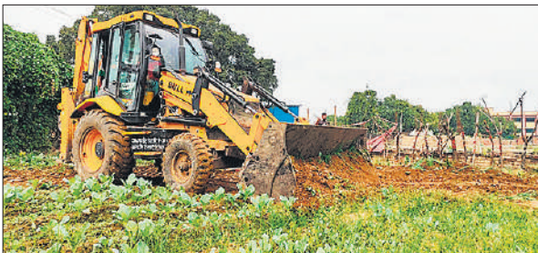
सरकारी जमीन पर खड़ी फसल को उजाड़ता बुलडोजर।

को कब्जा मुक्त कर दिया गया है। इसकी रिपोर्ट जिलाधिकारी को भेजी जाएगी। जिलाधिकारी