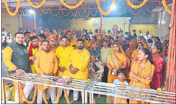
कार्यक्रम में मौजूद भक्त

जगह- जगह श्याम प्रेमियों का स्वागत किया। श्री श्याम मित्र मंडल क्योपार के तत्वावधान में मंगलवार को होने वाले बाबा श्याम के चतुर्थ श्री श्याम महोत्सव से पूर्व सोमवार की शाम गांव स्थित श्री ठाकुरद्वारा मंदिर से निशान यात्रा का आरंभ नायियल फोड कर किया गया। यात्रा में सैकड़ों की संख्या में डीजे पर बज रहे भजनों पर श्याम प्रेमी झूमते हुए निशान हाथ में लेकर गांव की गलियों में निकले। गांव मंदिर प्रांगण से प्रारंभ होकर गांव की विभिन्न गलियों के भ्रमण के बाद कीर्तन स्थल पर जा