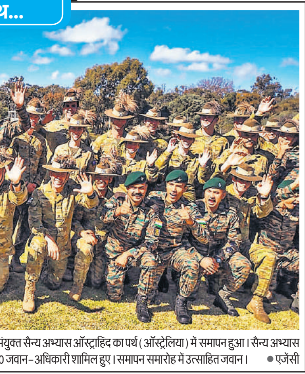
भारतीय और ऑस्ट्रेलियाई सेना के बीच संयुक्त सैन्य अभ्यास ऑस्ट्राहिंद का पर्थ ( ऑस्ट्रेलिया ) में समापन हुआ। सैन्य अभ्यास के इस चौथे चरण में भारत की ओर से 120 जवान-अधिकारी शामिल हुए। समापन समारोह में उत्साहित जवान।

दिशाशूल - उत्तर, ऋतु - हेमंत। चन्द्रबल- मिथुन, कर्क, तुला, धनु, कुंभ, मीन। ताराबल- अश्विनी, भरणी, कृतिका, रोहिणी, आर्द्रा, पुष्य, मघा, पूर्वा फाल्गुनी, उत्तरा फाल्गुनी, हस्त, स्वाति, अनुराधा, मूल, पूर्वाषाढा, उत्तराषाढा, श्रवण, शतभिषा, उत्तराभाद्रपद। नक्षत्र - पूर्वाषाढा 15.45 तक तत्पश्चात उत्तराषाढा।