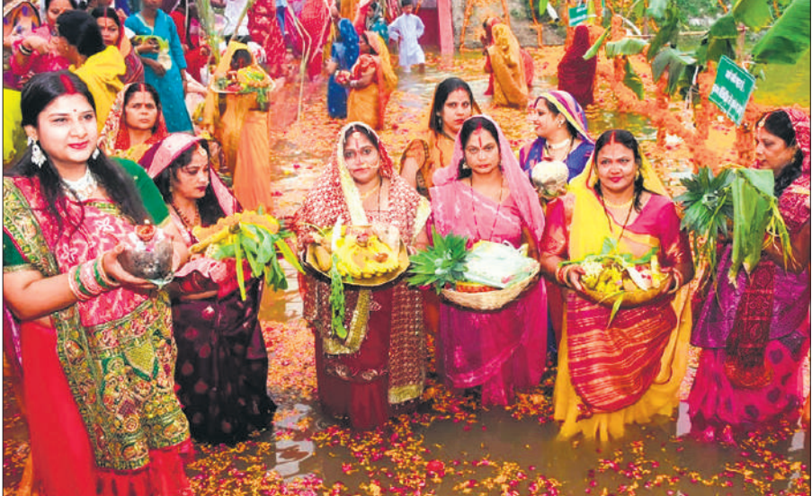
पानी में खड़ी होकर पूजा करती महिलाएं।