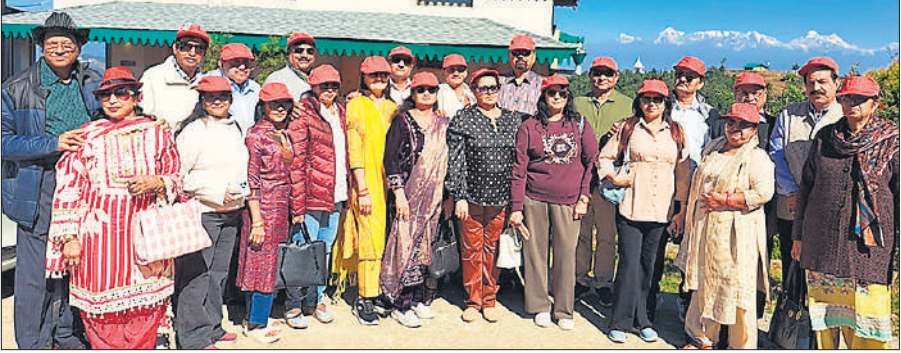
कार्यक्रम के दौरान उत्तराखंड में मौजूद उद्यमी।

एक्सपो में हॉस्पिटैलिटी, होटल, टूरिज्म से जुड़ी इंडस्ट्री भाग लेंगी। एक्सपो में देशभर से हैंडीक्राफ्ट से जुड़े उत्पाद दर्शित किए जाएंगे। रामपुर से भी इस एक्सपो में उद्यमी भाग लेंगे। रामपुर के ओडीओपी