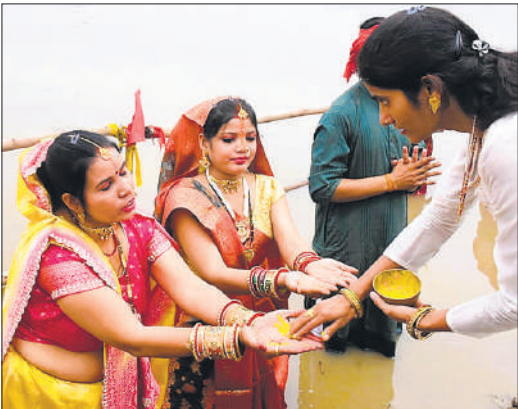
नदी में खड़ी महिलाओं के हाथ में हल्दी लगाती युवती।