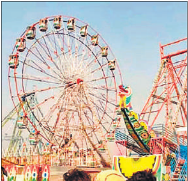
तिगरी गंगा मेले में लगे झूले।

हर वर्ष की तरह इस बार भी गंगा रोड से सटे सेक्टरों पर ही स्नान घाट बनाए गए हैं। सेक्टर एक व दो के सामने स्नान घाट बने हैं। इसी तरह कुछ आगे और फिर अंत में सेक्टर 11 के सामने स्नान घाट है। सदर गेट के सामने मीना बाजार, झूले- सर्कस, घाट- पकोड़ी की दुकानें लग रही है। इसी क्षेत्र के चारों तरफ अन्य सामाजिक व धार्मिक संगठनों के शिविर इत्यादि हैं। सदरगेट पर स्काउट गाइड का शिविर लगाता है। जहां खीर- पाए के संदर्भ में रात दिन सूचना केंद्र चालू रहता है।