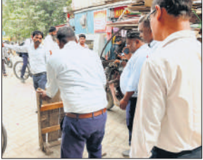
सामान जब्त करते कर्मचारी।

अमृत विचार : सोमवार को पालिका ने नगर में जगह जगह फैले अतिक्रमण को लेकर विशेष अभियान चलाया। अभियान के दौरान कब्जाधारियों का सामान जब्त कर उसे पालिका भिजवा दिया। नगर में नैनीताल हाईवे से लेकर अंतरिम मार्गों तक, जगह जगह अतिक्रमण हो रहा है। अतिक्रमण की वजह से आए दिन हाईवे पर जाम लग जाता है। अंतरिम मार्ग भी जाम की चपेट में आ जाते हैं। मार्गों की स्थिति भी अतिक्रमण को लेकर काफी खराब है। उधर लोगों की शिकायत पर संज्ञान लेते हुए सोमवार को पालिका ने एक टीम का गठन किया। इसके बाद टीम ने नगर में अतिक्रमण को लेकर विशेष अभियान चलाया। अभियान के दौरान टीम ने नगर में अतिक्रमणकारियों को नुक़्क लोग इस पर गंभीरता से विचार नहीं करते। अगर फिर कब्जा मिला तो कानूनी कार्रवाई होगी।