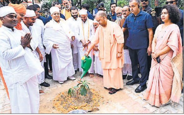
कबीरधाम में पौधरोपण के दौरान मुख्यमंत्री।