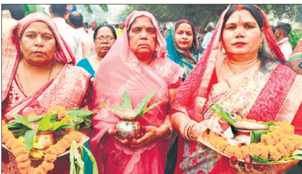
पीलीभीत में बरहा जलाशय पर अस्तगामी सूर्य को अर्घ्य देने जाती व्रतधारी महिलाएं।