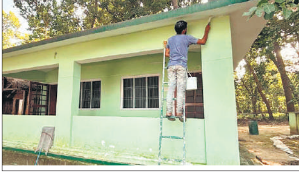
पीटीआर के चूका बीच में रंगाई-पुताई करता श्रमिक।

इधर इस बार वन मंत्री नए पर्यटन सत्र का शुभारंभ नए बराही गेट से कर सकते हैं। इसकी तैयारियां भी की जा रही हैं। पीलीभीत टाइगर रिजर्व का पर्यटन सत्र इस बार 1 नवंबर से