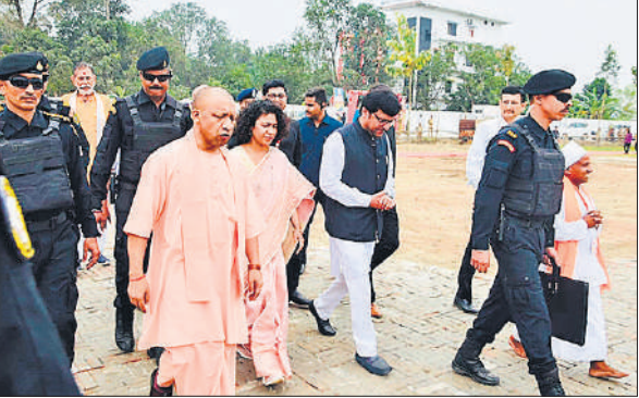
लखीमपुर खीरी में हेलीपैड से मंच पर जाते मुख्यमंत्री योगी आदित्यनाथ।