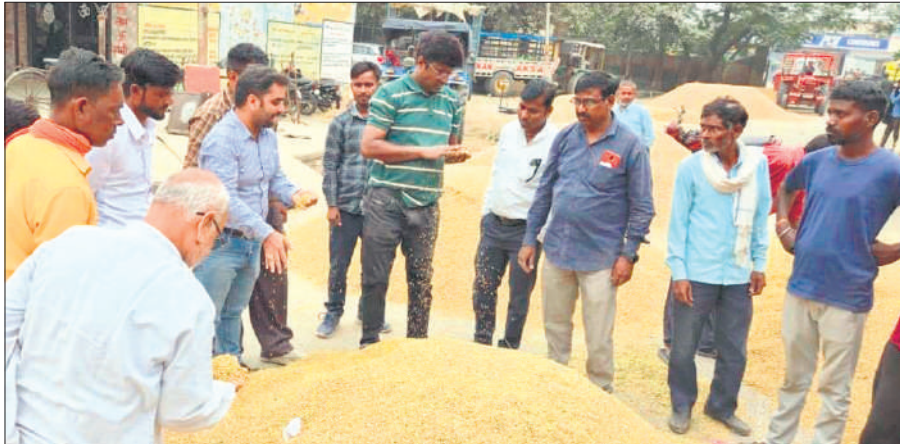
मंडी समिति पीलीभीत में धान की ढेरी की लगती बोली।

अमृत विचार: साप्ताहिक अवकाश के बाद मंडी समिति में क्रय केंद्रों पर धान की तौल शुरू हो गई। आलम ये रहा कि केंद्रों के बाहर धान लदी ट्रैक्टर ट्रॉली लिए किसान अपनी बारी आने का इंतजार करते हुए परेशान दिखे। आदतें भी गुलजार रही। उन पर किसान के धान की लगवाई जा रही बोली औपचारिकता की ओर इशारा कर गई। दोपहर में तो राइस मिलर्स के कर्मचारी-आदती की मौजूदगी में ही किसानों का धान औने-पौने दाम पर बिकता रहा। नतीजतन धान की गुणवत्ता ठीक हो या फिर खराब, एमएसपी (न्यूनतम समर्थन मूल्य) नहीं मिल सका। गुणवत्ता में कमी का हवाला देकर कुछ किसानों को तो अपने धान के महज 1200 से 1400 रुपये ही मिल सके। अधिकतम बोली भी 1800-1850 तक सीमित रही, जोकि एमएसपी से काफी कम रही। धनतेरस, दिवाली भैयादूज आदि त्योहारी सीजन में छह दिन तक क्रय केंद्र बंद रहे। जिसके चलते मंडी समिति में बड़ी संख्या में धान को आवक हुई। कई दिन