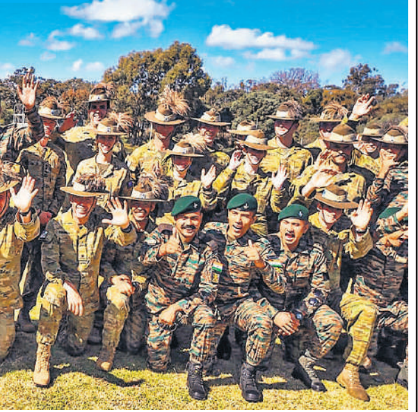
भारतीय और ऑस्ट्रेलियाई सेना के बीच संयुक्त सैन्य अभ्यास ऑस्ट्राहिंद का पर्थ ( ऑस्ट्रेलिया ) में समापन हुआ। सैन्य अभ्यास के इस चौथे चरण में भारत की ओर से 120 जवान-अधिकारी शामिल हुए। समापन समारोह में उत्साहित जवान।