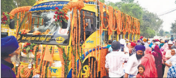
जोड़ा साहिब का दर्शन और स्वागत करता जनसमूह।