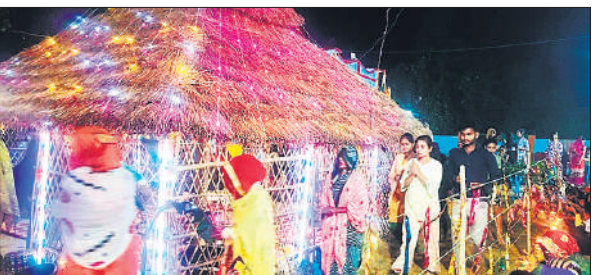
खेतौसा में यज्ञ की परिक्रमा करते श्रद्धालु।