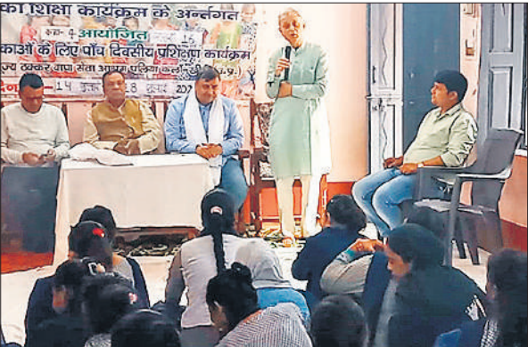
शिक्षिकाओं को प्रशिक्षण देते प्रशिक्षक।