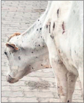
लंपी वायरस से पीड़ित पशु।