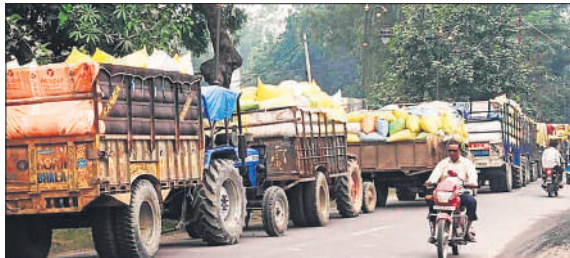
बीसलपुर में लगी धान लदे वाहनों की कतार।

अमृत विचार: धान खरीद को लेकर मंडी समिति स्थित क्रय केंद्रों पर तौल जारी है। सोमवार को भी मंडी धान से पटी रही। तौल तो चलती रही लेकिन गति धीमी रही। बता दें कि मंडी में 37 धान क्रय केंद्र बनाए गए हैं। आलम ये है कि बिलसंडा मार्ग पर किसान धान लदी ट्रैक्टर ट्रॉली लिए बारी का इंतजार कर रहे हैं। मौसम बिगड़ने की आशंका भी उन्हें परेशान करती रही। मंडी