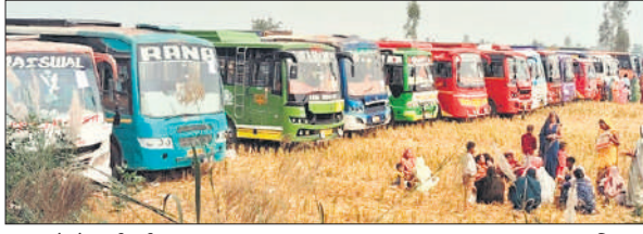
इन बसों से लाई गई जनता।

अमृत विचार: मुख्यमंत्री योगी आदित्यनाथ ने मुस्तफाबाद का नाम बदलकर कबीरधाम करने की घोषणा की। इस पर लोगों में खुशी दिखी। जनसभा के बाद लोगों ने कहा कि सालों पुराना सपना पूरा हुआ। अब मुस्ताफाबाद का नाम बदलकर कबीरधाम हो जाएगा। मुख्यमंत्री ने यह भी कहा कि जब हम मुस्तफाबाद आ रहे थे तो पता लगा कि यहां मुस्लिम समुदाय का कोई व्यक्ति नहीं रहता है। चूंकि यहां कबीरधाम है, इसलिए इसका नाम भी यही होना चाहिए। वह इसका प्रस्ताव मंगवाकर इसका नाम कबीरधाम करेंगे। मुख्यमंत्री की इस एलान से जनसभा में तालियां बजने लगीं। जनसभा के बाद लोगों ने काफी खुशी जताई।