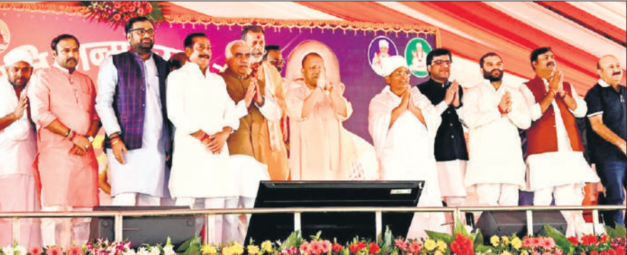
मंच से जनता का अभिवादन करते मुख्यमंत्री, असंगदेव महाराज, मंत्री और जनप्रतिनिधि।

उन्होंने कहा कि लखीमपुर खीरी जैसे सीमावर्ती जिलों में भी विकास की नई धारा बह रही है। गांव-गांव सड़कें बन रही हैं, मेडिकल कॉलेज की स्थापना