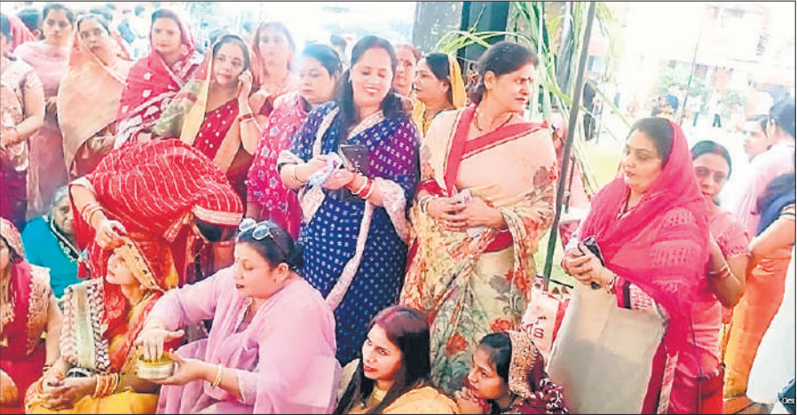
● અમૃત વિચાર