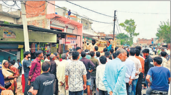
शव ले जाती पिकअप को रास्ते में रोककर हंगामा करते लोग।

प्रत्यक्षदर्शियों के मुताबिक शव के सिर पर काफी गहरे जखम थे। काफी खून भी मौके पर पड़ा था। इसके अलावा शव पर गहरे चोटों के निशान थे। इससे साफ है कि युवक की हत्या कर शव को झाड़ियों में फेंका गया है। मृतक का मोबाइल फोन और बरामद बाइक की चाबी लापता है। वाहन से जब शव पोस्टमार्टम के लिए रवाना