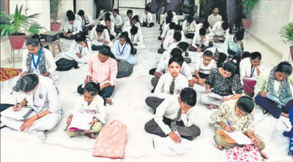
गोला की गो ज्ञान परीक्षा देते प्रतिभागी।