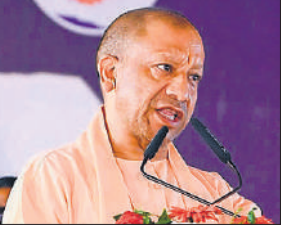
जनसभा को संबोधित करते मुख्यमंत्री योगी आदित्यनाथ।

देश की एकता को तोड़ने वाली शक्तियों से सावधान