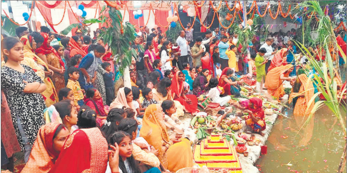
छठ पर्व को लेकर बरहा रेलवे क्रासिंग के समीप जलाशय पर अस्तगामी सूर्य को अर्घ्य देने पहुंचे व्रतधारी।

अमृत विचार : सूर्योपासना के छठ पर्व के तीसरे दिन व्रतधारियों ने अस्ताचलगामी सूर्य को अर्घ्य दिया। नाक से माथे तक मंगल सिंदूर लगाए व्रती महिलाओं ने जलाशयों-घाटों के पानी में खड़े होकर जब अर्घ्य दिया तो सिंदूरी आभा से उनके चेहरे दमक उठे। सूर्यास्त होने तक नदी तट व घाट घंटों और शंख ध्वनि से गुंजते रहे। जनपद में चार दिवसीय छठ पर्व के तहत रविवार को व्रतधारियों ने 36 घंटे का निर्जला व्रत श्रद्धा के साथ रखा। पूरे दिन पूजा-पाठ की तैयारियों का सिलसिला चलता रहा। डाला व सूप में कच्चे सूत की माला, करधनी आदि को अन्य 52 तरह की सामग्री के साथ रखा गया। सजे सूप के अगले भाग में प्रज्वलित मिट्टी का दीपक रखा गया। इधर सोमवार को सूर्यास्त से पूर्व ही बड़ी संख्या में पीत वस्त्रधारी महिलाओं ने घरों से बरहा रेलवे क्रासिंग स्थित पूजा स्थल (जलाशय) का सफर तय किया। इस दौरान महिलाओं ने हे छठी मइया हर लीं बलैया, रिमिक झिमिक बोलेली छठी मइया.. आदि गीत गाए। यहां जलाशय पर बनी वेदी पर विधि विधान से पूजा की गई। हालांकि आसमान में बादलों के सूर्यदेव ने दर्शन नहीं दिए। इसके बावजूद सूर्यास्त के