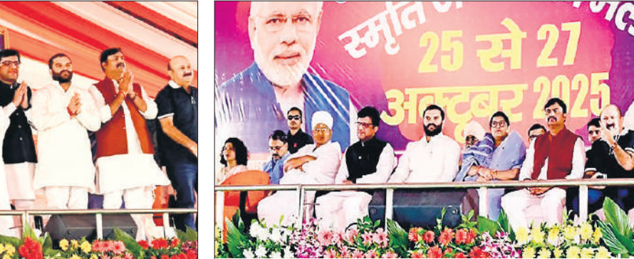
जनसभा में मंचासीन मंत्री और जनप्रतिनिधि।

समाज विरोधी ताकतें आस्था पर प्रहार करने और जाति के नाम पर विभाजन करने की कोशिश कर रही हैं। उन्होंने कहा कि अगर हम समय