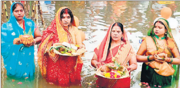
सूर्यदेव को अर्घ्य देने को जलाशय के पानी में खड़ी व्रतधारी महिलाएं। ● अमृत विचार

● बरहा रेलवे क्रासिंग के समीप जलाशय पर खूब दिखी रौनक निभाई। शाम ढलते ही घरों में श्रद्धालुओं ने कुल देवता की पूजा अर्चना की। खरना की थाली में सिंदूर और धी मिलाकर सूर्य चक्र बनाया गया और मिट्टी के दीयों में प्रसाद रखा गया। कलश को भी सजाया गया। गुड़ और दूध से बनी खीर, पूड़ी का भोग लगाया गया।महिलाएं इस निर्जला व्रत का पारायण मंगलवार को उगते सूर्य को अर्घ्य देने के बाद ही करेंगी।