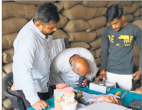
मंडी समिति में एक क्रय केंद्र पर आइरिस मशीन पर आंच लगाता किसान।