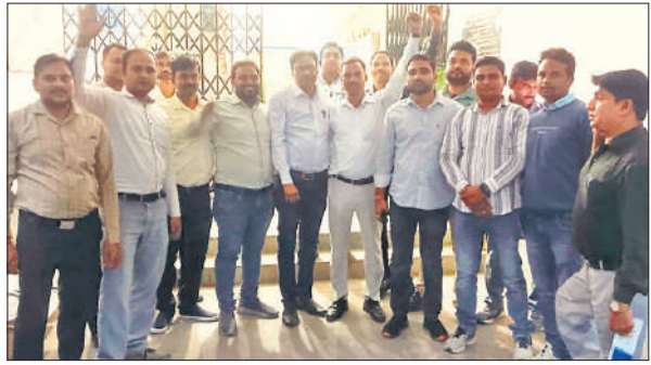
वेतन बहाली की मांग को लेकर नारेबाजी करते यूटा से जुड़े शिक्षक ।