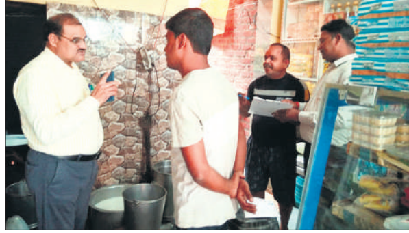
प्रतिष्ठान से दूध का सैंपल लेते खाद्य सुरक्षा विभाग के अधिकारी।