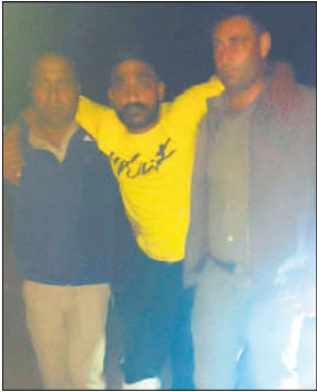
बदमाश को ले जाते पुलिसकर्मी।