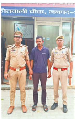
पुलिस की हिरासत में आरोपी।

शाहजहांपुर, अमृत विचार: एक शादीशुदा युवक ने खुद को कुवारा बताकर एक महिला का शारीरिक शोषण किया। विवाह नहीं करने पर पीड़िता ने आरोपी पर रिपोर्ट दर्ज कराई। चौक कोतवाली की एक महिला ने एसपी को दिए गए शिकायती पत्र में बताया उसे आरोपी ने खुद को अविवाहित बताया था, जबकि वह पहले से शादीशुदा था। आरोपी ने शादी का झूठा देकर उसके साथ कई साल तक दुष्कर्म किया। पीड़िता ने आरोपी के खिलाफ मुकदमा दर्ज कराया था। आरोप है कि एक माह पूर्व आरोपी उसके घर पर आया और मुकदमा वापस लेने के लिए दवाब बनाया। उसके साथ मारपीट की। आरोपी मुकदमा वापस नहीं लेने पर जान से मारने की धमकी दे रहा है।