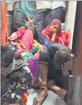
स्लीपर कोच की गैलरी में बैठे यात्री।

दरवाजा नहीं खोलते हैं। इस दौरान यात्रियों की कोच में सवार यात्रियों से हाथापाई तक की नौबत आ जाती है। दरवाजा न खुलने पर यात्री मजबूरन स्लीपर कोच की घुस जाते हैं और गैलरी में चादर बिछाकर बैठ जाते हैं। इस दौरान स्लीपर कोच के यात्रियों से नोकझोंक होती है।