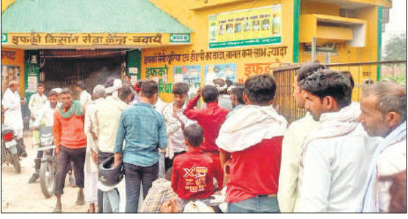
खाद लेने को लाइन में लगे किसान।

जिले भर में यूरिया और डीएपी खाद की किल्लत बनी हुई है। साधन सहकारी समितियों पर खाद नहीं पहुंची है। जिससे किसान परेशान हैं। शहर के मंडी समिति स्थित इफ्को किसान सेवा केंद्र पर सोमवार को सुबह छह बजे से महिला पुरुषों की लाइन लग गई। सुबह 10 बजे तक किसान अपने वाहनों के साथ इफ्को केंद्र पर पहुंच गए। 10 बजे केंद्र की खिड़की खुली तो लाइन