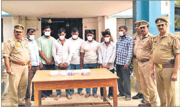
फैजगंज बेहटा पुलिस की गिरफ्त में डकैती डालने के आरोपी।