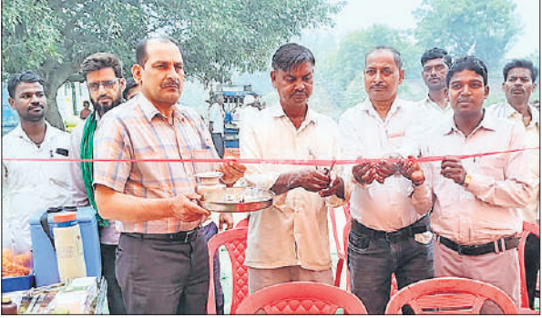
पशु आरोग्य मेले का फीता काटते ग्रामप्रधान।