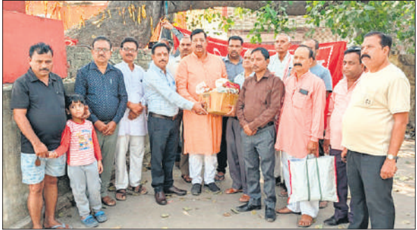
रोजा के बाबा आदर्शनाथ मंदिर से खंडित मूर्तियों का संग्रहण शुरू करते मंच के कार्यकर्ता ।

अमृत विचार: दीपावली उत्सव के बाद शहर और ग्रामीण इलाकों में परंपरागत रूप से श्रद्धालु अपने घरों से पुरानी व खंडित मूर्तियों को मंदिरों, चौराहों और सार्वजनिक स्थलों पर छोड़ देते हैं, जो शास्त्रों के अनुसार अनुचित माना गया है। इसी कुप्रथा को रोकने और जनजागरूकता फैलाने के उद्देश्य से भारतीय युवा चेतना मंच ने रविवार को “खंडित एवं परित्यक्त देव मूर्ति संग्रह कार्यक्रम” का आयोजन किया। कार्यक्रम का शुभारंभ रविवार सुबह 8 बजे रोजा स्थित बाबा आदर्शनाथ मंदिर से किया गया। मंच के कार्यकर्ताओं ने रोजा के विभिन्न मंदिरों और सार्वजनिक स्थलों से खंडित मूर्तियों को संग्रहित किया। यह अभियान निवाजपुर, रेती, हथौड़ा होते हुए शाहजहांपुर रेलवे स्टेशन के पास लाला तेली बजरिया, आवास विकास