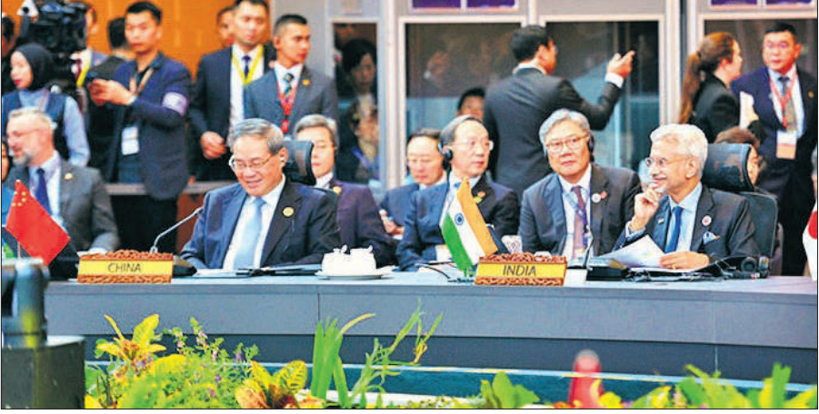
कुआलालंपुर में आसियान के शिखर सम्मेलन में भाग लेते विदेश मंत्री जयशंकर और सदस्य देशों के प्रतिनिधि।

ऐसा समझा जाता है कि जयशंकर और रुबियो ने दोनों पक्षों के बीच प्रस्तावित व्यापार समझौते पर भी व्यापक चर्चा की। भारत और अमेरिका के बीच द्विपक्षीय व्यापार समझौते के पहले चरण के लिए अब तक पांच दौर की वार्ता