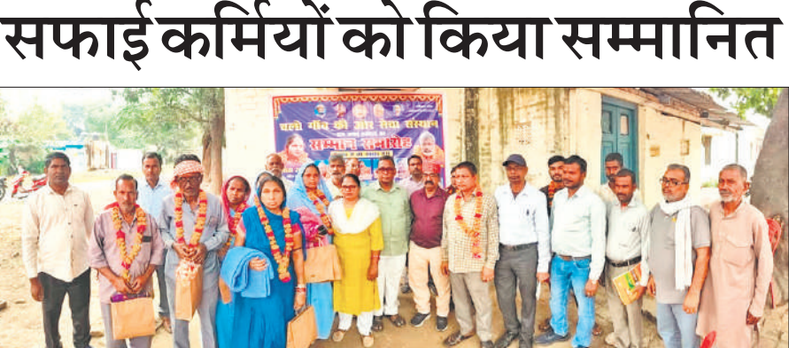
सफाई कर्मियों को चादर भेंट कर सम्मानित किया गया।