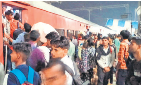
दिल्ली जाने वाली ट्रेन में भीड़।

दिल्ली जाने वाली ट्रेन श्रमजीवी एक्सप्रेस, काशी विश्वनाथ एक्सप्रेस, लखनऊ-दिल्ली मेल, पदमावत एक्सप्रेस, सत्याग्रह एक्सप्रेस, अयोध्या-दिल्ली एक्सप्रेस, छपरा दिल्ली एक्सप्रेस, शहीद एक्सप्रेस, गुवाहाटी एक्सप्रेस आदि हैं। दोनों लोहार खत्म होने के बाद दिल्ली जाने वाली ट्रेनों में भीड़ बढ़ना शुरू हो गयी है। ट्रेनों के जनरल कोच पहले से पीछे से भरकर आते हैं। यात्री जनरल कोच के दरवाजे पहले से अंदर से बंद कर लेते हैं। दिल्ली जाने वाली यात्रियों की शाम आठ बजे स्टेशन के प्लेटफार्म तीन पर भीड़ जमा हो