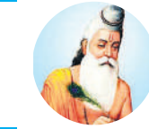
असली ताकत शारीरिक शक्ति में नहीं, बल्कि बुद्धि और आत्म-नियंत्रण में निहित है।

एनिमेशन की कला को बढ़ावा देने के उद्देश्य से एनिमेशन दिवस के अवसर पर विभिन्न सांस्कृतिक संस्थानों को एनिमेटेड फिल्मों की स्क्रीनिंग, प्रदर्शन, कार्यशालाओं के आयोजन तथा इस कला को प्रोत्साहित करने में मदद करने वाले कार्यक्रमों के आयोजन और प्रतिযোগिताओं के लिए आमंत्रित किया जाता है। इस अवसर पर दिखाई जाने वाली पूर्ण लंबाई की एनिमेशन फिल्मों और एनिमेटेड शॉर्ट्स में से कुछ फिल्में रेत, कागज तथा कम्प्यूटर का उपयोग करते हुए ड्राइंग, पेंटिंग, एनिमेटेड कठपुतलियों तथा अन्य वस्तुओं के साथ तैयार की असाधारण श्रेणी को प्रदर्शित करती हैं। कुछ एनिमेटेड फिल्में गैर-मौखिक होती हैं, जो सांस्कृतिक अभिव्यक्ति तथा संचार के लिए समृद्ध अवसर मानी जाती हैं।