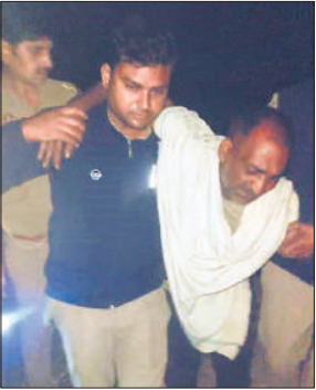
बदमाश को ले जाते पुलिसकर्मी।