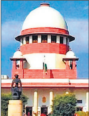
नई दिल्ली, एजेंसी

स्वतः संज्ञान लेकर दर्ज कराए गए मामलों पर तीन नवंबर को होगी सुनवाई