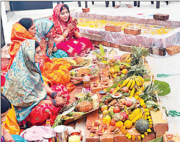
बाराबंकी स्थित साईं गार्डन कॉलोनी के घर की छत पर कृत्रिम तालाब बनाकर पूजा करती व्रती महिलाएं।

रेठ नदी के चिलहटा घाट, आलापुर घाट सहित शहर के प्रमुख तालाबों पर दीपों और गन्ने की बंदियों से सजे पूजा स्थल आकर्षण का केंद्र बने रहे। छठ मइया के गीतों करिहा क्षमा छठि मइया भूल चूक गलती हमार... घाट के बीच ब्रती महिलाओं ने घूटने पर पानी में खड़े होकर अस्ताचलगामी सूर्य को अर्घ्य अर्पित किया। पूजन के दौरान महिलाओं ने पांच परिक्रमा कर दीप प्रवाहित किए और परिवार की सुख-समृद्धि की कामना की। घर से दूर रहने वालों