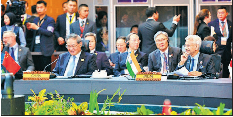
कुआलालंपुर में आसियान के शिखर सम्मेलन में भाग लेते विदेश मंत्री जयशंकर और सदस्य देशों के प्रतिनिधि।

भारतीय वस्तुओं पर अमेरिका द्वारा लगाए गए शुल्क के कारण दोनों देशों में पैदा हुए तनाव के बाद द्विपक्षीय संबंधों को फिर से पटरी पर लाने के प्रयासों के बीच, विदेश मंत्री एस जयशंकर और अमेरिका के विदेश मंत्री मार्को रुबियो ने सोमवार को यहां वार्ता की। जयशंकर और रुबियो की मुलाकात कुआलालंपुर में दक्षिण पूर्व एशियाई राष्ट्र संघ ( आसियान ) के वार्षिक शिखर सम्मेलन से इतर हुई। जयशंकर ने सोशल मीडिया एक 'पोस्ट' में लिखा कि कुआलालंपुर में आज सुबह विदेश मंत्री रुबियो से मिलकर खुशी हुई। हमारे द्विपक्षीय संबंधों के साथ-साथ क्षेत्रीय और वैश्विक मुद्दों पर हुई चर्चा की सराहना की। अमेरिका के राष्ट्रपति डोनाल्ड ट्रंप द्वारा भारत पर 50 प्रतिशत शुल्क लगाए जाने के बाद से नई दिल्ली और वाशिंगटन के संबंधों में गंभीर तनाव पैदा हो गया है। इस शुल्क में रूसी कच्चे तेल की खरीद पर लगाया गया 25 प्रतिशत अतिरिक्त शुल्क भी शामिल है। भारत ने अमेरिका के इस कदम को अनुचित, असंगत और अविवेकपूर्ण बताया। ऐसा समझा जाता है कि जयशंकर और रुबियो ने दोनों पक्षों के बीच प्रस्तावित व्यापार समझौते पर भी व्यापक चर्चा की। भारत और अमेरिका के बीच द्विपक्षीय व्यापार समझौते के पहले चरण के लिए अब तक पांच दौर की वार्ता