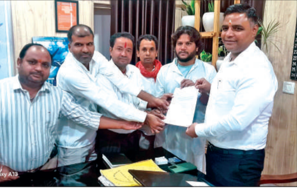
एसडीएम को ज्ञापन सौंपते यूनियन के पदाधिकारी।