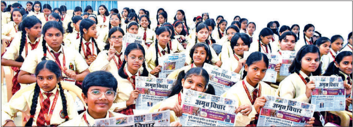
विद्या वर्ल्ड स्कूल में स्तन कैंसर जागरूकता कार्यक्रम में मौजूद बच्चे ।