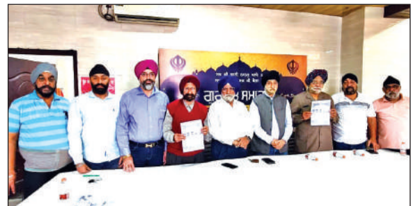
प्रकाश पर्व को लेकर आयोजित प्रेस वार्ता में मौजूद गुरुद्वारा प्रबंधक कमेटी के पदाधिकारी।

श्रद्धालुओं ने एक-दूसरे को पर्व की शुभकामनाएं दीं। छठ महापर्व की शुरुआत 25 अक्टूबर को नहाय-खाय से हुई थी। इसके बाद खरना, संध्या अर्घ्य और अंत में उषा अर्घ्य के साथ मंगलवार को व्रत का पारायण किया गया। पर्व के लिए नगर निगम व पुलिस की ओर से विशेष प्रबंध किए गए। सफाई, रोशनी व सुरक्षा के मद्देनजर टीमों की तैनाती की गई थी। स्वयंसेवी संगठनों ने श्रद्धालुओं को फल बांटे।