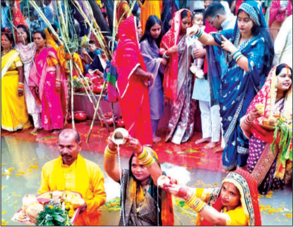
उगते सूर्य को अर्घ्य देती व्रतधारी महिलाएं। ● अमृत विचार

अमृत विचार: पूर्वांचल समाज का पावन पर्व छठ महापर्व उगते सूर्य को अर्घ्य देने के बाद आस्था पूर्वक संपन्न हो गया है। पूजा अर्चना करने के बाद निर्जला व्रतधारियों ने भोजन ग्रहण किया और छठ मईया से सुख समृद्धि की कामना की। बताते चलें कि रविवार की सुबह से ही शहर में छठ महापर्व को लेकर पूर्वांचल समाज में आस्था का उत्साह देखने को मिला था। सोमवार को शाम ढलते ही बड़ी संख्या में समाज के लोग शहर के कई स्थानों पर बने छठ घाटों पर पहुंचे और डूबते सूर्य को अर्घ्य देकर पूजा अर्चना की थी। वहीं मंगलवार की सुबह चार बजे से बड़ी संख्या में श्रद्धालु धोबी घाट, पैराडाइज झील, अटरिया, नारायणपुर, कीरतपुर, गंगापुर में बने छठ घाटों पर पहुंचने शुरू हो गए। पांच बजे तक छठ घाटों पर आस्था का सैलाब उमड़ पड़ा। सूर्य की पहली किरण धरती पर पड़ते ही छठ मईया व भजनों की धुन से घाट गुंजायमान हो गए। निर्जला व्रतधारियों ने सूर्य को अर्घ्य देकर पूजा अर्चना कर छठ महापर्व की आखिरी आराधना की। इसके बाद व्रतधारियों ने घर पहुंचकर छठ मईया की पूजा अर्चना के साथ ही भोजन का सेवन किया। इस अवसर पर पूर्वांचल समाज समिति