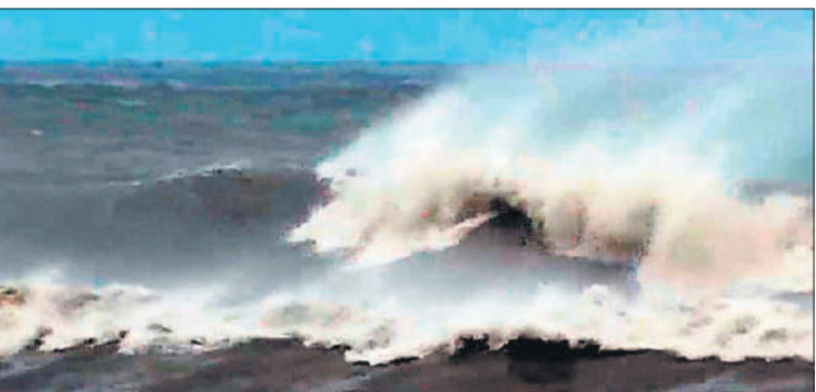
आंध्र प्रदेश : चक्रवात मोंथा के कारण कृष्णा जिले के मंगिनापुडी तट पर समुद्र में मची उथल-पुथल।

प्रचंड चक्रवाती तूफान मोंथा मंगलवार देर रात आंध्र प्रदेश के तट से टकरा गया है। भारत मौसम विज्ञान विभाग (आईएमडी) ने मंगलवार देर शाम सोशल मीडिया मंच ‘एक्स’ के अपने अधिकारिक हैंडल पर किए एक पोस्ट में कहा कि तूफान की नवीनतम स्थिति के मुताबिक इसके तट से टकराने की प्रक्रिया शुरू हो गई है। चक्रवाती तूफान के प्रभाव से समुद्र में लहरों की भारी उथल-पुथल जारी है। आईएमडी