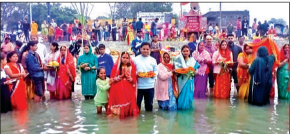
टनकपुर के शारदा घाट में उगते सूर्य की पूजा करती महिलाएं व पुरुष ।● अमृत विचार

संध्या, झोड़ा नृत्य, एकल महिला नृत्य प्रतियोगिता, महिला पारंपरिक परिधान प्रतियोगिता व महिला गायन प्रतियोगिता आयोजित की जाएंगी।