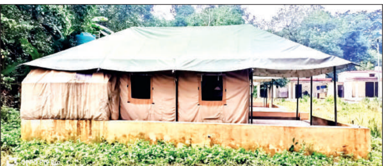
सुरई के जंगलों में लगाए गए टेंट हाउस । ● अमृत विचार

तराई पूर्वी वन डिवीजन के अंतर्गत सुरई रेंज के जंगल उप्र के पीलीभीत टाइगर रिजर्व से सटे हुए हैं। जो पीटीआर के लिए बफर जोन भी हैं। बाघ अक्सर पीटीआर से सुरई रेंज में आवाजाही करते हैं। उनका कॉरिडोर बन चुका है। वन्यजीवों के लिए मुफीद