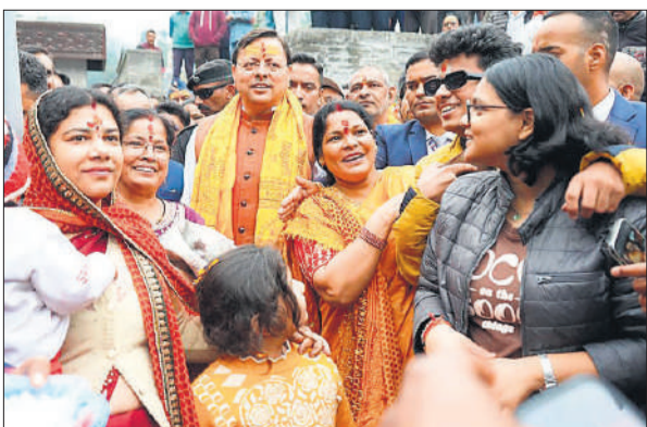
मंगलवार को जागेश्वर धाम पहुंचे सीएम धामी ने स्थानीय श्रद्धालुओं से भेंट की।

अमृत विचार: मुख्यमंत्री पुष्कर सिंह धामी ने कहा कि, जनसेवा और सीमाओं की सुरक्षा, यही उत्तराखंड की पहचान है। मंगलवार को विकासखंड मुनस्यारी के एक दिवसीय दौरे पर पहुंचे मुख्यमंत्री ने क्षेत्रीय जनता और जवानों के साथ आत्मीय संवाद किया। मुख्यमंत्री ने इस अवसर पर कहा कि राज्य सरकार का लक्ष्य है कि हर अंतिम व्यक्ति तक विकास की रोशनी पहुंचे और सीमांत क्षेत्रों के लोगों को बुनियादी सुविधाएं सुलभ हों। उन्होंने जनता को आश्वस्त किया कि सरकार निरंतर सीमांत अंचलों के समग्र विकास के लिए प्रतिबद्ध है। मुख्यमंत्री