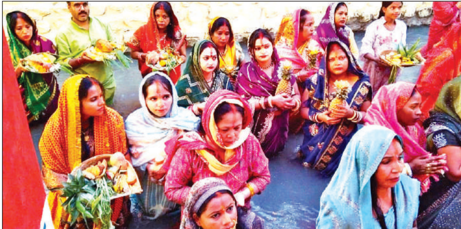
छठ पूजा स्थल पर मंगलवार की सुबह पूजा-अर्चना करती महिलाएं। ● अमृत विचार

अमृत विचार: लोक आस्था और सूर्य उपासना का चार दिवसीय महापर्व छठ पूजा मंगलवार को उगते सूर्य को अर्घ्य देने के साथ विधिवत संपन्न हो गया। सुबह की पहली किरण के साथ ही शहर के विभिन्न घाटों पर श्रद्धा और भक्ति का अद्भुत संगम देखने को मिला। रामपुर रोड स्थित छठ पूजा स्थल पर बड़ी संख्या में व्रती महिलाएं और श्रद्धालु एकत्र हुए और उगते सूर्य को अर्घ्य अर्पित कर परिवार की सुख-समृद्धि की कामना की। सुबह करीब छह बजे जैसे ही सूर्य की लालिमा क्षितिज पर उभरी, व्रती महिलाओं ने जल में खड़े होकर हाथ जोड़ सूर्य देव