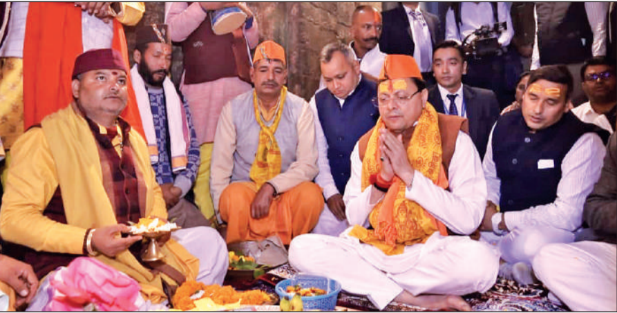
जागेश्वर धाम में पूजा-अर्चना करते मुख्यमंत्री पुष्कर सिंह धामी।

मुख्यमंत्री ने जागेश्वर धाम परिसर का पैदल भ्रमण एवं निरीक्षण किया तथा जागेश्वर धाम मास्टरप्लान की विस्तृत समीक्षा की। उन्होंने अधिकारियों को निर्देश दिए कि सभी कार्य निर्धारित समयसीमा के भीतर और गुणवत्तापूर्ण ढंग से पूरे किए जाएं। कहा कि जागेश्वर धाम हमारी