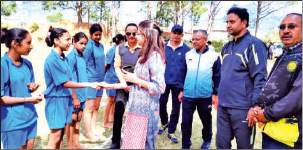
ताड़ीखेत में खिलाड़ियों से परिचय प्राप्त करती संयुक्त मजिस्ट्रेट ।

वहीं, जिस ओर रिक्शा पलटा उस समय वहां कोई नहीं था। इससे बड़ा हादसा टल गया। वहीं, माल रोड की बदहाली पर लोगों में रोष बना हुआ है। लोगों का कहना है कि बार बार पेंच वकं का काम किया जाता है, लेकिन कुछ समय बाद हालात वहीं हो जाते हैं।