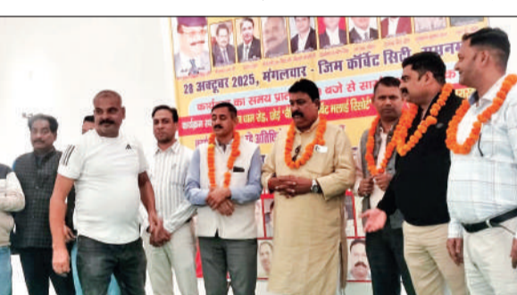
रामनगर में आयोजित सम्मेलन में मंवासीन लोग। ● अमृत विचार

छोई स्थित एक रिसॉर्ट में आयोजित सम्मेलन में सिक्योरिटी इंडस्ट्री में आ रही समस्याओं पर चर्चा की गई। बैठक का अहम मुद्दा उन कंपनियों के विरुद्ध रहा जो बिना पसारा लाइसेंस के अवैध रूप से सिक्योरिटी एजेंसी चला रहे हैं। कहा कि बिना लाइसेंस के सिक्योरिटी एजेंसी संचालित करने वालों पर कार्यवाही करने की मांग की गई। साथ ही बेहद कम वेतन और बिना पूरे मानक के सिक्योरिटी