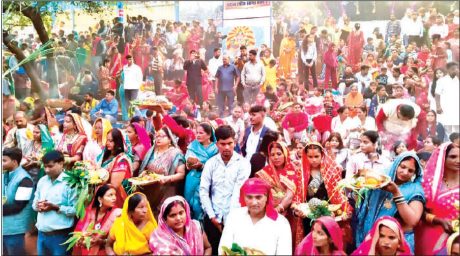
रुद्रपुर में मंगलवार को छठ घाट पर लगी श्रद्धालुओं की भीड़।