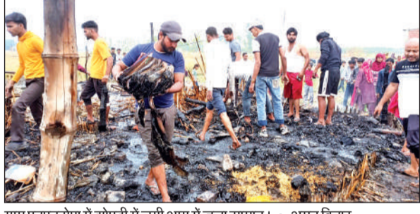
ग्राम एनएनटोपा में झोपड़ी में लगी आग में जला सामान।