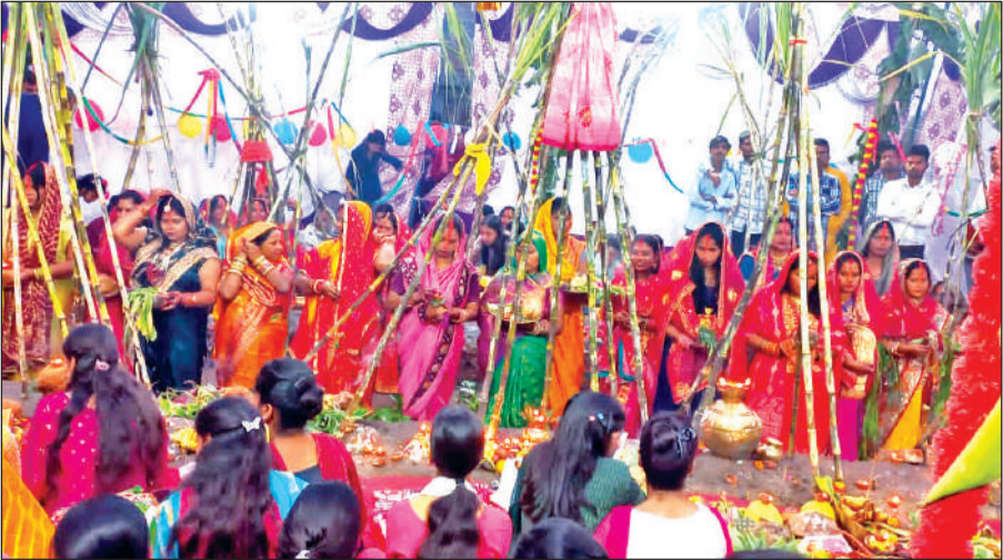
सितारगंज में उगते हुए सूर्य को अर्घ्य देती व्रती महिलाएं।