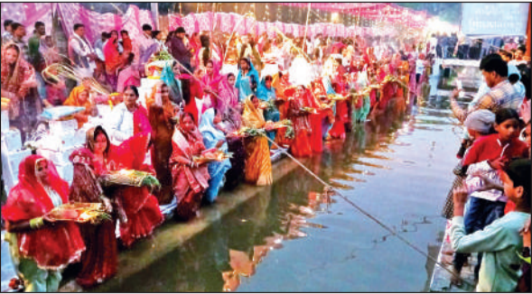
बाजपुर में उगते हुए सूर्यदेव को सामूहिक रूप से अर्घ्य अर्पित करती व्रती महिलाएं।

अमृत विचार: लोक आस्था व सूर्य देव की कठिन साधना का महापर्व छठ उगते सूर्य को अर्घ्य देने के साथ ही समाप्त हो गया है। व्रती महिलाओं ने पूरी श्रद्धाभाव से सूर्य उपासना कर घर-परिवार में सुख-समृद्धि की कामना की। सहकारी चीनी मिल से सटकर गुजर रही लेवड़ा नदी की माइनर नहर किनारे बने घाट पर सामूहिक रूप से छठ पूजा की गई। समाज के लोगों ने बताया कि 36 घंटे