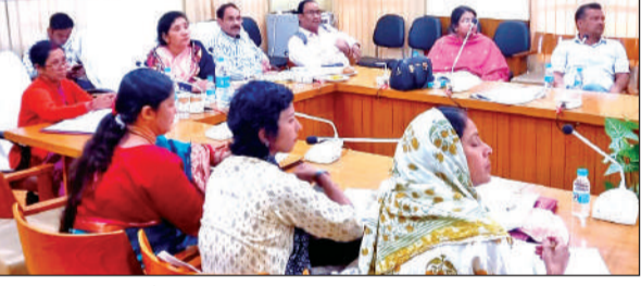
जिला पंचायत सदस्यों का प्रशिक्षण कार्यक्रम।

दूसरे दिन पंचायत सदस्यों को विभिन्न सरकारी योजनाओं, वित्तीय प्रबंधन, पारदर्शिता और ग्राम विकास के व्यवहारिक पहलुओं की जानकारी दी गई। मास्टर ट्रेनर