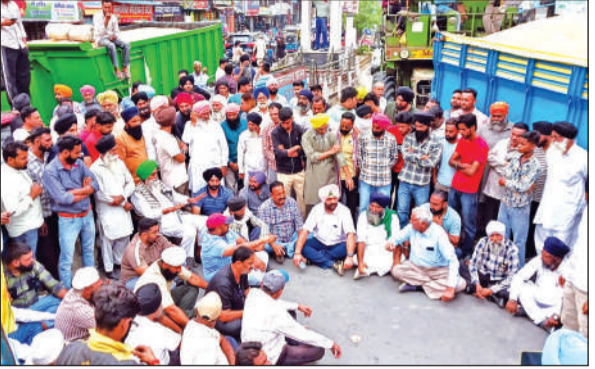
बाजपुर में धान तौल में अव्यवस्था के खिलाफ धरना देते किसान। ● अमृत विचार

बाजपुर में इस बार धान तौल व्यवस्था पटरी पर नहीं आ पा रही है। धान तौल की धीमी गति एवं कच्चा आढ़तियों द्वारा सरकारी मानकों के अनुरूप निर्धारित मूल्य पर धान खरीद कर पाने में असमर्थता जताने के चलते किसान अनाज मंडी में धान से लदी करीब 200 ट्रालियों को लेकर खड़े हैं, जोकि इस प्रयास में हैं कि किसी तरह व्यवस्था बने और उनकी उपज सही दामों पर बिक जाए। इसके लिए किसान पिछले लंबे समय से अधिकारियों एवं राइसमिलर्स व्यापारियों से वार्ता कर समस्या समाधान का प्रयास करते आ रहे हैं, लेकिन उनकी सारी कोशिशें बेकार चली गई, जिसके चलते मंगलवार को किसानों का धैर्य जवाब दे गया