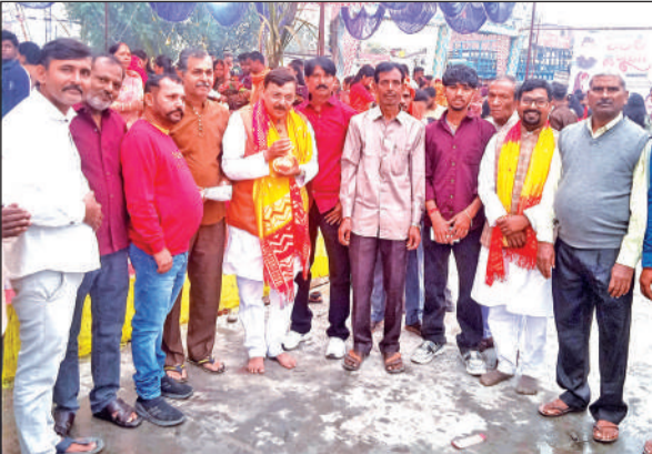
शांतिपुरी में छठ पर्व पर आयोजित कार्यक्रम में मौजूद श्रद्धालु।