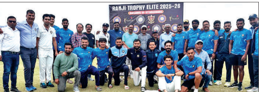
मेच ड्रा होने के बाद टीमों के खिलाड़ी एवं आयोजक।