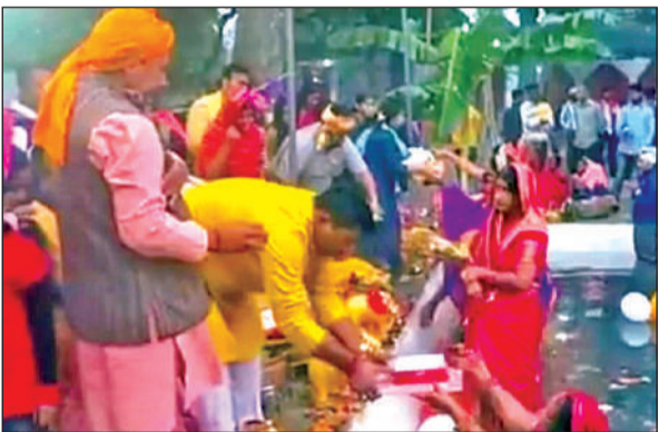
काशीपुर में उगते सूर्य को अर्घ्य देने से पहले पूजा अर्चना करती महिलाएं।