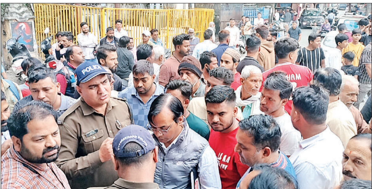
सैकड़ों लोग स्मार्ट मीटर लगाने के विरोध में सड़क पर उतरे । ● अमृत विचार

मंगलवार को ऊर्जा निगम की टीम राजपुर में टनकपुर रोड पर स्मार्ट मीटर लगाने पहुंचीं। टीम घर-घर जाकर मीटर लगाना शुरू किया कि लोगों ने विरोध शुरू कर दिया। उन्होंने आरोप लगाया कि टीम गृह स्वामियों से पूछे बिना ही पुराने मीटर तोड़कर नए स्मार्ट मीटर लगा रही है। बिजली विभाग की ओर से कोई पूर्व सूचना नहीं दी गई। यह भी आरोप लगाया कि यदि कोई स्मार्ट मीटर नहीं लगाना चाह रहा है तो जबरन गुंडई के बल पर स्मार्ट मीटर लगाया जा रहा है। इस बीच हंगामे की सूचना पर भीड़ इकट्ठा हुई और बिजली विभाग के खिलाफ नारेबाजी एवं प्रदर्शन शुरू कर दिया। गुस्साए स्वर में कहा कि स्मार्ट मीटर लगाने के बाद लोगों के