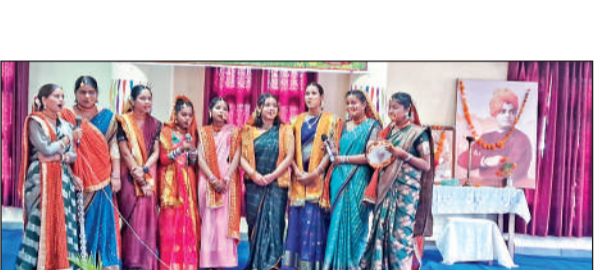
युवा महोत्सव में कार्यक्रम प्रस्तुत करती छात्राएं।