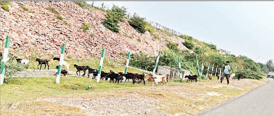
कटी फेंसिंग से एक्सप्रेस-वे की ओर जाते मवेशी ।

बता दें कि हसनगंज कोतवाली क्षेत्र से लेकर औरास तक लखनऊ-आगरा एक्सप्रेस-वे के किनारे की जाली कई जगह टूट गई है । इसके चलते आसपास के अन्ना व पालतू मवेशी एक्सप्रेस-वे पर पहुंच जाते हैं । कई बार इनसे हादसे भी हुए हैं लेकिन, अभी तक इन टूटी जालियों को दुरुस्त नहीं किया गया है । जानकारी के अनुसार, प्रदेश की देश भर में बेहतर कनेक्टिविटी के लिए लखनऊ-आगरा एक्सप्रेस वे बनाया गया था । जिसमें करीब 11,527 करोड़ की लागत लगी थी । इससे प्रदेश की राजधानी लखनऊ