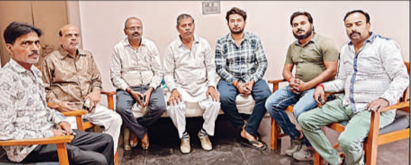
बैठक में मौजूद वैश्य महासमिति के पदाधिकारी ।