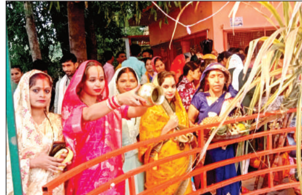
से अर्घ्य दिया और व्रत के समापन पर परिवार की सुख-समृद्धि की कामना की। इसके साथ ही भक्तों ने सूर्य भगवान से आराधना की कि हमारे देश की इस संस्कृति पर वे अपनी कृपा बनाये रखें, ताकि हजारों वर्ष बाद भी हमारी पुत्रवधुएं यूँ ही सज-धज कर

परिवार की सुख-समृद्धि की कामना की। इसके साथ ही भक्तों ने सूर्य भगवान से आराधना की कि हमारे देश की इस संस्कृति पर वे अपनी कृपा बनाये रखें, ताकि हजारों वर्ष बाद भी हमारी पुत्रवधुएं यूँ ही सज-धज कर