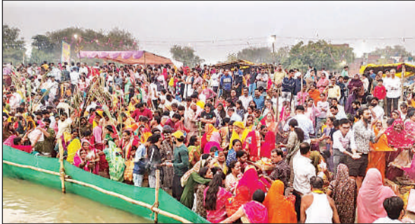
गंगा तट पर उमड़ी श्रद्धालुओं की भीड़ ।

अमृत विचार । चार दिनों तक चलने वाले लोकआस्था के पर्व छठ का मंगलवार सुबह उगते सूर्य को अर्घ्य अर्पित कर विधि-विधान के साथ समापन हो गया । तड़के 4 बजे से नगर के विभिन्न मोहल्लों से महिलाएं-परिवारजन कलश और डाला सिर पर रखकर जयछठ मड़या के गीतों के साथ गंगा तट की ओर रवाना होती रहीं । गंगातट पर पहुंचकर श्रद्धालुओं ने पूजा की तैयारी की और उदीयमान सूर्य को अर्घ्य समर्पित कर परिवार की समृद्धि, संतान की दीर्घायु व सुख-शांति की कामना की ।