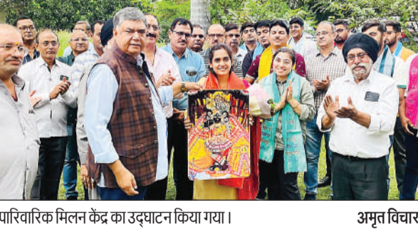
पारिवारिक मिलन केंद्र का उद्घाटन किया गया।