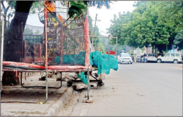
नगर निगम के सामने मोतीझील में सड़क तक लगा झूला।

सुप्रीम कोर्ट ने पैदल यात्रियों की सुरक्षा के लिए देश भर में फुटपाथों का सुरक्षा ऑडिट कराने का आदेश दिया है। इसका उद्देश्य फुटपाथों की स्थिति का आकलन करना और पैदल चलने वालों के लिए सुरक्षित वातावरण बनाना है। अदालत ने फुटपाथों पर अतिक्रमण रोकने के भी निर्देश दिए हैं, जिससे सड़क दुर्घटनाओं को कम किया जा सके। लेकिन, शहर में पांश इलाकों, बाजारों, यहां तक गली मोहल्लों तक के फुटपाथ पर कब्जा है। यहां