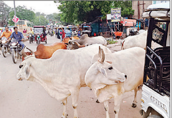
आईबीपी चौराहा में सड़क के बीचोबीच खड़े छुट्टा मवेशी ।

मवेशियों की घमाकोड़ी से कई बार ट्रैफिक थम जाता है और जाम लगता है । खासकर भीमाडूड वाले इलाकों जैसे बड़ा चौराहा, छेठा चौराहा, आवास विकास कालोनी, आईबीपी व हिरन नगर सहित अन्य जगह स्थिति सबसे खराब होती है । ये मवेशी सिर्फ यातायात ही बाधित नहीं कर रहे बल्कि जानलेवा हादसों का कारण भी बन रहे हैं । शनिवार को आसीवन क्षेत्र में एक घटना सामने आई थी । जहां छुट्टा मवेशी के हमले से एक किसान की मौत हो गई थी । इस घटना ने इन मवेशियों के आतंक की गंभीरता को