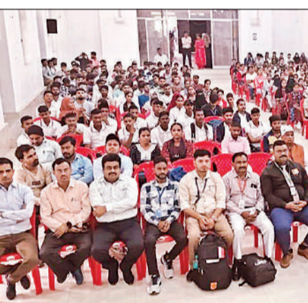
डीएसएन कॉलेज में आयोजित रोजगार मेले में मौजूद अभ्यर्थी ।