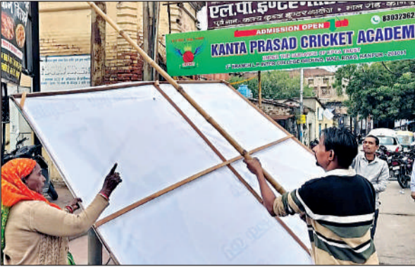
माल रोड में अवैध विज्ञापन को हटाने नगर निगम कर्मचारी।