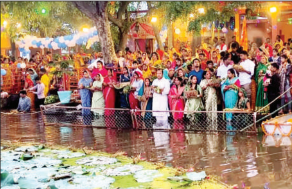
रनियां के अमृत सरोवर में जुटी श्रद्धालुओं की भीड़, सूर्य देव को अर्घ्य देतीं व्रती महिलाएं।

मंगलवार की सुबह सूर्योदय के समय कमर तक पानी में जाकर छठ व्रतियों ने सूर्य को अर्घ्य दिया। उसके बाद ठेकुआ प्रसाद और जल ग्रहण कर व्रत समाप्त किया। इसी के साथ 36 घंटे का निर्जला उपवास भी खत्म हो गया। यहां महिलाओं ने छठी मैया को प्रसन्न करने के लिए परंपरागत गीत गाए।