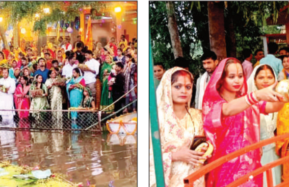
रसूलाबाद: छठ पूजा के अंतिम दिवस मंगलवार सुबह श्रद्धालु भक्तों ने उषाकालीन उदीयमान सूर्य को अर्घ्य देकर उनका पूजन अर्चन किया और

मंगलवार की सुबह सूर्योदय के समय कमर तक पानी में जाकर छठ व्रतियों ने सूर्य को अर्घ्य दिया। उसके बाद ठेकुआ प्रसाद और जल ग्रहण कर व्रत समाप्त किया। इसी के साथ 36 घंटे का निर्जला उपवास भी खत्म हो गया। यहां महिलाओं ने छठी मैया को प्रसन्न करने के लिए परंपरागत गीत गाए।