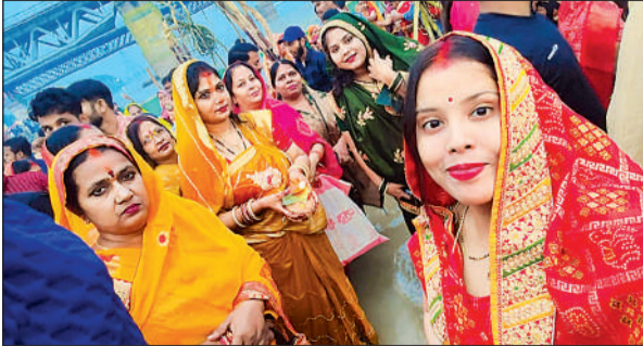
पूजन के दौरान सेल्फी लेती महिलाएं ।

पूजन-अर्चन किया । आसमान में हल्के बादल छाए रहने के कारण कुछ देर तक सूर्य दर्शन नहीं हुए, लेकिन परम्परानुसार श्रद्धालुओं ने सूर्यास्त के समय के अनुरूप ही