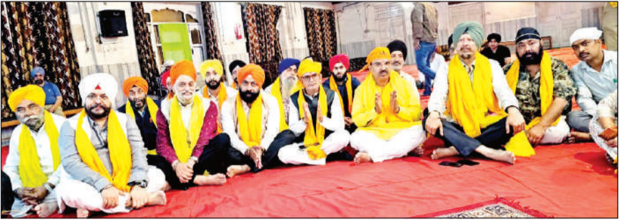
यात्रा का स्वागत करने जुटे भाजपाई।

इन पवित्र जोड़ों को श्री गुरु गोविंद सिंह जी की जन्मस्थली पटना साहिब में सुरक्षित रखने का