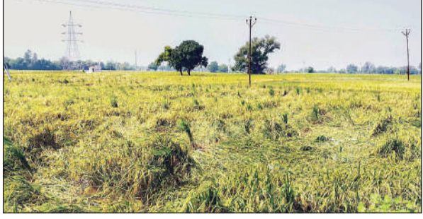
बारिश और तेज हवा के चलते पलटौ पड़ी फसल।

आलू की फसल पर मार: कृषि विशेषज्ञों के अनुसार, यह बारिश आलू की बुआई के लिए भी हानिकारक है। खेतों में