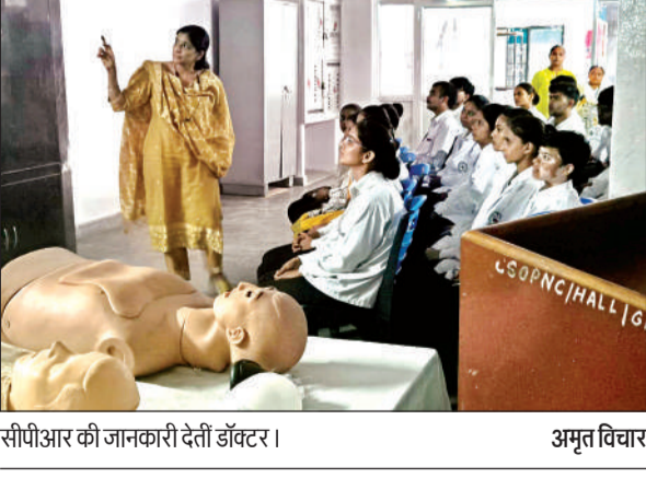
सीपीआर की जानकारी देती डॉक्टर।

कानपुर। छठ महापर्व के पश्चात यात्रियों की वापसी यात्रा के लिए रेलवे प्रशासन द्वारा छपरा-लोकमान्य तिलक टर्मिनस-छपरा वाया कानपुर, गोरखपुर पूजा विशेष गाड़ी का संचालन किया जायेगा।। ये गाड़ी 30 अक्टूबर को सुबह 10.55 बजे कानपुर सेंट्रल स्टेशन से तैयारी बैठक हुई। ये गाड़ी छपरा से 29 अक्टूबरको तथा लोकमान्य तिलक टर्मिनस से 31 अक्टूबर को चलेगी। गाड़ी संख्या 05083 छपरा-लोकमान्य तिलक टर्मिनस पूजा विशेष गाड़ी 29 अक्टूबर को छपरा से रात 8 बजे रवाना होगी। ये गाड़ी 30 अक्टूबर को कानपुर सेंट्रल सुबह 10.55 बजे पहुंचेगी। उरई दोपहर 1.20 बजे, झांसी 4.20 बजे, लोकमान्य तिलक टर्मिनस दूसरे दिन दोपहर 12.00 बजे पहुंचेगी। गाड़ी संख्या 05084 पूजा विशेष गाड़ी 31 अक्टूबर, 2025 को लोकमान्य तिलक टर्मिनस से 2.00 बजे प्रस्थान करेगी। झांसी 1 नवंबर को सुबह 9.55 बजे, उरई सुबह 11.07 बजे और कानपुर सेंट्रल दोपहर 2.05 बजे आएगी। छपरा छपरा सुबह 4.45 बजे पहुंचेगी। इस गाड़ी में शयनयान श्रेणी 04, वातानुकूलित तृतीय इकोनॉमी श्रेणी 10, सामान्य द्वितीय श्रेणी/सामान्य द्वितीय श्रेणी कुर्सीयान 04 कोचों सहित कुल 20 कोच होंगे।