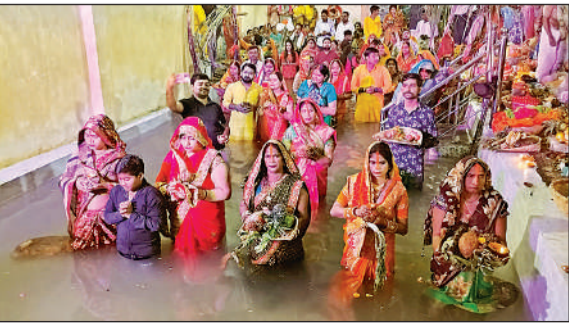
चंद्रशेखर आजाद (लिली) पार्क में उगते सूर्य को अर्घ्य देती महिलाएं ।