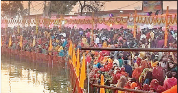
हाटा काशी विश्वनाथ मंदिर छठ घाट पर उमड़ी श्रद्धालुओं की भीड़।