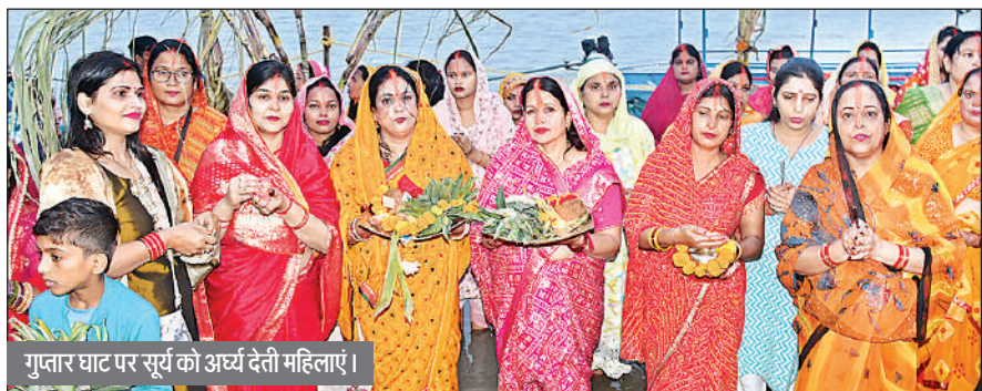
गुप्तार घाट पर सूर्य को अर्घ्य देती महिलाएं।