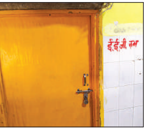
इसी कमरे में बंद है ईईजी मशीन।

ईईजी मशीन होने की जानकारी है। इस समय कमरे में बंद है। टेक्निशियन नहीं है, लेकिन बीच में संचालन हुआ था। अब क्यों बंद हो गई है। इसके बारे में बुधवार को पता कराता हूं।-डॉ. अजय चौधरी, चिकित्सा अधीक्षक।