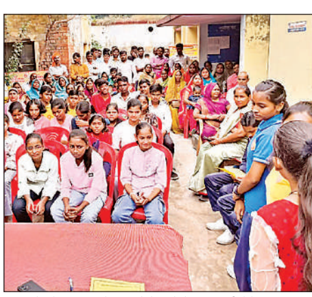
छात्राओं को विभिन्न योजनाओं के बारे में जानकारी देते श्रम विभाग के जिम्मेदार अधिकारी और कर्मचारी ।