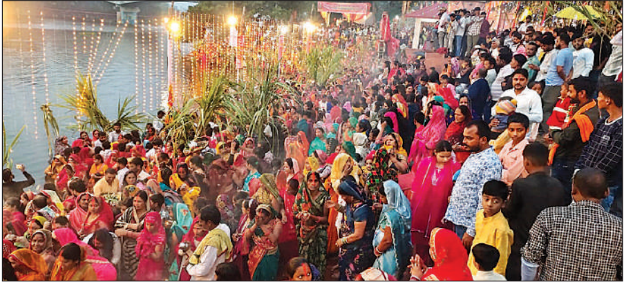
करनैलगंज सरयू तट पर सूर्य को अर्घ्य देने के लिए जुटीं व्रती महिलाएं व परिवारीजन।

पूर्वांचल और बिहार में पुजों की दीर्घायु और परिवार की मंगल कामना के लिए मनाया जाने वाला यह चार दिवसीय महापर्व शनिवार से प्रारंभ हुआ था। नहाय खाप और खरना के बाद इस महापर्व पर