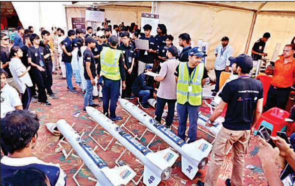
कार्यक्रम स्थल पर मौजूद वैज्ञानिकों की टीम।

बावजूद उन्हें पुनः आवंटन उप्र की जमींदारी विनाश एवं भूमि व्यवस्था अधिनियम की धारा 198(3) (i) के प्रावधानों का उल्लंघन करते हुए अनुचित लाभ पहुंचाया गया। इस मामले में गांव के लोगों ने डीएम से शिकायत दर्ज कराई थी। प्रशासन ने इस मामले को गंभीरता से लेते हुए एस्ट्रो-टर्फ, लाइटिंग, फेंसिंग, ड्रेनेज सिस्टम, सी.सी. रोड, ट्यूबवेल बोरिंग