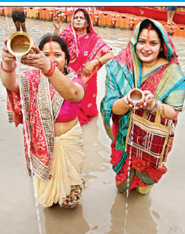
सूर्य को अर्घ्य देती महिलाएं।