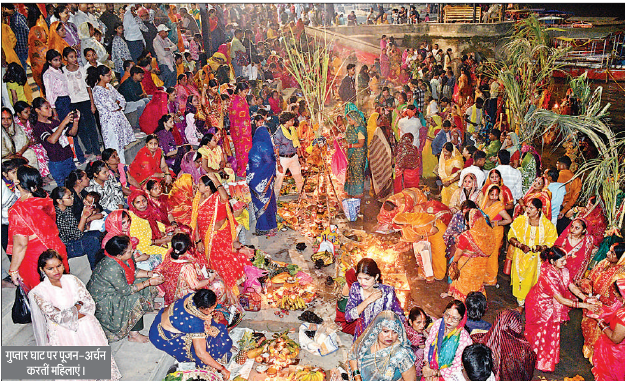
गुप्तार घाट पर पूजन-अर्चन करती महिलाएं।