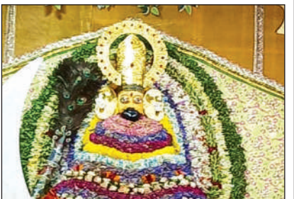
मंदिर में स्थापित बाबा खाटू श्याम।