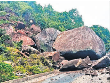
ओडिशा में भूस्खलन से गजपति जिले के मार्ग पर फैला मलबा।

गजपति जिले के अनाका ग्राम पंचायत से प्राप्त जानकारी के अनुसार, पास की पहाड़ियों से बड़े-बड़े पत्थर गिरे, जिससे पांच गांवों की सड़कें अवरुद्ध हो गईं। विशेष राहत आयुक्त कार्यालय के एक अधिकारी ने बताया, चक्रवात के राज्य से गुजरने के बाद विभिन्न जिलों से हुए नुकसान की रिपोर्ट संकलित की जाएगी। ओडिशा के दक्षिणी जिलों में 2,000 से अधिक आपदा राहत केंद्र खोले गए हैं। मुख्यमंत्री