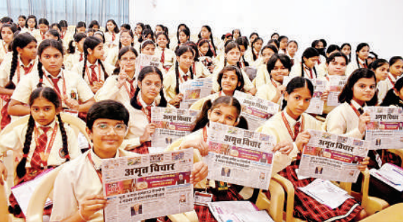
विद्या वर्ल्ड स्कूल में स्तन कैंसर जागरूकता कार्यक्रम में मौजूद बच्चे। अमृत विचार

रोहिलखंड कैंसर इंस्टीट्यूट और अमृत विचार के संयुक्त तत्वावधान में ब्रेस्ट कैंसर जागरूकता माह के तहत तीन दिवसीय नारी कैंसर सुरक्षा अभियान मंगलवार को शुरू हुआ। पहले दिन शहर के विद्या वर्ल्ड पब्लिक स्कूल, राधा माधव पब्लिक स्कूल और केसीएमएटी में छात्राओं