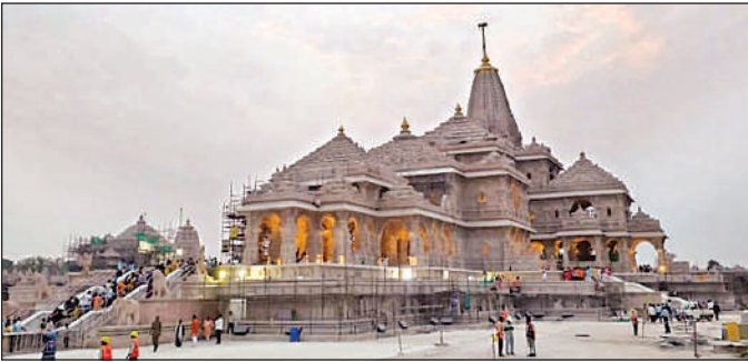
राम मंदिर परिसर में चल रही तैयारी।

उन्होंने कहा कि राम मंदिर के शिखर पर ध्वज लगाया जाना एक बड़ी चुनौती