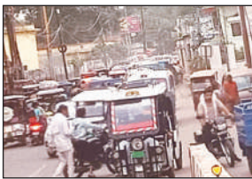
जीआईसी गेट के सामने लगा जाम।

की ओर घूमते हैं। ऐसे में चौड़ाई कम होने के कारण वाहनों का जाम लग जाता है। इसलिए इस तिराहे से आगे बढ़ने के लिए 20 मिनट से आधे घंटे तक का समय चाहिए। व्यवस्था के नाम पर कभी कभार होमगार्ड की तैनाती यहां दिखती है लेकिन ज्यादा समय तक तो आने जाने वाले स्वयं जाम में फंसेते हैं और निकलते भी हैं।