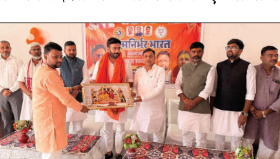
मुख्य अतिथि का स्वागत करते भाजपा के प्रदाधिकारी।

मुख्य अतिथि प्रदेश उपाध्यक्ष द्विवेदी ने कहा कि युवा मोर्चा का उद्देश्य युवाओं को राष्ट्र निर्माण की मुख्यधारा से जोड़ना है। आत्मनिर्भर भारत का सपना तभी साकार होगा जब युवा वर्ग अपने