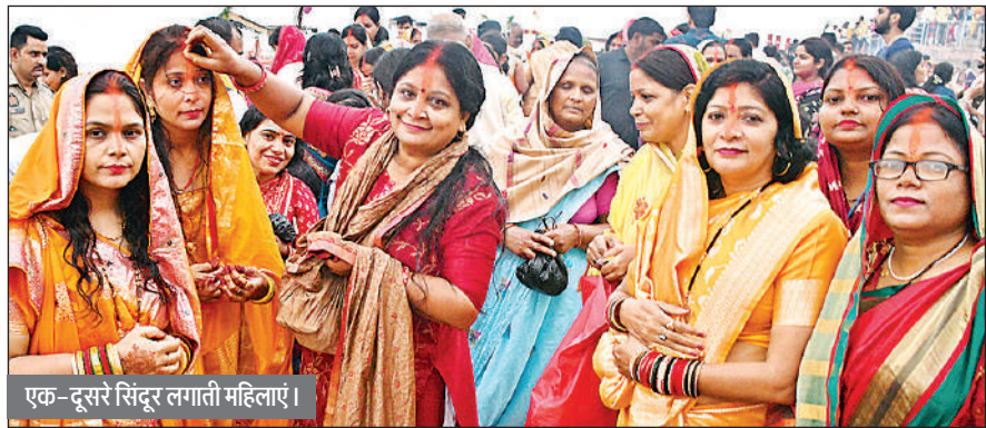
एक-दूसरे सिंदूर लगाती महिलाएं।