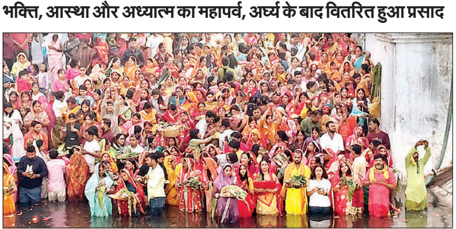
उगते सूर्य को अर्घ्य देती महिलाएं।

ग्रामीण इलाकों में छठ पूजा की धूम रही। नदियों, तालाबों पर बने घाट पर जाकर व्रती महिलाओं ने भगवान भास्कर को अर्घ्य दिया। धानेपुर में बिसुही नदी पर बनाए गए शक्ति संगम घाट पर महिलाओं ने उगते सूर्य को अर्घ्य देकर परिवार के कटरा घाट पर छठ व्रती महिलाओं ने