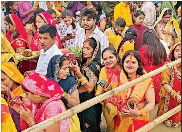
छठ पर्व पर घाट पर पूजन करके लौटती महिलाएं।