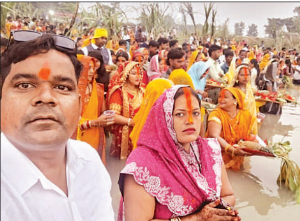
घाट पर सूर्यदेव को अर्घ्य देती महिलाएं।

यह अनोखा आयोजन देवरिया सांसद शशांक मणि त्रिपाठी की पहल पर भारतीय अंतरिक्ष