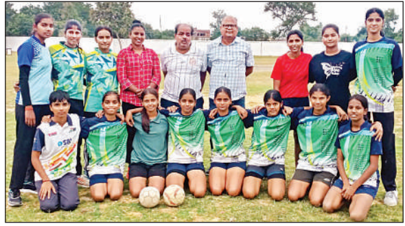
हैंडबॉल के लिए चयनित खिलाड़ी।