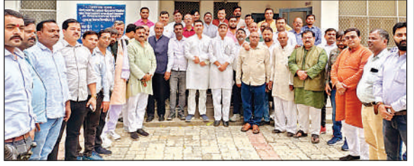
चौधरी चरण सिंह फील्ड हॉस्टल के सामने जुटे शिक्षक।