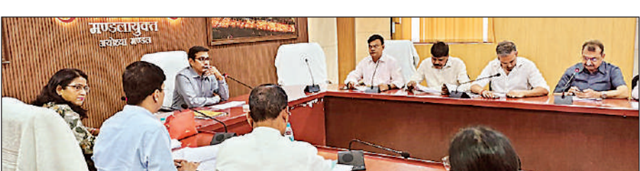
आयुक्त सभागार में मंडलीय उद्योग बंधु की बैठक लेते मंडलायुक्त राजेश कुमार।

उन्होंने मुख्यमंत्री युवा रोजगार योजना की समीक्षा की। कहा कि निर्धारित लक्ष्यों को प्राप्त करने के लिए जिला स्तर पर संबंधित बैंकों के अधिकारियों के साथ समीक्षा करते