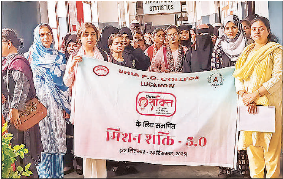
नगर निगम मुख्यालय में प्रदर्शन करती महिलाएं।

दिन सड़कों पर झाड़ू लगेंगी लेकिन 15 दिन में भी सफाई नहीं होती है। कालोनी के पास खुले नाले में अक्सर जानवर गिर जाते हैं। नाला गंदगी से बजबजा रहा है। अंबेडकर यूनिवर्सिटी रोड पर पावर हाउस के बाहर स्थान को कूड़ा घर बना दिया है। गंदगी के कारण सड़क पर टहरना मुश्किल है। महिलाओं ने नियमित सफाई कराने, कूड़ा उठाने, नाले और नालियों की सफाई, सभी नालों को पत्थर से ढकने और सब्जी मंडी वालों पर कूड़ा डालने पर कार्रवाई की मांग की।