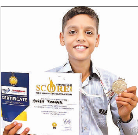
सीएमएस का प्रतिभाशाली छात्र।