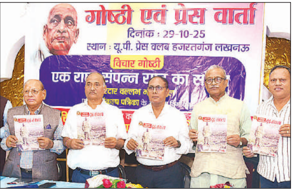
प्रेस क्लब में आयोजित विचार गोष्ठी में पटेल दर्पण पत्रिका का विमोचन करते अतिथि।