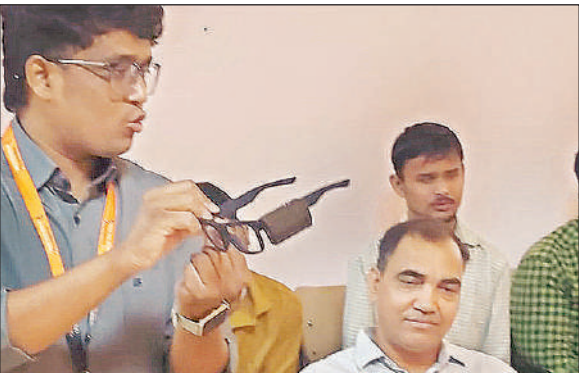
स्मार्ट विजन न्हास की जानकारी देते विशेषज्ञ।