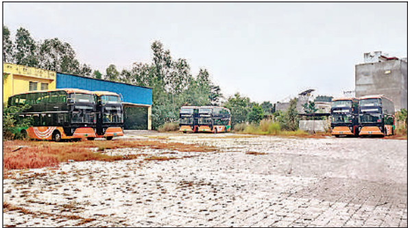
बाराबंकी डिपो में खड़ी डबल डेकर बसें।

अमृत विचार: पिछले वर्ष आठ नवंबर को मुख्यमंत्री योगी आदित्यनाथ ने इंदिरागांधी प्रतिष्ठान से जिन डबल डेकर इलेक्ट्रिक बसों को झंडी दिखाकर रवाना किया था, वह अभी तक सड़कों पर नहीं उतर पाई हैं। एक वर्ष बाद भी न ही बसों के रूट तय हो पाए हैं और न ही चार्जिंग स्टेशन तैयार हो पाए हैं। बिना तैयारी के 15 करोड़ रुपये कीमत की बसों को लाकर धूल फांकने के लिए बाराबंकी डिपो में खड़ा कर दिया गया।