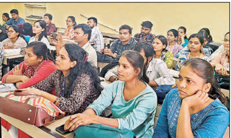
व्याख्यानमाला में उपस्थित छात्राएं।