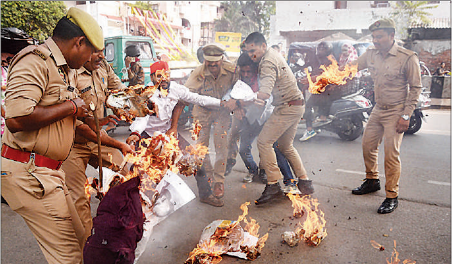
पुतला जलाते छात्रों को रोकते पुलिसकर्मी।