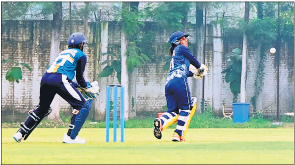
मैच के दौरान गेंद पर शॉट लगाती खिलाड़ी।