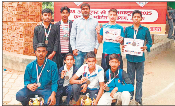
मेडल के साथ टीम के खिलाड़ी, साथ में कोच।