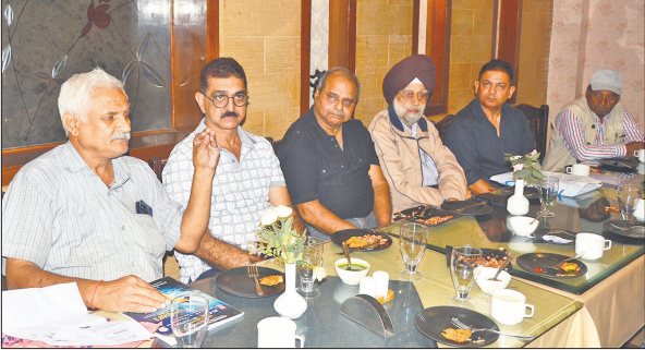
डॉंग शो के संबंध में जानकारी देते आयोजक।