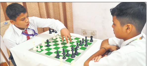
इंद्रा क्लस्टर शतरंज प्रतियोगिता में भाग लेते प्रतिभागी।

अमृत विचार : आर्मी वेलफेयर एजुकेशन सोसायटी दिल्ली की ओर से आर्मी पब्लिक स्कूल बरेली के सीनियर विंग परिसर में इंद्रा क्लस्टर शतरंज प्रतियोगिता का भव्य आयोजन हुआ। जिसमें आर्मी पब्लिक स्कूल लाल बहादुर शास्त्री लखनऊ, वाराणसी, रुड़की, पिथौरागढ़, हैमपुर, फतेहगढ़ और मेजबान बरेली की टीमों के विद्यार्थियों ने भाग लिया। निर्णायक मंडल के घोषित अंकों