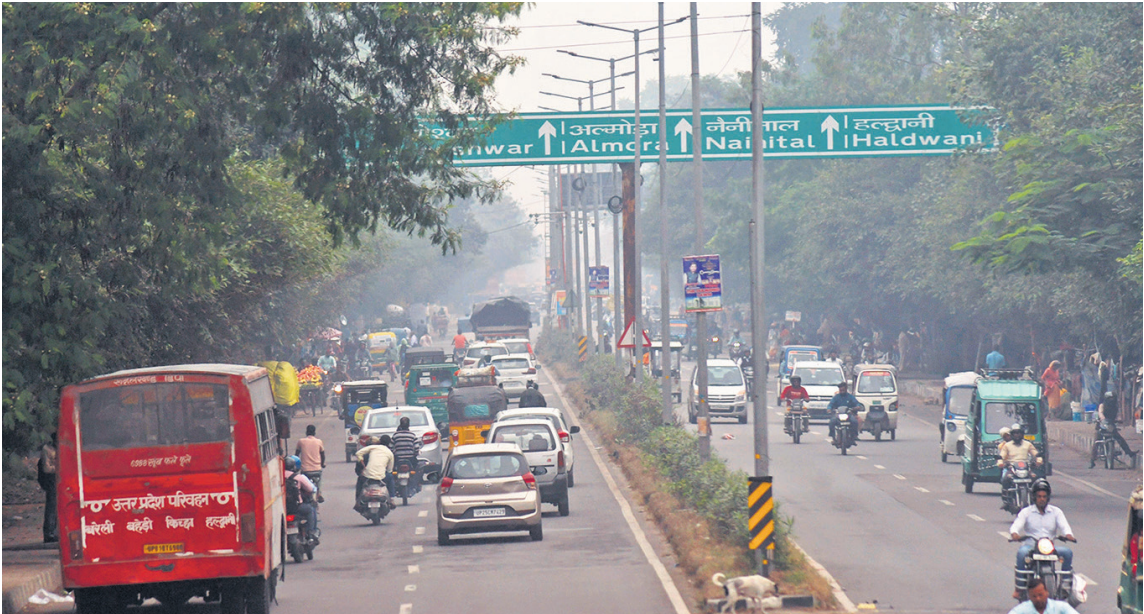
गुरुवार सुबह हल्की बूढ़ाबांदी के बाद धुंध छा गई। बरेली-नैनीताल रोड पर कुछ ऐसा दृश्य नजर आया।