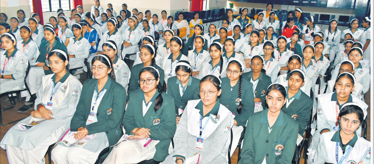
नारी कैंसर सुरक्षा अभियान के तहत सेक्रेड हार्ट्स स्कूल में जागरूकता कार्यक्रम में उपस्थित छात्राएं।