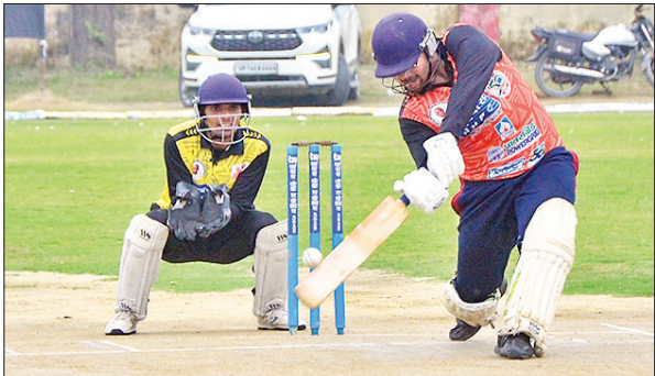
क्रिकेट टूर्नामेंट में शॉट लगाता बल्लेबाज।