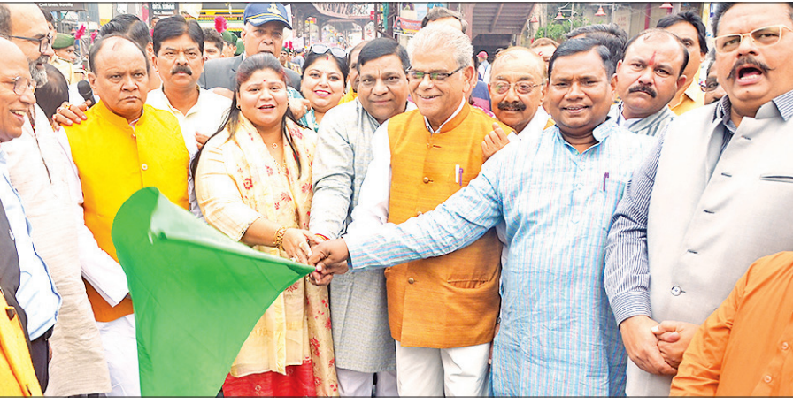
पटेल चौक पर रन फॉर यूनिटी को हरी झंडी दिखाते सांसद, वनमंत्री, जिला पंचायत अध्यक्ष और विधायक।

पटेल चौक से हुई दौड़ की शुरुआत, सांसद, मंत्री, विधायक, डीएम, सीडीओ समेत हजारों लोग हुए शामिल, ‘एक भारत, श्रेष्ठ भारत’ के नारे गूंजे