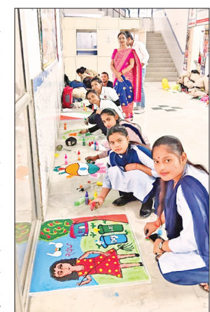
रंगोली बनाती छात्राएं।