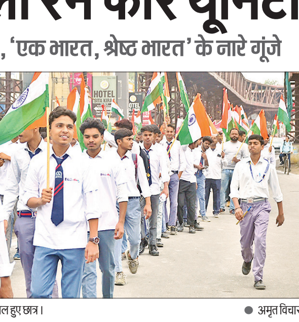
रन फॉर यूनिटी में हाथों में तिरंगा लेकर शामिल हुए छात्र।