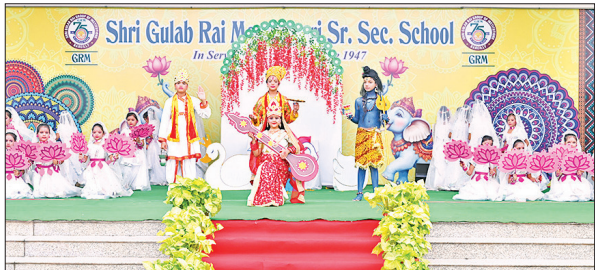
जीआरएम स्कूल में सांस्कृतिक कार्यक्रम प्रस्तुत करते बच्चे।