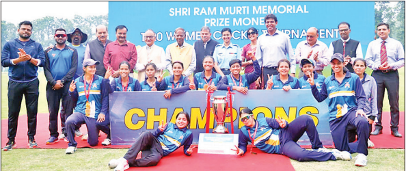
ट्राफी के साथ जश्न मनाते देहरादून स्ट्राइकर्स के खिलाड़ी।

देवोत्थान एकादशी शनिवार को मनाई जाएगी। देवोत्थान एकादशी से विवाह, मुंडन, गृह प्रवेश अनेक मंगल कार्य शुरू हो जाएंगे। एकादशी पर तुलसी और शालिग्राम का विवाह भी होता है। इस दिन पूजन के साथ व्रत रखने को भी बड़ा महत्त्व दिया जाता है। महिलाएं इस दिन आंगन में गेरू और चावल के आटे से चौक सजाती हैं और तुलसी विवाह के