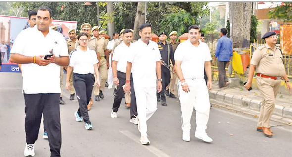
दौड़ लगाते एडीजी, आईजी, एसएसपी समेत अन्य अफसर।