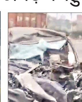
हादसे में क्षतिग्रस्त कार।