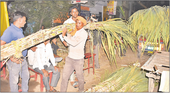
शहामतगंज बाजार में देवोत्थान एकादशी के लिए गन्ना खरीदते लोग।