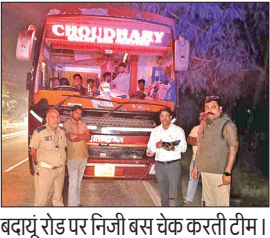
बदायूं रोड पर निजी बस चेक करती टीम।

अमृत विचार: परिवहन विभाग ने 1 से 31 अक्टूबर तक चलाए विशेष प्रवर्तन अभियान के तहत 560 बसों की जांच की, जिसमें 112 बसों का चालान और 22 बसें सीज कीं। इसके अलावा पांच बसें को तकनीकी दृष्टि से गलत पाया गया, जिन पर सुधारात्मक कार्रवाई की गई। वहीं, विभाग ने 3.25 लाख रुपये का शमन शुल्क भी वसूला है। इसी तरह बदायूं में 175 बसों की जांच में 11 बसें परमिट शर्तों का उल्लंघन करते पाई गईं। इनमें कुल 11 बसों के चालान कर चार बसों को सीज किया। वहीं पांच बसों से 72 हजार का जुर्माना वसूला गया। पीलीभीत में 88 बसों की जांच हुई, इनमें 4 बसें बिना परमिट पाई गईं। 26 बसें परमिट शर्तों का उल्लंघन कर संचालन कर रही थीं। कुल 33 बसों के चालान कर सात बसों