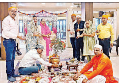
मंदिर में तुलसी की पूजा करते सिंधी समाज के लोग।