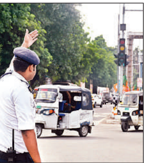
यातायात नियंत्रित करता ट्रैफिक कर्मी।

के अटल चौक का भी सिग्नल शुक्रवार को बंद था। यहां यातायात पुलिसकर्मी मैनुअली चौराहे पर ट्रैफिक संचालित कर रहे थे। इसी तरह का नजारा पॉलीटेक्निक चौराहे पर पिछले तीन दिन से दिखाई दे रहा है। चौराहों पर मौजूद यातायात पुलिसकर्मी यह नहीं बता पा रहे हैं कि सिग्नल किस कारण से बंद हैं। निरालानगर के आठ नंबर चौराहे पर सिग्नल काम नहीं कर रहा है। जिसके कारण चालक चौराहे पर यातायात पुलिसकर्मी दिखाई न देने