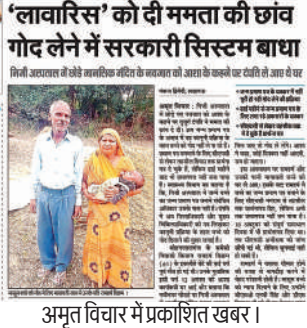
‘लावारिस’ को दी ममता की छांव गोद लेने में सरकारी सिस्टम बाधा (निजी अस्पताल से लेते नवजात बच्चे के कानूनन को आगे के कदमों पर चली गई, आश ने घर