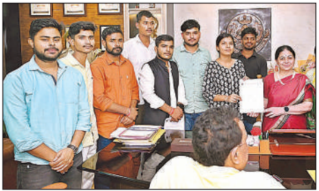
कुलपति को ज्ञापन सौंपते विद्यार्थी परिषद के कार्यकर्ता।