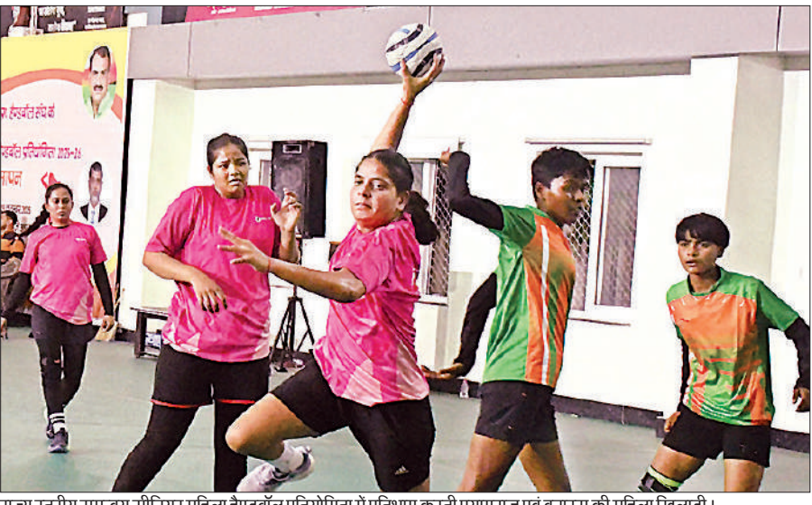
राज्य स्तरीय समन्वय सीनियर महिला हेण्डबॉल प्रतियोगिता में प्रतिभाग करती प्रयागराज एवं बनारस की महिला खिलाड़ी।