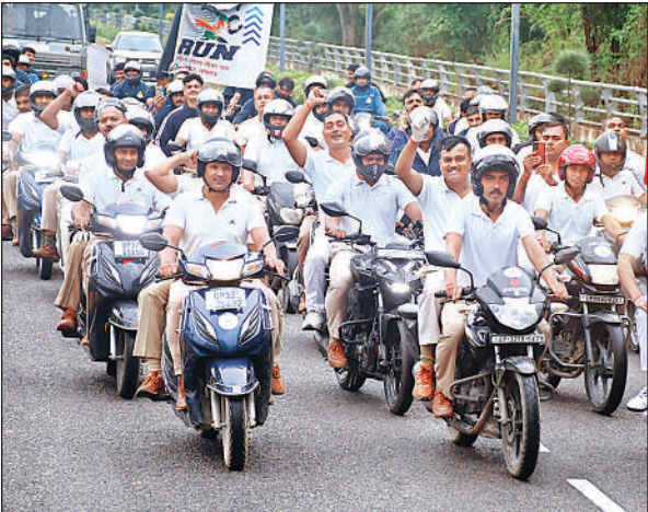
गोमती नगर में बाईक रैली निकालते एसएसबी के जवान।