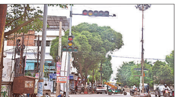
निरालानगर के आठ नंबर चौराहे पर बंद यातायात सिग्नल।

नवंबर में यातायात पुलिस जागरूकता माह मनाती है। पर, हाईटेक सिस्टम का दावा करने वाली कमिश्नरेट की यातायात पुलिस अपने सिग्नल को सुचारू रूप से संचालित नहीं कर पा रही है। राजधानी की हाईटेक ट्रैफिक व्यवस्था बेपटरी हो गई है। हालत यह है कि पिछले तीन दिनों से प्रमुख चौराहों पर सिग्नल ने काम करना बंद कर दिया है। राजधानी का हृदय कहे जाने वाले हजरतगंज