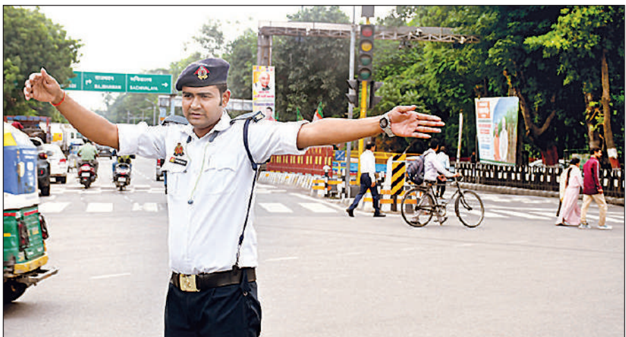
अटल चौराहे पर हाथ दिखाकर यातायात नियंत्रित करता पुलिस कर्मी।

अमृत विचार, लखनऊ : बादलों के बीच शुक्रवार को भी शहर के कई इलाकों में कुछ देर रिमिडिम बारिश हुई। दिन भर धूप नहीं निकली, जिससे रात का तापमान लगभग 20 डिग्री सेल्सियस के करीब पहुंच गया, जो सामान्य से 4.2 डिग्री अधिक रहा। वहीं अधिकतम तापमान 25.6 डिग्री सेल्सियस रिकॉर्ड किया गया, जो सामान्य से 5.8 डिग्री अधिक रहा। मौसम विभाग के अनुसार राजधानी और आस-पास शनिवार को भी कहीं-कहीं बादल छाप रहेंगे। साथ ही धूप निकलने के आसार हैं, जिससे अधिकतम तापमान 29 डिग्री तक पहुंच सकता है।