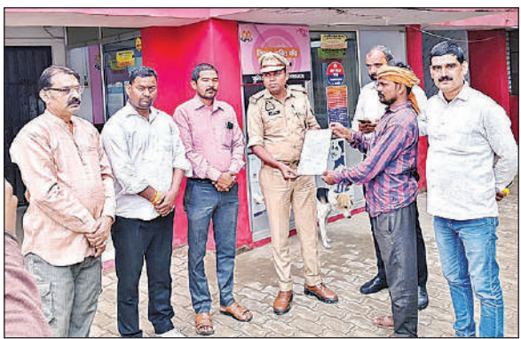
पुलिस अधिकारी को ज्ञापन देते बजरंग दल के कार्यकर्ता।