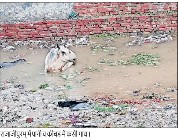
राजाजीपुरम में पानी व कीचड़ में फंसी गाय।

अमृत विचार: निराश्रित गोवंशों के उपचार और भरण-पोषण लिए यूपी सरकार बेहद गंभीर है। यही नहीं, गोवंशों को किसी प्रकार की कोई दिक्कत न हो इसके लिए विभिन्न माध्यमों से करोड़ों रुपये खर्च भी कर रही है, लेकिन कुछ लोग व संगठन घायल गोवंशों की भावनाओं से खेलते हुए धन कमाने का रास्ता निकाल लिए हैं। फर्फुंदी की तरह फैले कथित एनजीओ व उनके दलाल विरोध और बदनाम करके अपना गोरखधंधा चला रहे हैं। उन्हें घायल, बीमार व लाचार गोवंशों के जान की चिंता दूर-दूर तक नहीं है। ये लोग घायल या तड़पते गोवंशों का इलाज कराने की जगह क्लॉट्सप ग्रुपों में उनका वीडियो वायरल कर पशु-प्रेमियों से धन ऐंठने में लगे रहते हैं। इस गोरखधंधे के खिलाफ अमृत विचार के माध्यम से जिन प्रशासन ने कई गोवंशों को इलाक़ से छुड़ाकर जान बचाई है। अधोलिखित उदाहरण यह बताने को