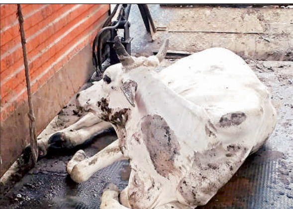
गाय को कीचड़ से निकालकर कान्हा उपवन ले जाता नगर निगम का अमला।