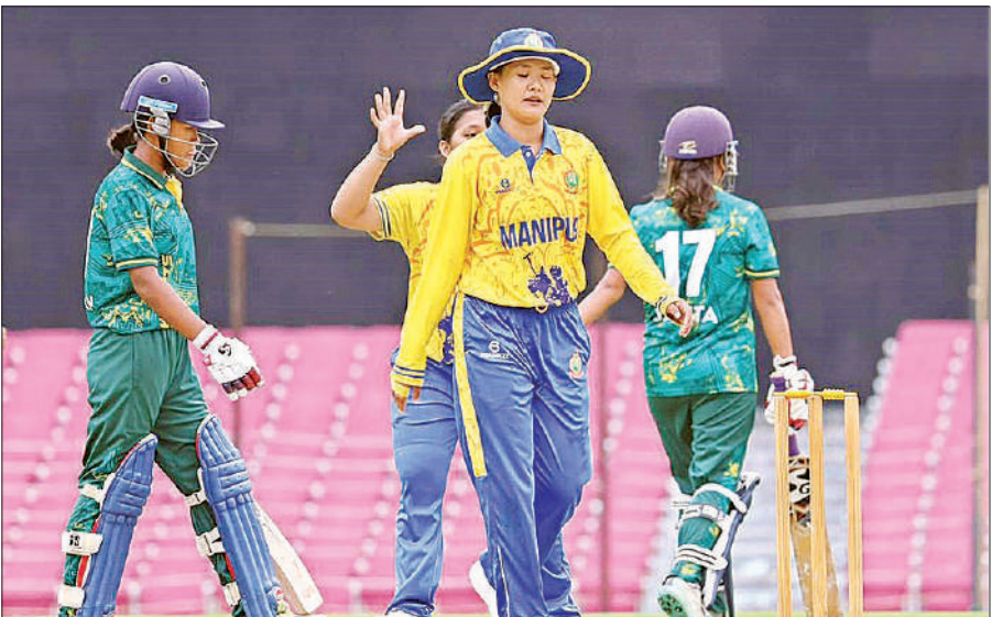
जीत के लिए संघर्ष करते खिलाड़ी।

जवाब में मणिपुर ने 6.5 ओवर में एक विकेट खोकर लक्ष्य हासिल